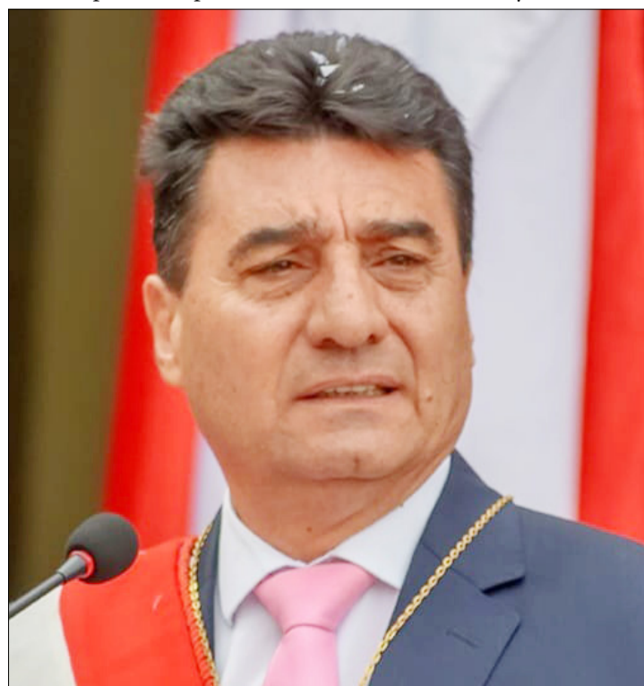
ALCALDE DE TARIJA, JOHNNY TORRES TERZO.

Se precisa equilibrio en el presupuesto del país, la devolución del IDH, si no puede darse una devolución total, puede ser parcial, un 30%, poder hablar de una renegociación con el FNDR (Fondo Nacional de Desarrollo Regional) y sobre llevar la crisis, añadió.