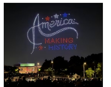
UN ESPECTÁCULO DE DRONES ILUMINA EL CIELO JUNTO AL INDEPENDENCE HALL, EN FILADELFA, EN LA ANTESALA DEL DÍA DE LA INDEPENDENCIA