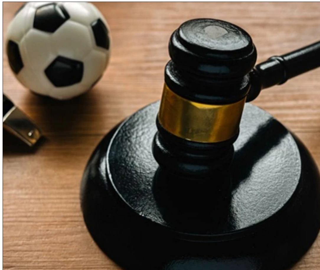
UNA ILUSTRACIÓN DE LA JUSTICIA DEPORTIVA EN EL FÚTBOL.

La FIFA actualiza cada lunes el listado de clubes impedidos de habilitar jugadores.