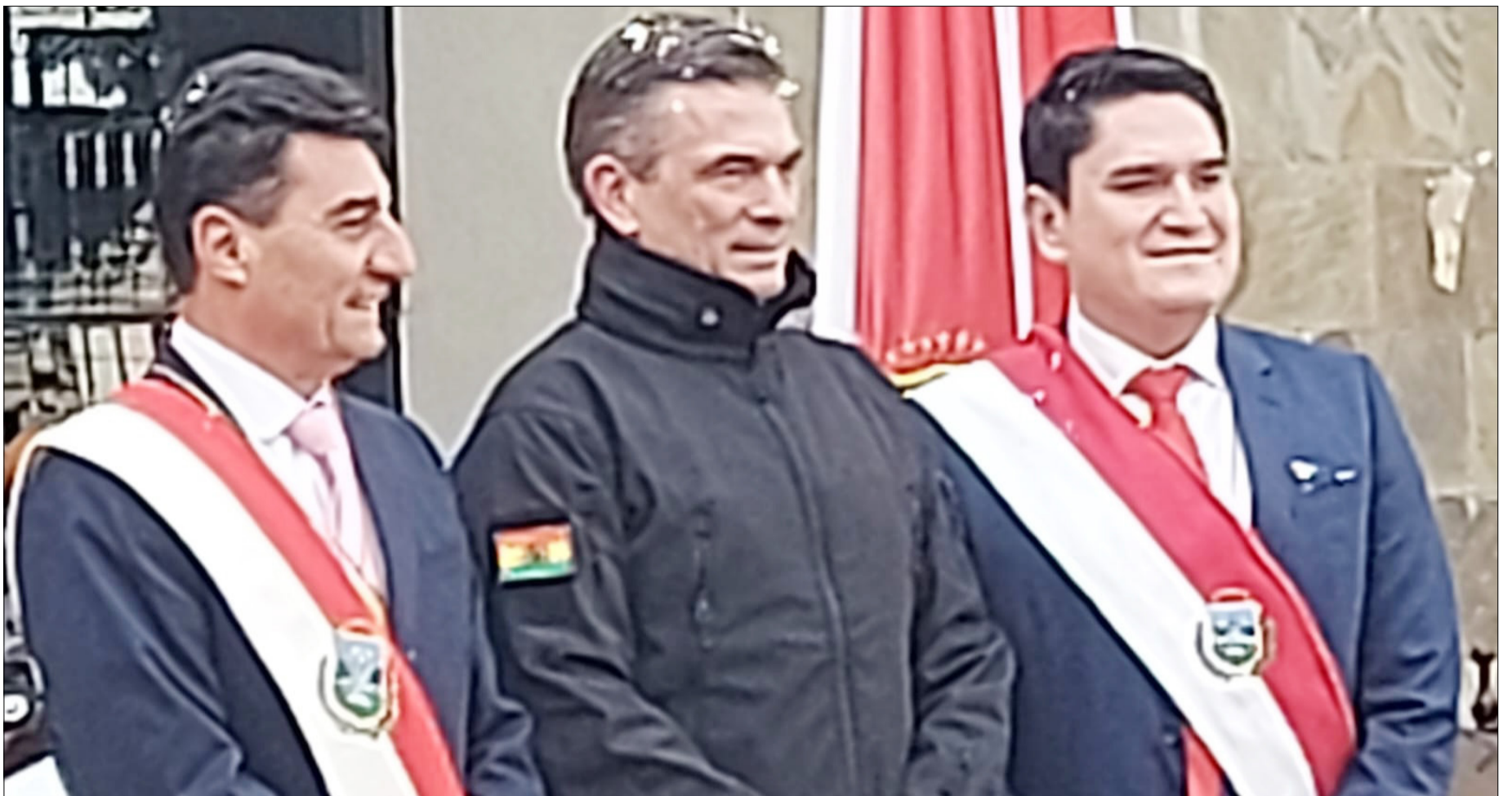
EL PRIMER MANDATARIO REALIZÓ EL ACTO CONMEMORATIVO POR LA FUNDACIÓN DE LA CIUDAD DE TARIJA.

Solo dos megaobras costarán Bs 1.200 millones