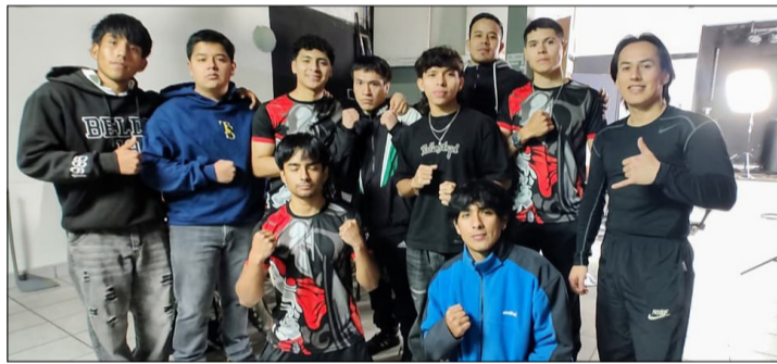
LOS INTEGRANTES DE LA SELECCIÓN DE TARIJA QUE COMPETIRÁ EN EL NACIONAL.

“Ya tenemos todo listo para el desarrollo del campeonato na-