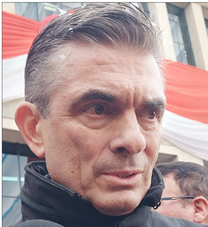
PRESIDENTE DE BOLIVIA, RODRIGO PAZ PEREIRA.

El Mandatario también dijo que espera que el presupuesto 2026 del país se apruebe, permitirá abrir negociaciones con instituciones que inyectarán dólares, ahora que se unificó el dólar, y se lograr Reservas en el Banco Central, pueden reformularse deudas.