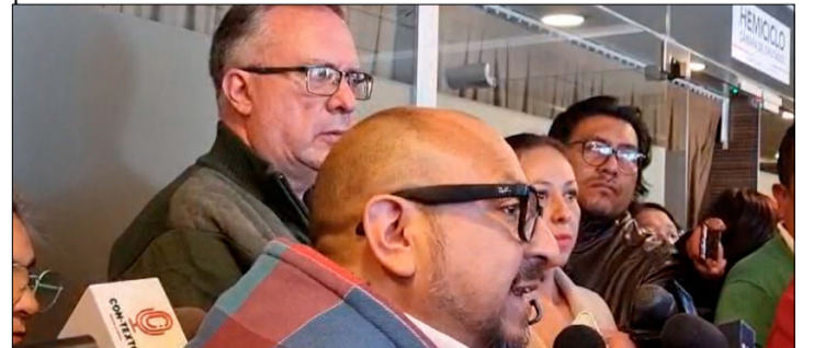
ALARCÓN, MÉRIDA Y SORUCO UNIFICARÁN EL PROYECTO.