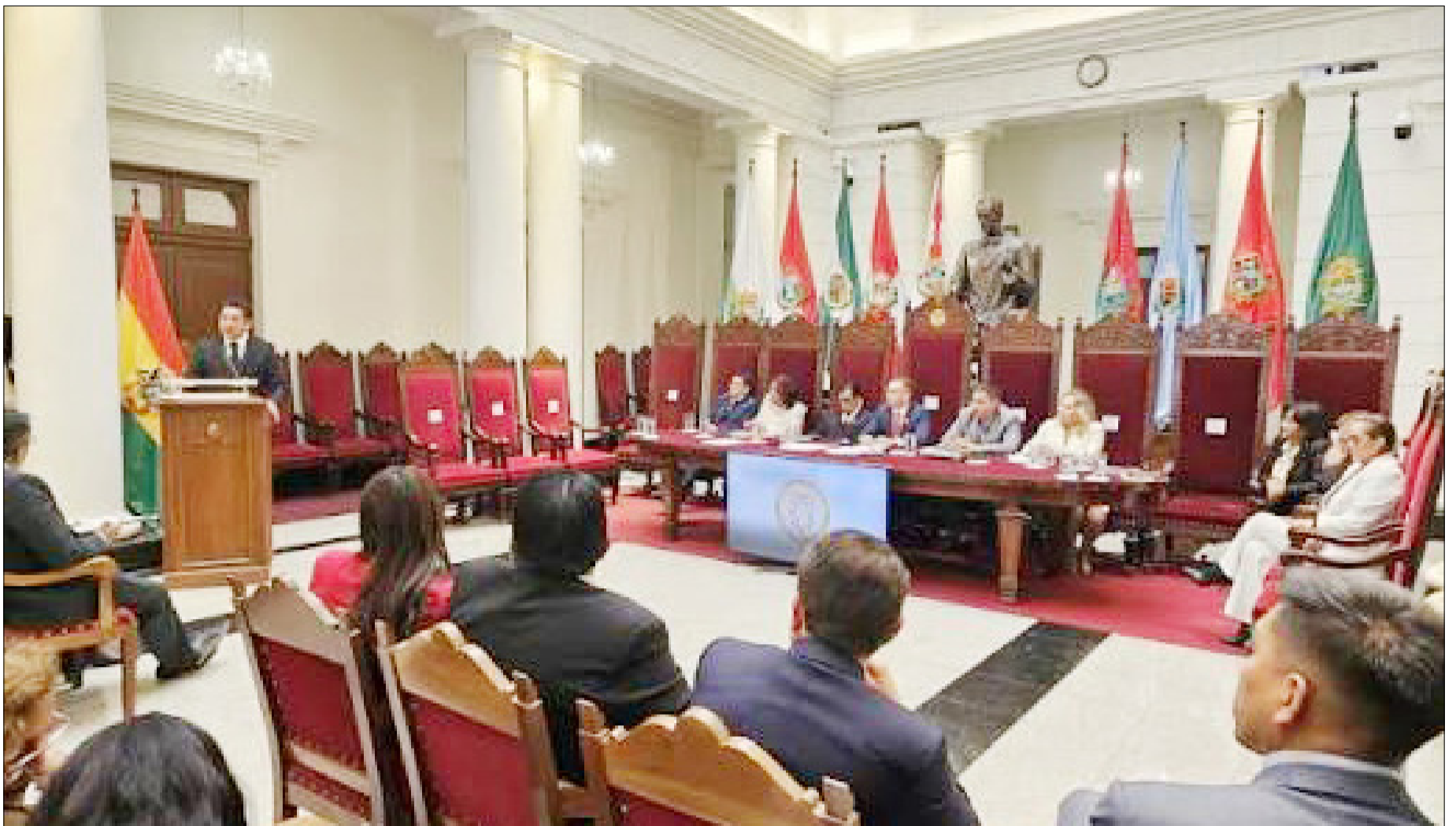
ÓRGANO JUDICIAL INSISTE EN MEJOR ASIGNACIÓN PRESUPUESTARIA PARA UN ADECUADO FUNCIONAMIENTO.

Insistirán, se necesita más jueces entre otro personal