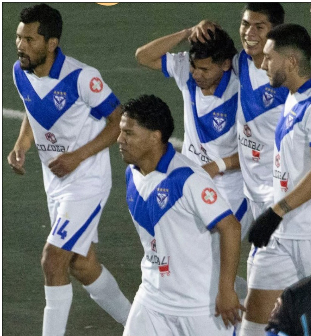
EL PLANTEL DE GARCÍA AGREDA, FUE EL PROTAGONISTA DEL PARTIDO.

al segundo lugar en la tabla de posiciones con 31 puntos.