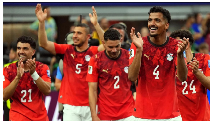
LOS SELECCIONADOS DE EGIPTO CELEBRAN LA CLASIFICACIÓN A OCTAVOS EN EL MUNDIAL 2026.

No la tuvo. los errores de Souttar y Herrington acabaron penalizando a Australia, Salah dejó su impronta con el penalti a lo Panenka y Egipto avanzó por primera vez en su historia a octavos, donde se encontrará con el ganador del duelo entre Argentina y Cabo Verde.