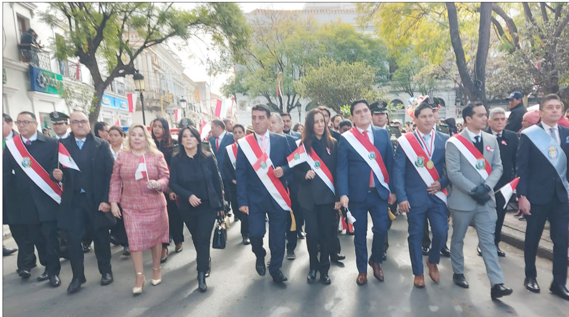
UNA FACETA DE LA CONMEMORACIÓN DE LA FUNDACIÓN DE LA CIUDAD DE TARIJA.

El planteamiento fue lanzado en la sesión de honor del Concejo Municipal, por la fundación de Tarija, donde llegó el gobierno en pleno, junto a autoridades del interior del país y del departamento.