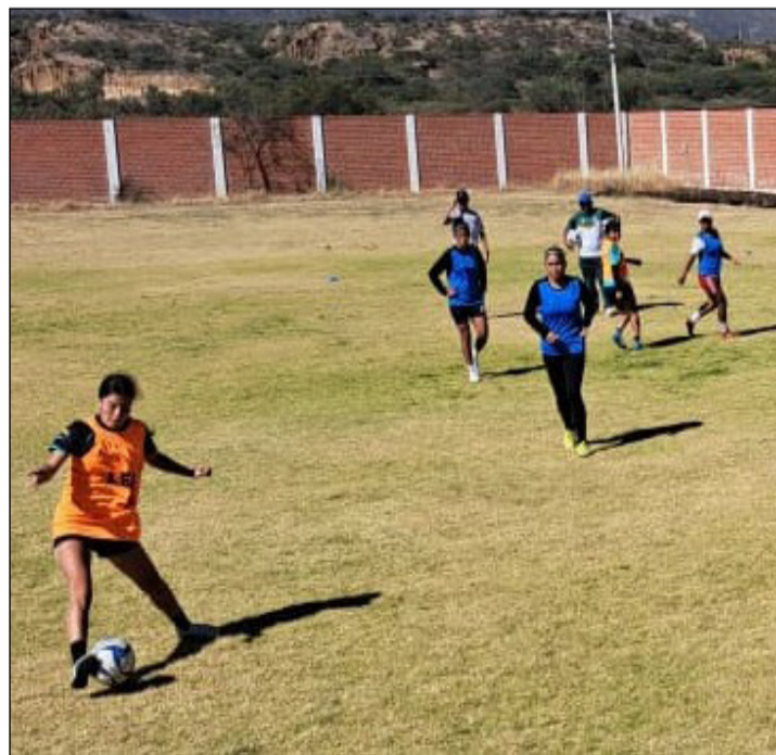
JUGADORAS DE REAL TOMAYAPO, DURANTE UNO DE LOS ENTRENAMIENTOS.

ta de la Federación Boliviana de Fútbol; si bien es la tercera edición bajo el nombre de Liga Femenina, es el quinto año que se organizará en el país un torneo para las damas y hasta el momento solo hay un ganador, se trata del club Always Ready, actual tetracampeón.