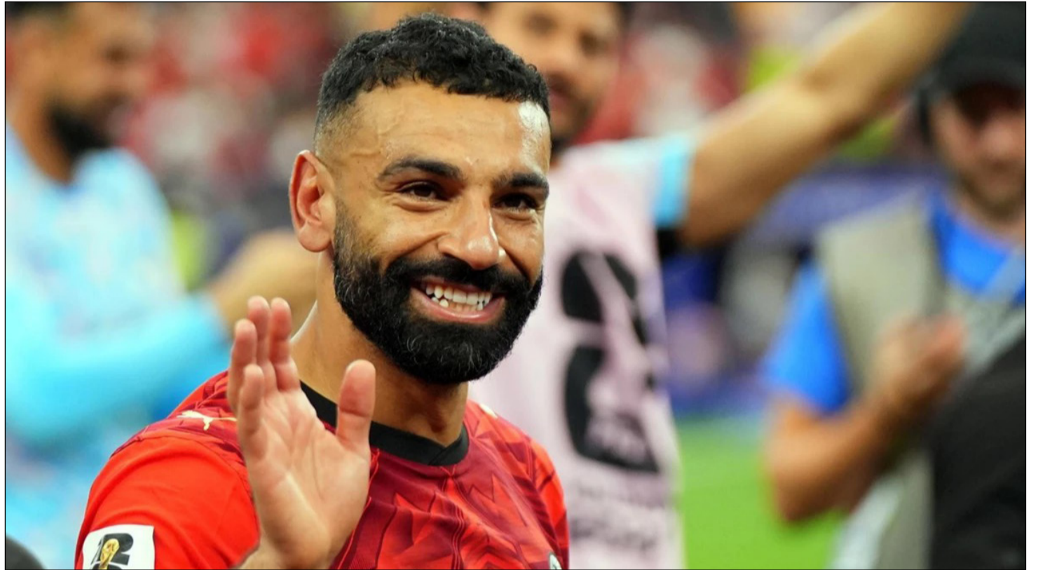
SALAH ES LA FIGURA MÁS EMBLEMÁTICA DEL SELECCIONADO EGIPCIO.