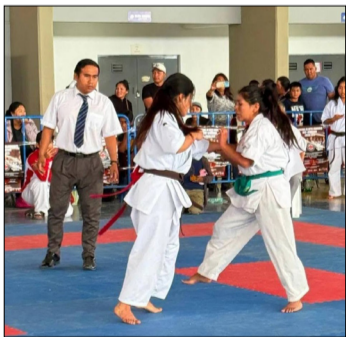
LAS DAMAS TAMBIÉN SERÁN LAS PROTAGONISTAS DEL TORNEO NACIONAL. (FOTO: FEDERACIÓN).

La selección del departamento de Tarija está conformada por 60 deportistas, categoría infantil, juvenil, mayores, senior y master damas y varones; el evento contará con la participación de 300 karatecas de todo el país y los combates se realizarán en el coliseo La Pampa de la capital chapaca. El pesaje se realizará en la mañana de este sábado.