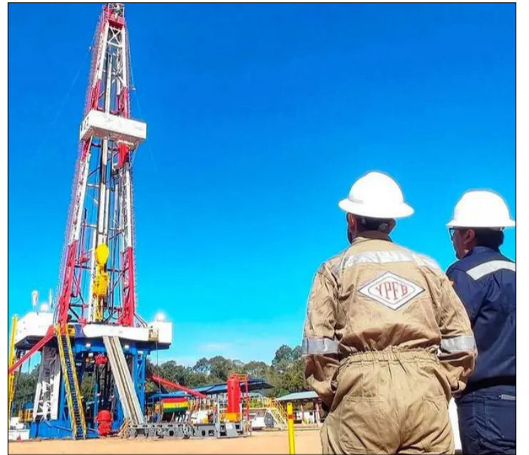
FOTO REFERENCIAL. YFPB