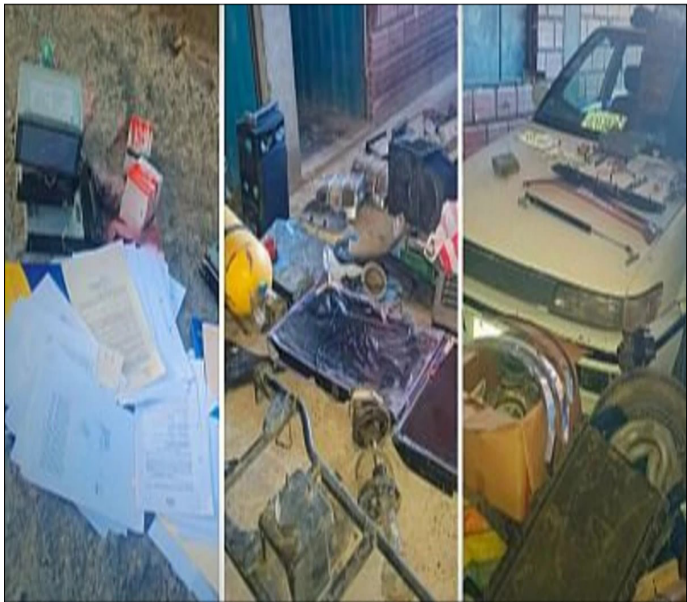
DIPROVE HALLÓ UN DEPÓSITOS CON PARTES DE AUTOS ROBADOS. LOS VENDÍAN EN LA ZONA BALLIVIÁN, DE LA CIUDAD DE EL ALTO.