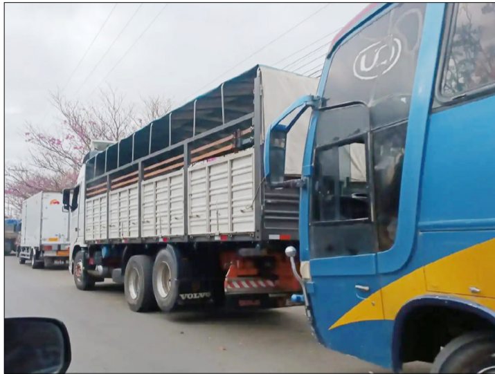
YACIMIENTOS ASEGURA QUE ESTÁ RESOLVIÉNDOSE LA ESCASEZ DE DIÉSEL.

En ese tránsito tiene que cargar diésel en Tarija, son 70 cis-