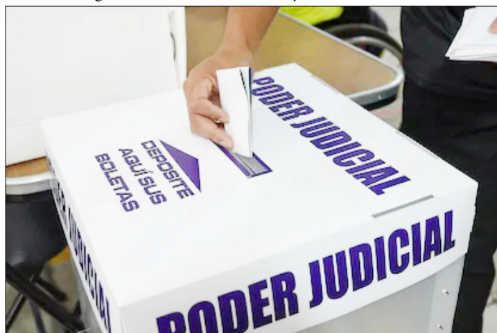
SIN LEY DE CONVOCATORIA NI PRESUPUESTO NO PUEDE HABLARSE DE ELECCIÓN JUDICIAL EN EL PAÍS.