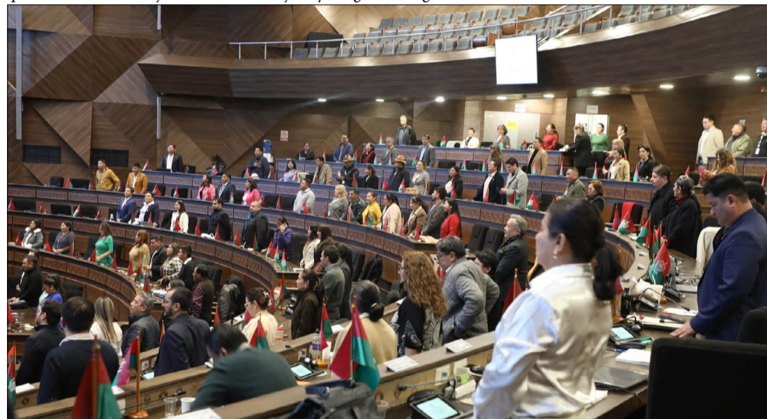
LOS LEGISLADORES SE PUSIERON DE PIE PARA VOTAR.