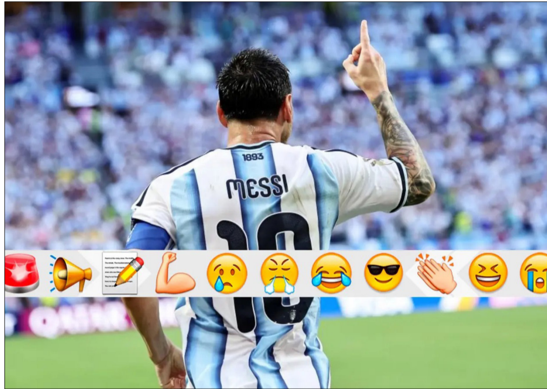
LEO MESSI CELEBRA SU GOL ANTE CABO VERDE.

Son datos para la historia. Leo Messi se convirtió en Miami, su casa, en el primer futbolista que alcanza los 30 partidos disputados en una Copa del Mundo. Cuatro más que el segundo, Cristiano Ronaldo. Y, al mismo tiempo, anotó por octavo partido consecutivo en las Copas del Mundo... marcando un nuevo registro para el recuerdo: 20 goles marcados en los Mundiales. Kylian Mbappé, con 18 en 18 partidos, es el inmediato perseguidor.