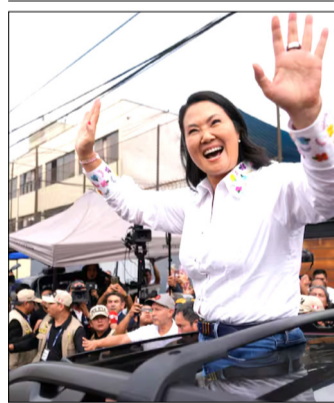
KEIKO FUJIMORI SALUDA TRAS EMITIR SU VOTO DURANTE LA SEGUNDA VUELTA DE LAS ELECCIONES PRESIDENCIALES EN LIMA

La futura mandataria de Perú ya ha recibido la felicitación de varios líderes afines de la región, como el presidente de la Argentina, Javier Milei, de Chile, José Antonio Kast, y de El Salvador, Nayib Bukele.