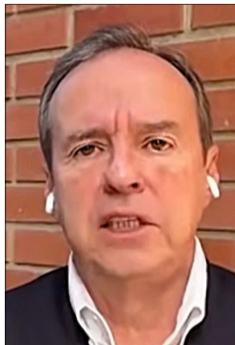
EL EXPRESIDENTE Y LÍDER DE LIBRE, JORGE TUTO QUIROGA.