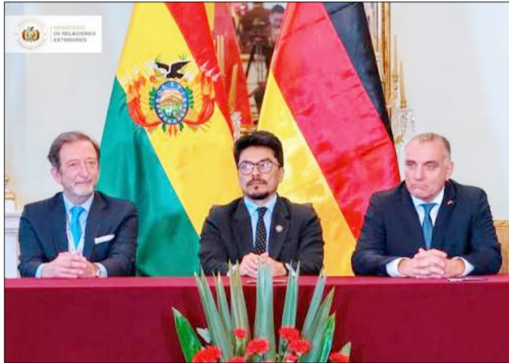
MINISTERIO DE RELACIONES EXTERIORES BUSCA MEJORAR EL RELACIONAMIENTO CON OTROS PAÍSES.

gunos casos corresponde, pero no siempre significa, “quiero aclarar”, la ruptura de relaciones con los países, por el contrario, la filosofía del gobierno “es traer el mundo a Bolivia y llevar Bolivia al mundo”