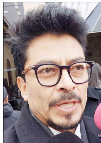
CANCILLER DE BOLIVIA, FERNANDO ARAMAYO CARRASCO.

La Cancillería está avanzando en darle mucha más atención a los connacionales. Otro punto es el relanzamiento de la cadena diplomática, acorde a los procesos de reinserción en espacios políticos, comerciales y diplomáticos multilaterales.