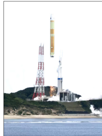
EL COHETE H3 DE LA AGENCIA DE EXPLORACIÓN AEROSPA-CIAL DE JAPÓN

“Desde hace algunos años esto ocurre a diario, pero todavía es soportable.