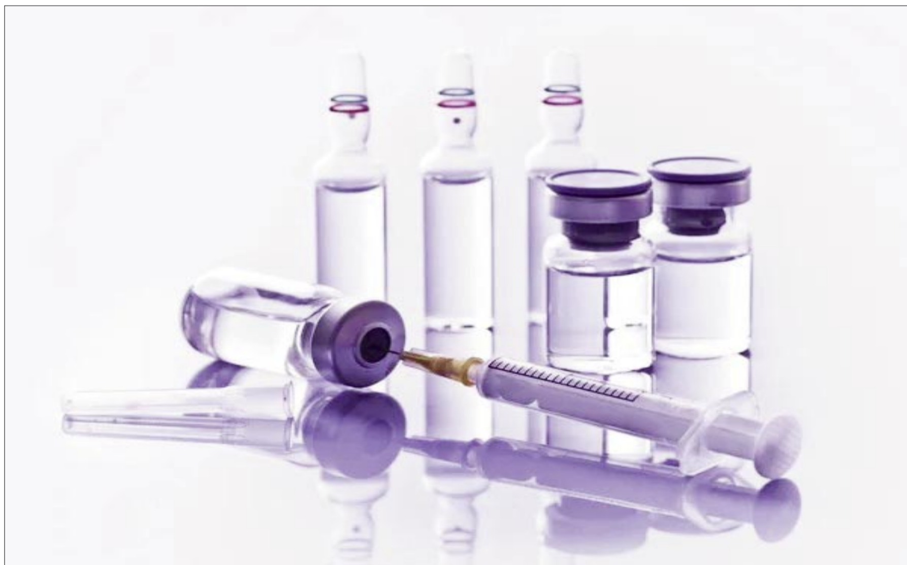
LOS ANTICONCEPTIVOS INYECTABLES, TAMBIÉN ESTÁN CON BASTANTE USO.

La información es del responsable del área de salud sexual y reproductiva del Sedes, Wilber Leytón Vacaflares, al confirmar que muchos jóvenes no quieren tener hijos y prefieren manejar mascotas