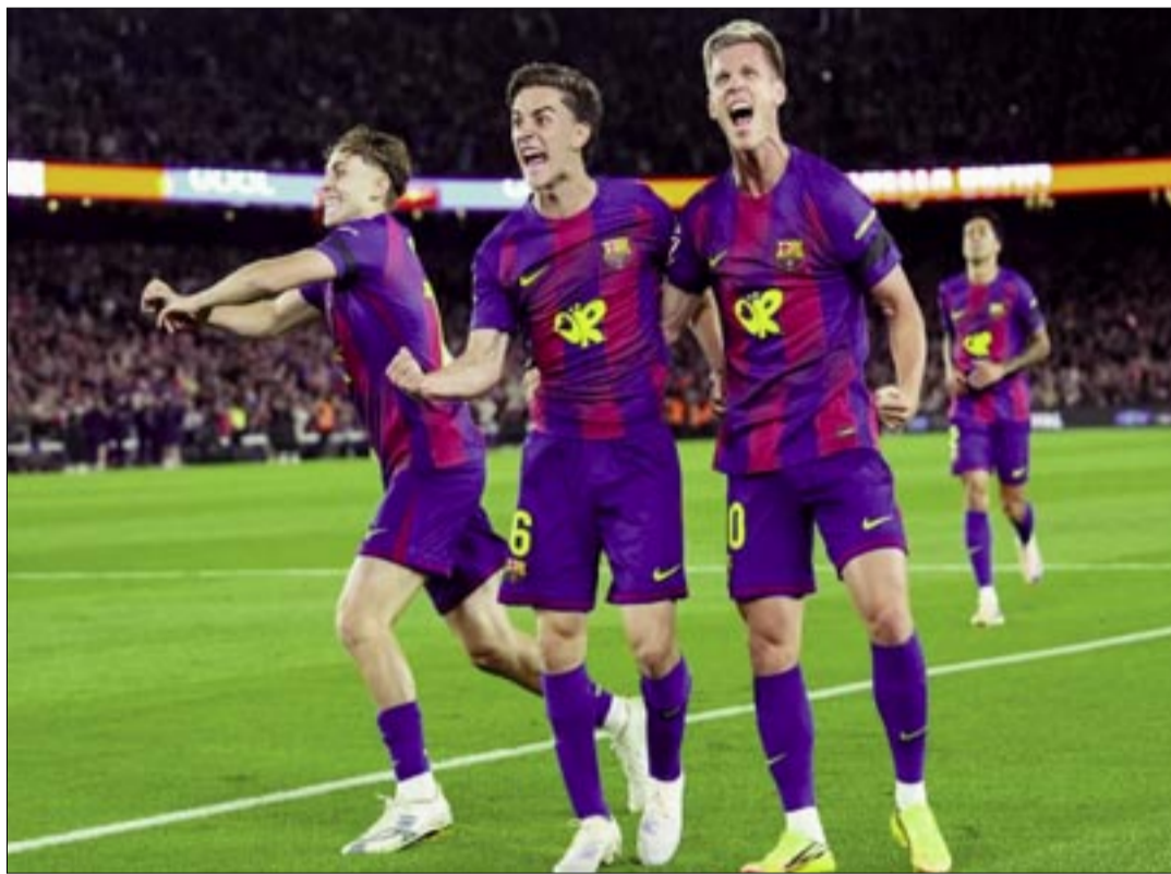
EL BARCELONA DERROTÓ 2-0 AL REAL MADRID EN EL SPOTIFY CAMP NOU

Diez minutos después, el cuadro catalán firmaba el segundo en otra obra