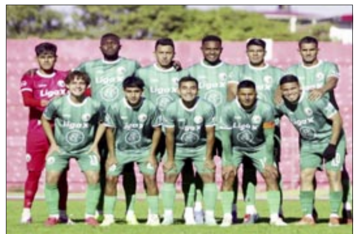
EL PLANTEL DE JUGADORES DE UNIÓN TARIJA.