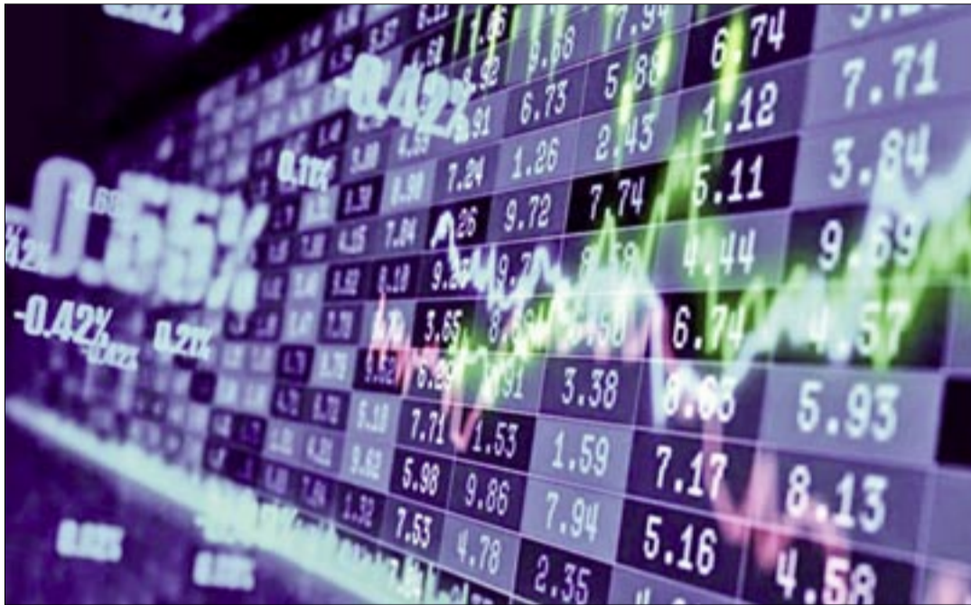
BOLIVIA AUN ES PERCIBIDA COMO UN PAÍS CON MUCHO RIESGO PARA LA INVERSIÓN

El riesgo país es seguido de cerca por inversionistas, organismos multilaterales y analistas porque influye en el acceso al crédito externo, el costo de financiamiento y la percepción internacional sobre la econo-