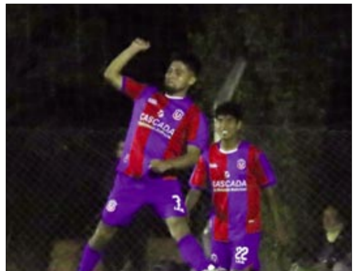
JUGADORES DE UNIVERSITARIO CELEBRAN LA VICTORIA.