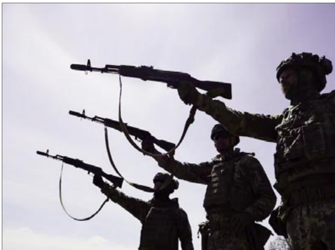
RECLUTAS UCRANIANOS DURANTE UN EJERCICIO EN UN CENTRO DE ENTRENAMIENTO EN LA REGIÓN DE ZAPORÍYIA ANDRIY ANDRIYENKO - UKRAINIAN 65 MECHANIZED BRIGADE

El gobernador de la región de Járkov, Oleh Syniehubov, indicó que ocho personas, incluidos dos niños, sufrieron heridas tras ataques con drones sobre la capital regional y zonas aledañas. En Jersón, las autoridades denunciaron bombardeos con drones y artillería desde la madrugada del sábado. El Servicio Estatal de Emergencias de Ucrania también acusó a Rusia de atacar un vehículo de rescate en Dnipropetrovsk mediante un dron. El ataque dejó herido a un conductor de 23 años. Según la Fuerza Aérea ucraniana, Rusia lanzó durante la noche 27 drones de largo alcance contra territorio ucraniano, una cifra menor a la habitual. Kiev afirmó que sus de-