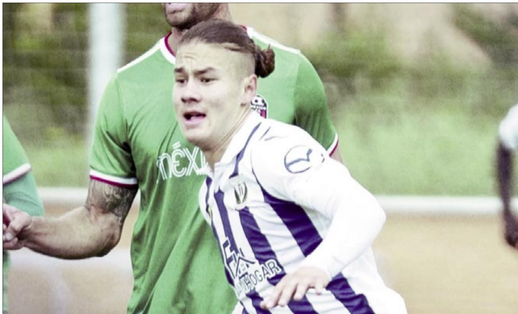
EL LATERAL BOLIVIANO ABRIÓ EL MARCADOR PARA EL LEGANÉS B Y SUMÓ SU TERCER GOL EN EL FÚTBOL ESPAÑOL