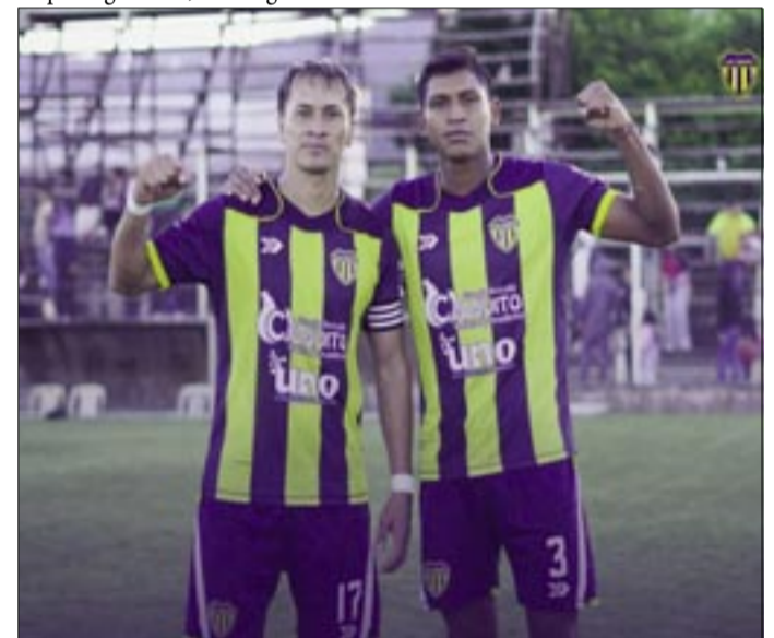
EL TRABAJO DE LA SEMANA TUVO SUS FRUTOS ESTE DOMINGO.

toria en casa y en la tercera fecha jugarán de visitante