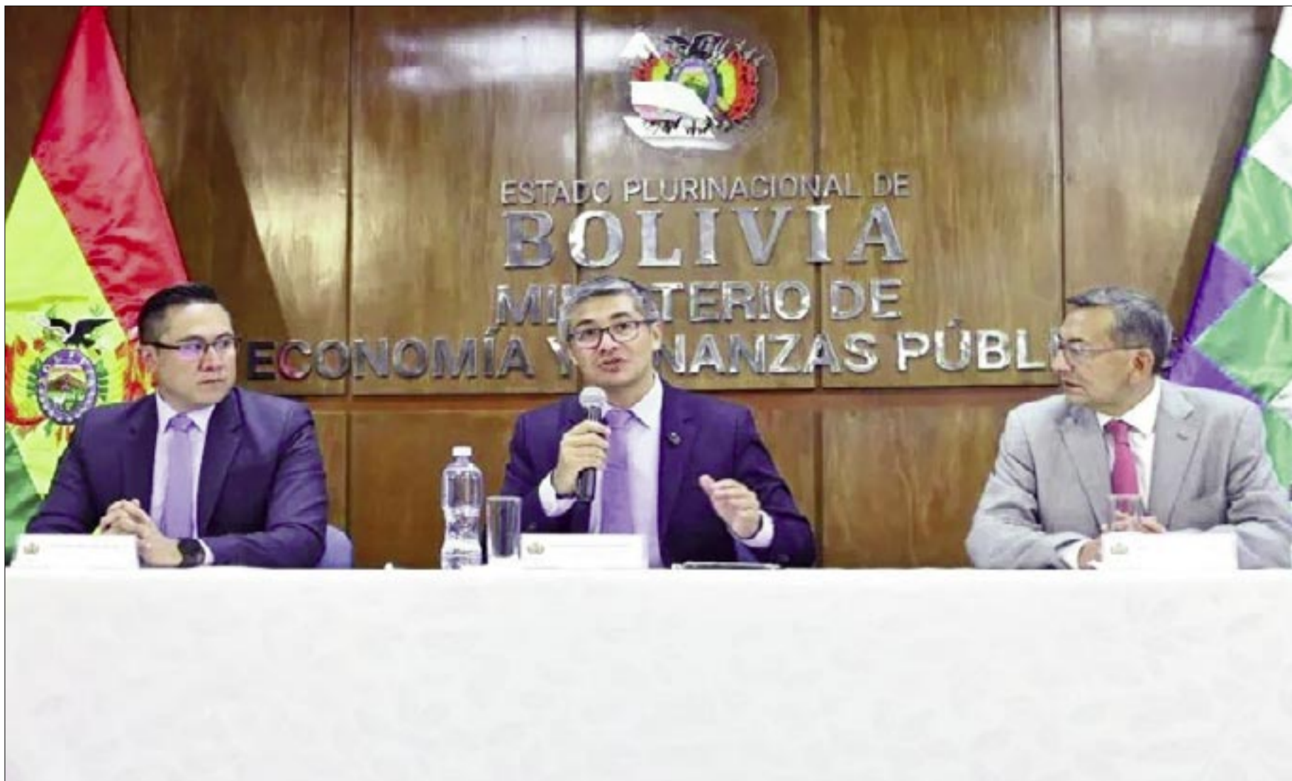
EL PRESUPUESTO 2026 DEL PAÍS, NO TIENE MAYORES NOVEDADES DE REDISTRIBUCIÓN.