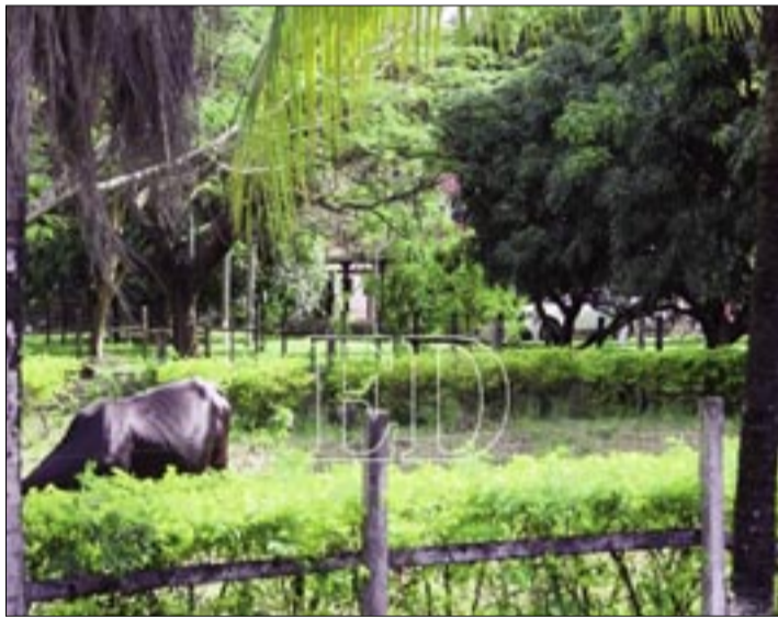
OPERATIVO EN LA QUINTA LA ODISEA, UBICADA EN EL TORNO

"Se encontró (el dinero) en distintos lugares: se tiene en los catres, también se encontró en una mochila", indicó y aseguró que más detalles serán brindados en una conferencia de prensa AGENCIAS/EL DEBER