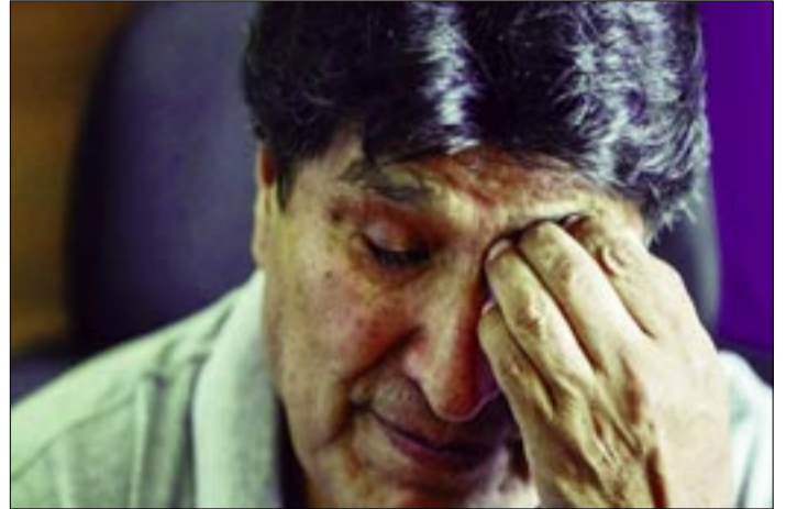
EXPRESIDENTE EVO MORALES

Según Chávez, el inicio del juicio responde a "una persecución política que