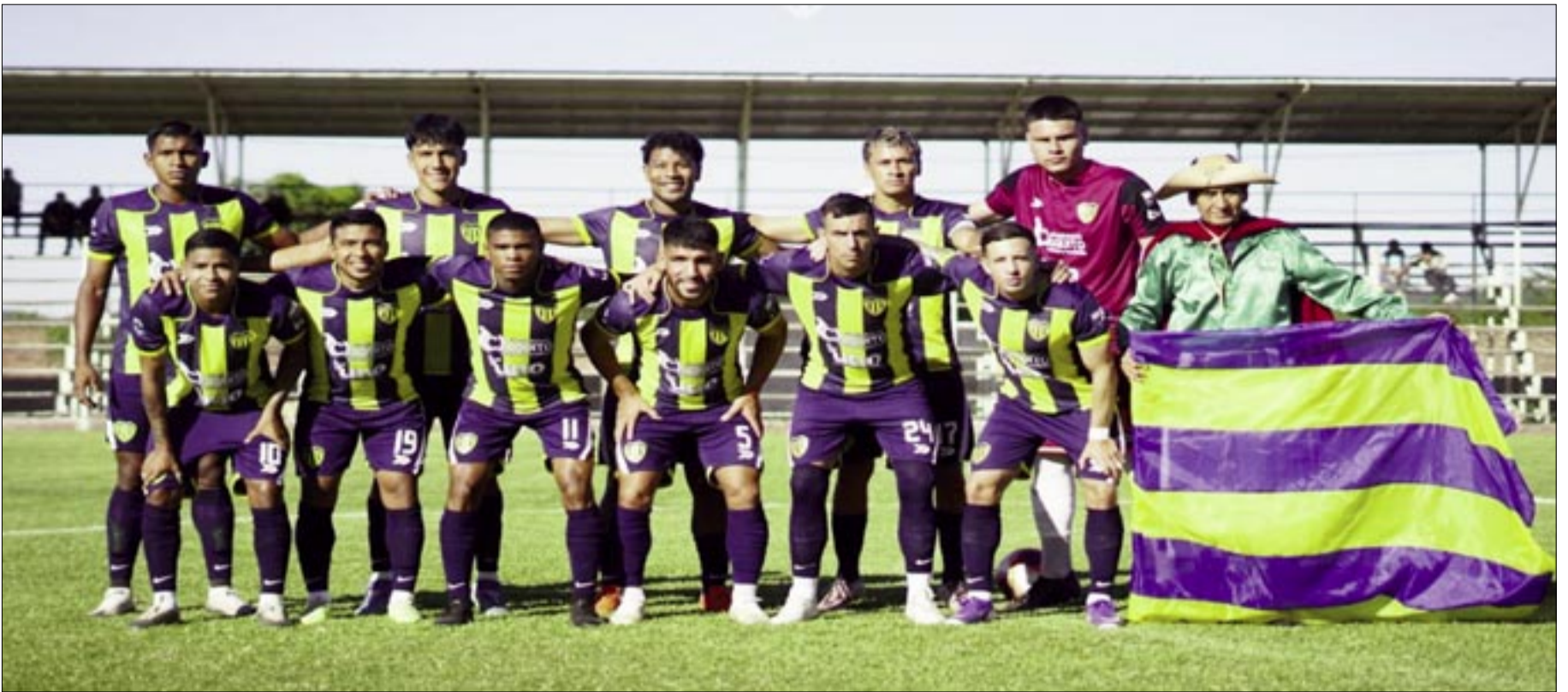
EL PLANTEL DE SAN MARTÍN DE YACUIBA, SE CONVIERTEN EN LOS PROTAGONISTAS.