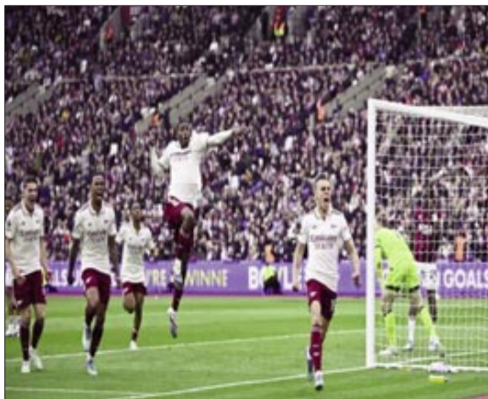
LOS 'GUNNERS' ESTÁ A DOS VICTORIAS DE ALZARSE CON LA PREMIER LEAGUE VEINTIDÓS AÑOS DESPUÉS

Los visitantes insistieron, aunque no consiguieron materializar las constantes ocasiones que generaron en los primeros 25 minutos. De nuevo Calafiori tuvo el primero en las botas el primero para los suyos con un disparo desviado y otro tiro que salvó Konstantinos Mavropanos sobre la línea.