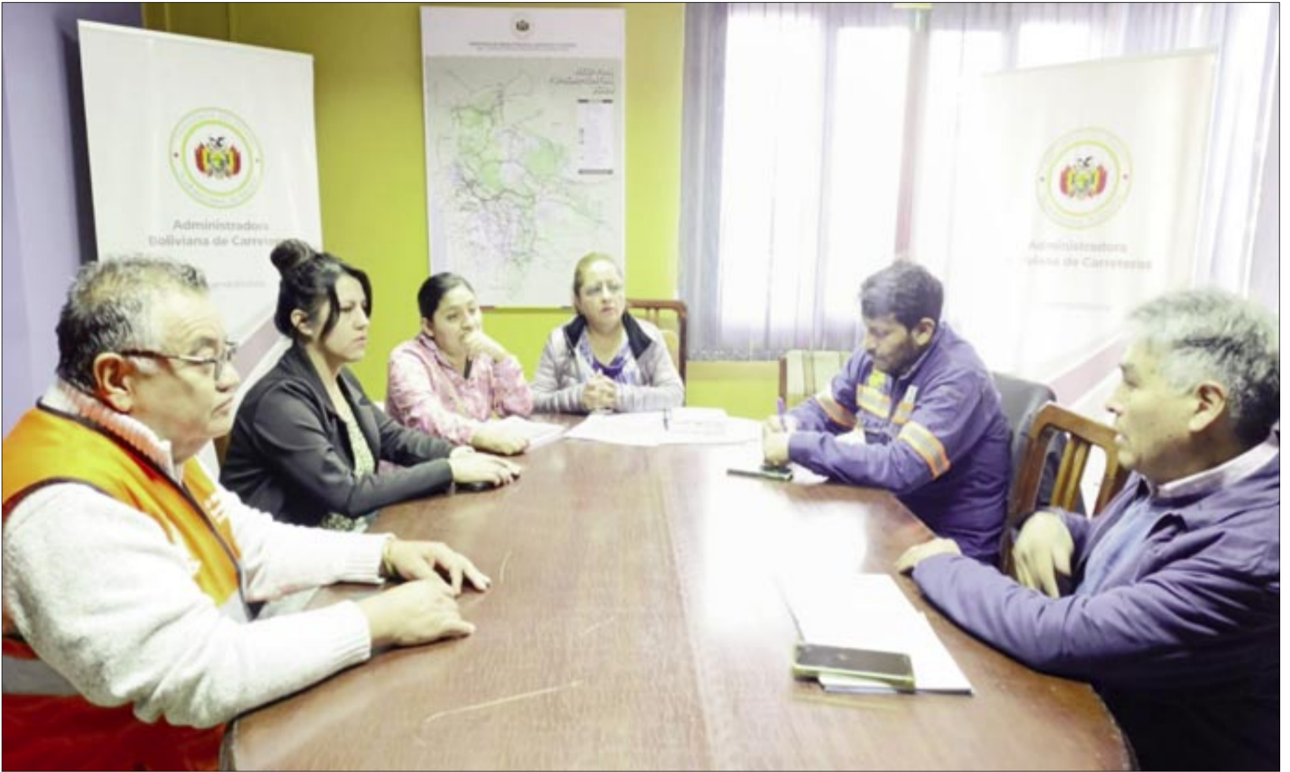
REUNIÓN DE LA ABC CON AUTORIDADES MUNICIPALES DE SAN LORENZO

El estudio de diseño técnico estaría elaborado