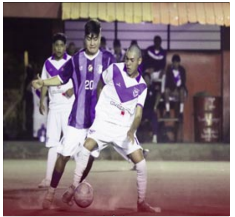
EL CUADRO DE MUNICIPAL NO PUDO CONTROLAR EL JUEGO Y SE QUEDÓ CON LAS MANOS VACÍAS.