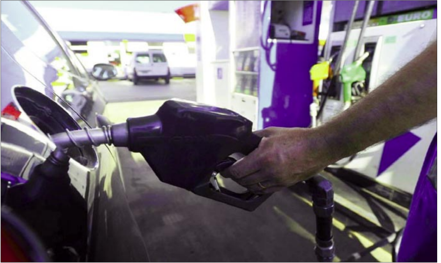
EL PRECIO DE LOS CARBURANTES ESTÁ BAJO CON RELACIÓN AL VIGENTE EN EL EXTERIOR.

De acuerdo a la Fundación, la situación es crítica