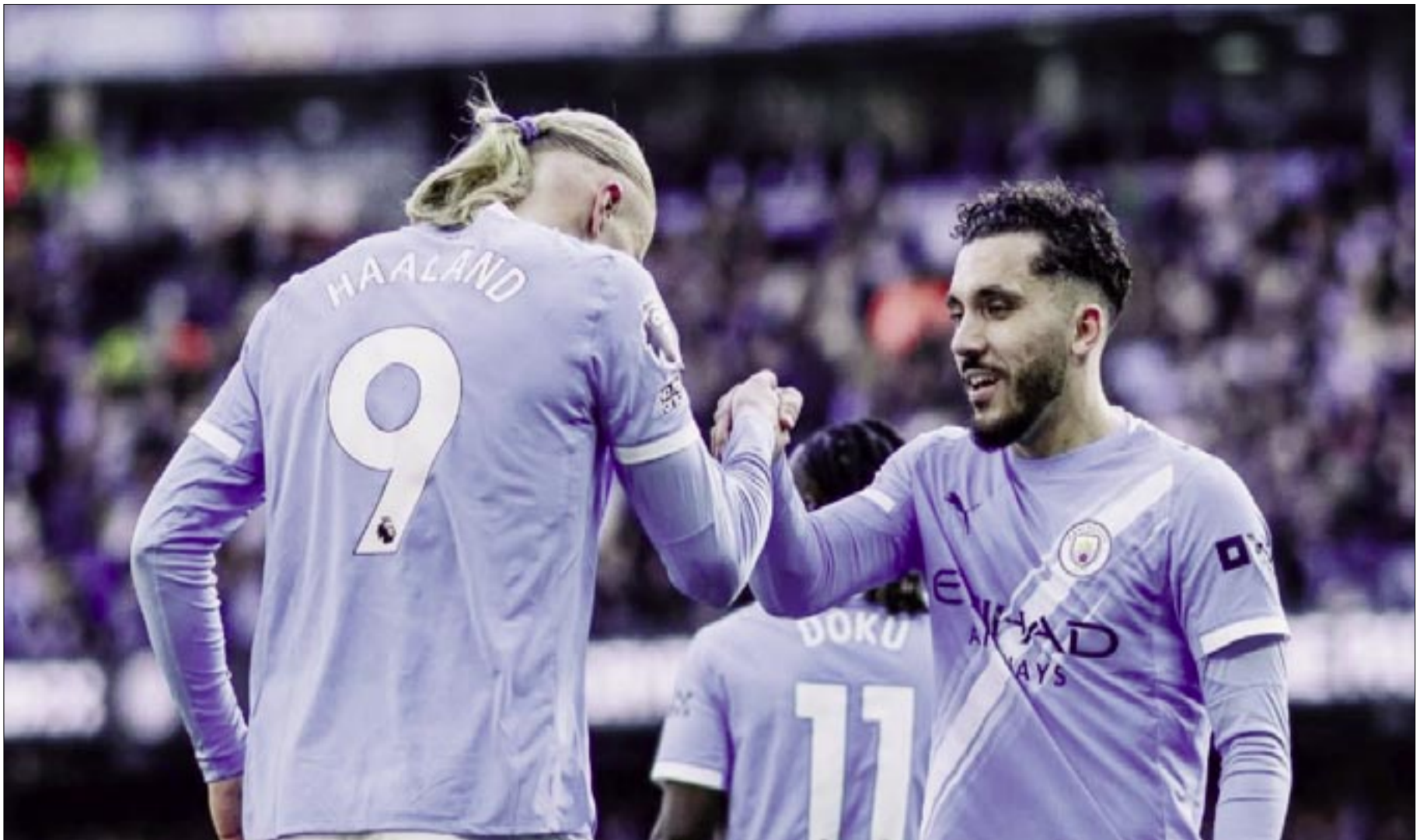
HAALAND FESTEJA SU GOL.