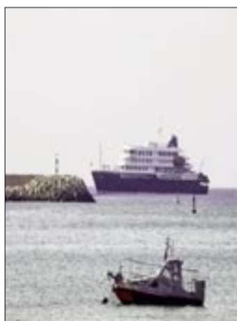
IMAGEN DEL CRUCERO HOLANDES MV HONDIUS (AL FONDO) ANCLADO FRENTE A LA COSTA DE PRAIA EN CABO VERDE.