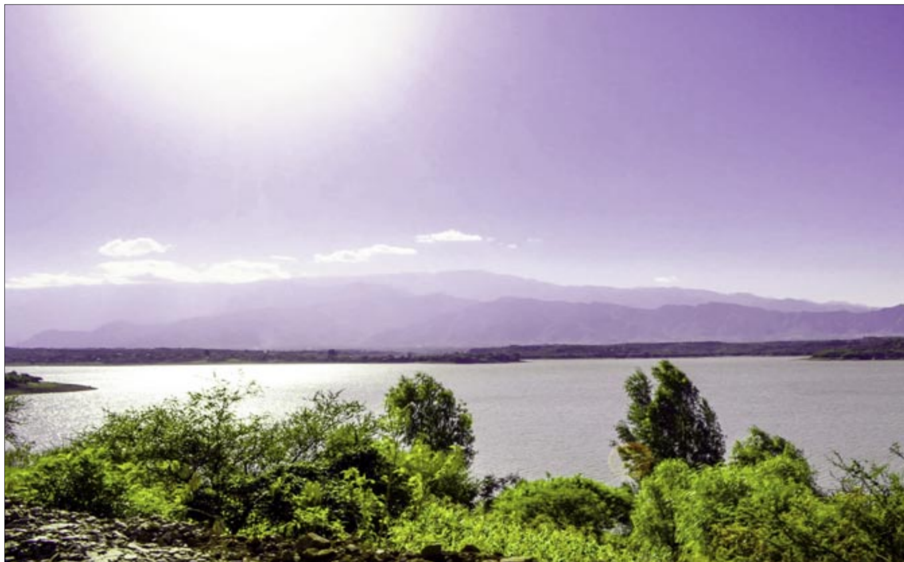
EL ARRASTRE DE SEDIMENTOS AL EMBALSE DE SAN JACINTO, CADA VEZ ES MAYOR.