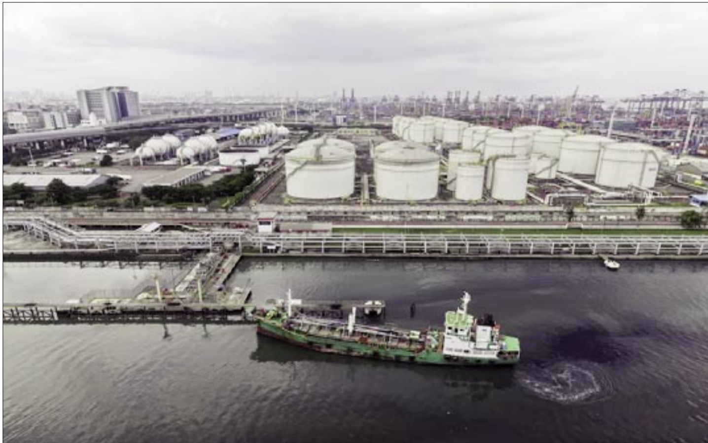
LA GUERRA CONTRA IRÁN ESTÁ AGOTANDO LA RESERVA MUNDIAL DE PETRÓLEO A UN RITMO SIN PRECEDENTES.

Algunos analistas consideran que, si la situación empeora, los precios deberán subir aún más para reducir la demanda mundial y equilibrar el mercado.