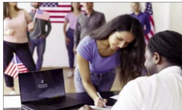
PARA LAS PRÓXIMAS ELECCIONES EN EE.UU., LOS DEMÓCRATAS LIDERAN CON UN 48,9% DE APOYO FRENTE AL 43,6% DE LOS REPUBLICANOS

Big Data Poll: elaborado entre el 25 y el 28 de abril, posiciona a los demócratas con 50% y a los republicanos con 39%.