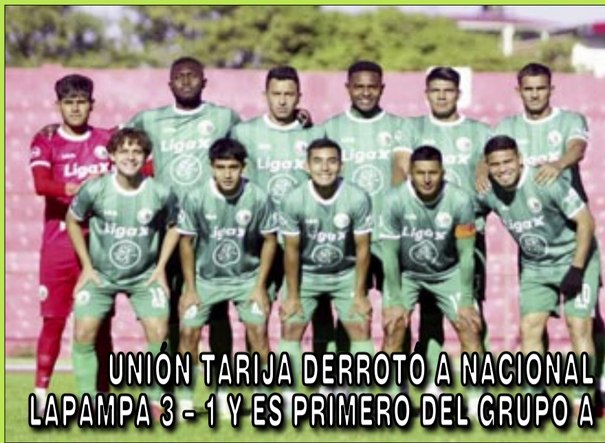
UNIÓN TARIJA DERROTO A NACIONAL LAPAMPA 3 - 1 Y ES PRIMERO DEL GRUPO A