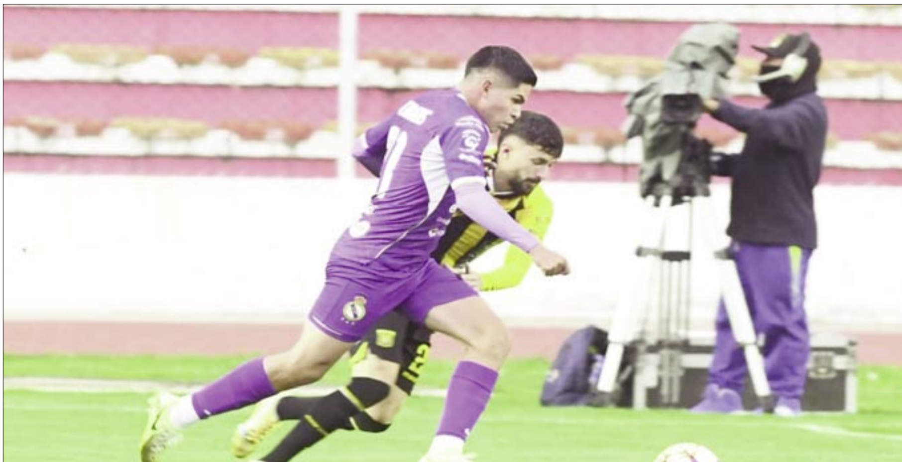
EL TIGRE DESPERDIÓ LA CHANCE DE CONVERTIRSE EN EL ÚNICO PUNTERO