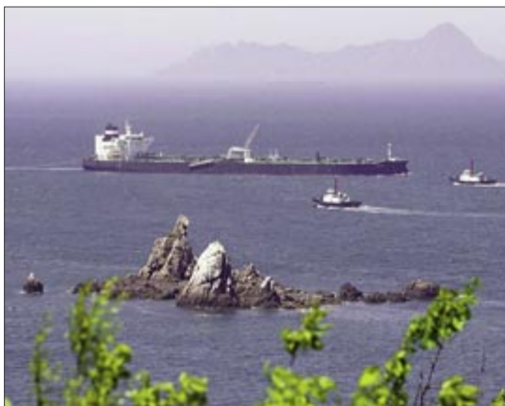
EL ESTRECHO DE ORMUZ SEGUIRÁ CENTRANDO LAS MIRADAS. EL GOBIERNO OFRECE A ESPAÑA COMO GRAN SURTIDOR EUROPEO DE COMBUSTIBLE PARA