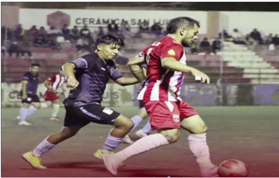
LOS PANOSEÑOS SE LLEVARON LA VICTORIA EN LA TARDE DEL DOMINGO. (FOTO: ATF).