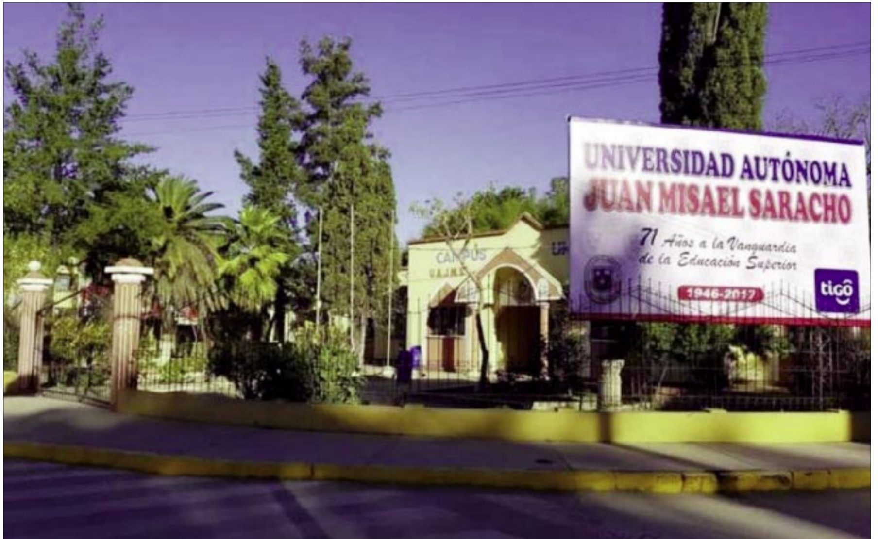
LA CASA DE ESTUDIOS SUPERIORES DE TARIJA, PRECISA MÁS RECURSOS PARA SU FUNCIONAMIENTO