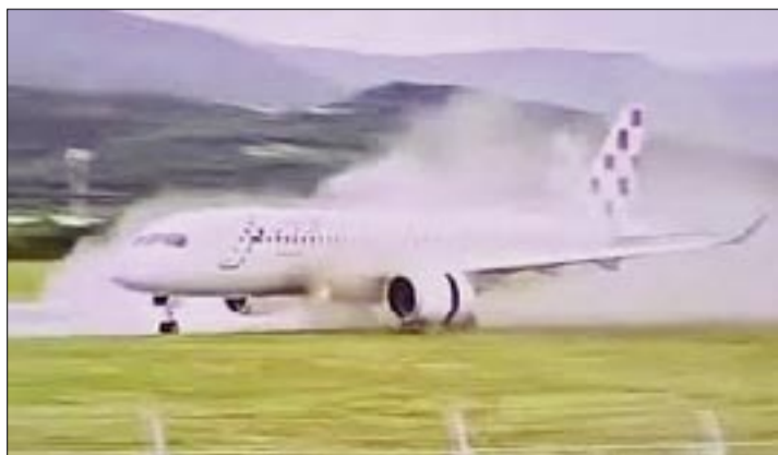
AIRBUS A220-300 DE CROATIA AIRLINES CON 132 PASAJEROS A BORDO