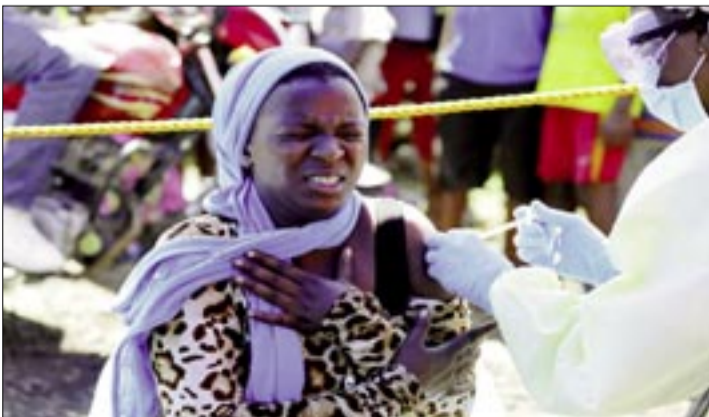
MUERTOS POR NUEVO BROTE DE ÉBOLA EN RDC AUMENTAN A 80 Y UGANDA REPORTA UN FALLECIDO BAZ RATNER