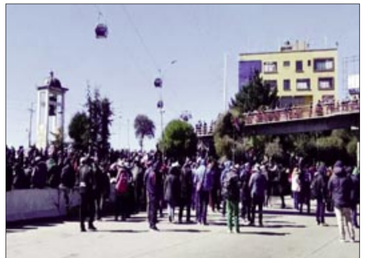
PROTESTA EN EL PEAJE DE LA AUTOPISTA LA PAZ - EL ALTO. ERBOL