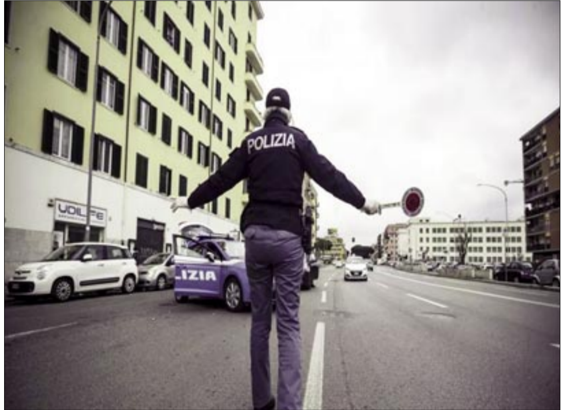
UN CONDUCTOR ATROPELLA A UNA DOCENA DE PERSONAS EN LA CIUDAD ITALIANA DE MÓDENA Y APUÑALA A OTRA EN SU FUGA.