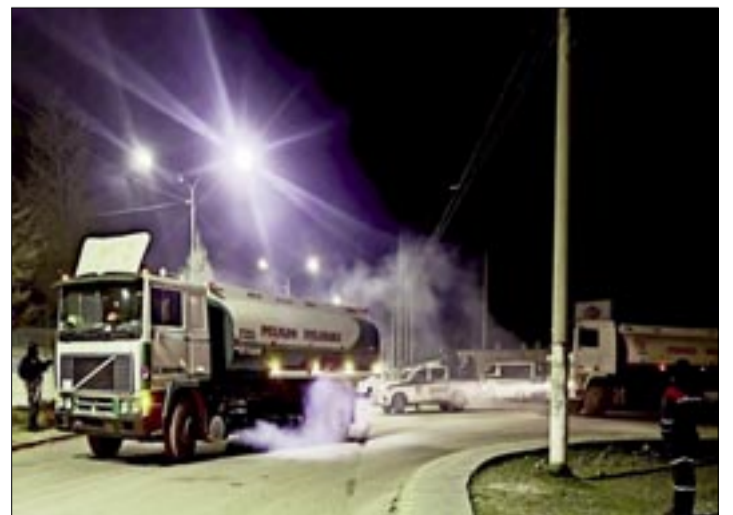
EL DESBLOQUEO DE RUTAS PERMITIÓ EL TRÁNSITO DE LAS CISTERNAS CON CARBURANTES

Especialistas en seguridad industrial advierten que instalaciones de este tipo operan bajo estrictos protocolos internacionales debido al alto nivel de riesgo asociado al almacenamiento de combustibles y gas licuado