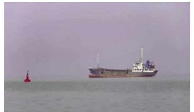
ARCHIVO - BUQUE EN EL ESTRECHO DE ORMUZ (ARCHIVO)