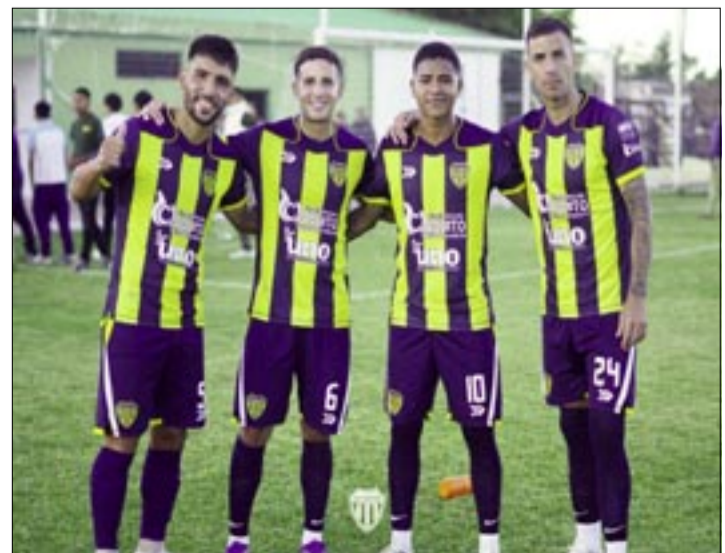
JUGADORES DEL PLANTEL DE SAN MARTÍN, LLEGARON CON LA MISIÓN DE GANAR.