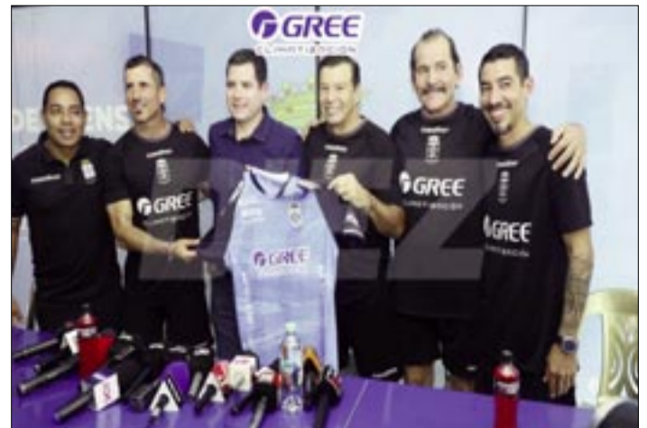
EL CUERPO TÉCNICO DE ERWIN SÁNCHEZ.

Por definir queda el nombre del asistente de campo, una pieza importante dentro de la estructura técnica y que podría confirmarse en los próximos días.