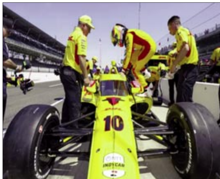
ALEX PALOU SALDRÁ EN UNA POSICIÓN COMPLICADA A CLASIFICAR EL DOMINGO.