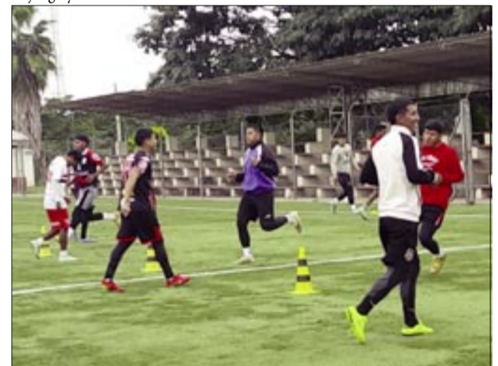
UNA DE LAS PRÁCTICAS DEL EQUIPO DE BILBAO RIOJA.

sificar al cuadrangular departamental, en la segunda fecha perdió con Universitario; tiene un punto en la tabla de posiciones.