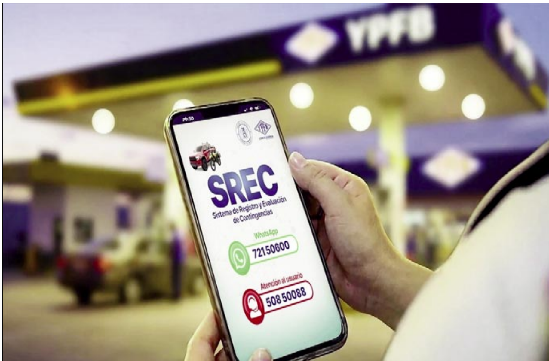
LA ESTATAL PETROLERA DESTACÓ EL PROCESO DE PAGO A LOS USUARIOS QUE SE VIERON AFECTADOS POR LA CALIDAD DE LA GASOLINA

Miles de conductores reportaron daños mecánicos en todo el país; el debate sobre calidad del combustible y control técnico sigue abierto