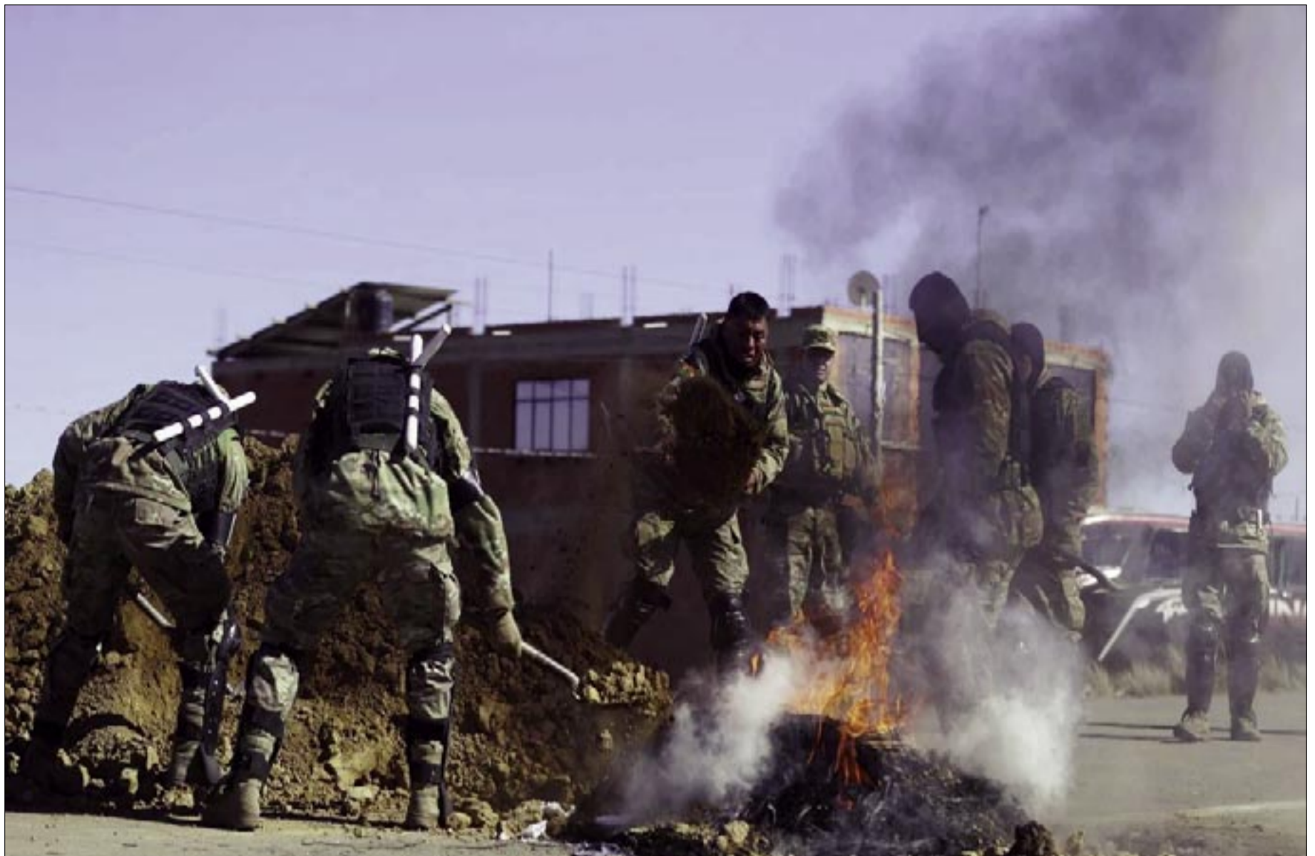
INTEGRANTES DE LAS FUERZAS ARMADAS DESBLOQUEAN UNA CARRETERA ESTE SÁBADO, EN CALAMARCA (BOLIVIA). EL GOBIERNO DE BOLIVIA ASEGURÓ QUE HARÁ TODO "ESFUERZO" PARA EVITAR UN "DERRAMAMIENTO DE SANGRE", EN MEDIO DE LA OPERACIÓN POLICIAL Y MILITAR QUE SE REALIZA PARA DESBLOQUEAR LAS CARRETERAS CERRADAS Y QUE DERIVÓ EN ENFRENTAMIENTOS EN VARIOS LUGARES.