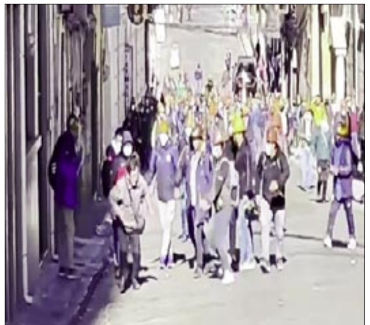
GRUPO DE MINEROS VIOLENTOS AGREDE A UN PERIODISTA EN LA PAZ.