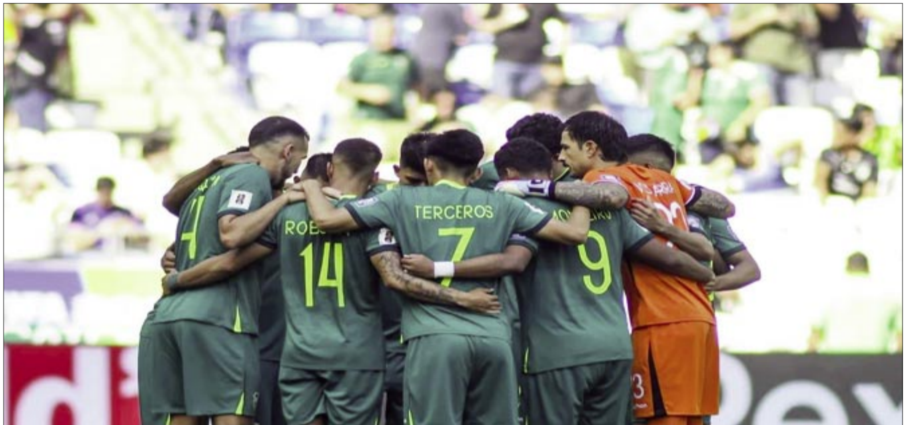
LA SELECCIÓN APUNTA A JUGAR TRES AMISTOSOS EN JUNIO.