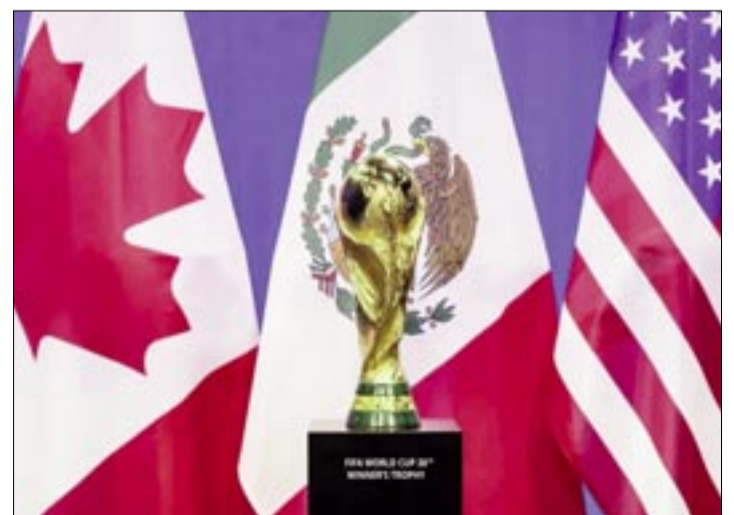
LA COPA DEL MUNDO SE JUGARÁ DEL 11 DE JUNIO AL 19 DE JULIO DE ESTE AÑO.

El sábado 11 de julio jugarán en El Alto (15.00) ABB vs. Real Oruro; para ese día están previstos dos partidos de cuartos de final sin horario, por ahí sean en la noche.