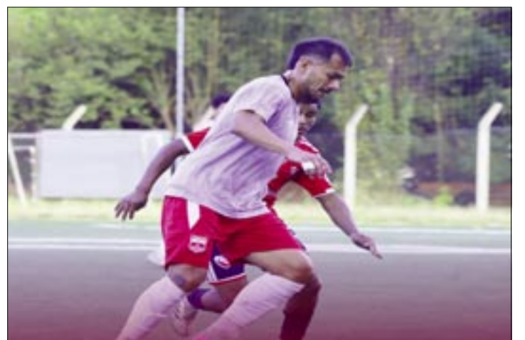
EL PLANTEL DE MUNICIPAL SALDRÁ CON LA OBLIGACIÓN DE GANAR.