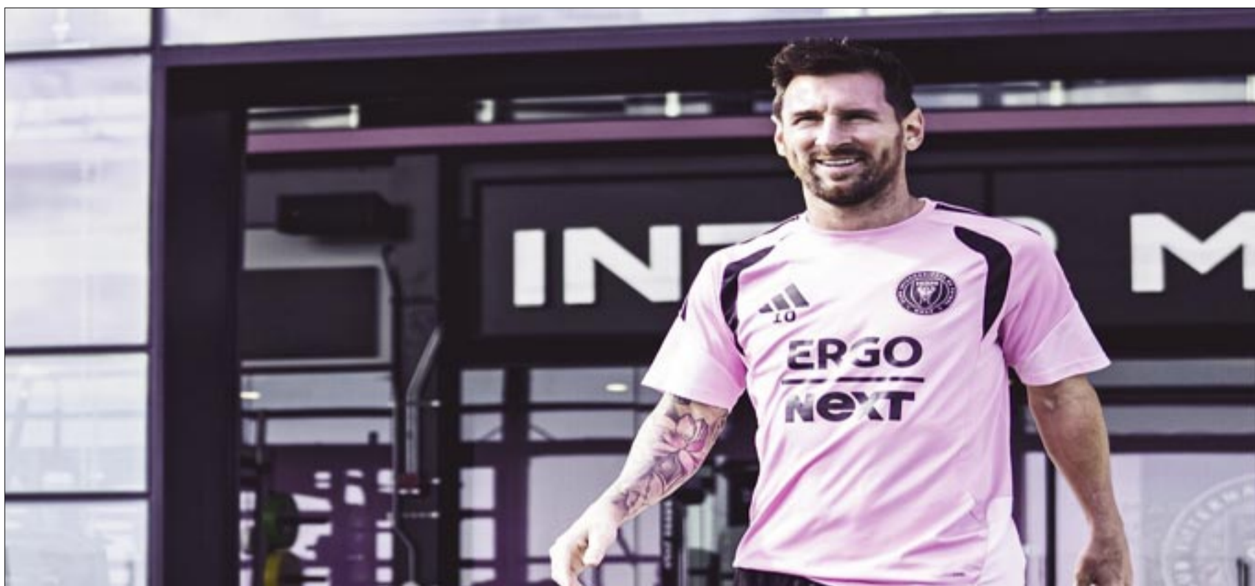
MESSI EN EL ENTRENAMIENTO DE ESTE LUNES (INTER MIAMI)