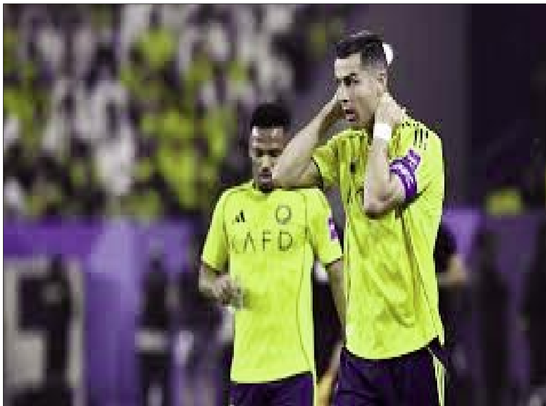
AL NASSR 0-1 GAMBA OSAKA RESUMEN AFC CHAMPIONS LEAGUE 2

Gamba Osaka sorprendió desde el primer minuto con una propuesta muy valiente. El equipo japonés salió a presionar arriba, impidiendo la sa-