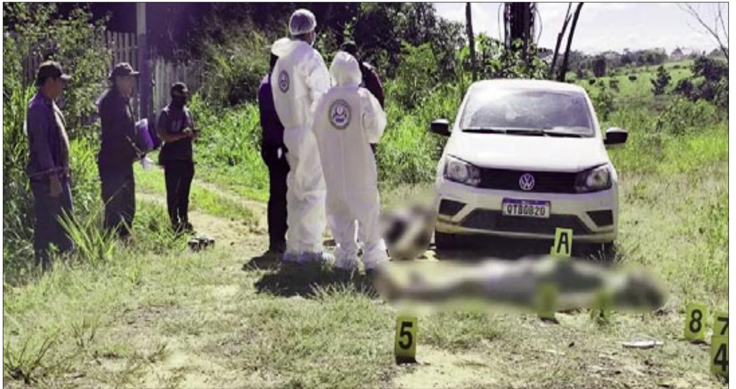
INVESTIGAN DOBLE ASESINATO EN COBIJA. FISCALÍA

Ambos presentaban múltiples heridas provocadas por arma de fuego, por lo que las autoridades presumen que fueron atacados de manera violenta durante la madrugada. En el lugar también se halló un vehículo con placa brasileña que tenía numerosos impactos de bala en diferentes partes de la