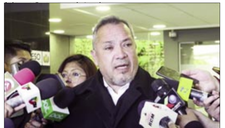
DIPUTADO POR LIBRE-COCHABAMBA, GUILLERMO MENDOZA.