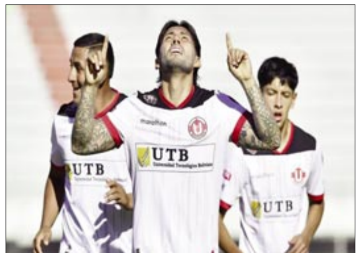
NCIDENCIAS DEL PARTIDO EN EL FÉLIX CAPRILES.

Con este resultado, Bolívar dejó pasar la posibilidad de alcanzar a The Strongest en la cima del torneo y continúa atravesando un momento irregular. El equipo celeste acumuló tres partidos consecutivos sin ganar, luego de los empates frente a Nacional Potosí (1-1) y Blooming (0-0)