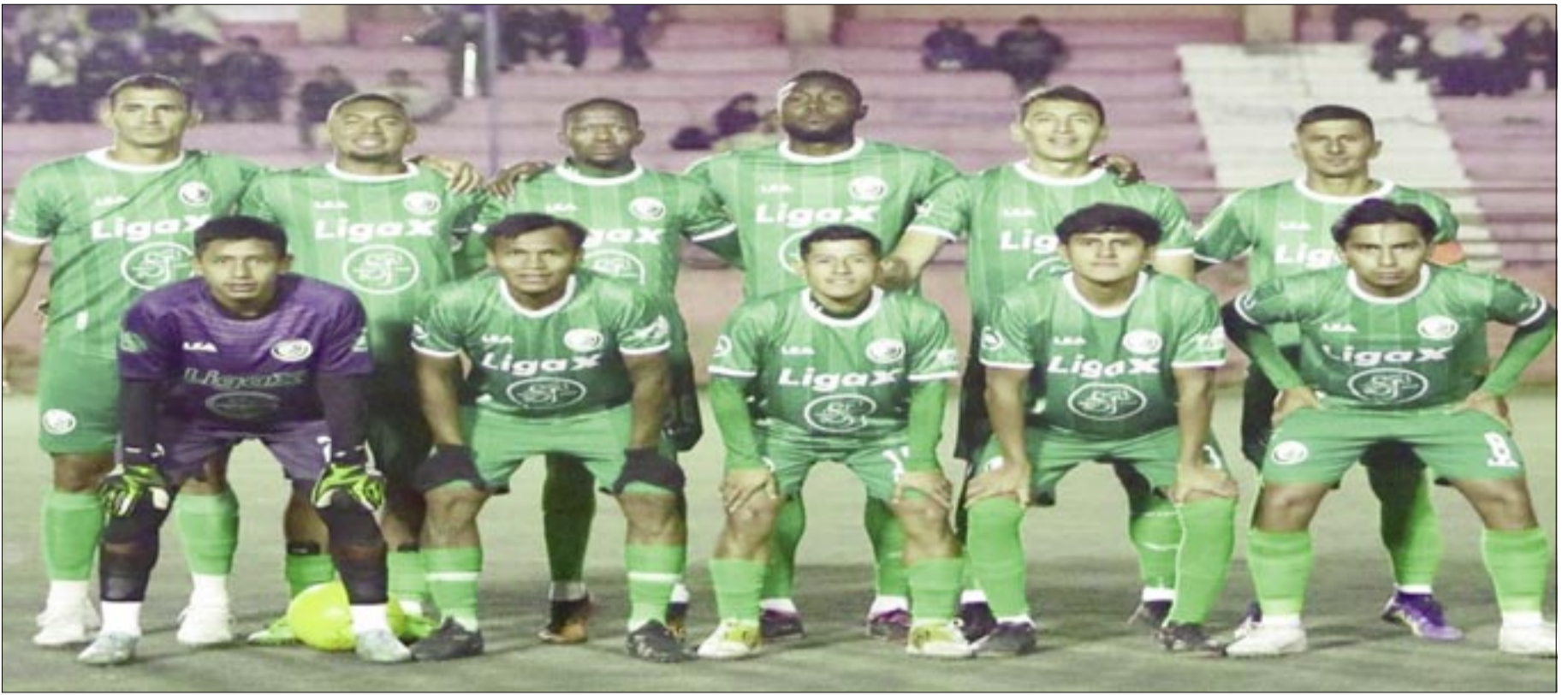
EL PLANTEL DE UNIÓN TARIJA, ESTÁ INVICTO EN EL TORNEO NACIONAL.