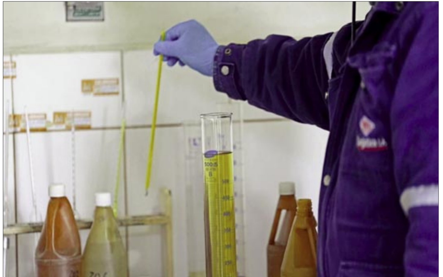
CON LA NUEVA NORMATIVA EL GOBIERNO ESPERA EVITAR PROBLEMAS EN EL COMBUSTIBLE IMPORTADO

YPFB sostiene que el nuevo marco regulatorio busca adecuar las especificaciones técnicas bolivianas a estándares internacionales y fortalecer los controles de calidad en toda la cadena de importación, almacenamiento y comercialización.