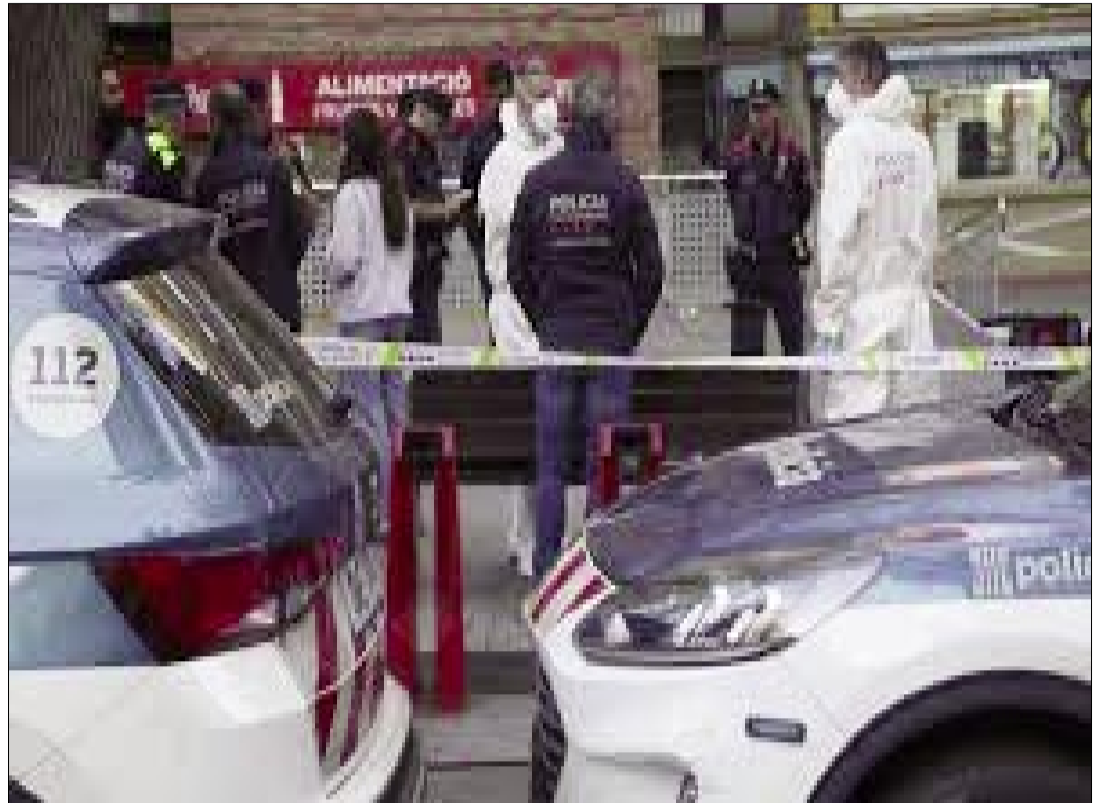
LOS MOSSOS BUSCAN A UN SOSPECHOSO EN LO QUE PODRÍA SER UN NUEVO AJUSTE DE CUENTAS

Hace tres semanas, también en Sants-Montjuïc muy cerca de dónde han matado a este hombre, se produjo un tiroteo.