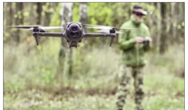
MILITARES DE LA UNIDAD ESPECIAL DE LA 72ª BRIGADA INDEPENDIENTE, LLAMADA LOS ZAPOROZHIANOS NEGROS, ENSAMBLAN Y SE ENTRENAN PARA PILOTAR DRONES ANTES DE SU USO EN COMBATE, EN LA REGIÓN DE JÁRKIV, UCRAINA.