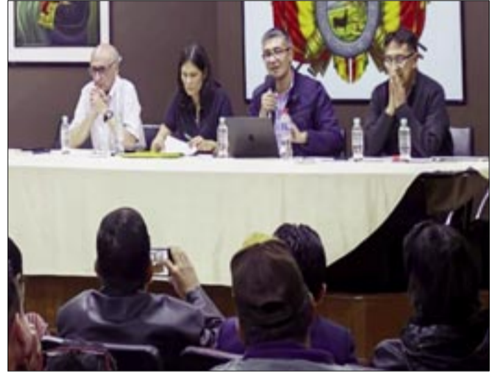
LA REUNIÓN FUE EN COCHABAMBA.

ratificó la vigencia de la educación fiscal, única y gratuita, descartando políticas de privatización, y garantizó la plena vigencia del Reglamento del Escalafón Nacional sin modificaciones.