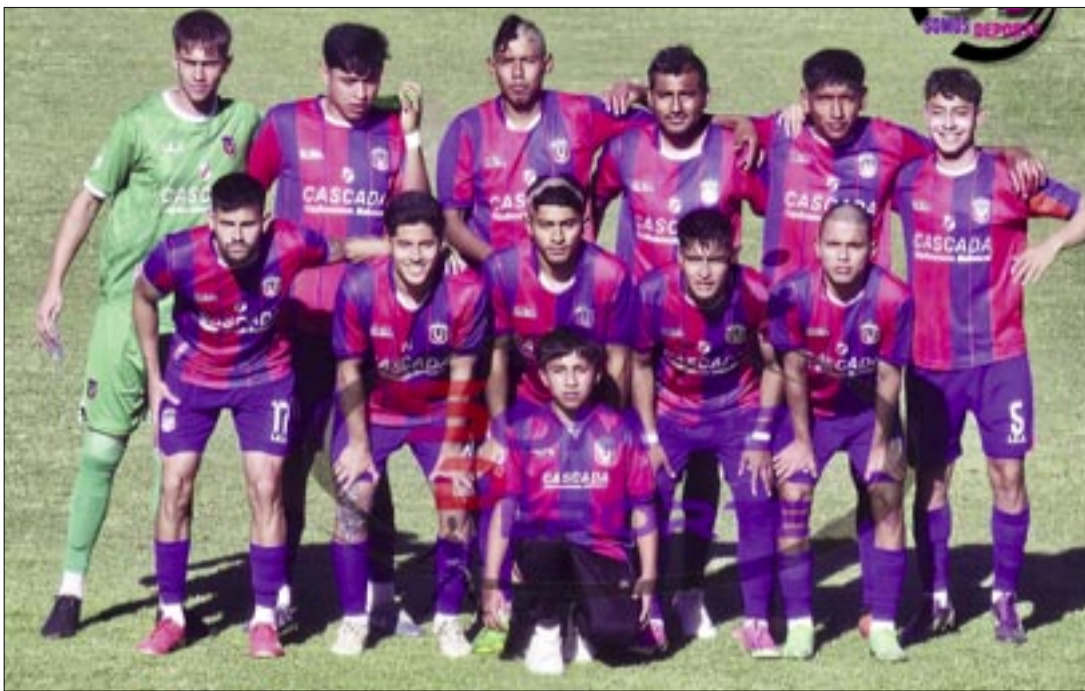
LOS JUGADORES DE UNIVERSITARIO MARCARON LA DIFERENCIA EN EL COMPLEMENTO.