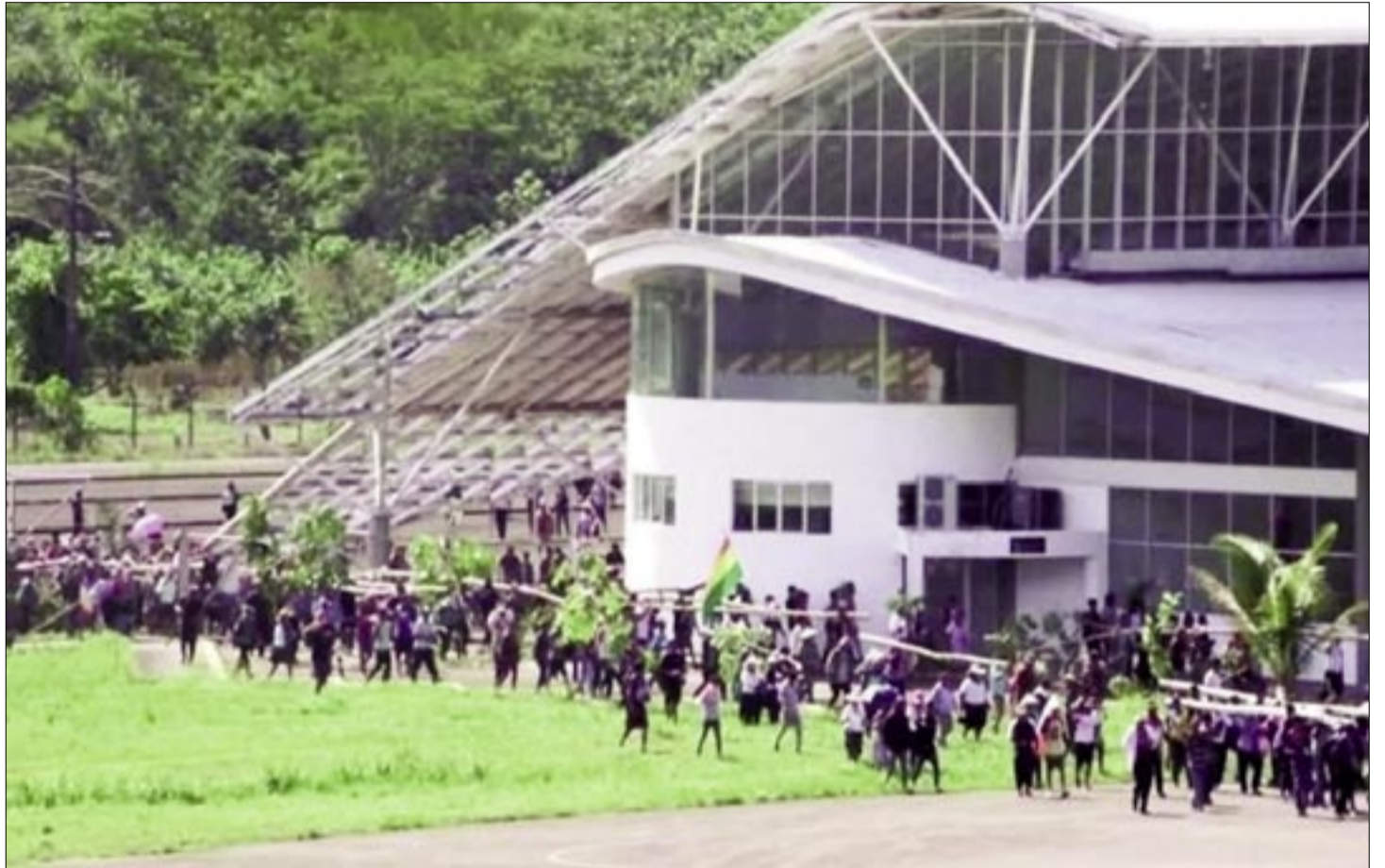
LA TOMA DE AEROPUERTO SE REALIZÓ ESTE SÁBADO

“Bolivia no merece más violencia, amenazas ni discursos que pongan en riesgo la vida de nuestra gente. Tomar el aeropuerto de Chimoré y hablar de perder vidas jamás puede ser el camino. Nuestro país necesita diálogo, paz, institucionalidad y soluciones reales para la población”, expresó la autoridad de Gobierno en una declaración pública. El ministro también cuestionó las medidas de presión impulsadas por sectores evistas y aseguró que este tipo de acciones perjudican directamente a la población, afectan la libre transitabilidad y generan incertidumbre en diferentes regiones del país. Añadió que la confrontación no puede convertirse en un mecanismo político para resolver disputas internas o procesos judiciales. Asimismo, anunció que el Gobierno realizará una auditoría al proyecto de construcción del aeropuerto de Chimoré.