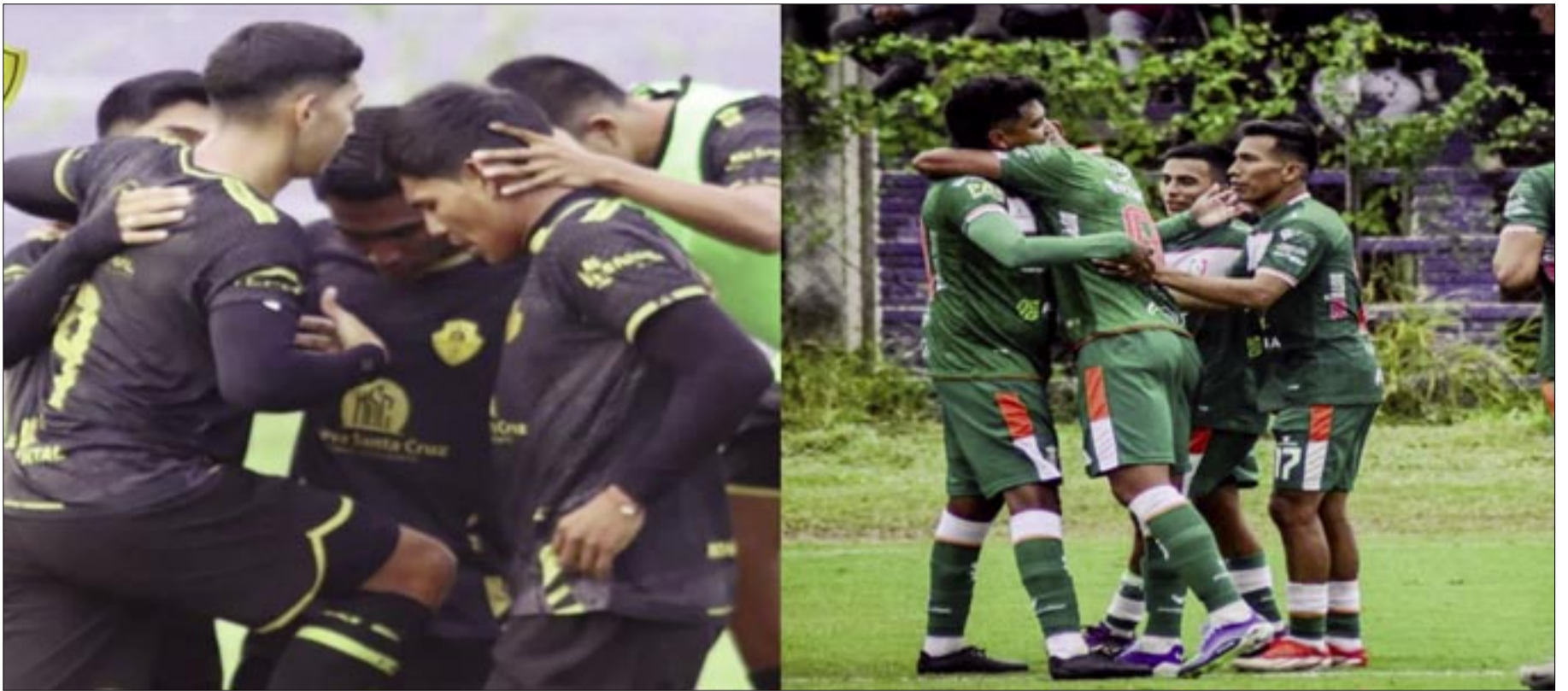
DEPORTIVO NUEVA SANTA CRUZ Y SAN JUAN SON LÍDERES DEL GRUPO A.