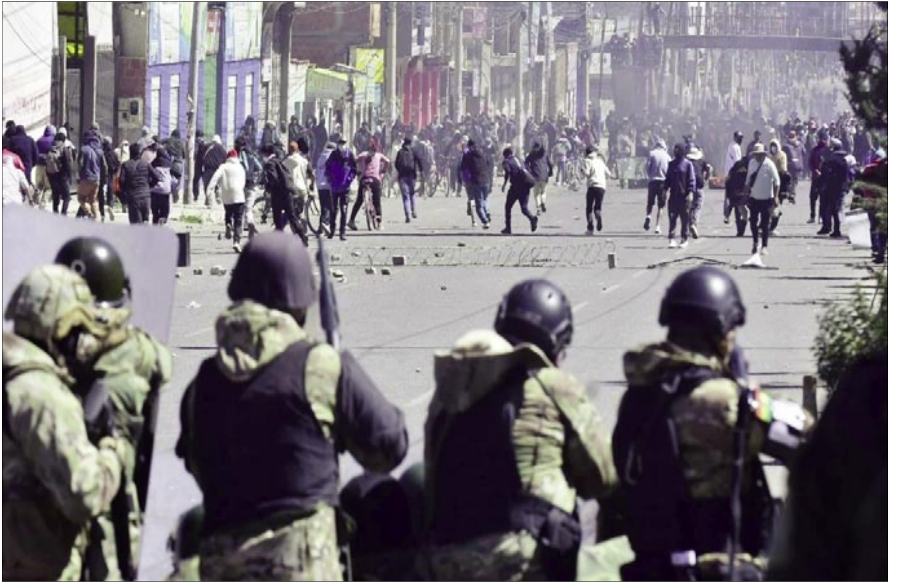
UNIFORMADOS Y BLOQUEADORES ENFRENTADOS EN EL ALTO.

Según el mapa de transitabilidad de la ABC, actualizado hasta las 21:29 de este sábado, permanecen instalados 22 puntos de bloqueos, la gran mayoría en el departamento de La Paz