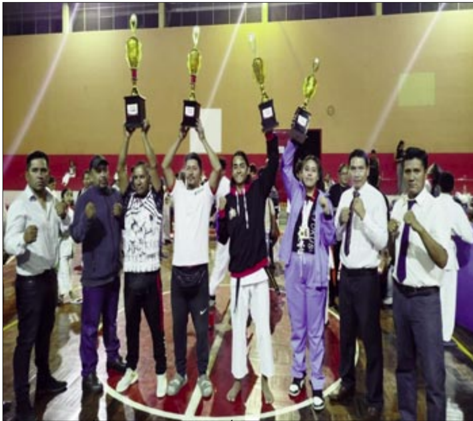
LA SELECCIÓN DE CERCADO SUBIÓ A LA CIMA DEL PODIO.