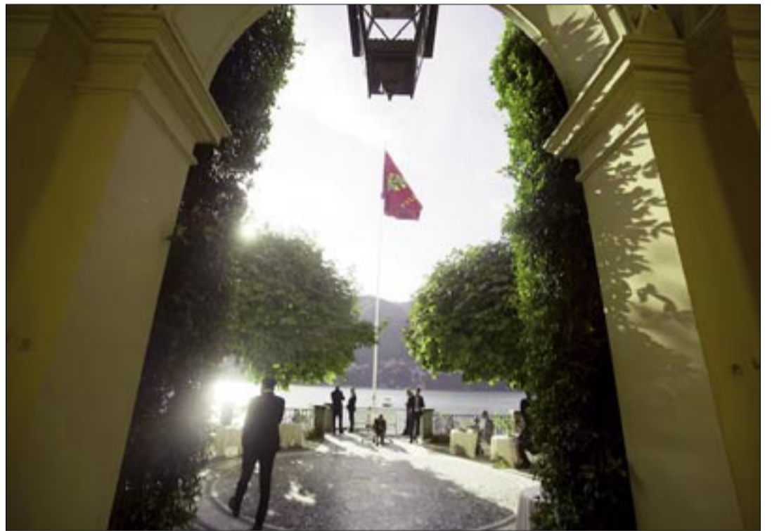
GUERRA CON IRÁN OBLIGA A LA ÉLITE GLOBAL A REPLANTEAR EL SISTEMA ECONÓMICO MUNDIAL. ASISTENTES A ORILLAS DEL LAGO COMO DURANTE EL FORO AMBROSETTI EN CERNOBIO.

sumo podrían mantenerse elevados de forma permanente debido a los costos logísticos y de protección. La élite global ha aceptado que el costo de la paz económica era una dependencia que ya no pueden permitirse. La guerra con Irán, por tanto, actúa como el martillo que está forjando un nuevo modelo de capitalismo, donde la soberanía energética y la seguridad de datos valen más que la optimización de la mano de obra.