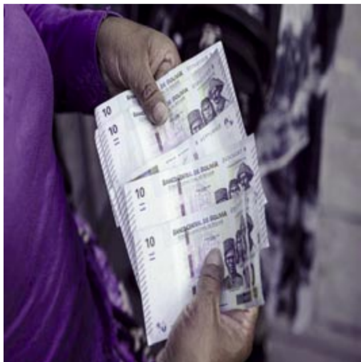
RIESGO DE DEFAULT SE MANTIENE EN BOLIVIA PESE A MEJORA DE CALIFICACIÓN DE RIESGO, DICEN ANALISTAS. UN RESIDENTE MUESTRA BILLETES DE LA SERIE B FRENTE AL BANCO CENTRAL DE BOLIVIA EN LA PAZ, BOLIVIA, EL MARTES 3 DE MARZO DE

mente, una apertura real al capital privado. "El mercado ya no cree en promesas de estabilidad basadas en el consumo interno si no hay dólares que respalden esa operación", afirma uno de los reportes analizados.