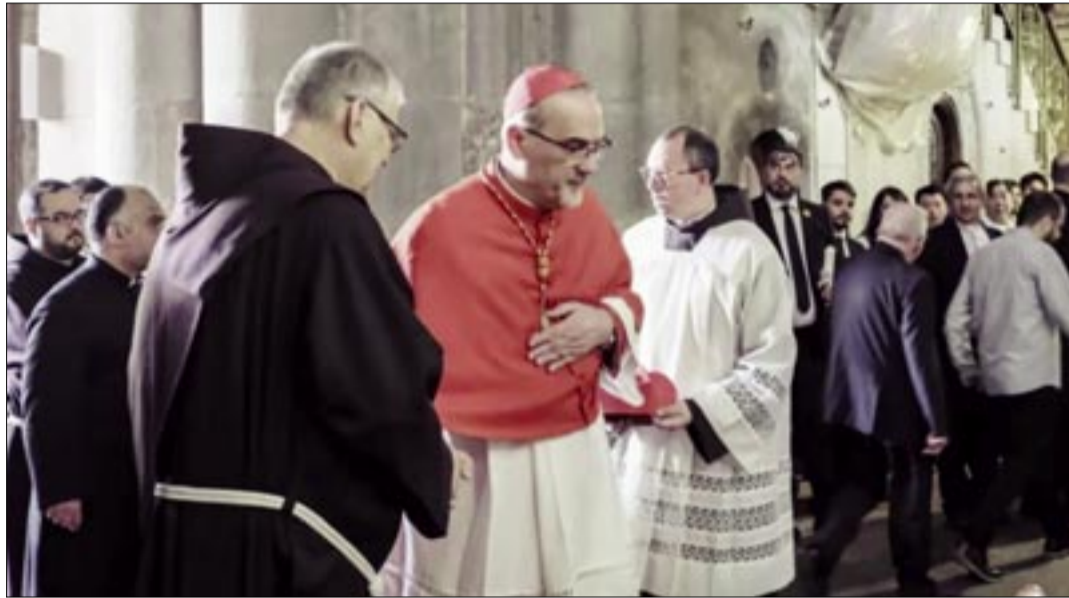
FOTO DE ARCHIVO DEL CARDENAL PIZZABALLA

Finalmente, el Patriarcado y la Custodia expresaron su profundo pesar ante los fieles cristianos de Tierra Santa y del mundo, lamentando la imposibilidad de orar en uno de los días más sagrados del calendario litúrgico, en un