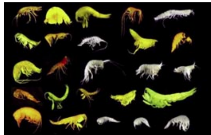
EN CONJUNTO, ESTAS 24 NUEVAS ESPECIES FORMAN INCLUSO UNA SUPERFAMILIA CUYA EXISTENCIA SE DESCONOCÍA