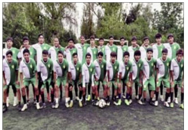
EL CUADRO DE REAL SOCIEDAD QUE JUGÓ ESTE SÁBADO CON CICLÓN.