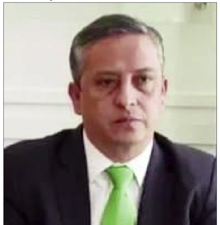
FISCAL DEPARTAMENTAL DE TARIJA, JOSÉ MOGRO PALACIOS.