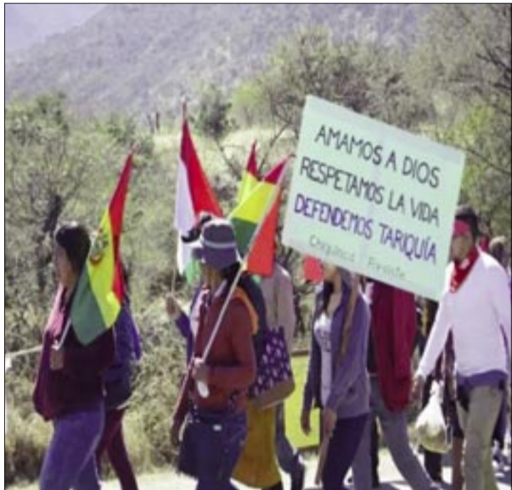
COMUNARIOS MARCHAN EN DEFENSA DE TARIQUÍA.

El conflicto también se trasladó al ámbito penal. Según Ibarra, actualmente existen dos procesos contra comunarios que se oponen al proyecto para defender su hábitat. En el primero, iniciado en octubre de 2024, 12 personas serán llevadas a juicio por delitos como atentado contra la libertad de trabajo e instigación a delinquir. En un segundo proceso, otras 17 personas fueron denunciadas, de las cuales cinco enfrentan ambos casos.