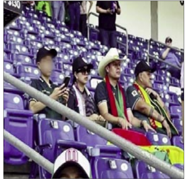
EL VICEPRESIDENTE EN EL PARTIDO BOLIVIA VS SURINAM | FOTO: RRSS

El primer incidente se registró un día antes del partido frente a Surinam, cuando fue captado en el estadio BBVA consumiendo bebidas alcohólicas, situación que generó cuestionamientos por parte de hinchas