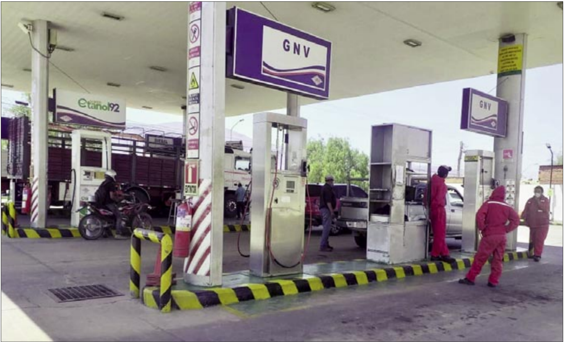
SURTIDORES DE TARIJA RECHAZAN ACUERDO DE CHÓFERES Y GOBIERN