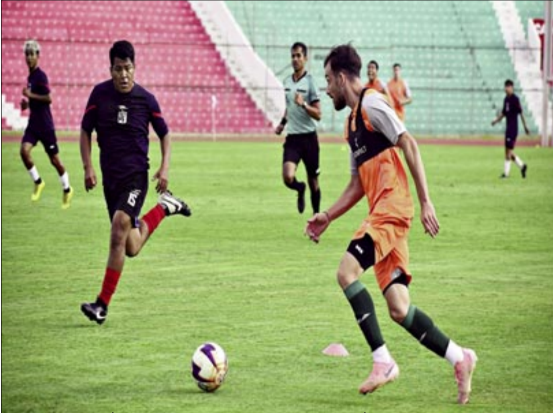
EL PLANTEL JUGÓ PARTIDOS AMISTOSOS DURANTE LAS ÚLTIMAS SEMANAS.