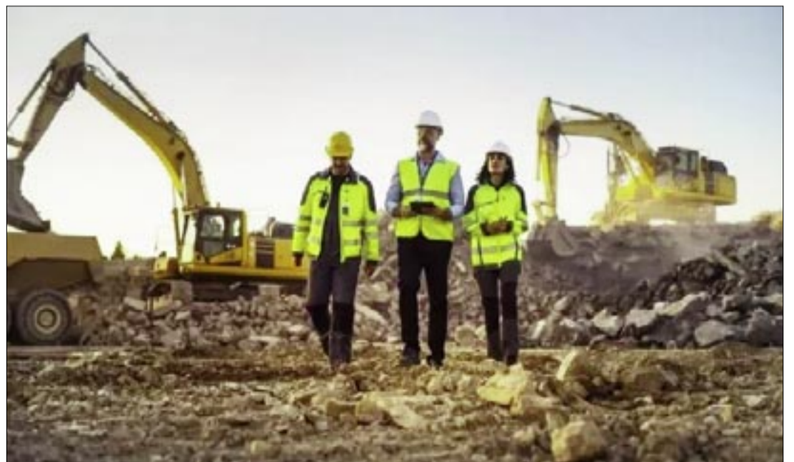
PROFESIONALES EN MINERÍA ANALIZAN POTENCIALIDADES.

Por ello la entidad internacional destaca que, con las políticas y salvaguardas adecuadas, la explotación minera puede ir más allá de la extracción e incluir la fabricación y el procesamiento a nivel local. Este progreso garantiza que el valor y los empleos sigan siendo locales y tengan un impacto duradero.