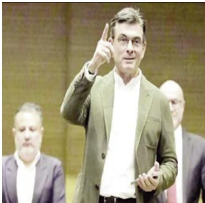
EL PRESIDENTE RODRIGO PAZ EN UNA FOTO DE ARCHIVO/ ABI

El presidente de Bolivia, Rodrigo Paz, reconoció dificultades en el cumplimiento de pagos por los daños ocasionados por combustible de mala calidad, aunque aseguró que ya se iniciaron gestiones para regularizar la situación. La autoridad remarcó que estos procesos requieren cumplir procedimientos administrativos, lo que impide respuestas inmediatas.