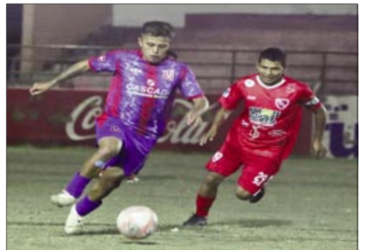
LA "U" INGRESÓ A LA RECTA FINAL DE SU PREPARACIÓN CON MIRAS AL TORNEO 2026.

con la bendición de Dios comenzamos a conformar el plantel base que jugará el primer partido, esperamos que los jugadores puedan poner en práctica todo el trabajo que hemos realizando desde el inicio de la temporada; el equipo está completo, aunque tenemos algunos jugadores que están con algunas molestias, esperamos que en el transcurso de la semana se puedan recuperar, tenemos gente joven, gente que puede ocupar esos puestos”, puntualizó el entrenador del cuadro de Universitario, Abdón Reyes.