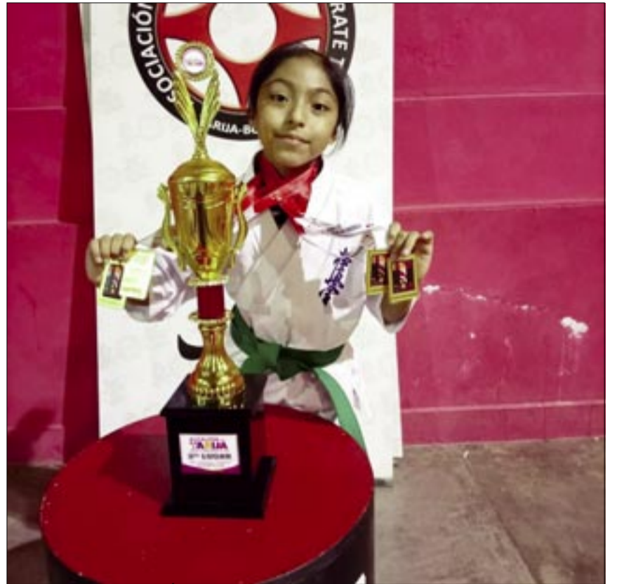
LOS NIÑOS TAMBIÉN FUERON PROTAGONISTAS DEL TORNEO DEPARTAMENTAL.