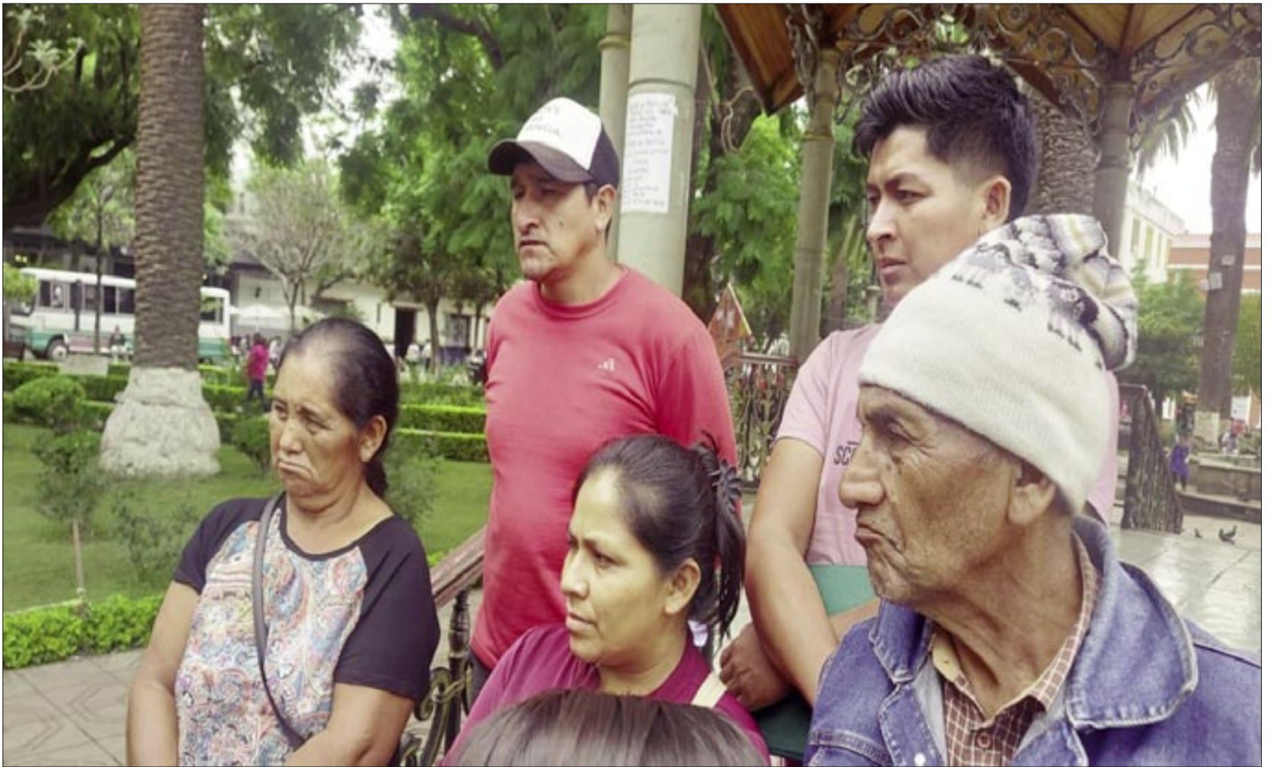
CHIQUIAQUEÑOS PROCESADOS POR DEFENDER TARIQUÍA

Pese a todo gozan de libertad irrestricta