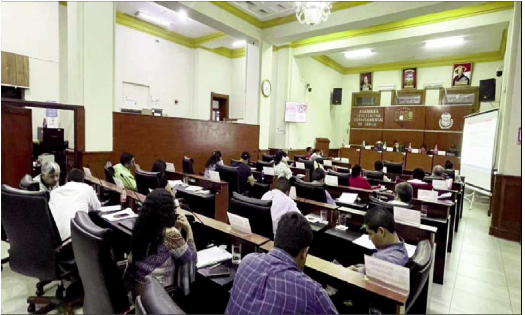
DENUNCIA CONTRA LEGISLADORES POR LEY DEL 45 % NO PROSPERA

El instrumento legal está sancionado, no promulgado