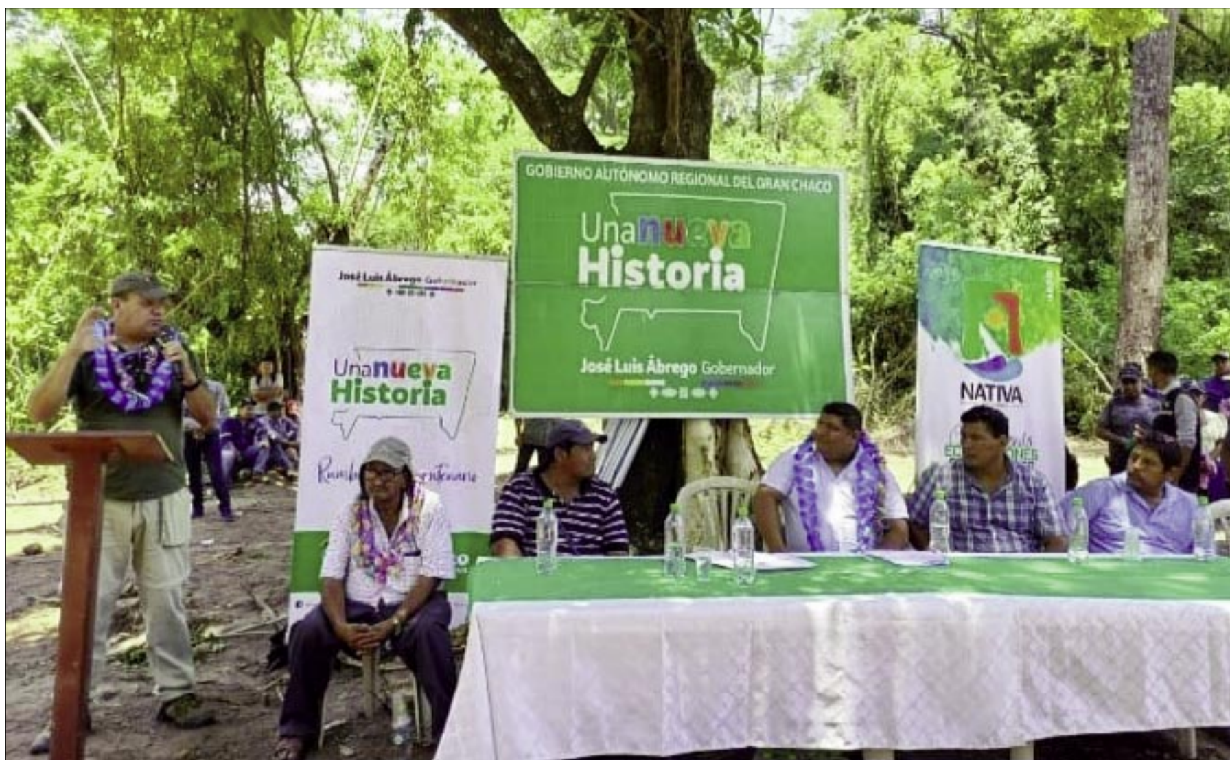
GOBIERNO REGIONAL DEL GRAN CHACO, SIN LOS RECURSOS ESPERADOS COMO EN EL RESTO DEL PAÍS.

Una cosa es lo presupuestado y otra lo recibido