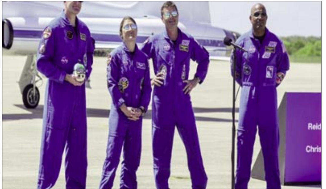
LA TRIPULACIÓN DE ARTEMIS II POSA TRAS SU LLEGADA AL CENTRO ESPACIAL KENNEDY, EN FLORIDA, Y PARTIRÁN EL MIÉRCOLES

A bordo viajarán cuatro astronautas: Reid Wiseman, Victor Glover, Christina Koch y Jeremy Hansen.