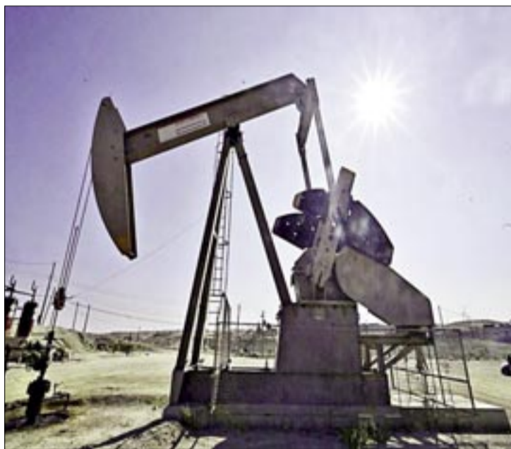
GUERRA: LA PRODUCCIÓN DE PETRÓLEO SE VE AFECTADA POR LA FALTA DE SEGURIDAD EN EL TRANSPORTE. FOTO: ARCHIVO

DANIEL SALAZAR CASTELLANOS/BLOOMBERG LÍNEA