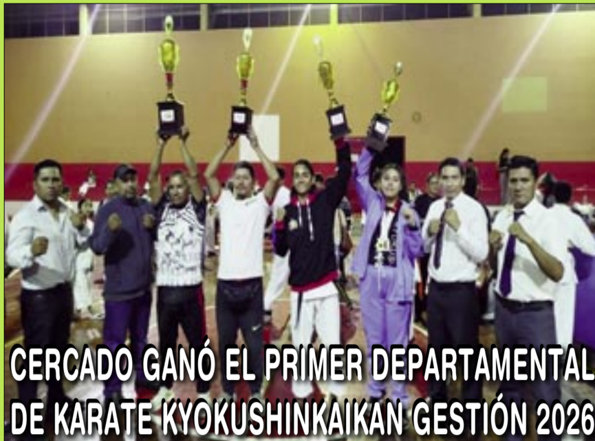
CERCADO GANÓ EL PRIMER DEPARTAMENTAL DE KARATE KYOKUSHINKAIKAN GESTIÓN 2026