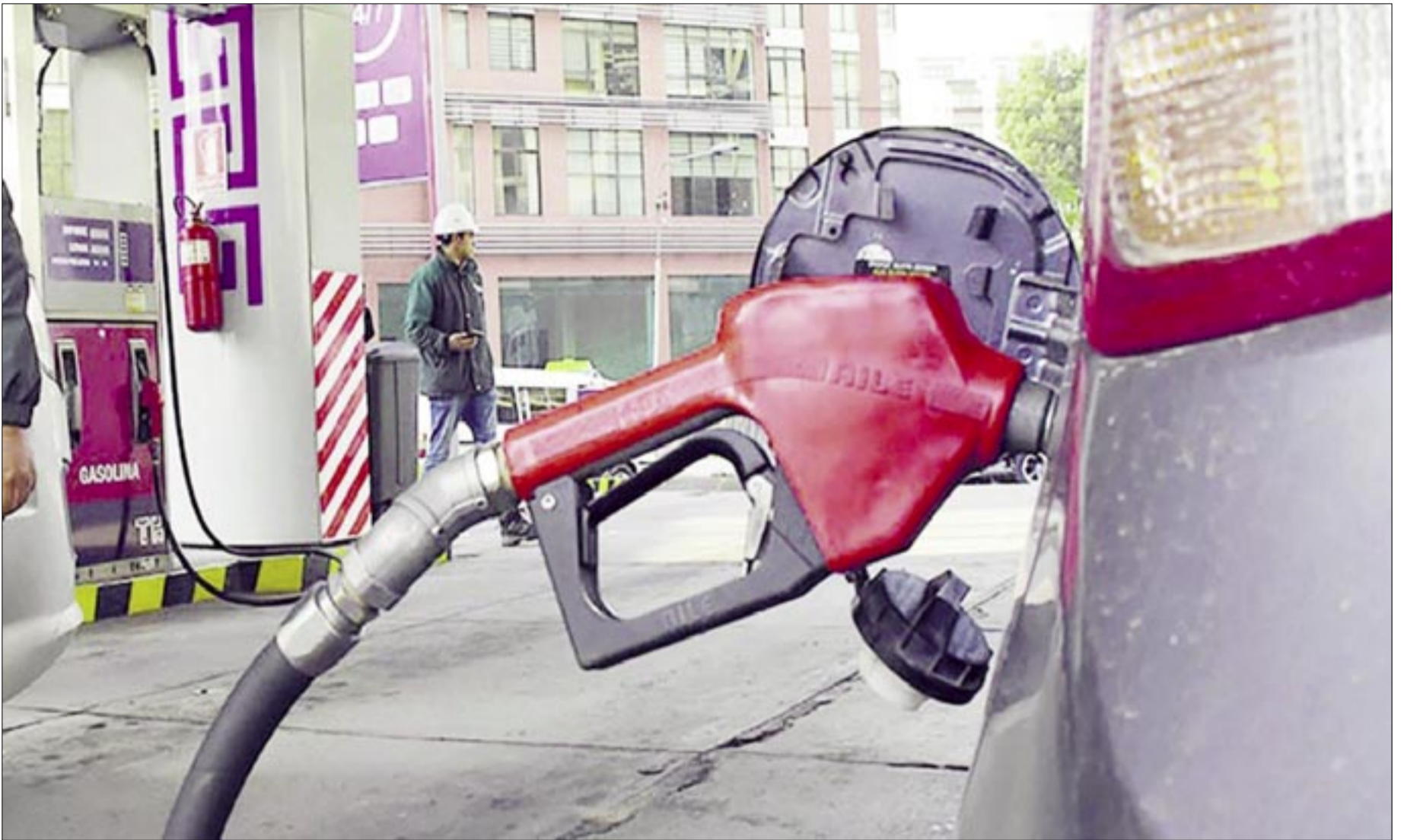
EL PRECIO DE LA GASOLINA EN BOLIVIA ESTÁ A LA MITAD DEL COSTO EN EL MERCADO INTERNACIONAL.

Se generó una marcada incertidumbre en el país