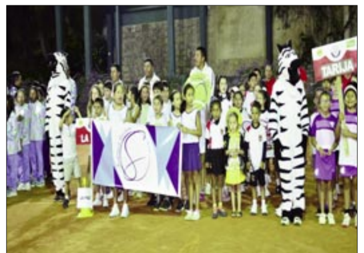
LOS TENISTAS DURANTE EL ACTO DE INAUGURACIÓN DE LA CITA NACIONAL SUB – 10. (ORGANIZACIÓN).

Durante el desarrollo del campeonato los niños compartieron momentos especiales, más que todo de amistad mediante el deporte blanco; la inauguración del campeonato se desarrolló durante la noche del jueves en los predios del club de tenis Tarija, al acto asistieron los padres de familia, los dirigentes de la Federación Boliviana de Tenis, de la Asociación Departamental de Tenis y del club de tenis Tarija; junto a los niños le dieron el realce a tan importante acto.