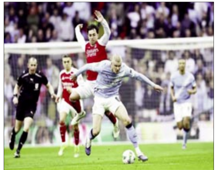
HAALAND, EN UN DUELO ANTE ZUBIMENDI.

Y la tendencia se mantuvo. El City seguía siendo superior tras el descanso y encontró, pasados 15 minutos de la reanudación, el 'factor Nico O'Reilly'. Un talento de la academia City que se inventó Guardiola y ha aprovechado en prácticamente todas las posiciones del campo. Un joven de apenas 21 años que ha demostrado tener gol (13 tantos en año y medio con el primer equipo) desde el primer día y que, jugando como lateral izquierdo, hizo doblete en Wembley