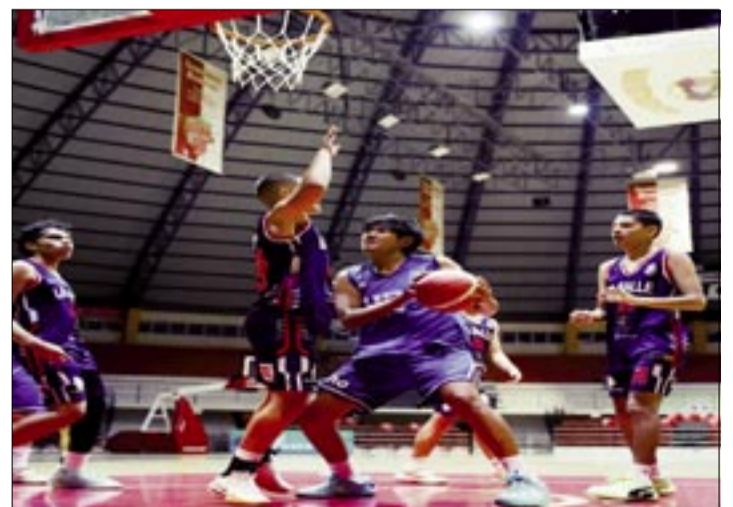
EL PLANTEL DE LOBOS UNO, ESTÁN EN EL PUESTO 7 DE LA TABLA CON 5 PUNTOS.

Sin embargo, ganaron el tercero y en el último cuarto ganaron el partido, aprovecharon las falencias que tuvo el rival y anotaron lanzamientos desde los tres, dos y un punto.