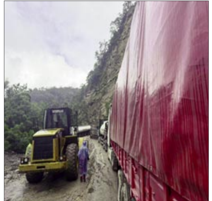
VEHÍCULOS PESADOS HAN QUEDADO ATRAPADOS EN PLENA RUTA

La ruta a los Valles cruceños ya dejó consecuencias fatales este sábado: un pasajero falleció y