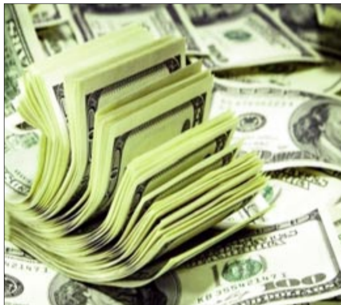
EL BCB TIENE UN POCO MÁS DE $US 300 MILLONES EN DIVISAS, UNA DE LAS MÁS BAJAS DE LOS ÚLTIMOS AÑOS

restricciones de liquidez, caída de reservas internacionales y presiones sobre las finanzas públicas. El anuncio fue realizado por el ministro de Economía, José Gabriel Espinoza, quien destacó que el cumplimiento se realizó sin recurrir a nuevo endeudamiento.