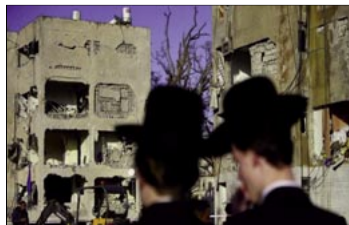
LUEGO DEL ATAQUE CONTRA DIMONA, AL MENOS 100 PERSONAS RESULTARON HERIDAS LA NOCHE DEL SÁBADO

Ante este ultimátum del presidente estadounidense, la respuesta iraní no se ha hecho esperar. Los responsables de la Guardia Revolucionaria han afirmado que, en caso de ataque contra las centrales eléctricas iraníes, todas las instalaciones de desalinización de las monarquías árabes del Golfo Pérsico serán blanco de ataques inmediatos.