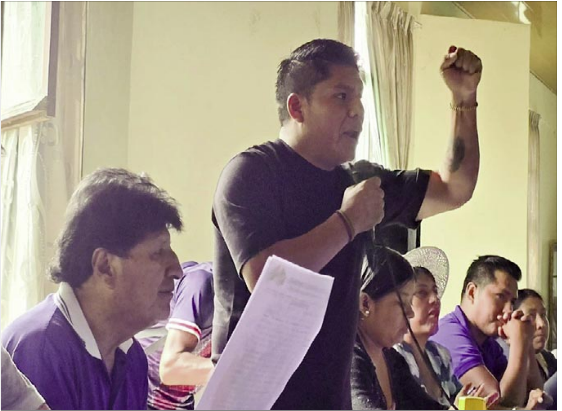
LEONARDO LOZA CELEBRA JUNTO A LOS COCALEROS DEL CHAPARE SU TRIUNFO ELECTORAL.