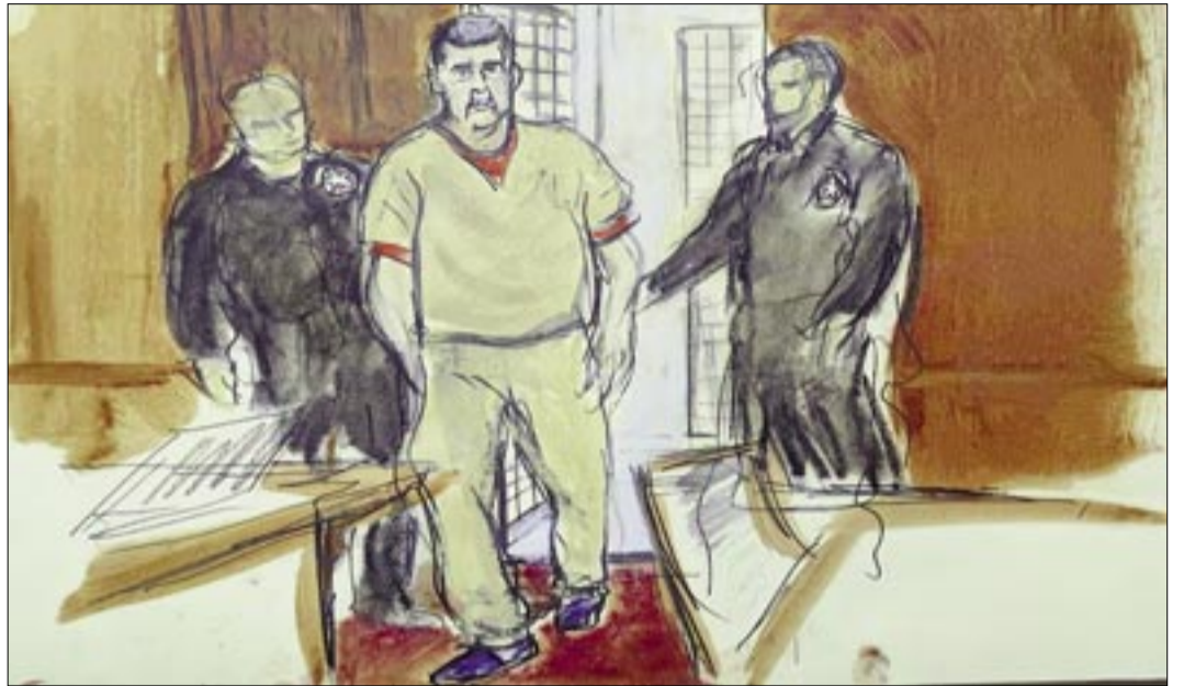
EL EXPRESIDENTE VENEZOLANO NICOLÁS MADURO ES ESCORTADO A UNA SALA DE UN TRIBUNAL FEDERAL DE MANHATTAN, EL JUEVES 26 DE MARZO DE 2026, EN NUEVA YORK

Este mensaje surge a dos días de una nueva jornada en la que el exmandatario venezolano compareció ante un tribunal federal de Manhattan. En tanto, continúa preso en Nueva York. Las imputaciones contra Maduro incluyen delitos