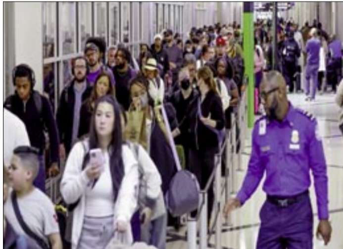
PASAJEROS HAN TENIDO QUE FORMARSE POR VARIAS HORAS PARA CRUZAR LOS CONTROLES DE SEGURIDAD EN VARIOS AEROPUERTOS DE EE.UU.

En grandes aeropuertos, como los de Nueva York, Atlanta y Houston, la ausencia ha llegado hasta el 40%. Pero en otros aero-