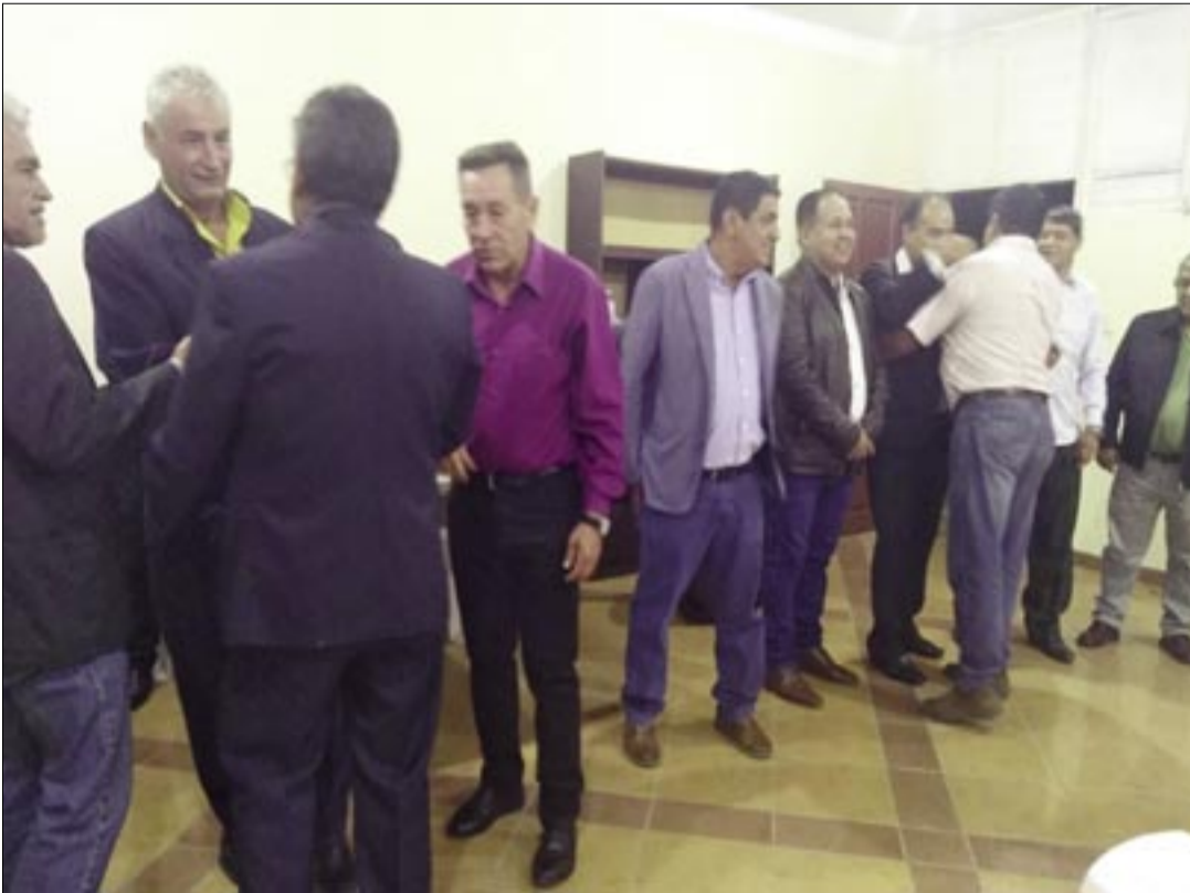
EL MOMENTO DE LAS FELICITACIONES A LA NUEVA DIRECTIVA DE LA MUTUAL.