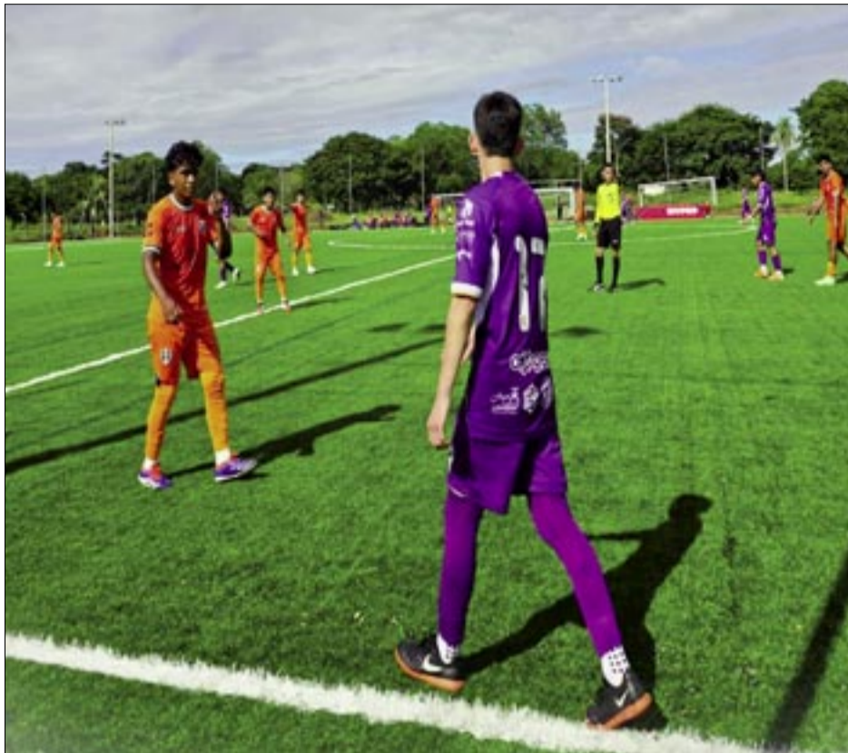
UNA DE LAS CELEBRACIONES DEL PLANTEL DE REAL TOMAYAPO.