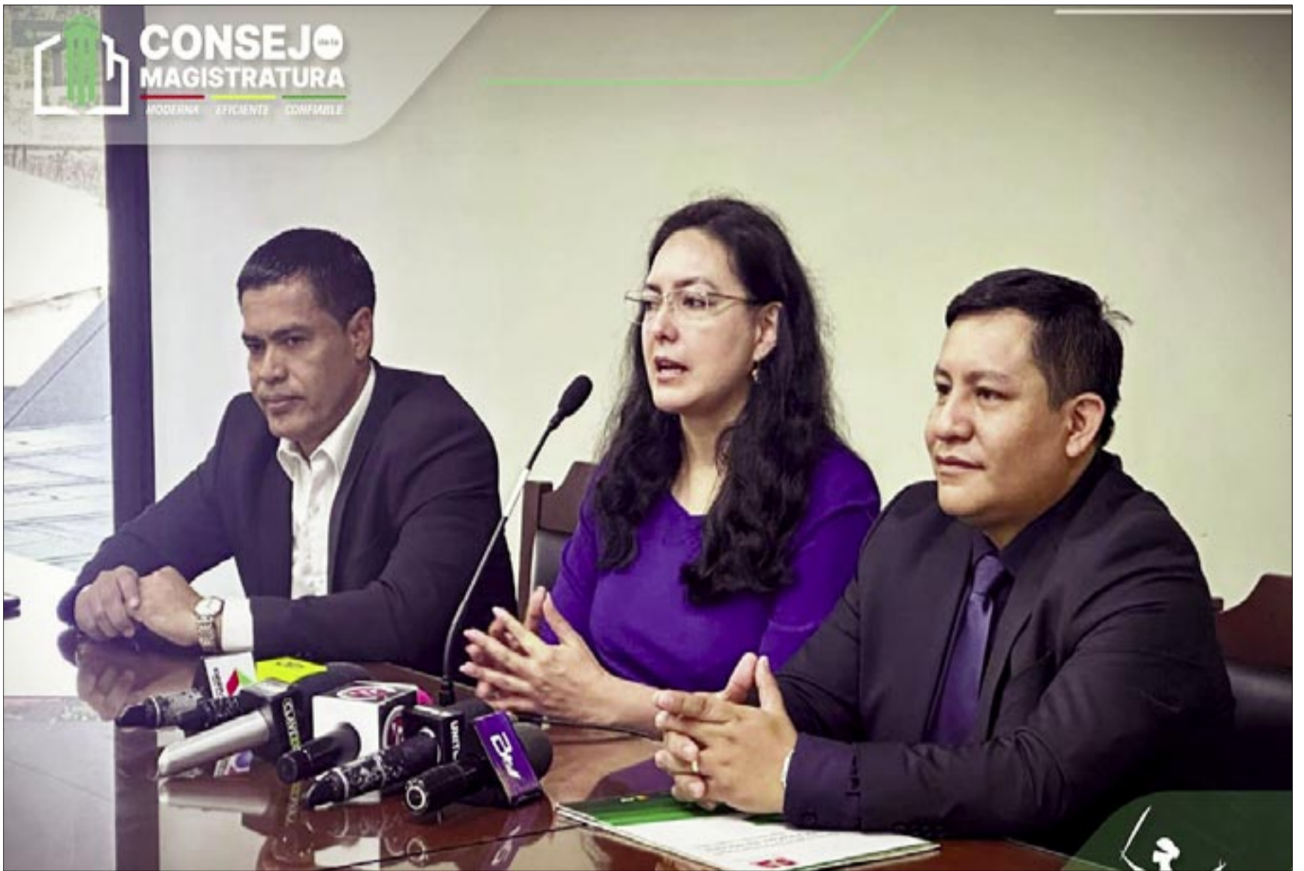
CONSEJEROS DE LA MAGISTRATURA CON SEDE EN SUCRE.