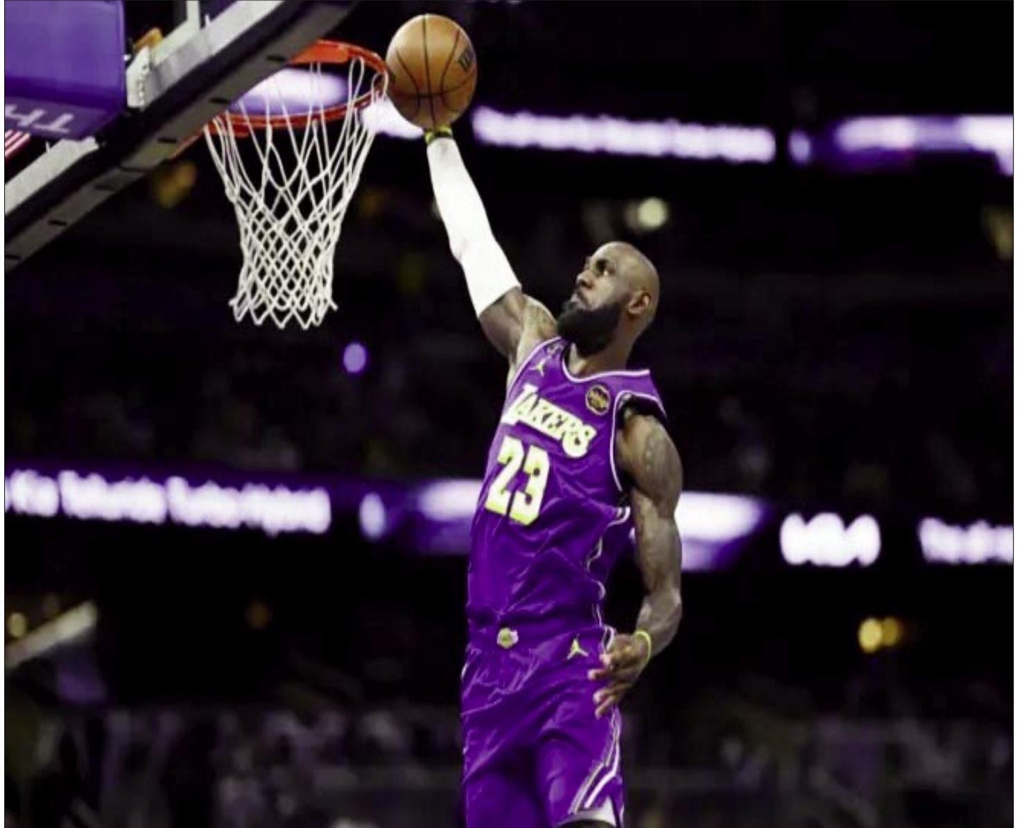
LEBRON JAMES MACHACA EN LA PRIMERA ACCIÓN DE SU PARTIDO 1.612 COMO PROFESIONAL.

Con el de hoy, además, ha alcanzado los 469 partidos con la camiseta de la franquicia angelina. Antes de llegar en 2018, ya lle-