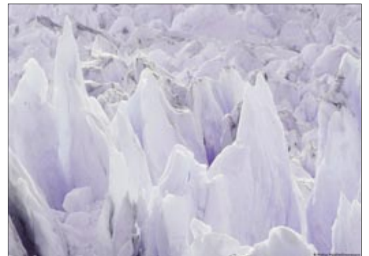
EN ARGENTINA, GRAN PARTE DEL AGUA SUPERFICIAL Y SUBTERRÁNEA QUE ABASTECE A LAS PROVINCIAS CORDILLERANAS PROVIENE DEL APORTE COMBINADO DE LA NIEVE, LOS GLACIARES Y EL AMBIENTE PERIGLACIAR.

"Esta es la razón por la que se discutió la necesidad de un régimen que ordene las actividades en zonas de glaciares", agrega Villalonga apuntando la aprobación de dicha ley en 2010 que prohíbe la actividad minera, la hidrocarbúfera e industrial, la liberación, dispersión o deposición de sustancias contaminantes o residuos, y la construcción de obras de infraestructuras.