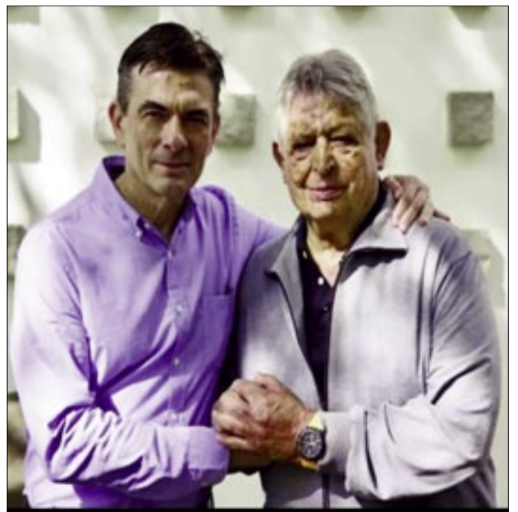
EL PRESIDENTE ACOMPAÑÓ A SU PADRE, JAIME PAZ ZAMORA CUANDO VOTÓ EN SAN LORENZO

tomar decisiones sobre volver a potenciar los hidrocarburos en Bolivia y otras energías renovables, sugirió