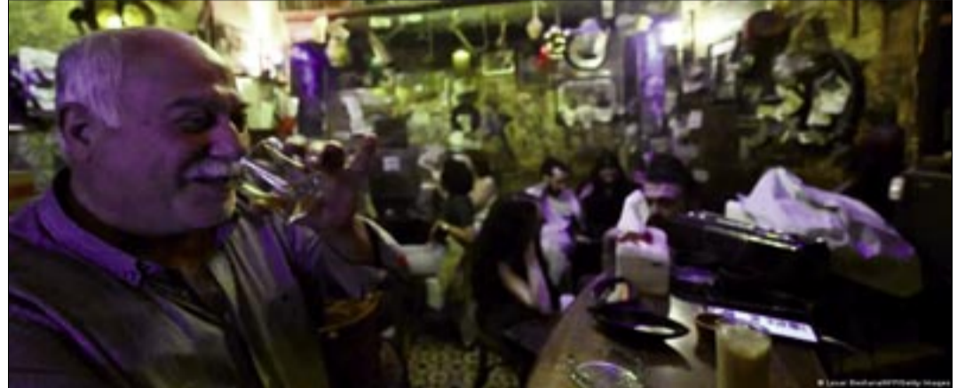
LOS LOCALES QUE VENDEN ALCOHOL TIENEN 90 DÍAS PARA CONVERTIRSE EN CAFETERÍAS

La prohibición del alcohol en Damasco desató un debate entre los sirios. Algunos estiman que esto va mucho más allá de una simple copa, y que tiene que ver con las libertades y la unidad comunitaria.