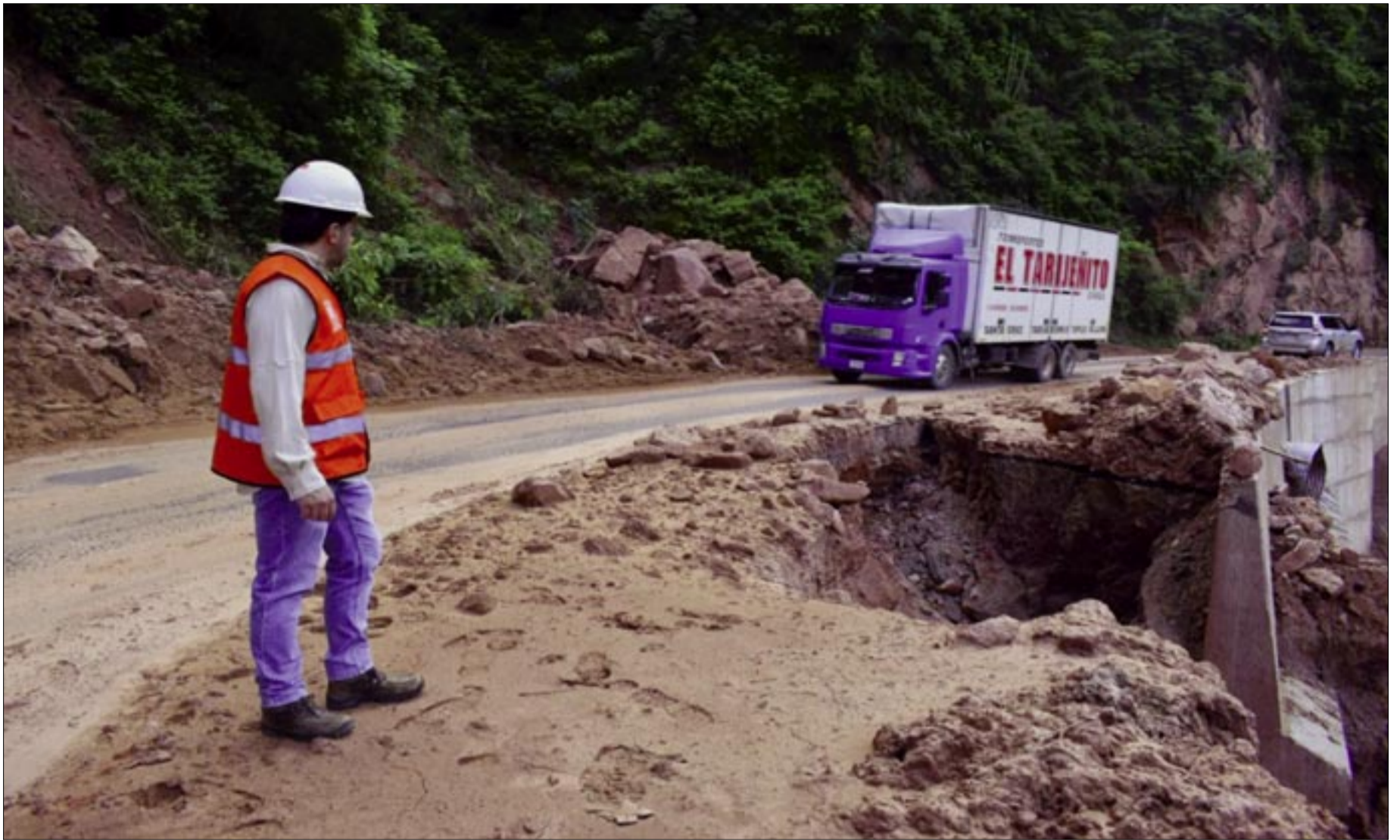
VARIOS TRAMOS DEL CAMINO AL CHACO ESTÁN PRÁCTICAMENTE DESTRUIDOS