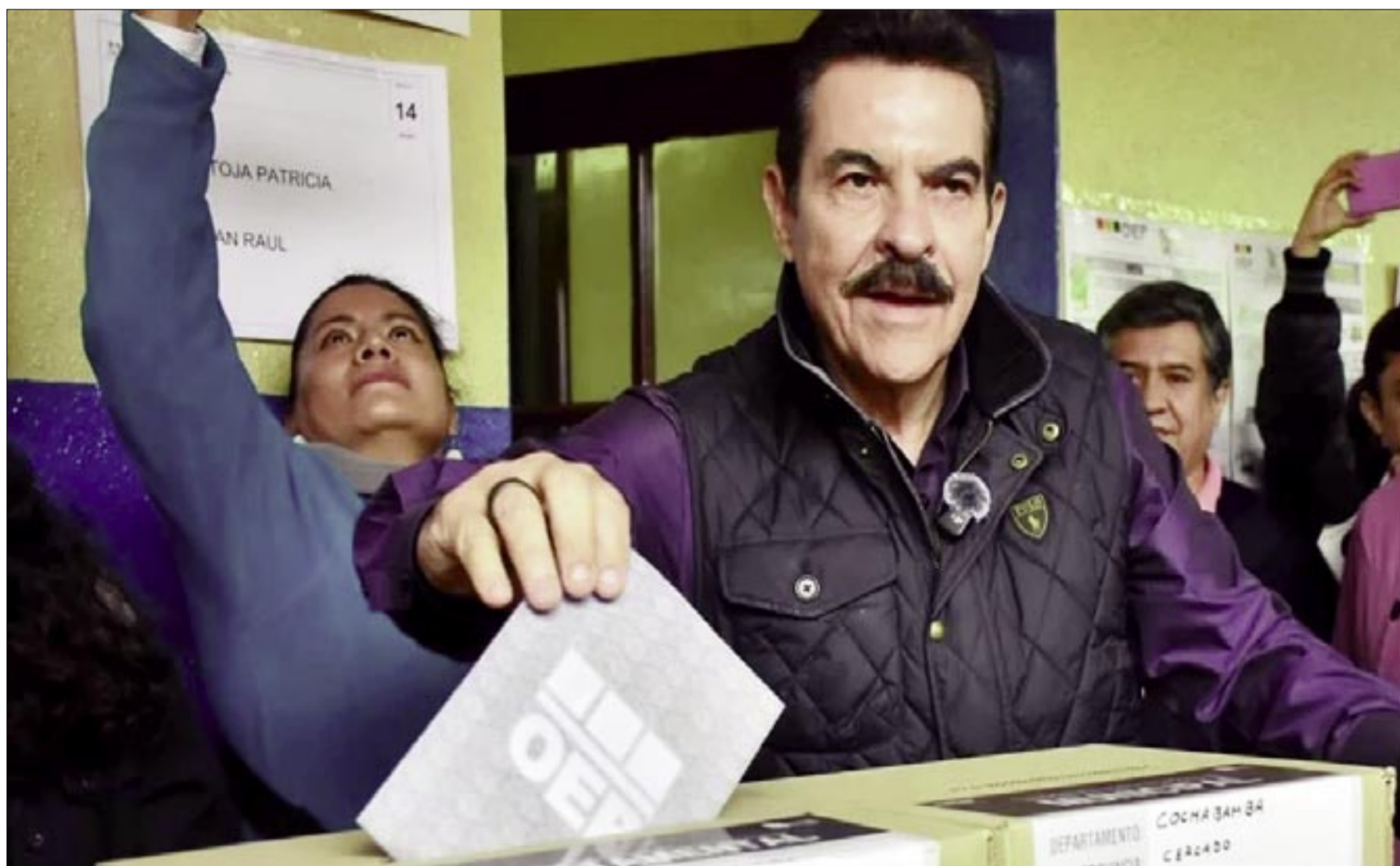
MANFRED REYES VILLA