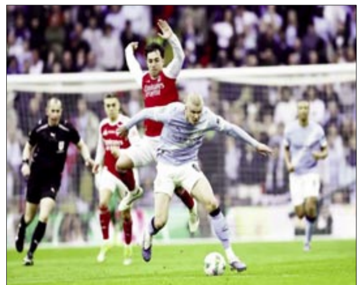
HAALAND, EN UN DUELO ANTE ZUBIMENDI.

La cantera, al rescate del City Y la tendencia se mantuvo. El City seguía siendo superior tras el descanso y encontró, pasados 15 minutos de la reanudación, el 'factor Nico O'Reilly'. Un talento de la academia City que se inventó Guardiola y ha aprovechado en prácticamente todas las posiciones del campo. Un joven de apenas 21 años que ha demostrado tener gol (13 tantos en año y medio con el primer equipo) desde el primer día y que, jugando como lateral izquierdo, hizo doblete en Wembley