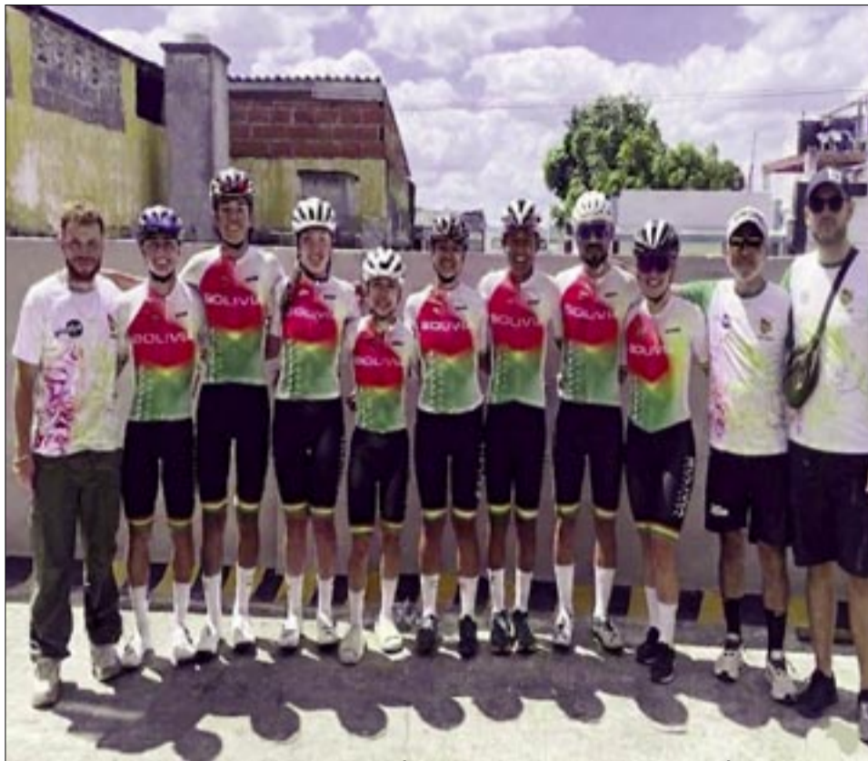
LOS INTEGRANTES DE LA SELECCIÓN DE BOLIVIA QUE COMPITIÓ EN COLOMBIA.