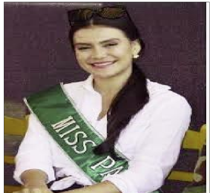
MISS PANDO 2024