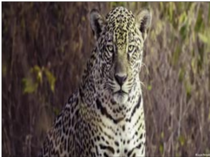
EL JAGUAR ES, JUNTO AL TAPIR Y EL OSO HORMIGUERO, UNA DE LAS ESPECIES PROTEGIDAS QUE HABITAN EL PANTANAL, RECONOCIDO POR LA UNESCO COMO PATRIMONIO NATURAL DE LA HUMANIDAD. (ARCHIVO: 06.07.2024)