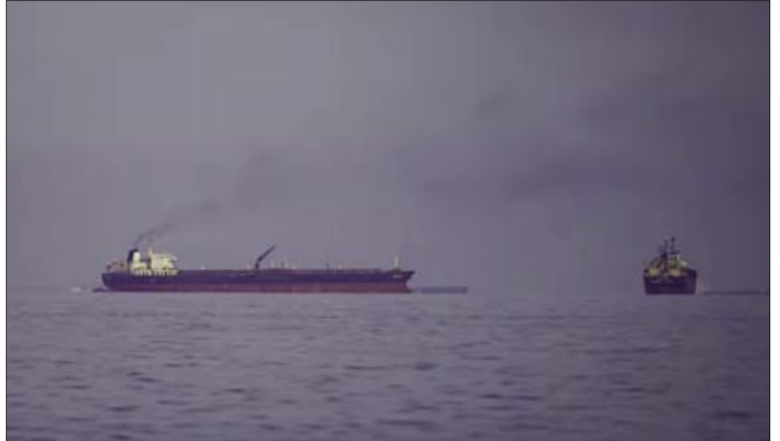
LOS BUQUES CISTERNA, CON DIMENSIONES QUE SUPERAN EL LARGO DE UN CAMPO DE FÚTBOL Y VELOCIDADES DE MANIOBRA REDUCIDAS, REPRESENTAN BLANCOS DE ALTO VALOR Y FÁCIL FIJACIÓN PARA LOS SISTEMAS DE MINADO

Minas lapa: se trata de artefactos más pequeños que son adheridos manualmente al casco de los barcos por buzos. Estos dispositivos están programados para explotar tras un tiempo determinado, lo que permite a