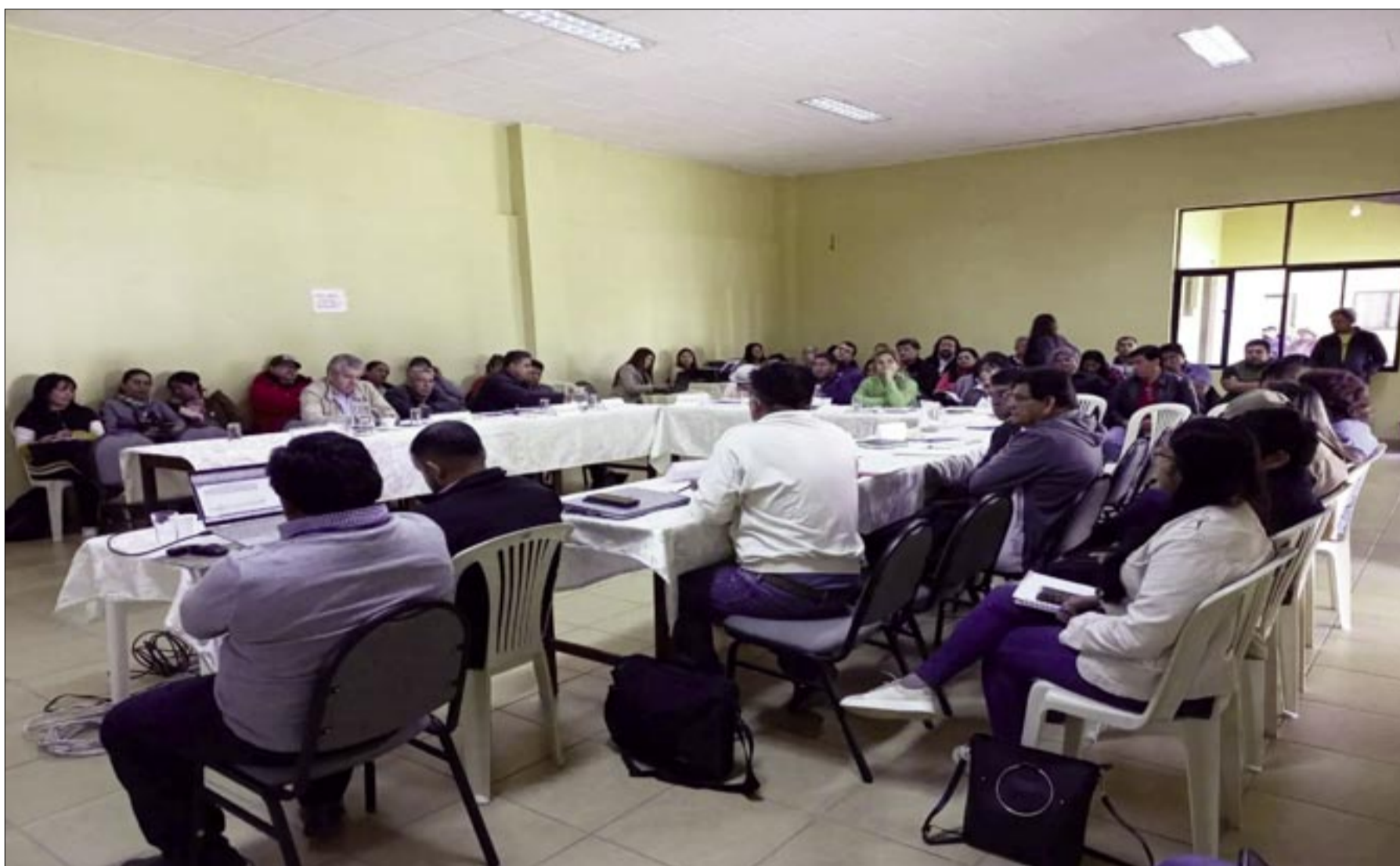
MUNICIPIOS CON PRESUPUESTOS DESFASADOS POR CORTE EN SUBVENCIÓN EN PRECIO DE CARBURANTES, ENTRE OTROS FACTORES