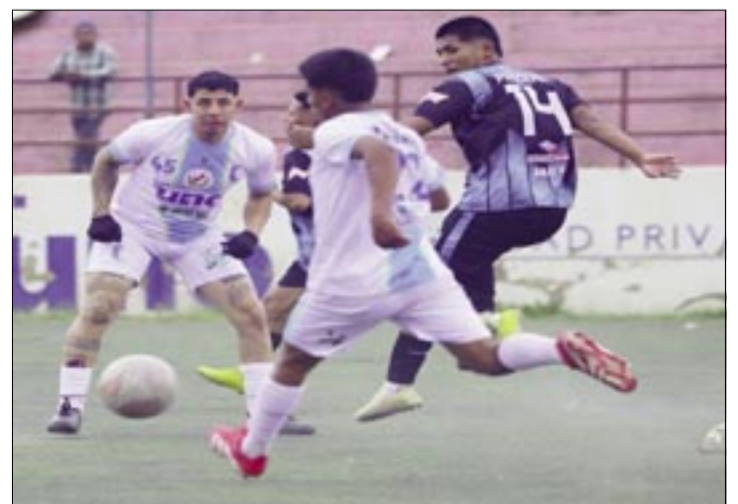
EL CUADRO ENTRERRIANO SE ALISTA PARA COMPETIR EN EL TORNEO 2026.