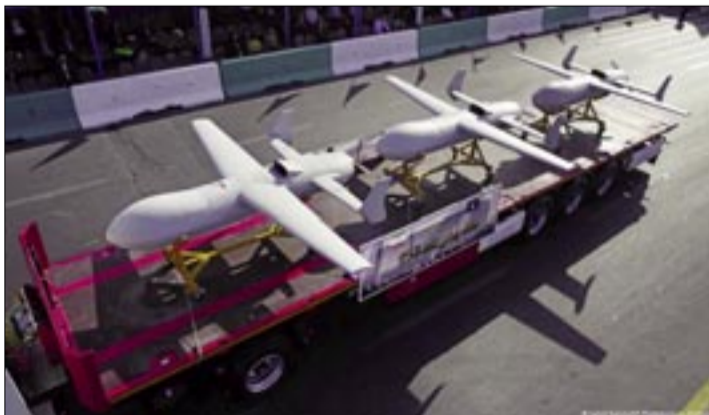
DRONES DE COMBATE IRANÍES EN UN DESFILE MILITAR (IMAGEN DE ARCHIVO).

En numerosos países de la región del Golfo, se están atacando las instalaciones energéticas y militares y la infraestructura civil. Al mismo tiempo, el presidente estadounidense, Donald Trump, declaró que Irán fue derrotado militarmente. Pero la realidad sobre el terreno cuenta una historia diferente. Políticamente, la presión sobre Washington aumenta. El alza de los precios de la energía está impulsando la inflación y la inseguridad en todo el mundo, también