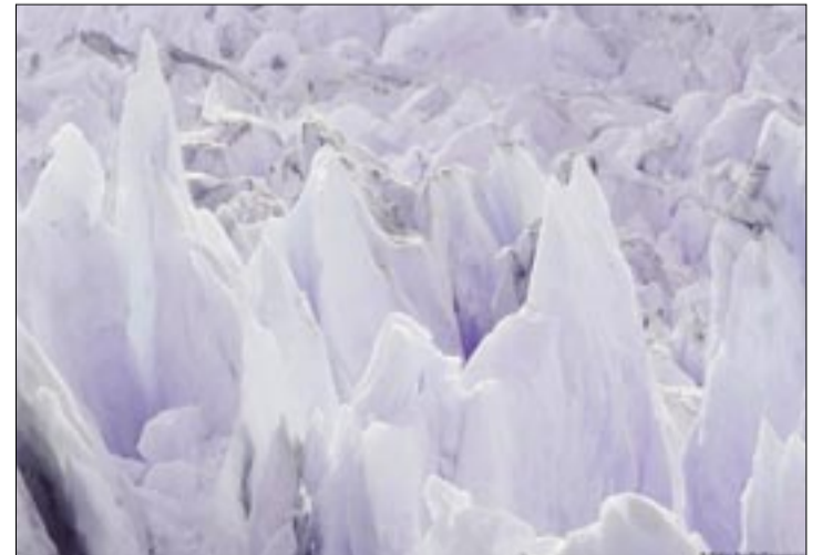
EN ARGENTINA, GRAN PARTE DEL AGUA SUPERFICIAL Y SUBTERRÁNEA QUE ABASTECE A LAS PROVINCIAS CORDILLERANAS PROVIENE DEL APORTE COMBINADO DE LA NIEVE, LOS GLACIARES Y EL AMBIENTE PERIGLACIAR.

"Esta es la razón por la que se discutió la necesidad de un régimen que ordene las actividades en zonas de glaciares", agrega Villalonga apuntando la aprobación de dicha ley en 2010 que prohíbe la actividad minera, la hidrocarburífera e industrial, la liberación, dispersión o deposición de sustancias contaminantes o residuos, y la construcción de obras de infraestructuras.