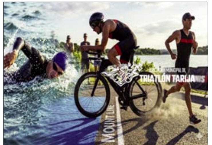
LOS TRIATLETAS DE LA CAPITAL COMPETIRÁN ESTE FIN DE SEMANA. (FOTO: ARCHIVO).

Los atletas podrán hacerlo mediante sus clubes, mientras que aquellos que no pertenezcan a ninguno podrán inscribirse de forma directa. Las inscripciones se realizarán mediante los clubes ante el comité organizador, hasta las 18:00 horas del día Jueves 26 de marzo de 2026