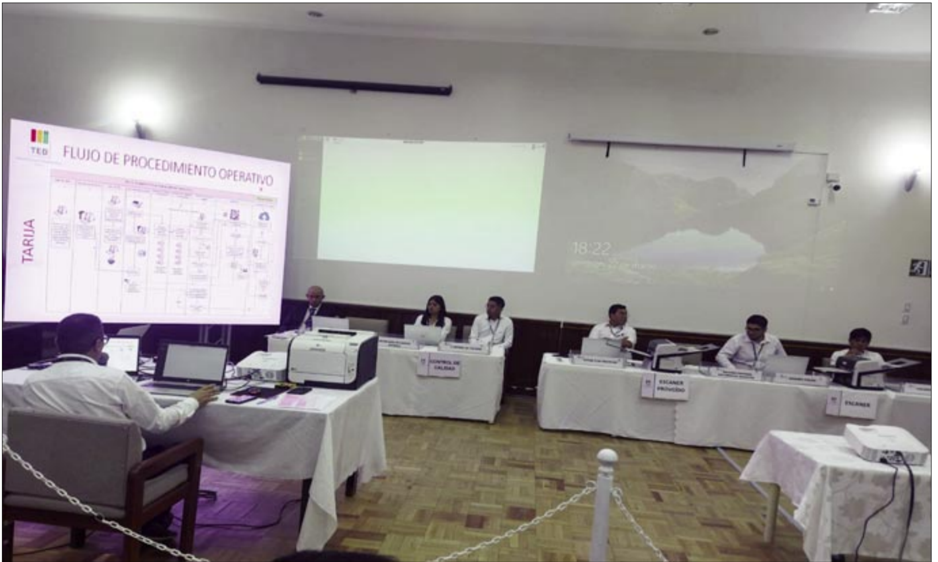
EL TED ASÍ INICIÓ EL RECUENTO OFICIAL DE VOTOS, DE LA ELECCIÓN SUBNACIONAL.