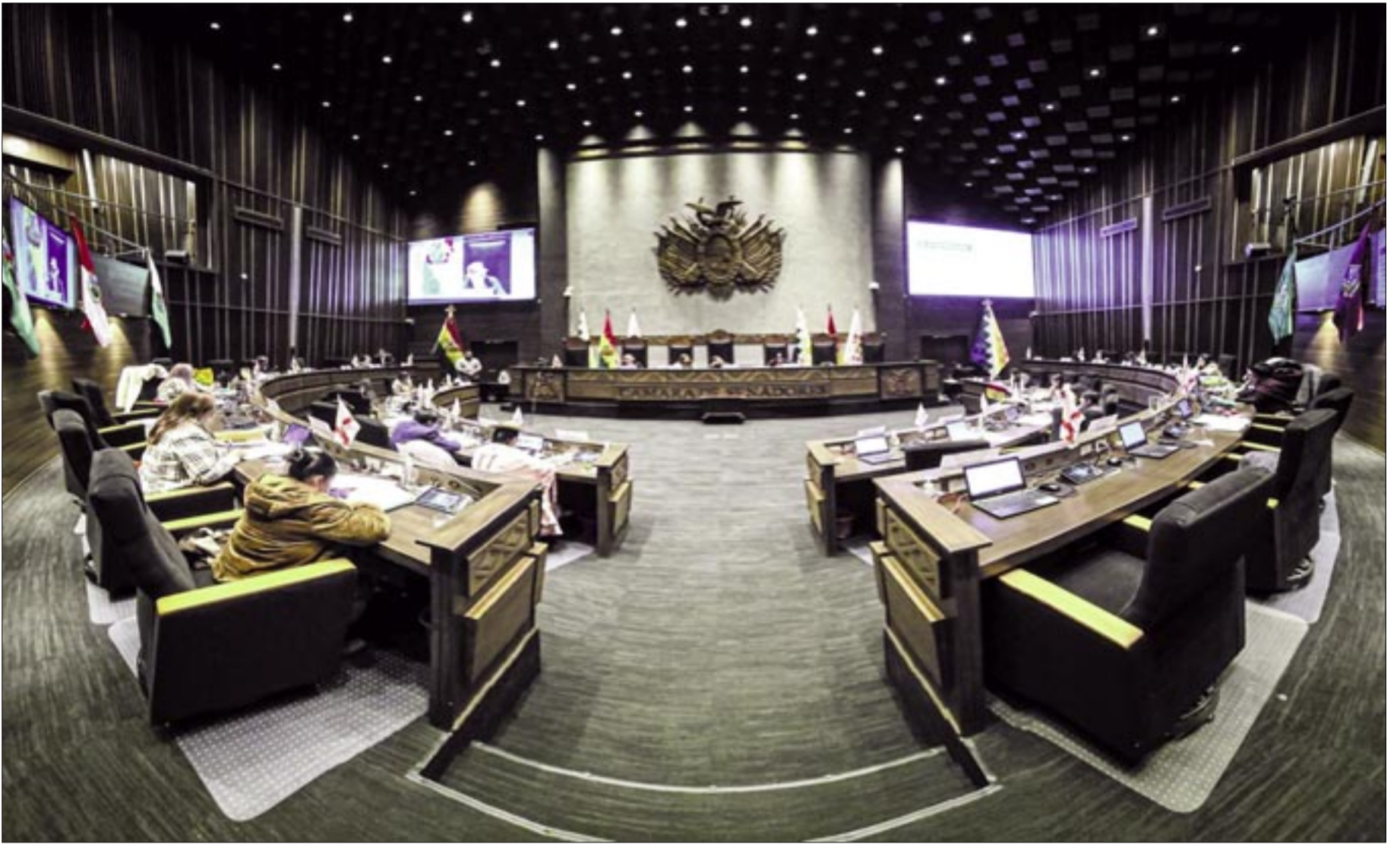
SENADO TRATARÁ PAQUETE DE LEYES QUE ENVÍE EL EJECUTIVO

Distribuirán recursos, pero también obligaciones