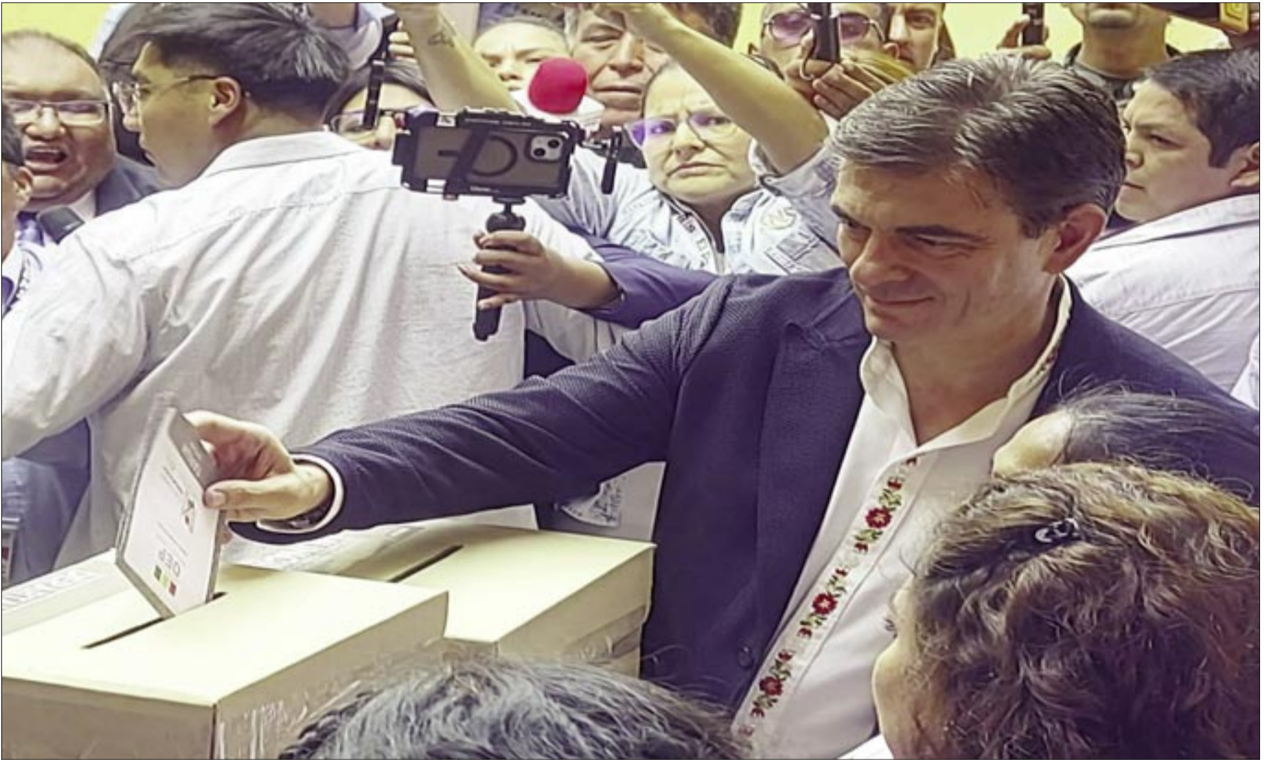
EL PRESIDENTE, RODRIGO PAZ PEREIRA, ASÍ VOTÓ PARA GOBERNADOR Y ALCALDE.