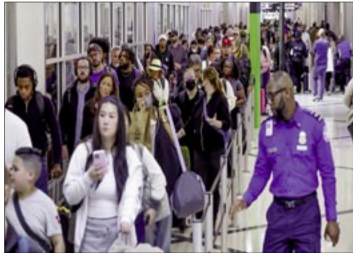
PASAJEROS HAN TENIDO QUE FORMARSE POR VARIAS HORAS PARA CRUZAR LOS CONTROLES DE SEGURIDAD EN VARIOS AEROPUERTOS DE EEUU

En grandes aeropuertos, como los de Nueva York, Atlanta y Houston, la ausencia ha llegado hasta el 40%. Pero en otros aero-