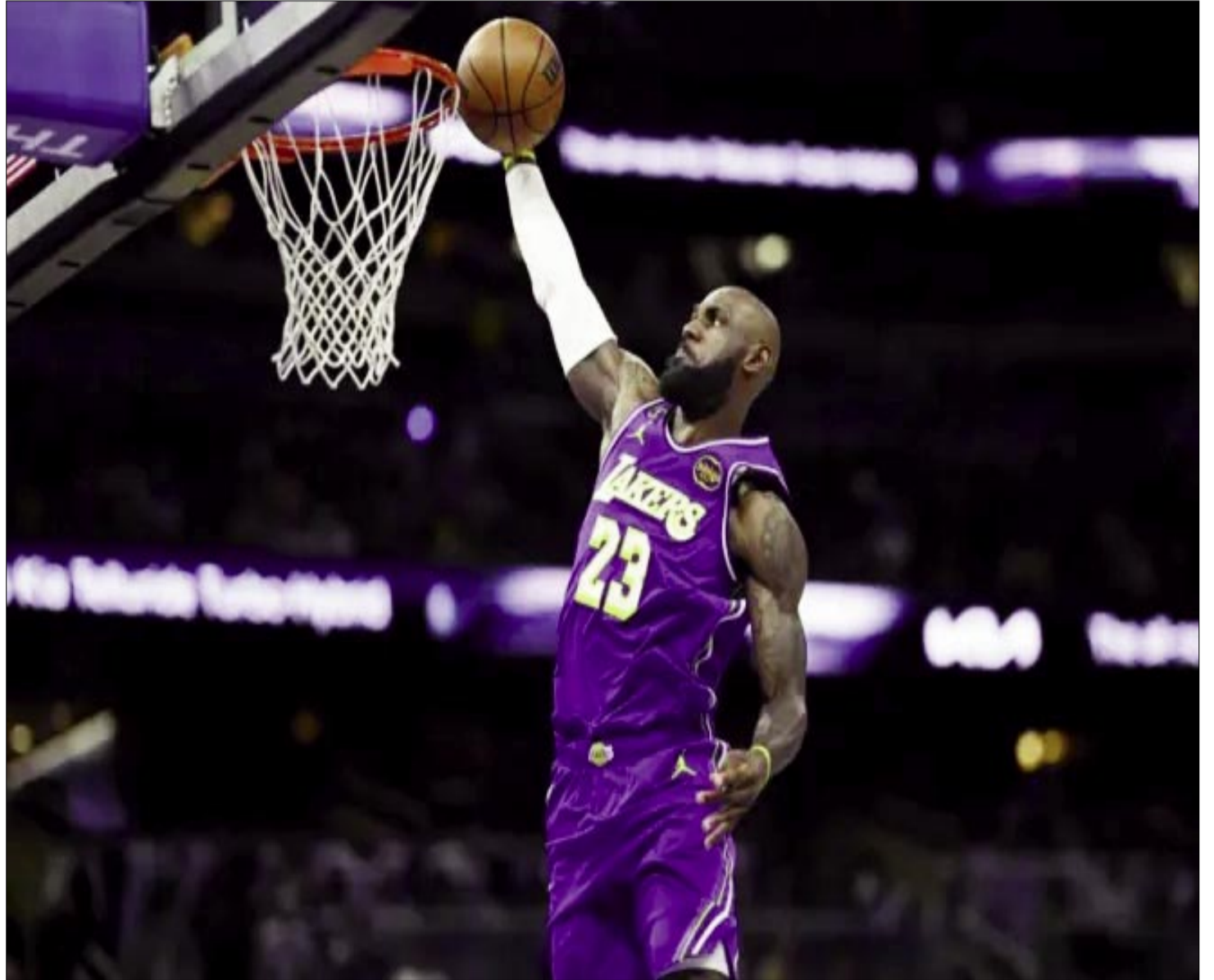
LEBRON JAMES MACHACA EN LA PRIMERA ACCIÓN DE SU PARTIDO 1.612 COMO PROFESIONAL.

Con el de hoy, además, ha alcanzado los 469 partidos con la camiseta de la franquicia angelina. Antes de llegar en 2018, ya lle-