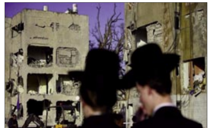
LUEGO DEL ATAQUE CONTRA DIMONA, AL MENOS 100 PERSONAS RESULTARON HERIDAS LA NOCHE DEL SÁBADO

Ante este ultimátum del presidente estadounidense, la respuesta iraní no se ha hecho esperar. Los responsables de la Guardia Revolucionaria han afirmado que, en caso de ataque contra las centrales eléctricas iraníes, todas las instalaciones de desalinización de las monarquías árabes del Golfo Pérsico serán blanco de ataques inmediatos.