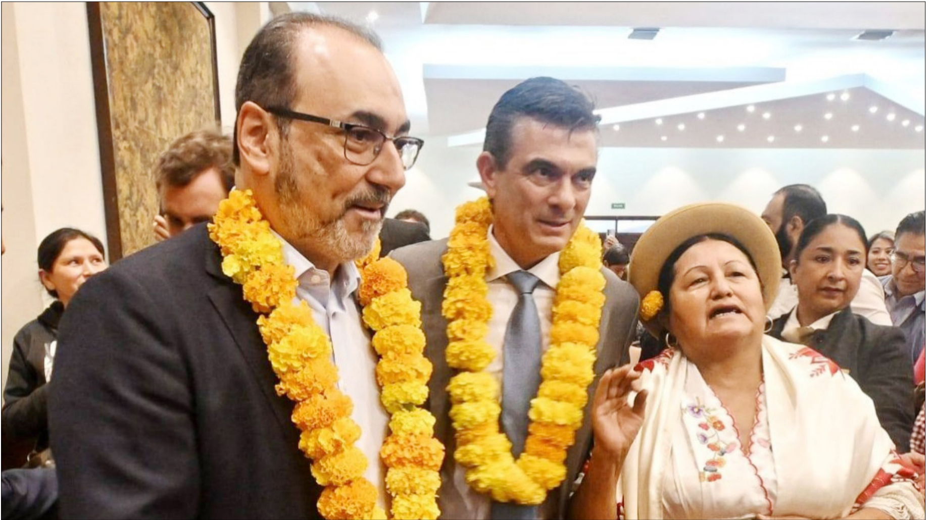
CRÉDITO DE LA CAF PARA PLANTA DE TRATAMIENTO, EMPEZARÁ A TRATARSE POR LOS PARLAMENTARIOS.