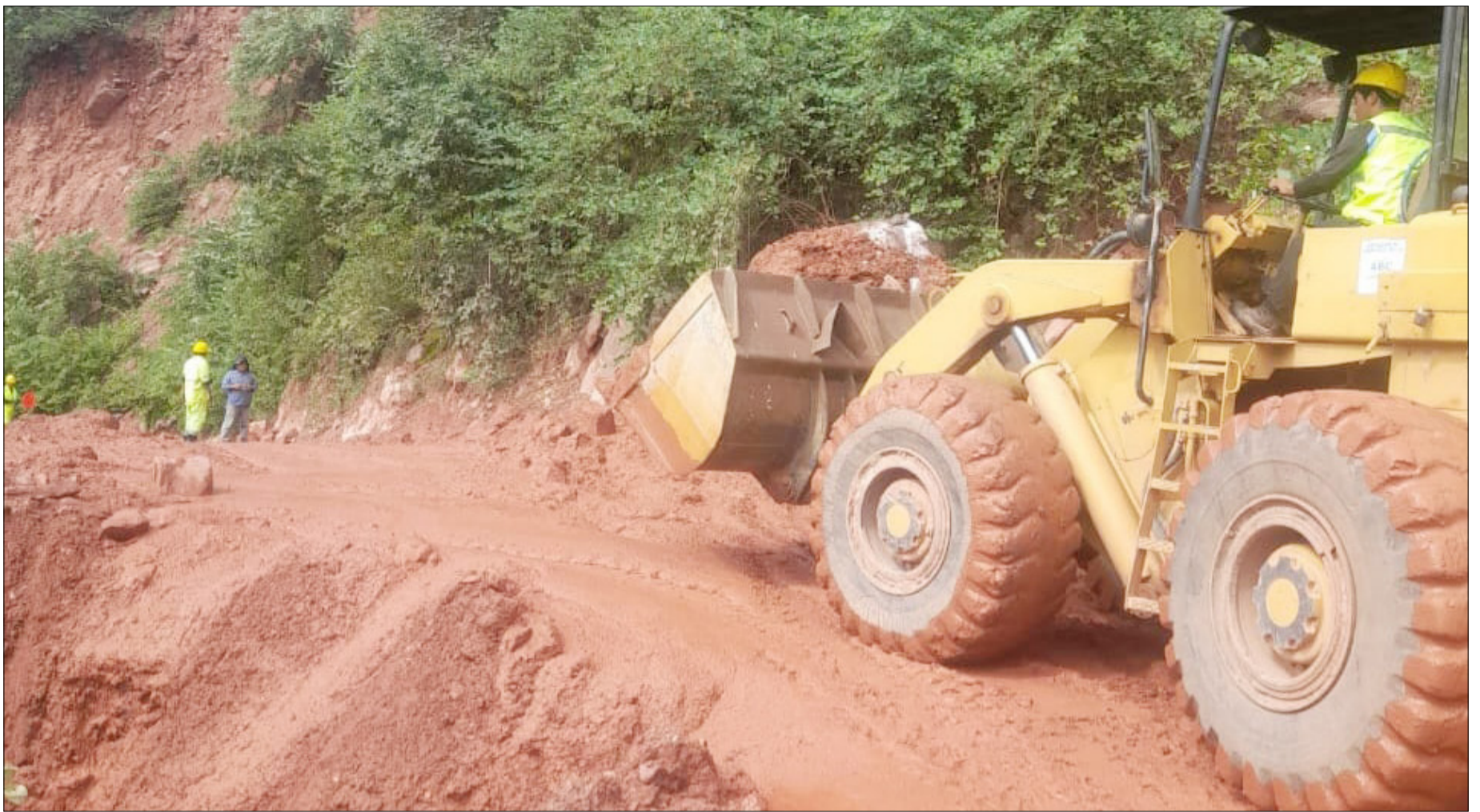
EL CAMINO AL CHACO CONTINÚA CON PROBLEMAS POR FALTA DE RECURSOS.

La ABC entiende, pero no comparte la posición