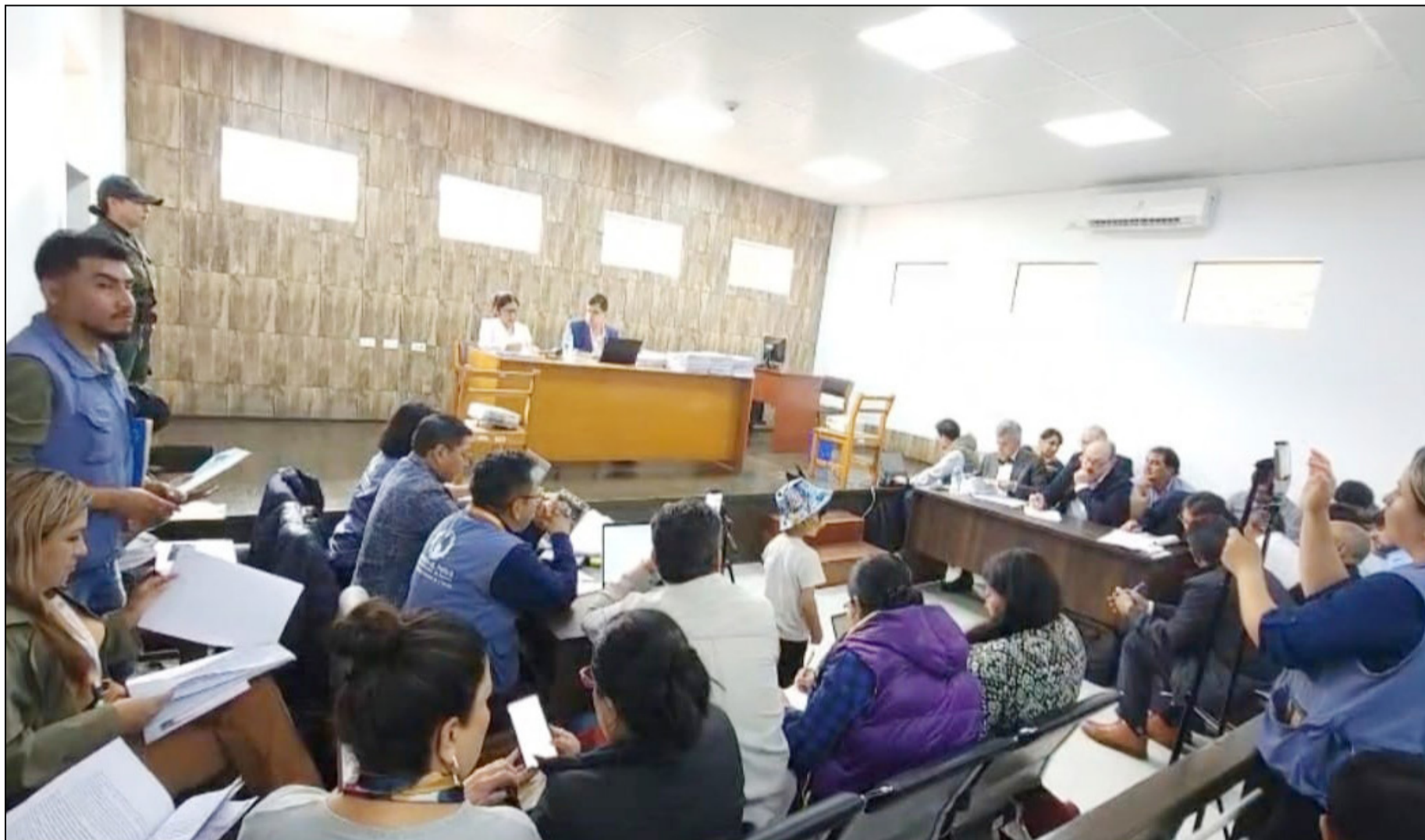
EN ESTA AUDIENCIA SE SUPO DE UN RECURSO DE COMPULSA PLANTEADO POR EL GOBIERNO.

La autoridad judicial de Entre Ríos, tiene un plazo de 24 horas para enviar toda la documentación de lo obrado hasta ahora, a esa instancia superior, se informó.