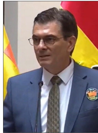
EL PRESIDENTE RODRIGO PAZ DURANTE LA PRESENTACIÓN DEL DECRETO.

La norma dispone además la elaboración de un Ranking de Simplificación Regulatoria, que evaluará periódicamente a las instituciones públicas en función de la reducción de cargas administrativas y la eficiencia en sus servicios.