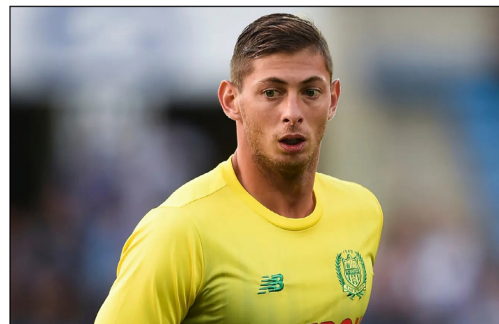
EMILIANO SALA. CON EL NANTES EN 2019