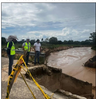
LA ESTATAL ABC NO CUENTA CON LOS RECURSOS PARA EL MANTENIMIENTO DE VÍAS

“Para mantener los 18.120 kilómetros de la red vial fundamental se necesitan más de 1.000 millones de bolivianos al