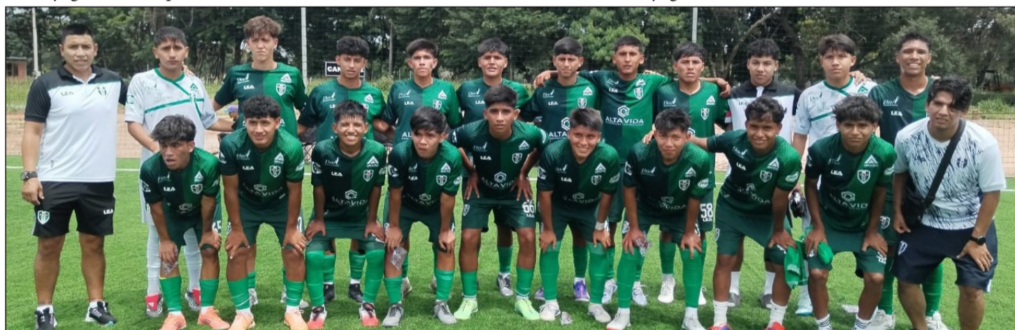
LOS JUGADORES DE REAL TOMAYAPO, CUMPLIERON EL PRIMER OBJETIVO. (FOTO: TOMAYAPO).