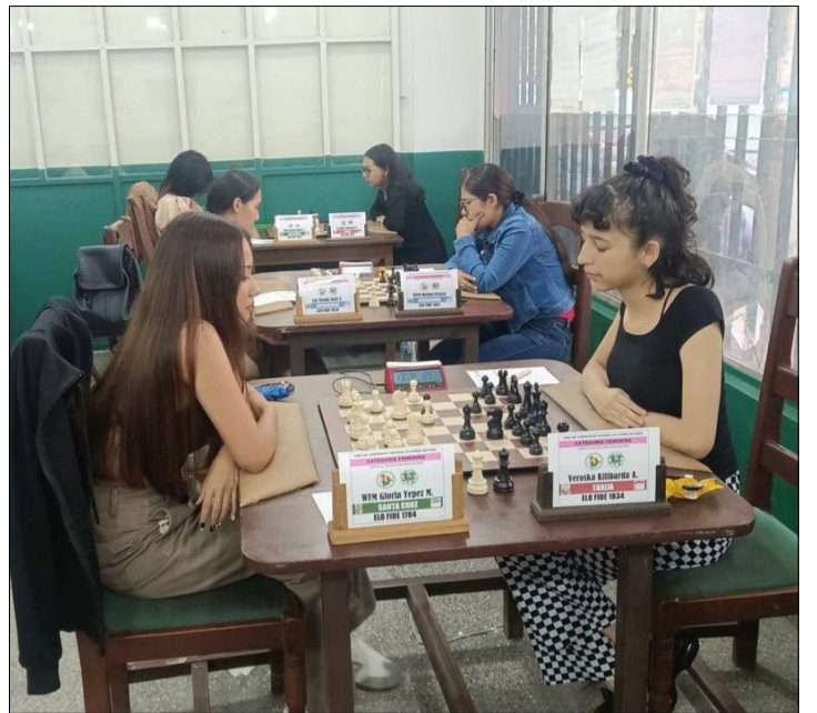
UNA DE LAS PARTIDAS QUE JUGÓ LA CHAPACA KILIBARDA.

del campeonato nacional mayores femenino; la chapaca cuenta con un ELO internacional de 1834 y su ELO FIDE es de 58,8 producto de los resultados que logró durante los torneos en los que participó, ahora le queda continuar preparándose para representar de buena manera a Bolivia y a Tarija en la XLVI Olimpiada Mundial de Ajedrez se llevará a cabo en Samarcanda, Uzbekistán.