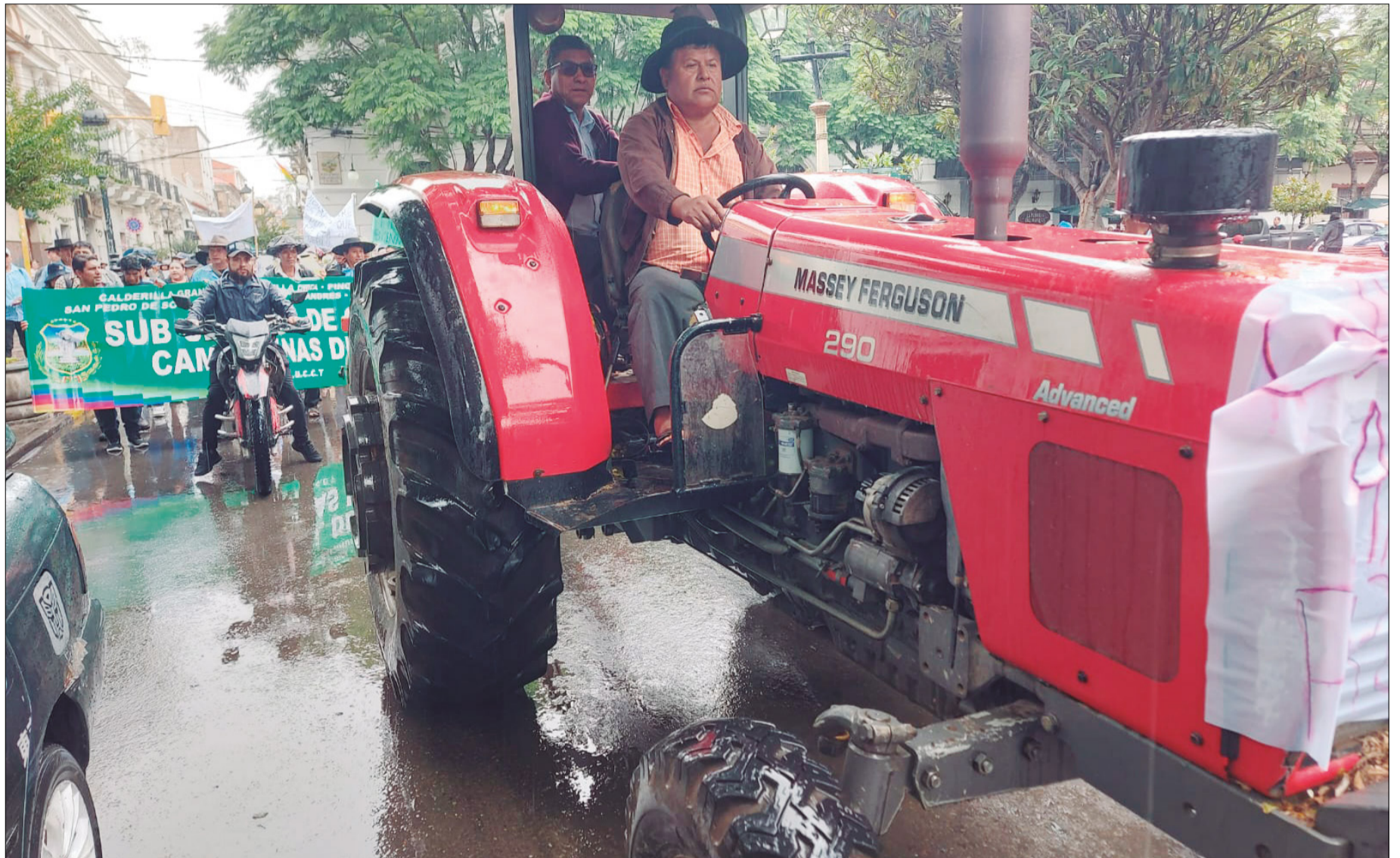
MARCHA CAMPESINA DE RECHAZO A ALGUNAS POLÍTICAS DE GOBIERNO.