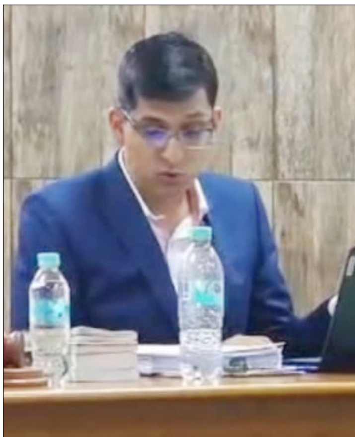
JUEZ AGROAMBIENTAL DE ENTRE RÍOS, FUE APARTADO DEL CASO.

Se conoció la notificación, este lunes, del Tribunal Agroambiental al Ministerio de Hidrocarburos y a la Pro-