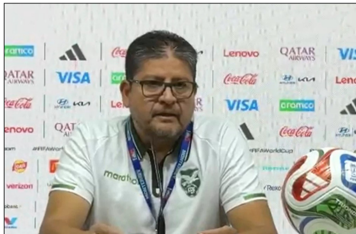
EL SELECCIONADOR BOLIVIANO DURANTE LA CONFERENCIA.

Bolivia buscará hacer historia y volver a la Copa del Mundo 32 años después. El partido empieza desde las 23:00.