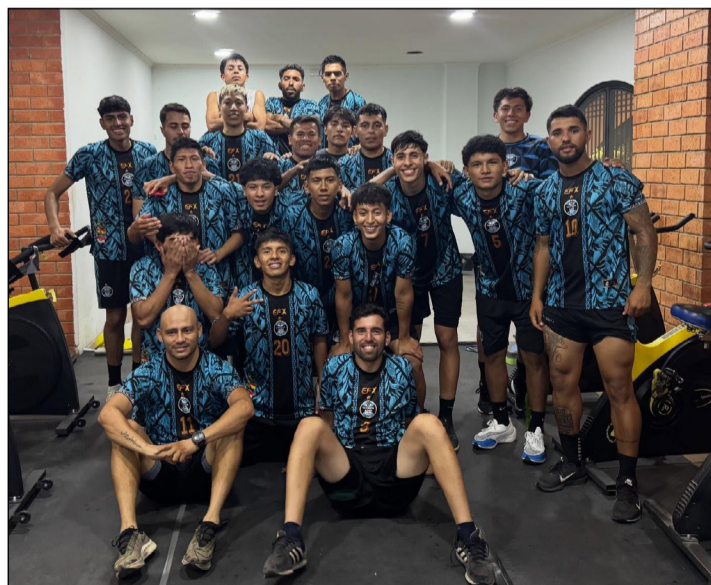
JUGADORES DESPUÉS DE LA SESIÓN DE GIMNASIO..

Cata, indicó que todos los jugadores del plantel están habilitados para el primer partido, los dirigentes del club ya realizaron todos los trámites para la habilitación, ahora solo queda ultimar los detalles técnicos; hasta el momento, el rendimiento es positivo, durante las últimas