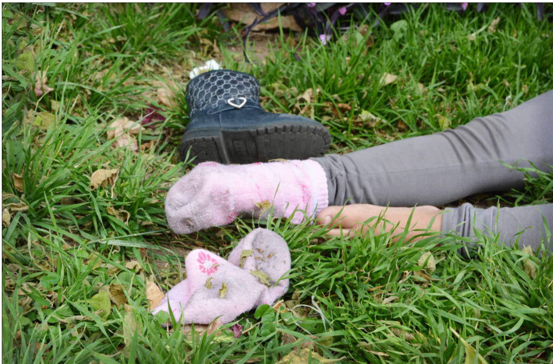
MINISTERIO PÚBLICO INVESTIGA UN INFANTICIDIO Y UNA AUTOELIMINACIÓN.

También hubo un grave accidente de tránsito