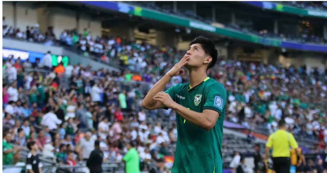
TERCEROS CELEBRANDO SU GOL ANTE SURINAM, TANTO QUE LE DIO LA VICTORIA A LA VERDE.