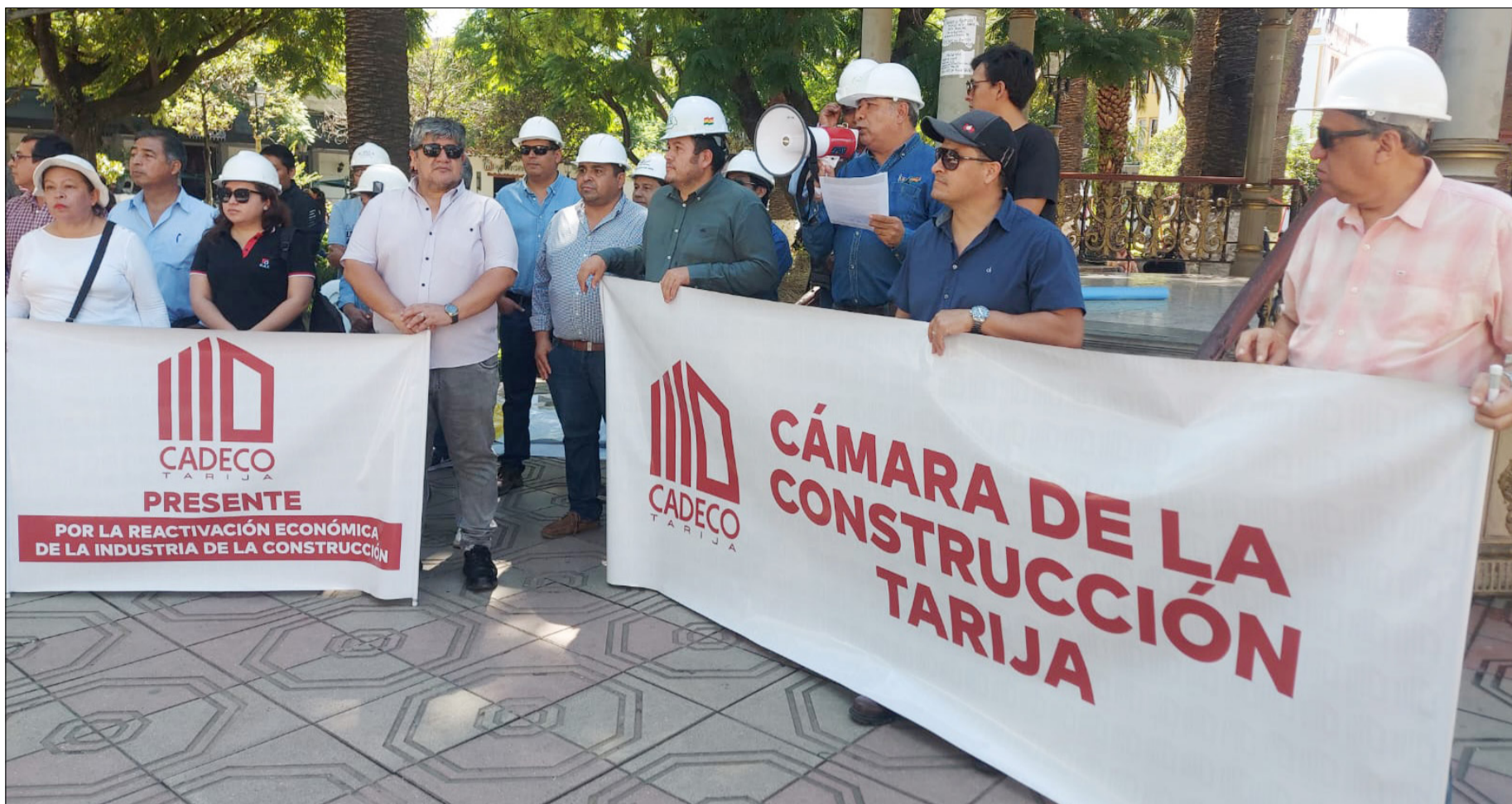
DE ESTA MANERA SE MOVILIZARON PARA LOGRAR EL DECRETO DE REAJUSTE DE PRECIOS.