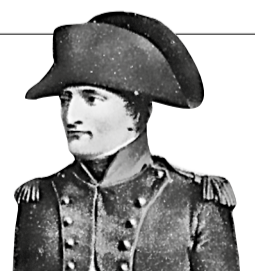
Napoleón I 1769-1821. Napoleón Bonaparte. Emperador francés.

“Cada uno de los movimientos de todos los individuos se realizan por tres únicas razones: por honor, por dinero o por amor...”