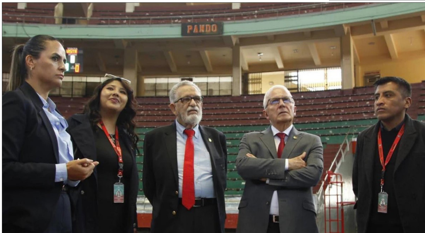
PERSONAL DE ODEBO EN LA VISITA AL COLISEO JULIO BORELLI EN LA PAZ.

Añadió que el jueves llegará el documento oficial de la Odebo. “La Paz es sede. No se olviden que esta postulación no hubiera sido posible sin actua-