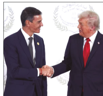
TRUMP Y SÁNCHEZ EN UNA CUMBRE EN EGIPTO

“Desde el primer momento se le trasladó clarísimamente al Ejército americano y a las fuerzas americanas y por lo tanto ni se autorizan las bases y por supuesto tampoco se autoriza la utilización del espacio aéreo español para actuaciones que tengan que ver con la guerra en Irán”, dijo Robles a periodistas.