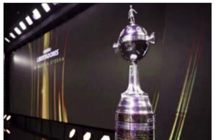
EL SORTEO SE REALIZARÁ EN LUQUE, PARAGUAY.

Mientras tanto, The Strongest, que inició su participación desde la primera fase preliminar, quedó eliminado por Deportivo Táchira, quedando fuera de la competencia continental en esta edición