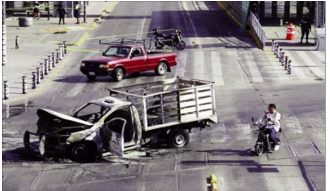
LA SECRETARÍA DE LA DEFENSA NACIONAL DE MÉXICO CONFIRMÓ ESTE DOMINGO EL ABATIMIENTO DE NEMESIO RUBÉN OSEGUERA CERVANTES, ALIAS EL MENCHO

Tras el operativo y en reacción del grupo criminal, se registraron diversos bloqueos y quema de vehículos y negocios en Jalisco y en otros es-