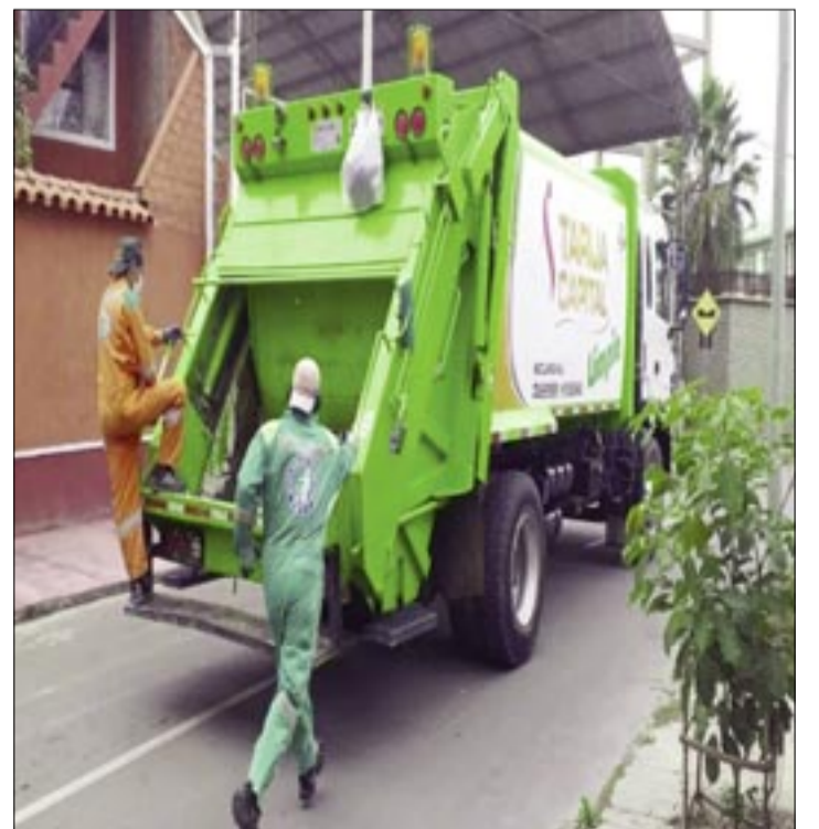
EMAT ENCARGADA DEL RECOJO DE LA BASURA

que tiene que recoger, a diario, unas 250 toneladas de basura de la ciudad y alrededores.