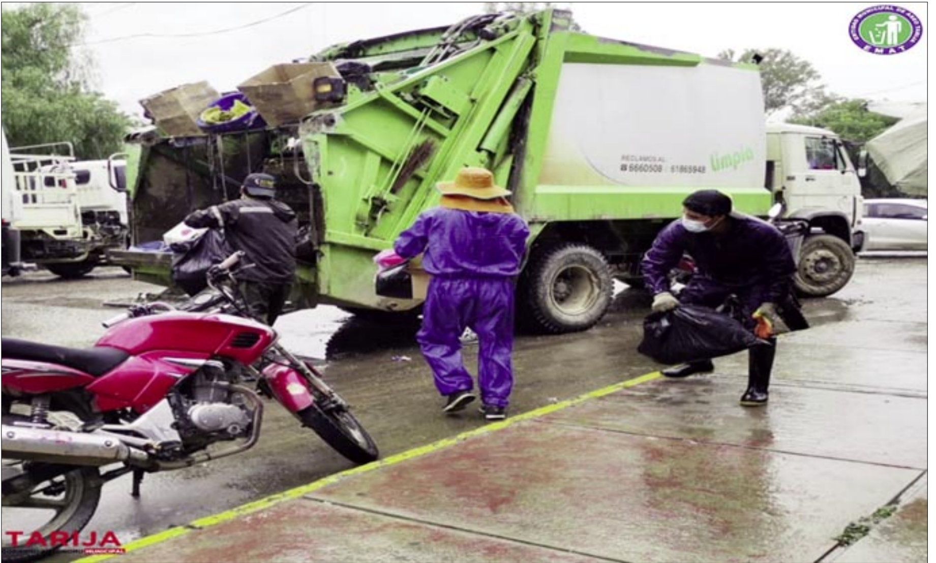
EMAT TENDRÁ NUEVO EQUIPAMIENTO DESDE ESTE LUNES

Pidieron participar a autoridades y dirigentes