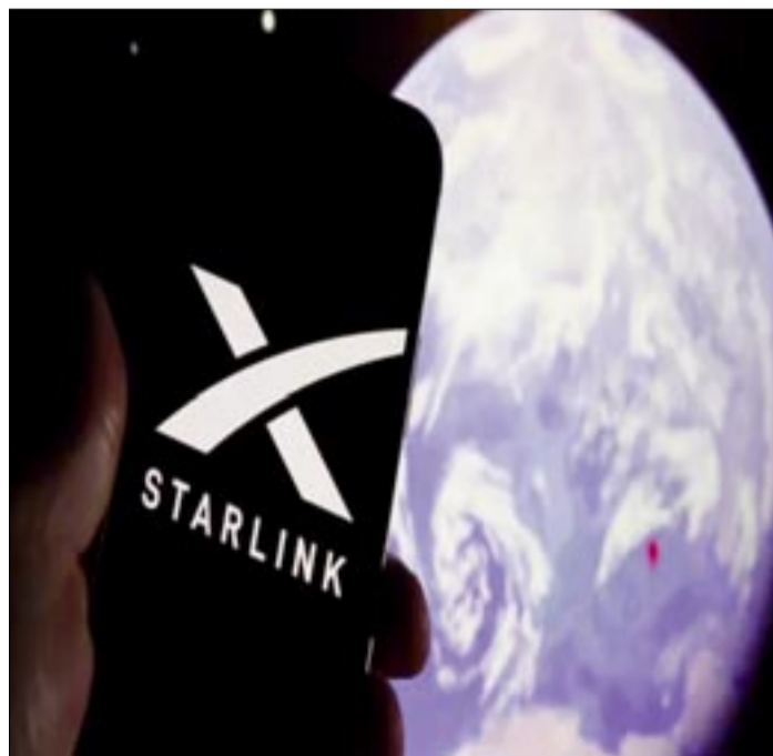
LA LLEGADA DE ESTE SERVICIO BUSCA MEJORAR LA COBERTURA DEL INTERNET, SEGÚN EL GOBIERNO