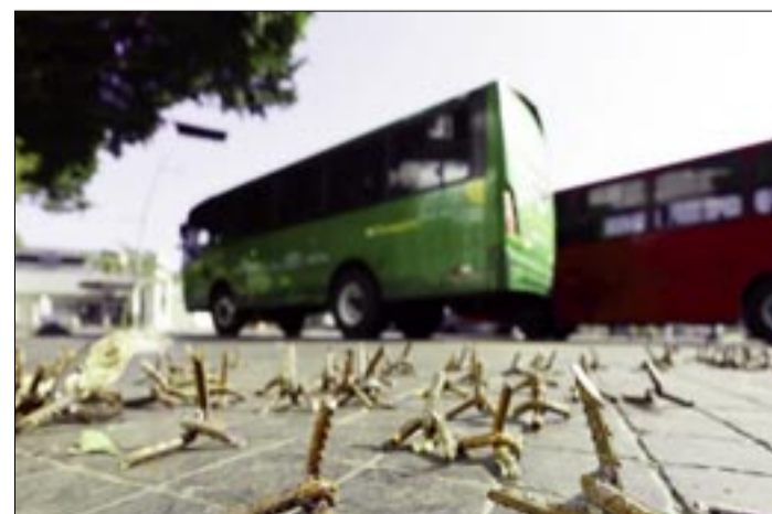
EL LÍDER DEL CARTEL DE JALISCO FUE ABATIDO DURANTE UN OPERATIVO EN TAPALPA, 130 KILÓMETROS AL SUR DE GUADALAJARA, CAPITAL DE JALISCO

Asimismo, precisó que no se han registrado incidentes al interior del aeropuerto ni existe riesgo para pasajeros, colaboradores o visitantes, luego de que en redes sociales circularan videos de personas corriendo para resguardarse en el aeropuerto. El GAP indicó que el material que circula en redes sociales no corresponde a hechos dentro de la terminal aérea, sino a "psicosis presentada entre los pasajeros, lo que ha generado percepciones que no reflejan la situación real en los aeropuertos".