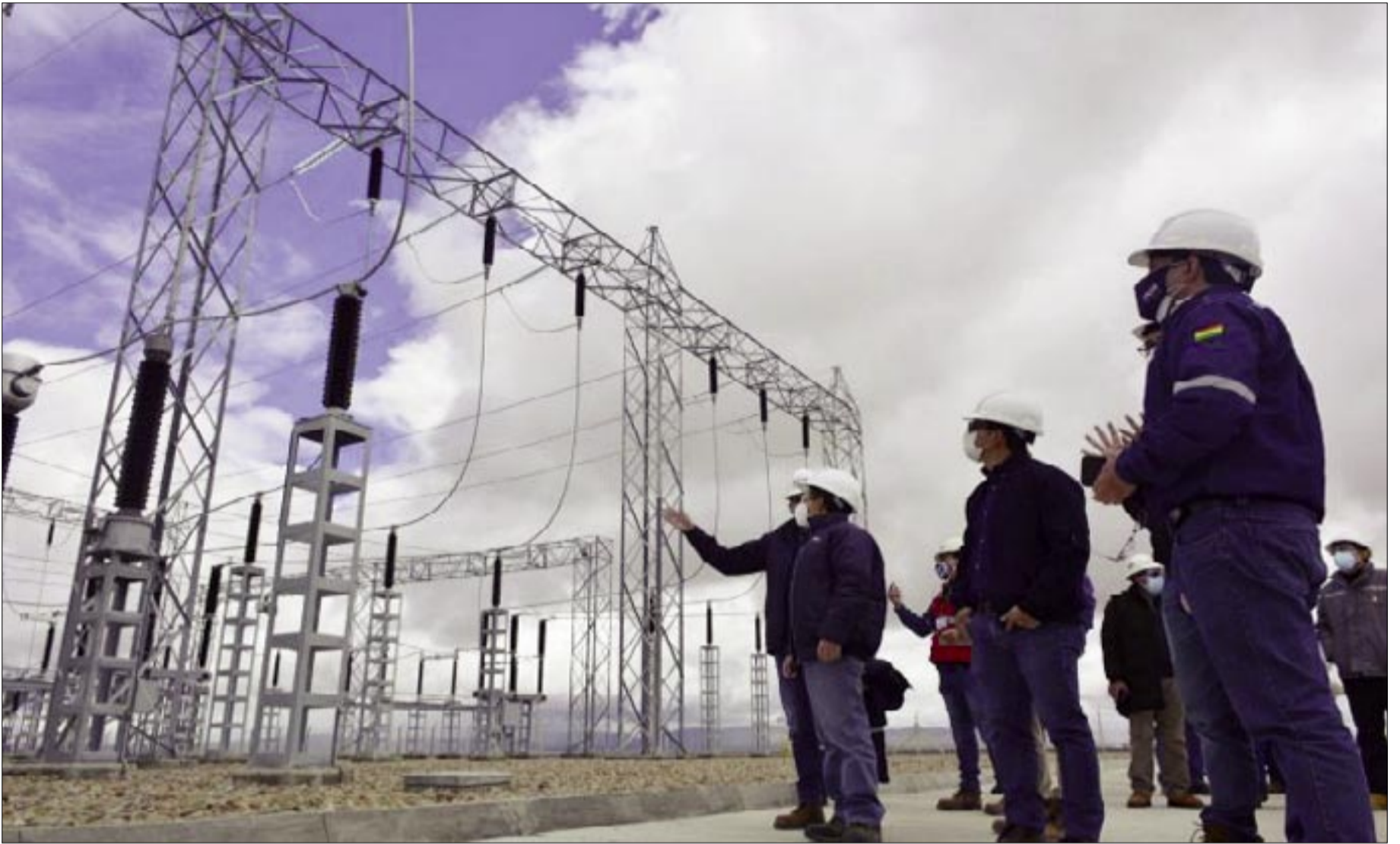
LA GENERACIÓN ELÉCTRICA EN BOLIVIA ESTÁ EN RIESGO.

El tiempo pasa y no hay acciones para evitar el