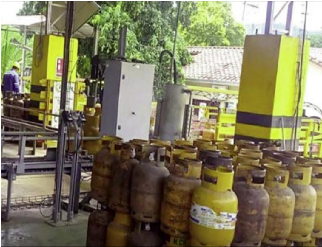
UNA PLANTA DE DISTRIBUCIÓN DE GLP. / FOTO: ANH.

El decreto también establece que su implementación no implicará recursos adicionales del Tesoro General de la Nación, por lo que no generará gasto extra para el Estado.