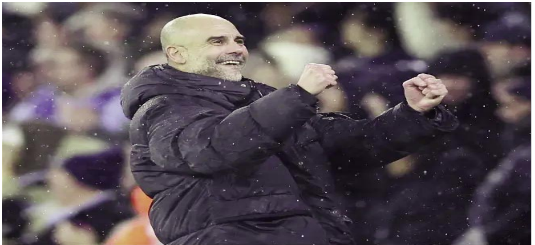
PEP GUARDIOLA, DURANTE UN PARTIDO CON EL MANCHESTER CITY