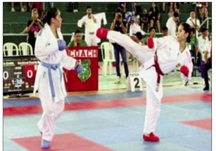
UN EVENTO PASADO DE LA DISCIPLINA, EN EL PAÍS. FEBOKA

Se prevé que para el domingo, a las 13.00, concluya la concentración tras el almuerzo.