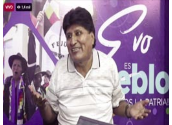
EVO MORALES.

se habla de los hechos de corrupción registrados durante la gestión de la expresidenta Jeanine Áñez y mencionó versiones según las cuales la detención de Luis Arce Catacora habría sido acordada con el Gobierno para evitar procesos contra sus hijos.