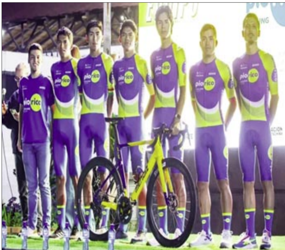
PIO RICO CYCLING TEAM DE COCHABAMBA, COMPETIRÁ EN LA VUELTA A TARIJA.