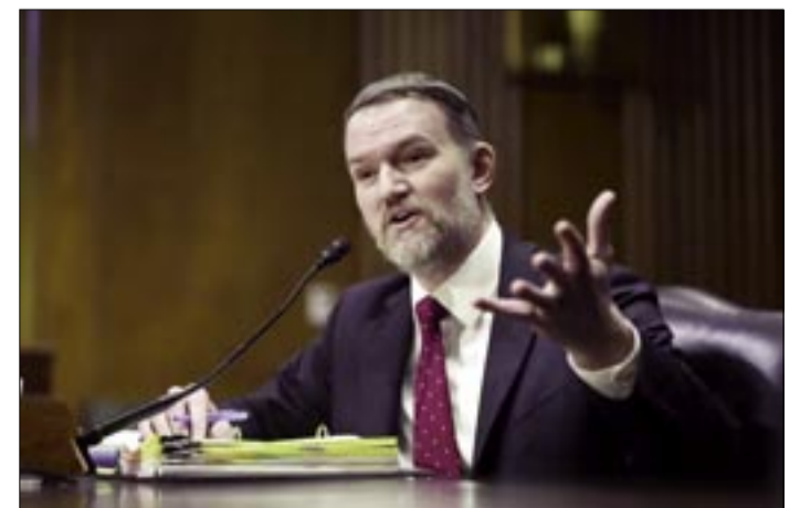
EL REPRESENTANTE COMERCIAL DE ESTADOS UNIDOS, JAMIESON GREER.

La Comisión Europea (CE) advirtió este domingo que no aceptará ningún aumento en los aranceles acordados hace meses con Washington. Bruselas le exigió que respete el acuerdo comercial firmado por Trump y la presidenta de la CE, Ursula von der Leyen, por el que el bloque aceptó un arancel del 15% para los productos europeos mientras bajaba el gravamen a algunos estadounidenses "AGENCIAS/LA NACION//