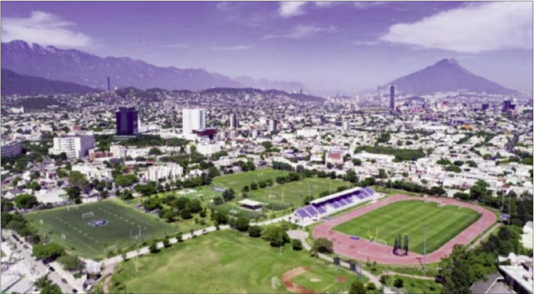
TOMA AÉREA DEL CENTRO DEPORTIVO DEL TECNOLÓGICO MONTERREY.