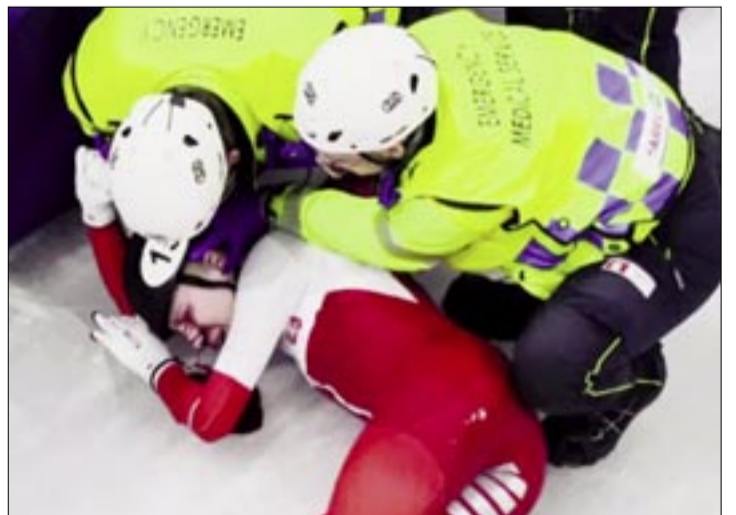
LA PATINADORA POLACA ES ATENDIDA POR LOS SERVICIOS DE EMERGENCIA

Horas más tarde, Sellier publicó una foto en Instagram con un mensaje en el que agradece los mensajes que ha recibido: "Sé que algún día esta foto me recordará que soy más fuerte de lo que creo. Gracias por todas las amables palabras de apoyo y hacerme saber que lo estoy haciendo bastante bien"