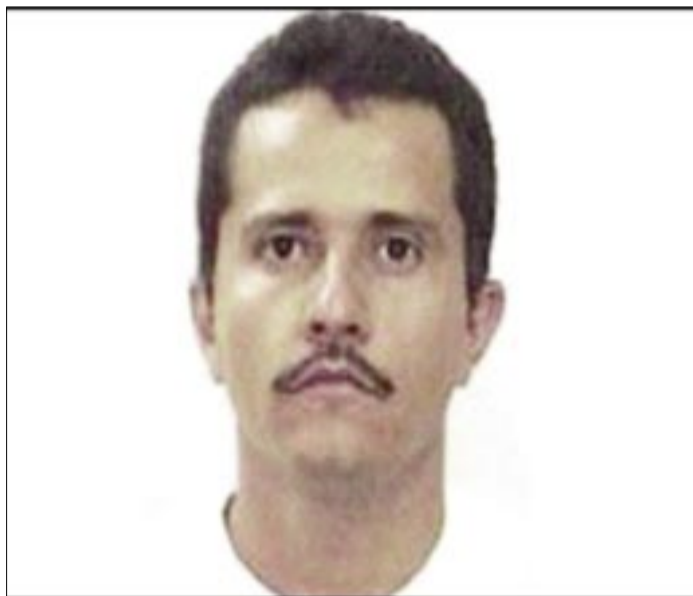
EL NARCOTRAFICANTE MEXICANO NEMESIO OSEGUERA CERVANTES FUE ABATIDO EN UN OPERATIVO MILITAR

A su regreso a México ingresó a las filas de la policía de un muni-