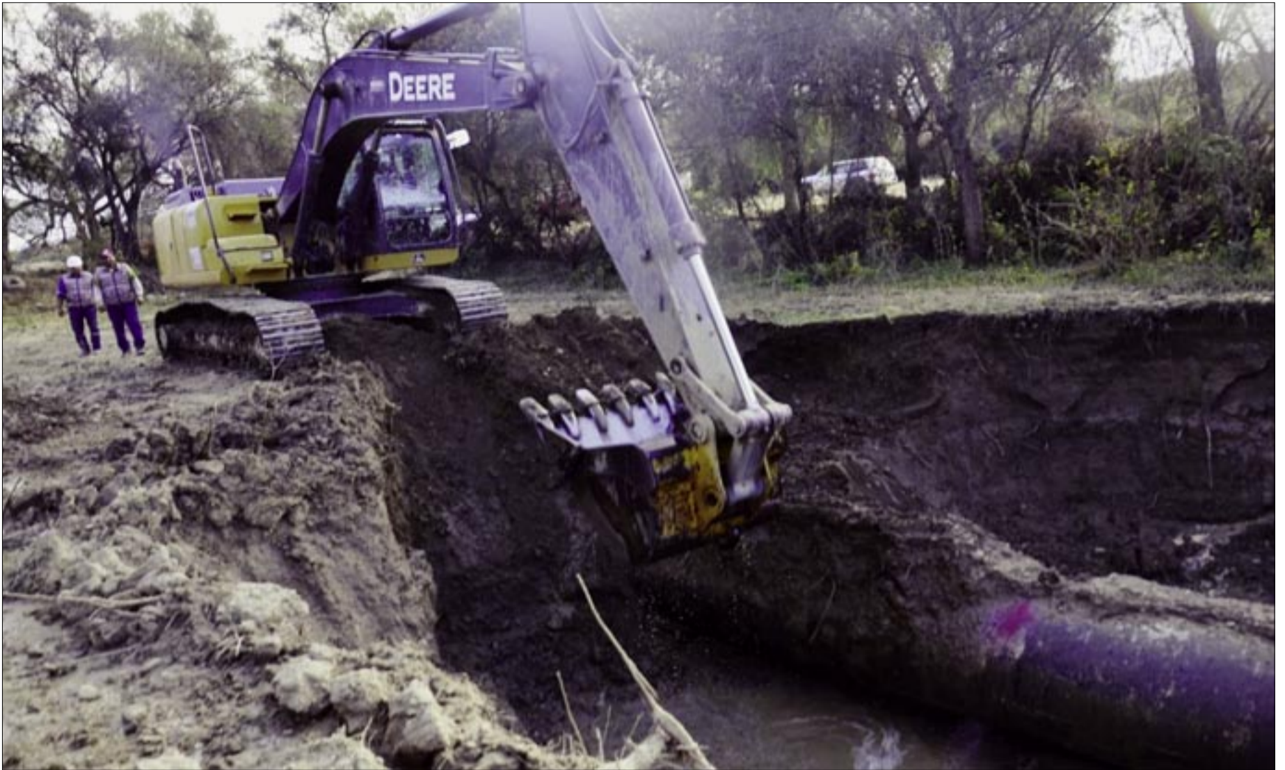
REGANTES ESPERAN CAMBIAR Y AMPLIAR TUBERÍA PRINCIPAL DE SAN JACINTO