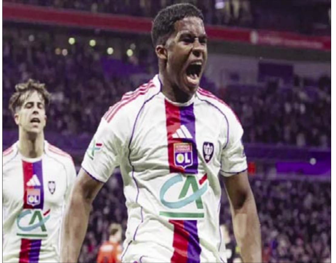
ENDRICK TRAS MARCAR UN GOL CON EL LYON.

Para Endrick, el Lyon ha sido también un refugio espiritual, un lugar donde puede centrarse en el balón y menos en los contratos publicitarios o las cámaras que lo persiguen en cada esquina de la Castellana. Nace el 'Matador': Una película de acción en el área. En las gradas de Lyon ya le han puesto nombre a su nueva pesadilla favorita para las defensas rivales: 'Matador'. Lejos de rehuir el apodo, Endrick lo ha abrazado con un entusiasmo que roza lo cinematográfico. El