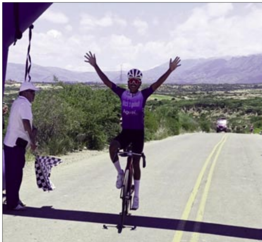
LOS CICLISTAS DE LA CAPITAL CHAPACA SE PREPARAN PARA LA CARRERA.

Asociación Municipal de Ciclismo de Cercado