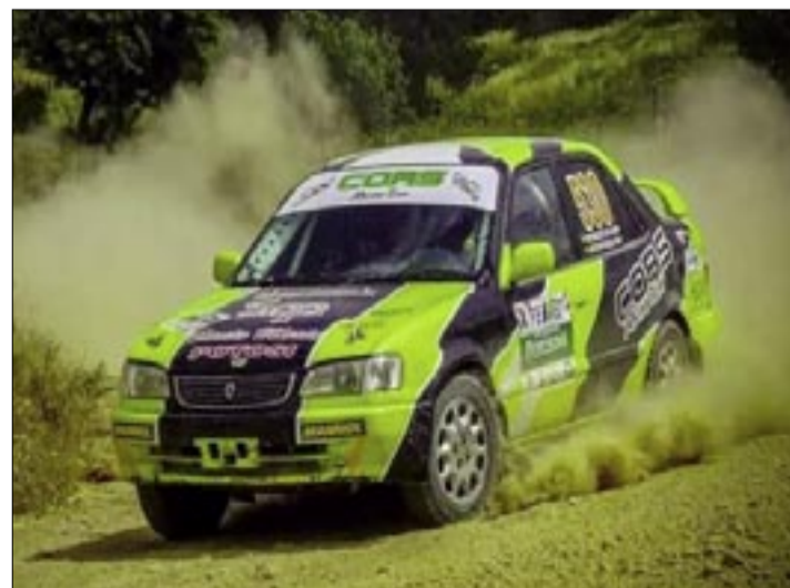
LOS PILOTOS TARIJEÑOS PREPARAN SUS BÓLIDOS PARA LAS PRIMERAS CARRERAS DEL AÑO.

El Rally Andaluz se correrá por las rutas de las provincias de Avilés, Cercado y Méndez, en el transcurso de los siguientes días las autoridades de cada región realizaran los trabajos de mantenimiento de los caminos por donde se desarrollará la competencia nacional