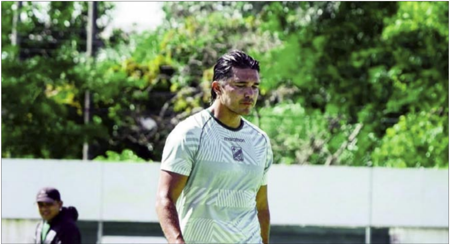
MARTINS EN UN ENTRENAMIENTO CON ORIENTE.