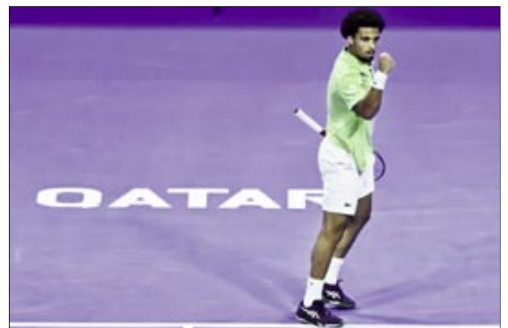
FILS LEVANTA EL PUÑO.

Se precipitó en su vuelta en Toronto (ganó un partido a Pablo Carreño) y tuvo que parar después hasta este mes de febrero.