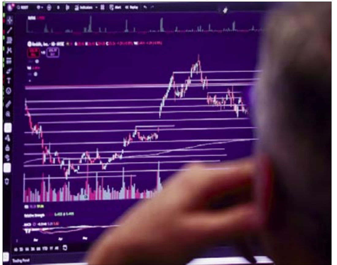
CUÁLES SON LOS PRINCIPALES RIESGOS PARA LOS BONOS SOBERANOS DE LATINOAMÉRICA EN 2026

uniforme; los países con marcos institucionales fuertes y disciplina fiscal (como Chile o Uruguay) se diferenciarán claramente de aquellos con desequilibrios crecientes.