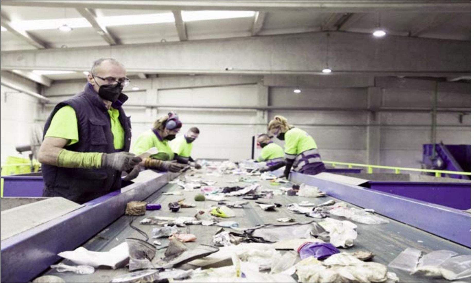
ALCALDÍA PROYECTA RECICLAR LA BASURA DENTRO DE POCO

La meta ideal es llegar a “cero” residuos