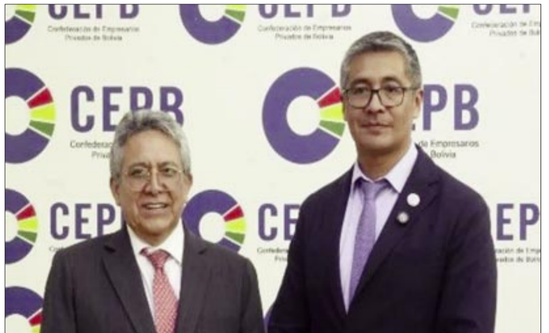
EL MINISTRO DE ECONOMÍA Y FINANZAS PÚBLICAS, JOSÉ GABRIEL ESPINOZA SOSTUVO QUE EL PAÍS ENFRENTA EL DESAFÍO DE ESTABILIZAR LA BALANZA DE PAGOS, REORDENAR LOS MERCADOS Y RECONSTRUIR LAS BASES PRODUCTIVAS EN UN NUEVO ENTORNO INTERNACIONAL.

miso de mantener un canal de diálogo permanente entre el gobierno y el sector empresarial a través de las instancias institucionales, con la seguridad de que la coordinación público-privada es fundamental para superar la crisis, recuperar la confianza y construir una economía más competitiva, ordenada y sostenible para todos los bolivianos.