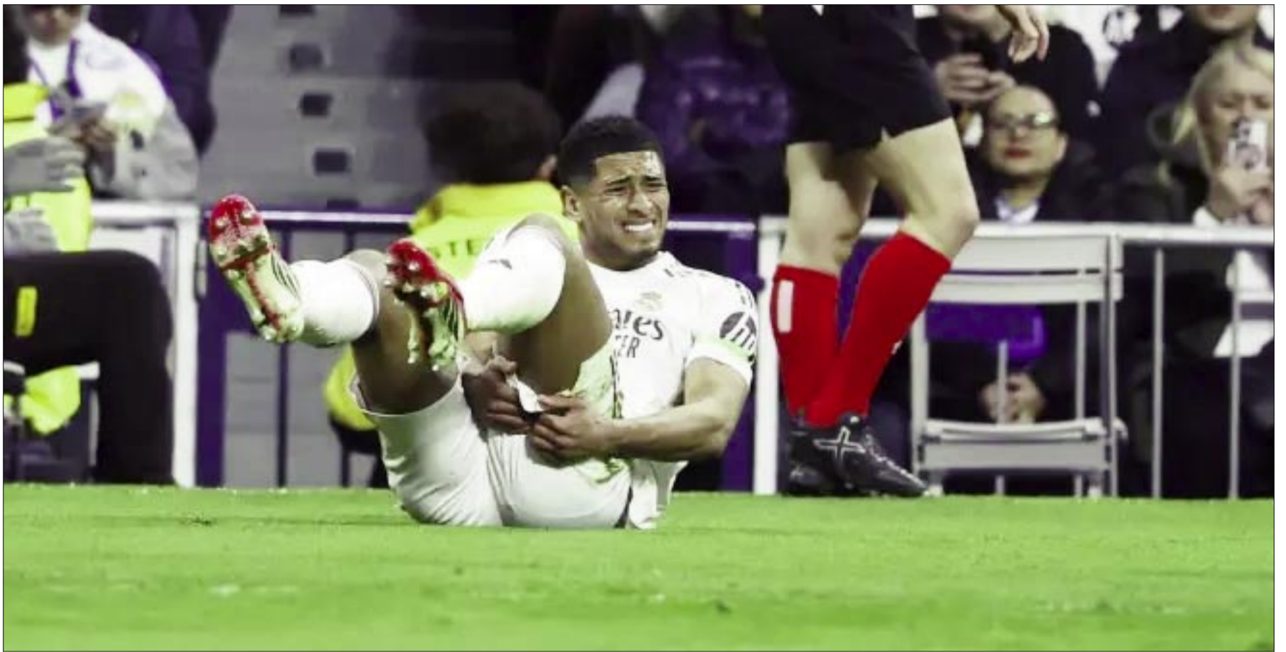
MOMENTO EXACTO DE LA LESIÓN DE BELLINGHAM.