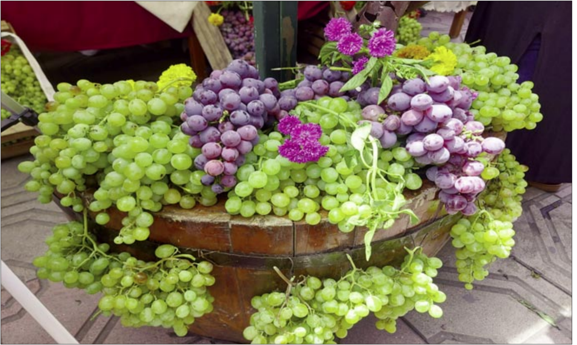
SÓLO EL 20% DE LA UVA QUEDA POR COSECHAR

Habrà poca vid en la fiesta de la vendimia