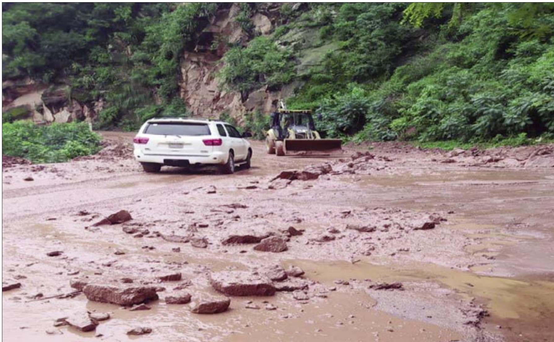
LA ABC BUSCA RESOLVER EL PROBLEMA RÍO ISIRI-LA CENTRAL

Para que el trayecto no esté dejado y abandonado