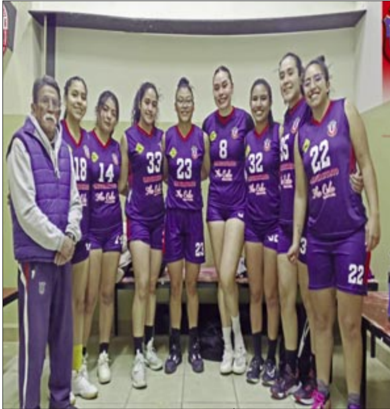
JUGADORAS DE LA U, VAN POR EL TÍTULO DEL TORNEO LOCAL 2025. (FOTO: ARCHIVO).