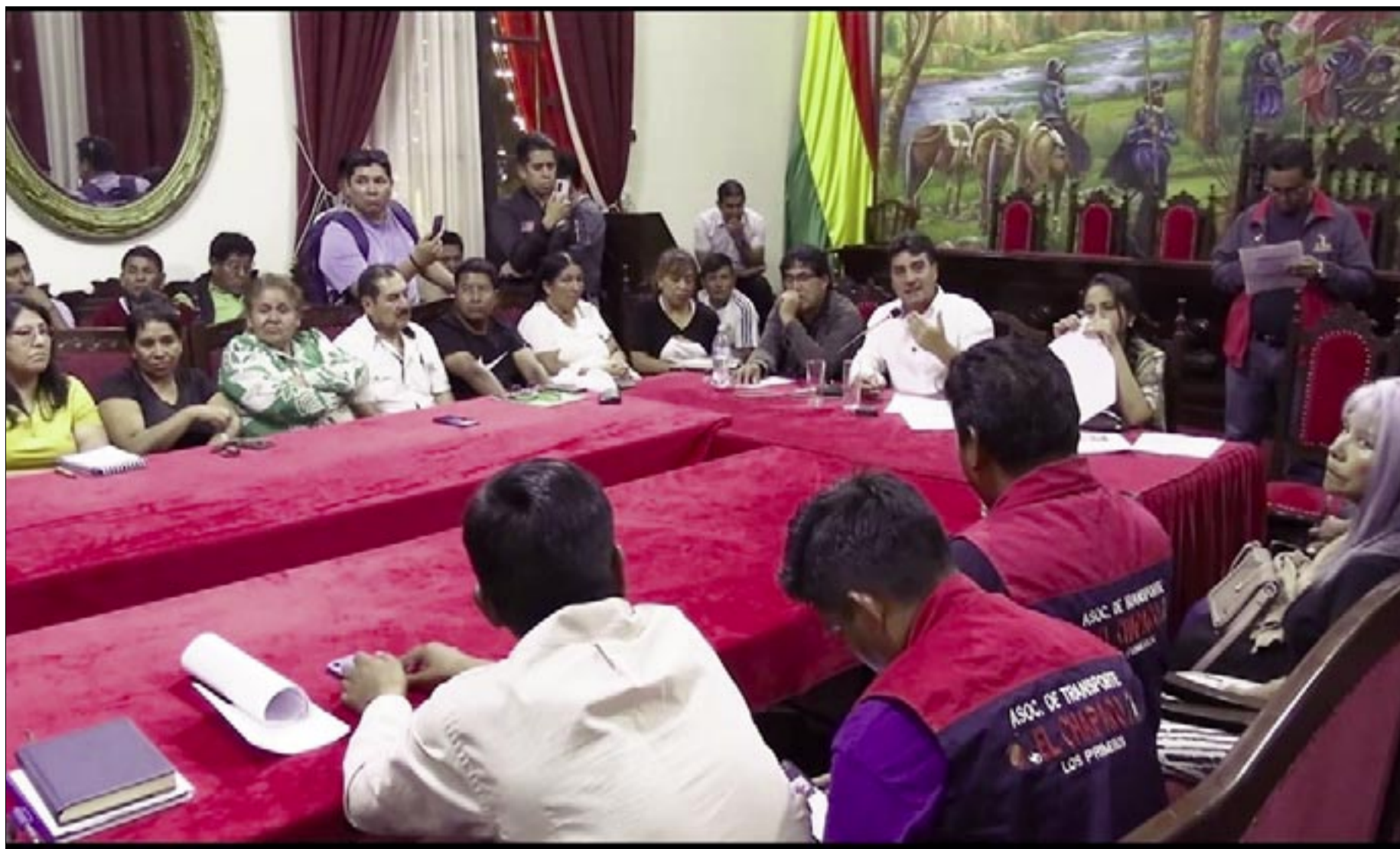
DIRIGENTES VECINALES ESPERAN DEFINIR PRONTO LAS TARIFAS DEL TRANSPORTE PÚBLICO.

Las actuales son transitorias, eventuales