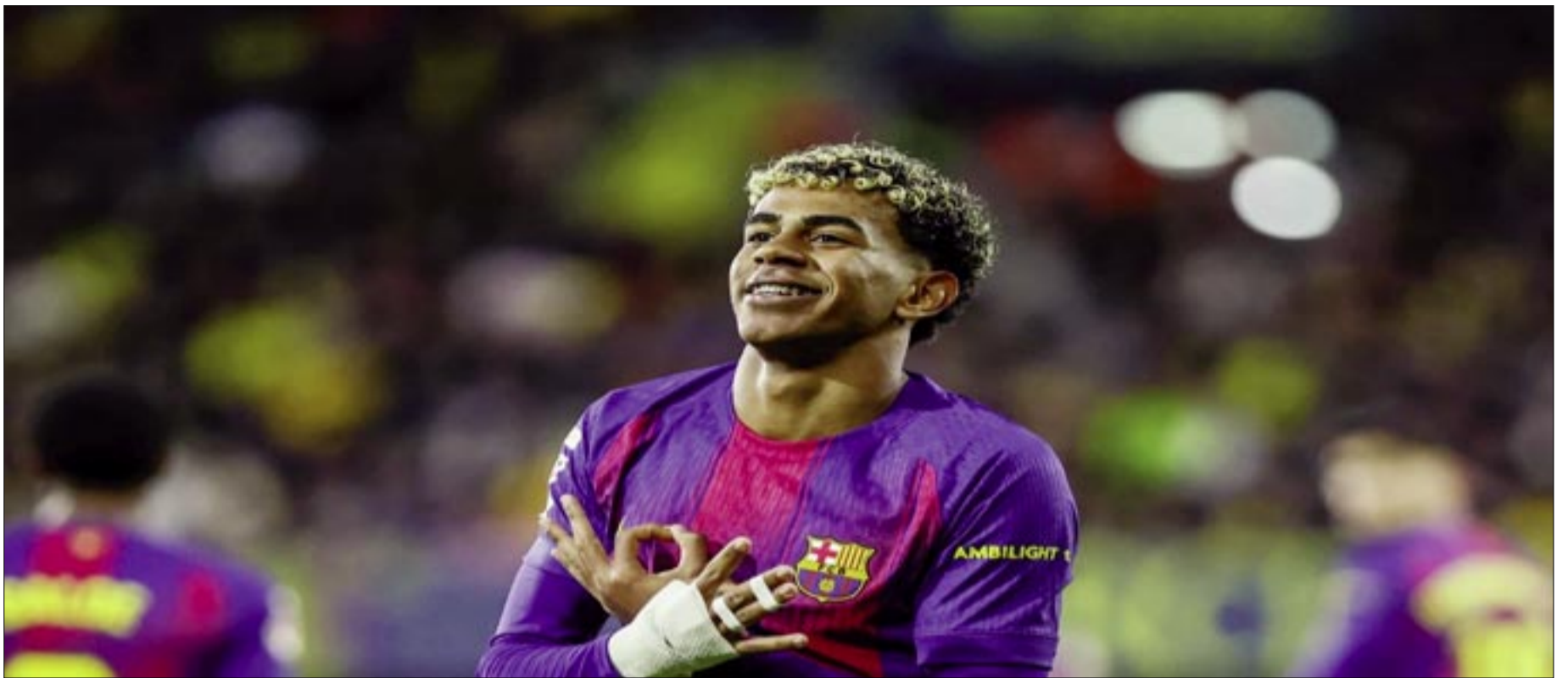
EL EQUIPO AZULGRANA SE IMPUSO POR 0-2 CON GOLES DE RAPHINHA Y LAMINE YAMAL