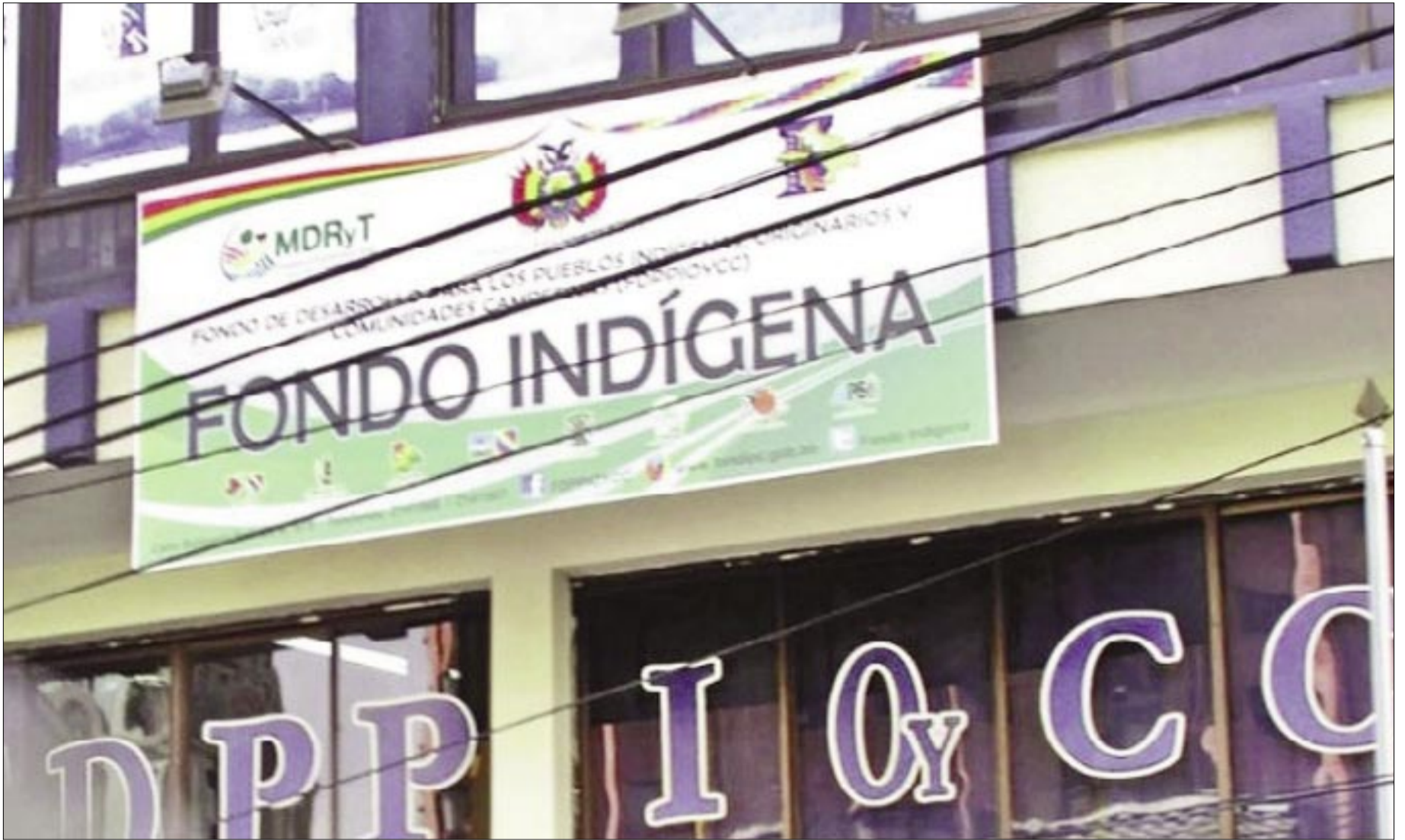
EL CASO FONDIOC SE REFIERE A UN DESFALCO MILLONARIO

Gobierno investiga todo lo relativo a esta entidad