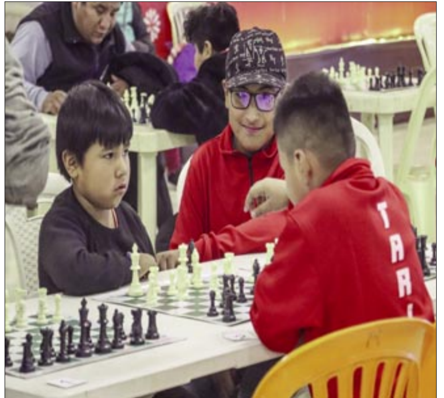
LOS NIÑOS SE PREPARAN PARA COMPETIR EN EL SELECTIVO NACIONAL. (FOTO: ARCHIVO).