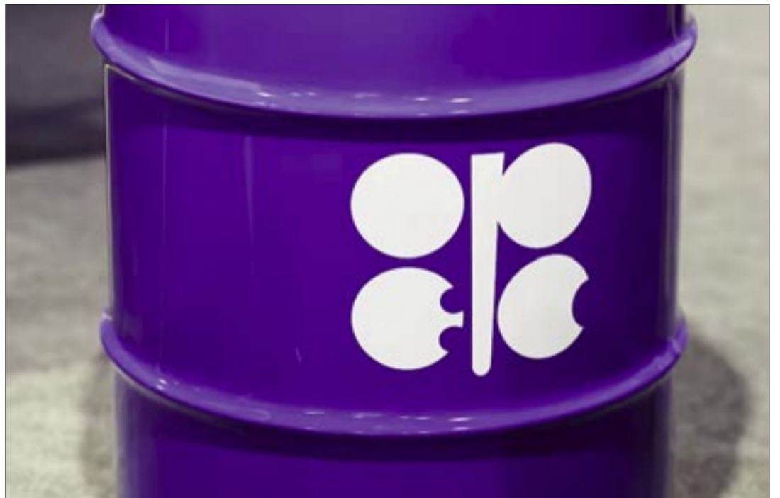
OPEP+ REAFIRMA SU PLAN DE MANTENER ESTABLE EL FLUJO DE PETRÓLEO EN MEDIO DE LAS TENSIONES. UN BIDÓN DE PETRÓLEO CON LA MARCA DE LA ORGANIZACIÓN DE PAÍSES EXPORTADORES DE PETRÓLEO (OPEP) EN LA CONFERENCIA CLIMÁTICA COP29 CELEBRADA EN BAKU, AZERBAIYÁN, EL MIÉRCOLES 13 DE NOVIEMBRE DE 2024

Antes de la pausa actual, la OPEP+ había acordado restablecer parte de la producción interrumpida desde 2023, pero los volúmenes añadidos han sido menores de los anunciados ya que algunos países enfrentan dificultades para elevar su bombeo.