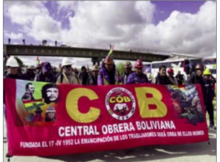
SEGUNDO DÍA DE MARCHA DE LA COB.

El dirigente minero remarcó que la medida de presión no tiene un carácter político-partidario y cuestionó los intentos de "desvirtuar" la protesta atribuyéndole un tinte partidario. Afirmó que la movi-