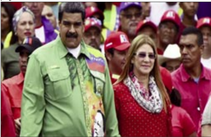
NICOLÁS MADURO Y SU ESPOSA, HOY CAPTURADOS POR EL GOBIERNO DE ESTADOS UNIDOS, URGENTE.

Desde el punto de vista judicial, la audiencia de este lunes no implica aún un juicio ni una evaluación de pruebas, sino el inicio formal del proceso con el acusado presente. A partir de allí, la fiscalía deberá detallar los cargos, la defensa podrá plantear objeciones preliminares y el juez decidirá sobre cuestiones clave como la detención preventiva, el calendario procesal y las condiciones de acceso a la evidencia.