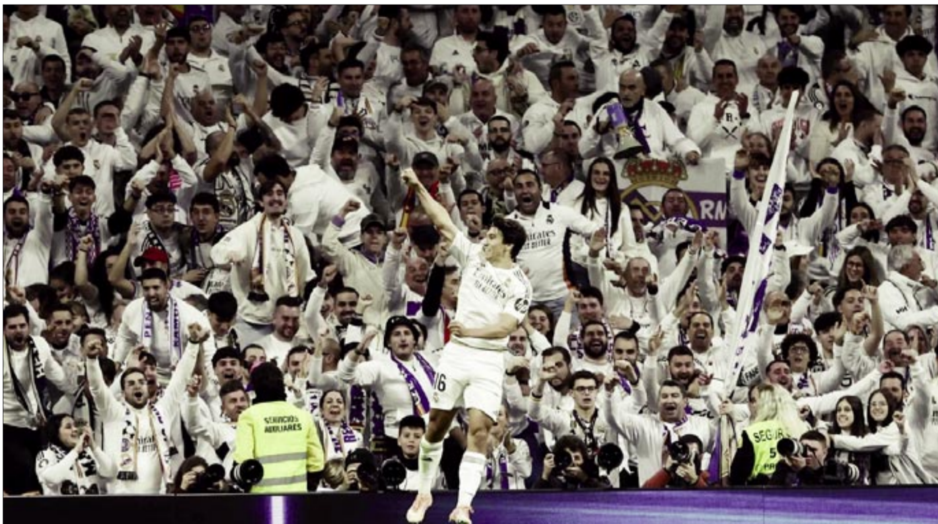
MANUEL PELLEGRINI, DURANTE EL PARTIDO FRENTE AL GETAFE EN EL ESTADIO LA CARTUJA.