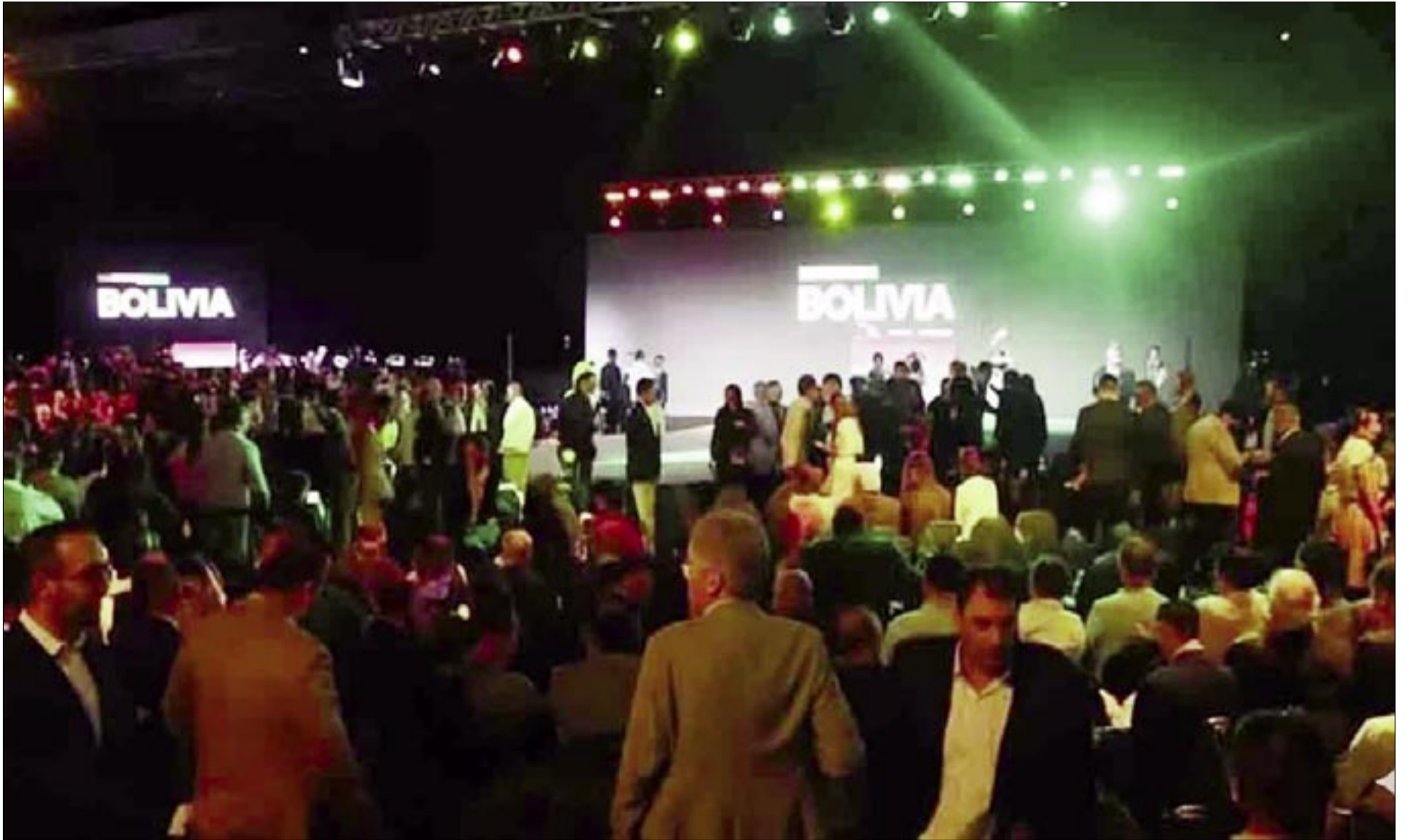
SECTORES PRODUCTIVOS CONSIDERAN NECESARIA UNA NUEVA LEY DE INVERSIONES.

Los parlamentarios tendrán que manifestarse