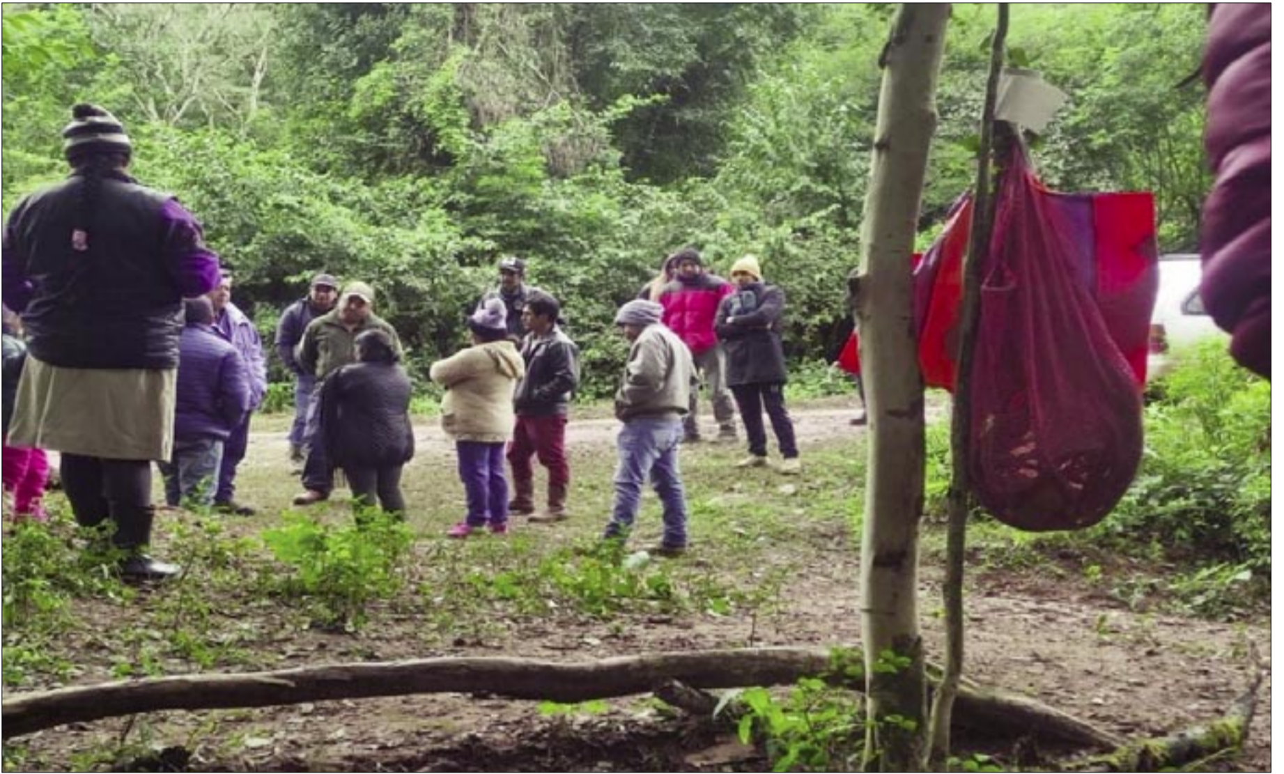
CHIQUIAQUEÑOS NO DEJARON VIGILIA NI EN NAVIDAD NI AÑO NUEVO

Se trata en sí del bloque San Telmo Norte