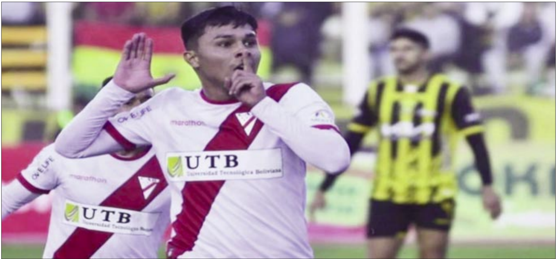
EL HISTÓRICO EQUIPO LILA FUE SUPERIOR A SAN JUAN FC. GOLEÓ EN LA PRIMERA FINAL (4-0)