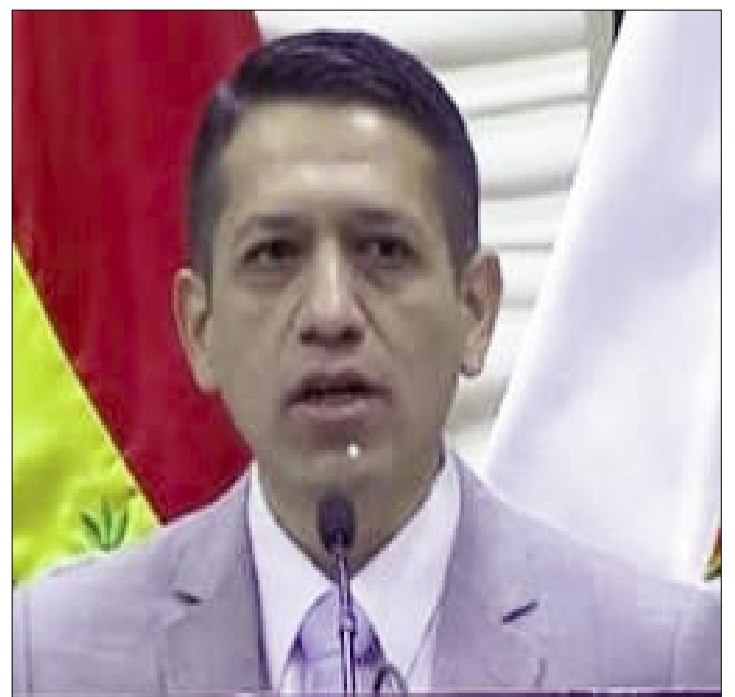
VICEMINISTRO DE TRANSPARENCIA, YAMIL GARCÍA DELFÍN

García reveló que recibieron más de 200 nuevos casos que están en análisis y que serán objeto de procesos judiciales en los siguientes días.