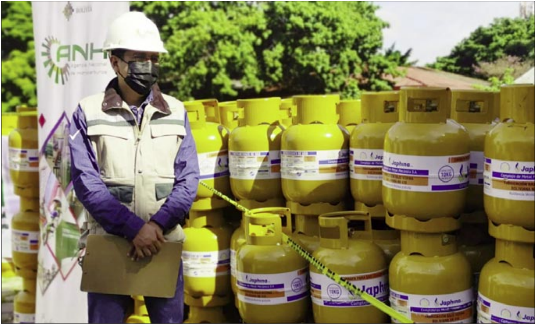
GOBIERNO Y DISTRIBUIDORES LOGRARON ACUERDO, PRECIO DEL GLP SE MANTENDRÁ.

Autoridades y distribuidores lograron acuerdo