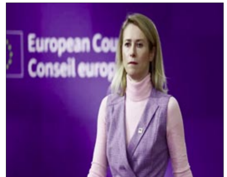
REPRESENTANTE DE LA UNIÓN EUROPEA PARA ASUNTOS EXTERIORES, KAJA KALLAS.