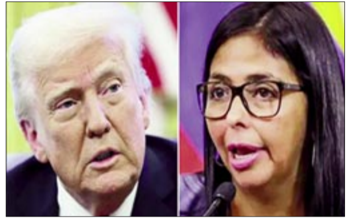
DONALD TRUMP Y DELCY RODRÍGUEZ, RESPECTIVAMENTE.

malo en el caso de Venezuela. El país se ha ido al infierno. Es un país fallido. Es un país totalmente fallido. Es un país que es un desastre lo mires por donde lo mires", ha afirmado.