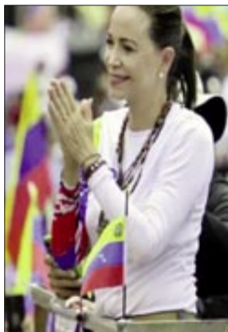
LA LÍDER Opositora VENEZOLANA MARÍA CORINA MACHADO (D) Y EL PRESIDENTE DE EEUU, DONALD