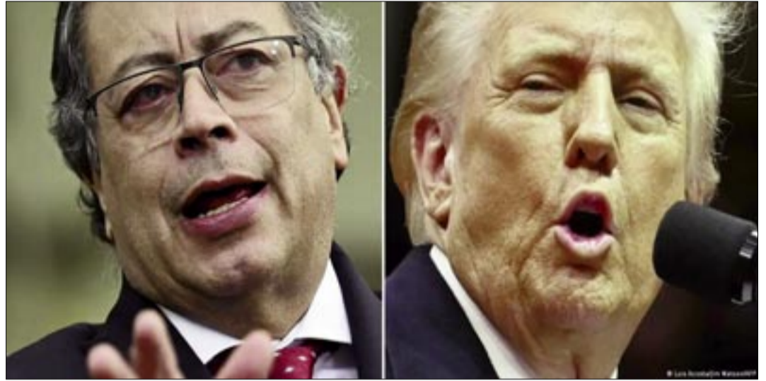
EL PRESIDENTE DE COLOMBIA GUSTAVO PETRO (IZQUIERDA) CRITICÓ EL ATAQUE A VENEZUELA ORDENADO POR SU HOMÓLOGO ESTADOUNIDENSE DONALD TRUMP, QUE CULMINÓ CON LA CAPTURA DE NICOLÁS MADURO.

"No es si Maduro es bueno o malo, ni siquiera si es narcotraficante, en los archivos de la justicia