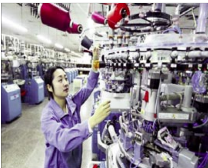
EL GOBIERNO DE LA INDIA CONFIRMÓ, EN SU REVISIÓN ECONÓMICA DE FIN DE AÑO