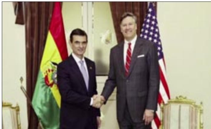
LAS RELACIONES SE MANTIENEN A NIVEL DE ENCARGADOS DE NEGOCIOS DESDE QUE EN 2008

El Gobierno de Bolivia espera completar en el transcurso del primer semestre los procesos "administrativos y legales" correspondientes para ver luego la reposición de embajadores con Estados Unidos, que también tiene que cumplir estos trámites, señaló este domi-