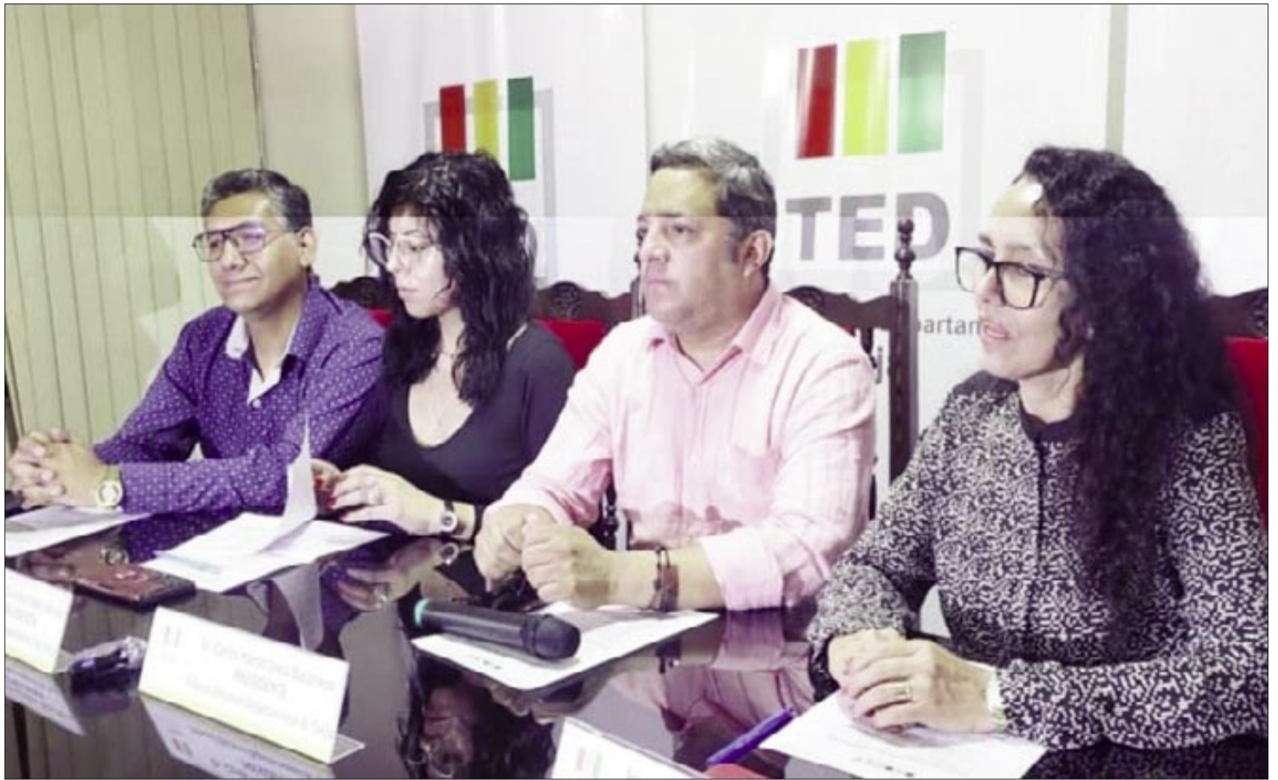
VOCALES DEL TED TENDRÁN SEMANA ARDUA DE TRABAJO

De 4.164 candidaturas registradas en el país