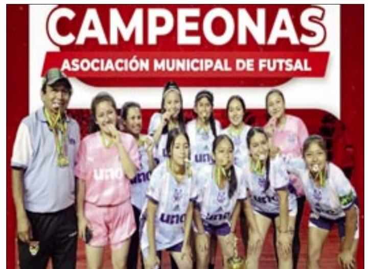
LAS CAMPEONAS DEL TORNEO OFICIAL DE FUTSAL 2025.

En la gestión pasada, no lograron la clasificación a la Liga Nacional de Fútbol por diferencia de gol; sin embargo, este año van con la misión de cumplir con el sueño de ascender.