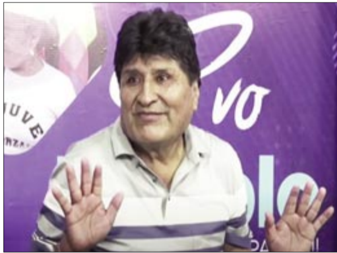
EVO MORALES, EXPRESIDENTE. FOTO/CAPTURA