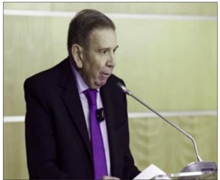
GONZÁLEZ ADVIRTIÓ QUE, AUNQUE EL "USURPADOR DEL PODER" YA NO SE ENCUENTRA EN VENEZUELA, LA TRANSICIÓN SOLO SERÁ POSIBLE CUANDO SE LIBERE A LOS PRESOS POLÍTICOS

González indicó que la salida del país de Nicolás Maduro, a quien calificó como "usurpador del poder", y su sometimiento a la justicia configura un nuevo escenario político, pero aclaró que ello no reemplaza las tareas pendientes. Entre ellas, remarcó como ineludible la liberación inmediata e incondicional de los presos políticos, tanto civiles como militares. "Ninguna transición democrática es posible mientras haya un solo venezolano encarcelado de manera in-