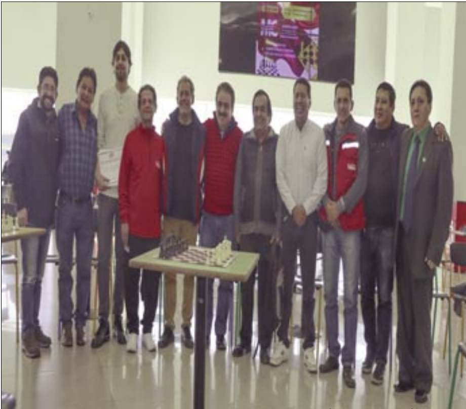
LOS DIRIGENTES DE LA DEPARTAMENTAL, TAMBIÉN APROBARÁN EL CALENDARIO 2026.