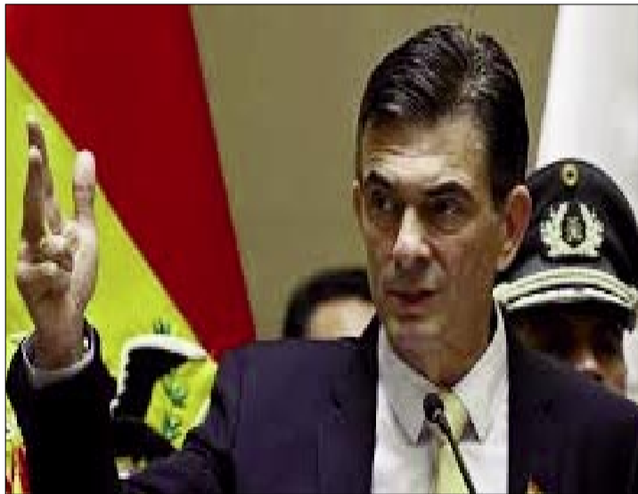
PRECIDENTE RODRIGO PAZ

El canciller afirmó que el Presidente y los ministros tienen una alta valoración del foro. Caso contrario, no participarían del mismo, pero lo ven como un espacio para definir una importante agenda económica