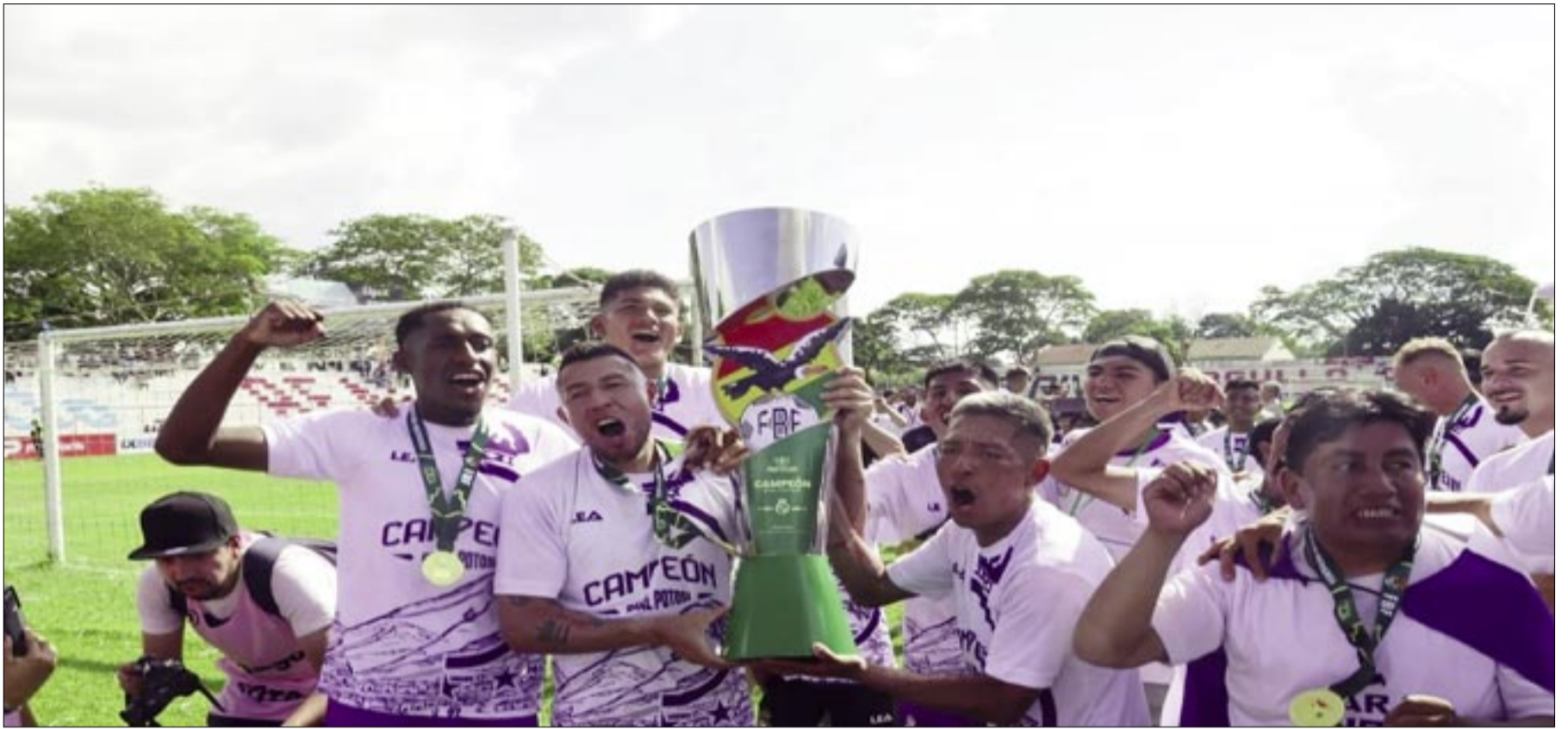
EL HISTÓRICO EQUIPO LILA FUE SUPERIOR A SAN JUAN FC. GOLEÓ EN LA PRIMERA FINAL (4-0)