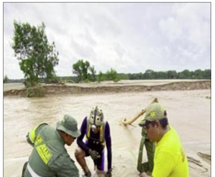
RESCATE TRAS DESBORDE DEL RÍO PIRAI

Los tres niveles de gobierno (municipal, departamental y nacional) han activado medidas y acciones. Mientras los ministerios de Salud, Defensa y Gobierno se encuentran desplazados en El Torno, también están presentes el COED y el Centro de Comando de Incidentes, apoyando los operativos en las zonas afectadas.