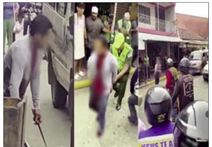
EL CRIMEN PASIONAL SE REGISTRÓ EN PLENA VÍA PÚBLICA EN MONTERO.