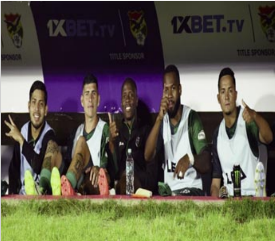
LOS JUGADORES DE REAL TOMAYAPO, MENTALIZADOS PARA GANAR EN POTOSÍ.