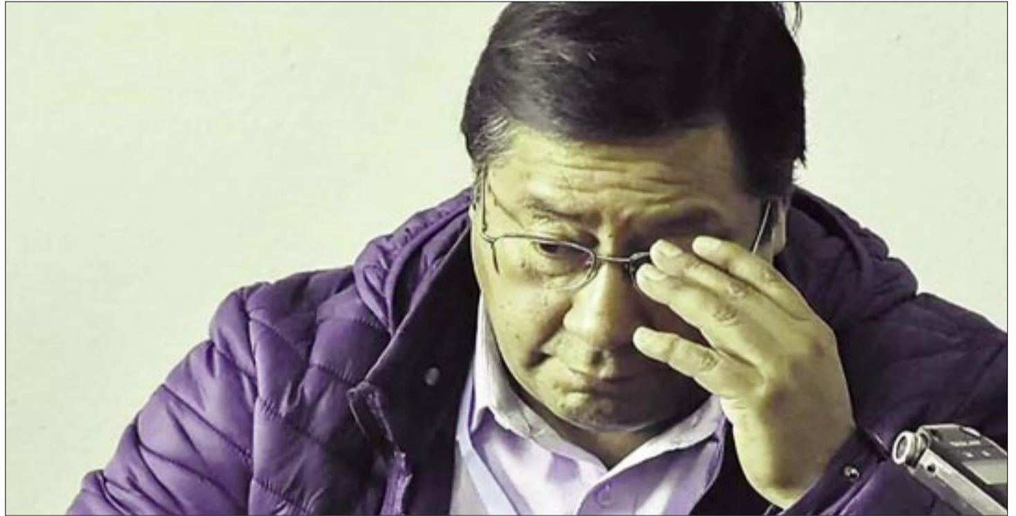
LUIS ARCE, EXPRESIDENTE DE BOLIVIA. ARCHIVO

Asimismo, aclaró que Arce cumple los procedimientos regulares del sistema penitenciario, sin