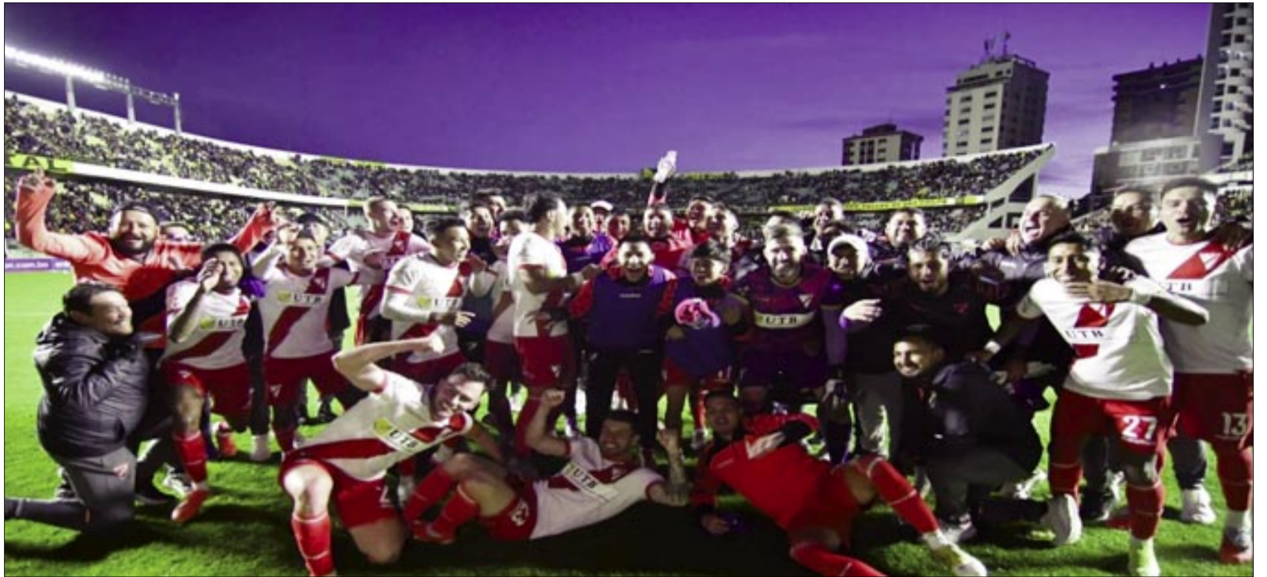
ALWAYS READY SE IMPUSO 3-2 A THE STRONGEST EN EL HERNANDO SILES DE LA PAZ