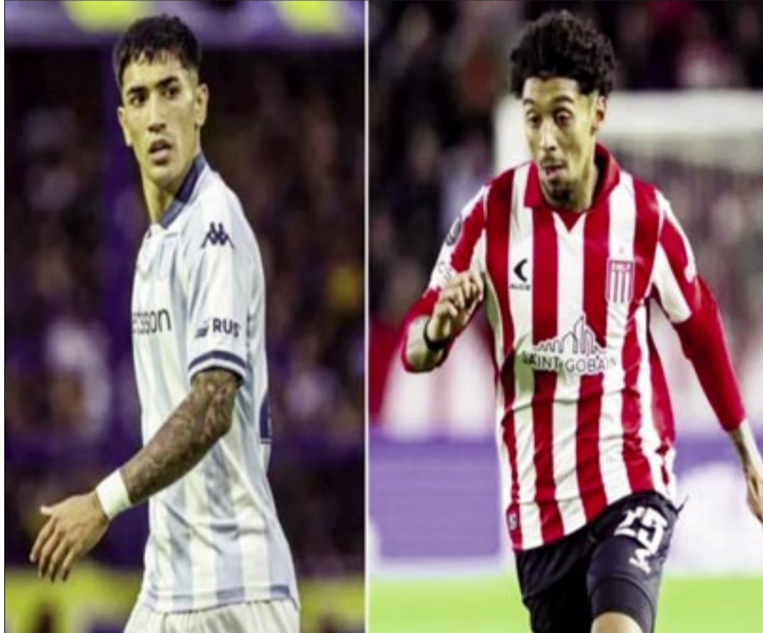
RACING CLUB Y ESTUDIANTES DE LA PLATA DEFINIRÁN ESTE SÁBADO LA FINAL DEL TORNEO CLAUSURA DEL FÚTBOL ARGENTINO

En octavos de final su víctima fue River Plate, al que venció por 3-2 como local, mientras que en cuartos superó en casa a Tigre en los penaltis tras empatar sin go-