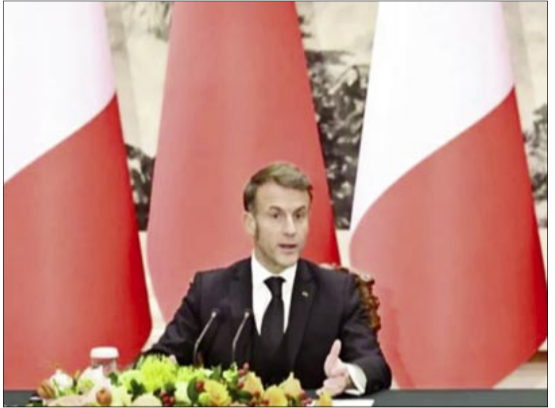
EL PRESIDENTE FRANCÉS EMMANUEL MACRON

tores afectados, entre los que se encuentran las baterías, el refinado de litio, la energía eólica, la energía fotovoltaica, los vehículos eléctricos, las bombas de calor aire-aire, los produc-