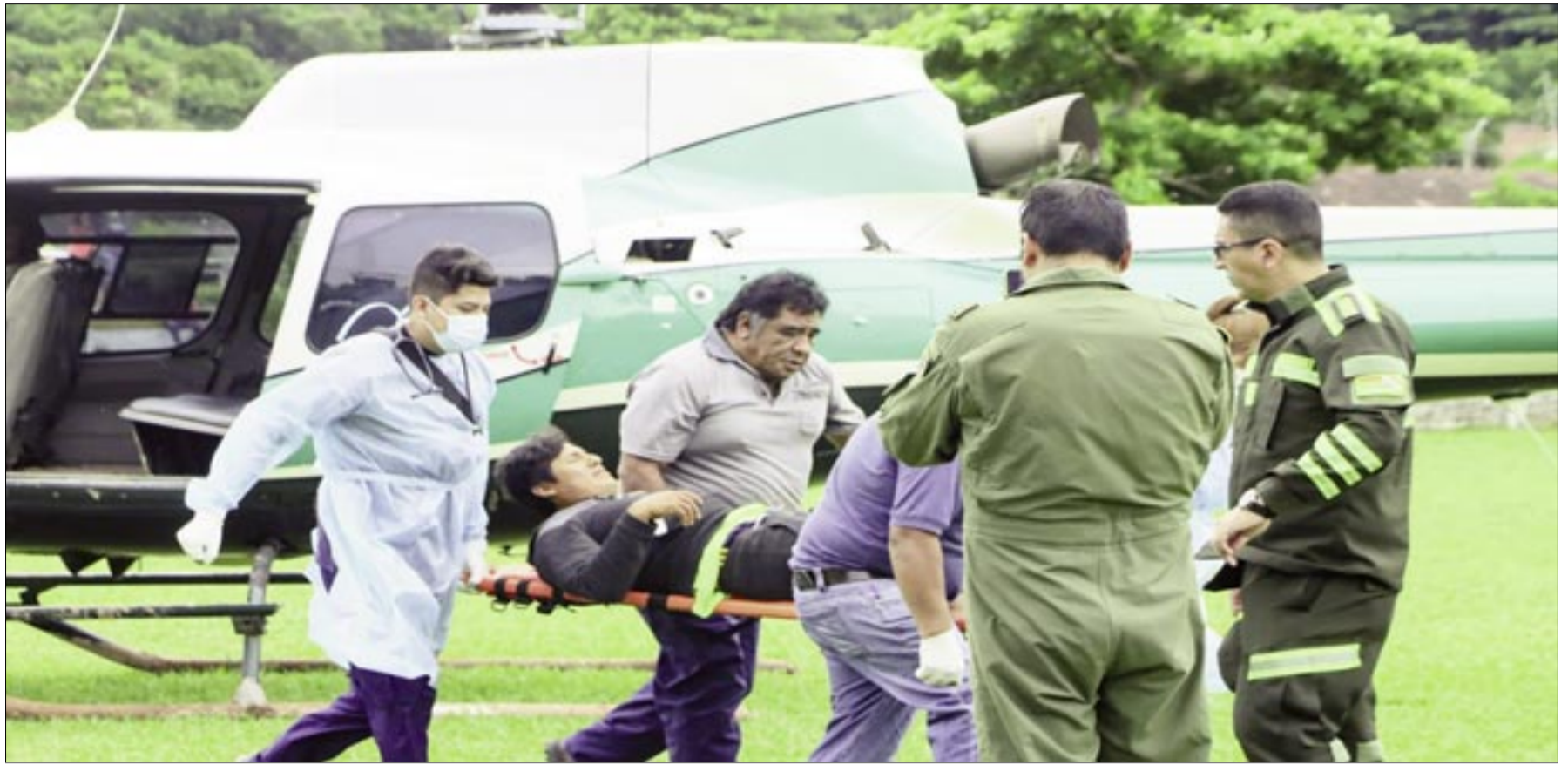
OPERACIONES DE EVACUACIÓN A CARGO DE LA POLICÍA BOLIVIANA.