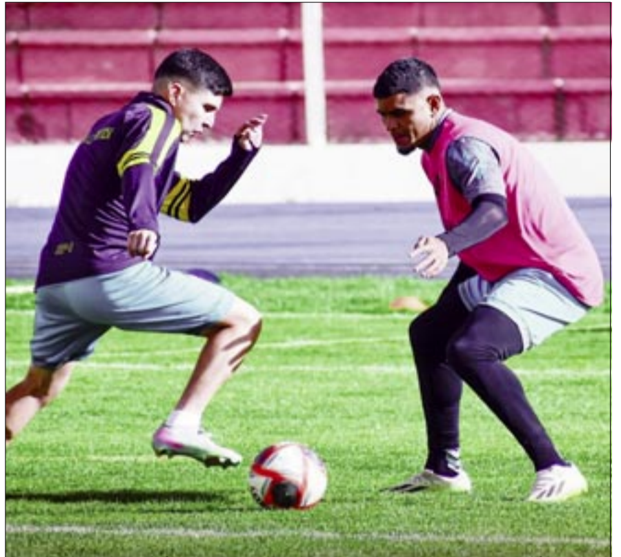
UNA DE LAS PRACTICAS DEL CUADRO DE NACIONAL POTOSÍ.

División Profesional del fútbol boliviano