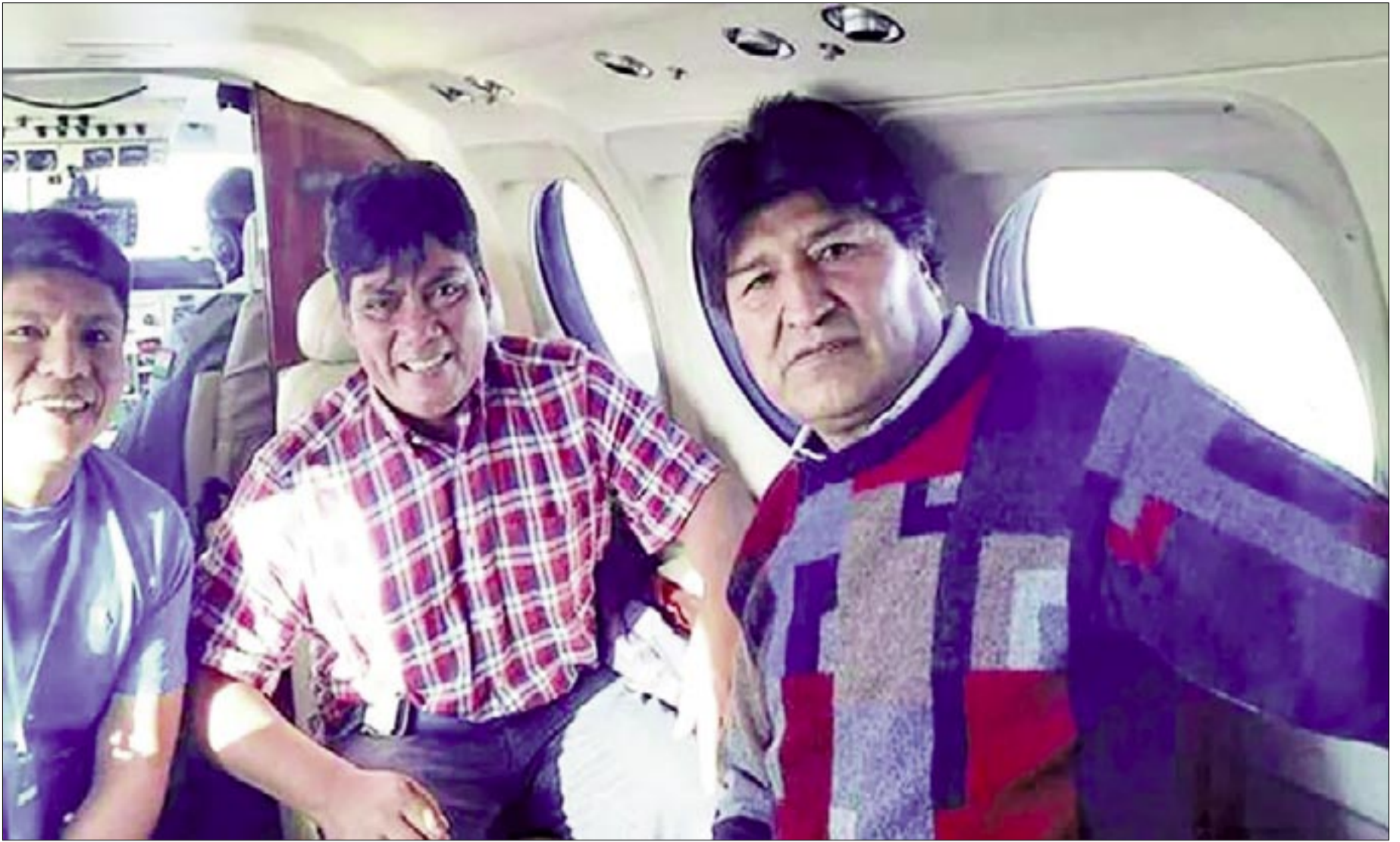
EL DIPUTADO HÉCTOR ARCE JUNTO A EVO MORALES Y LEONARDO LOZA.