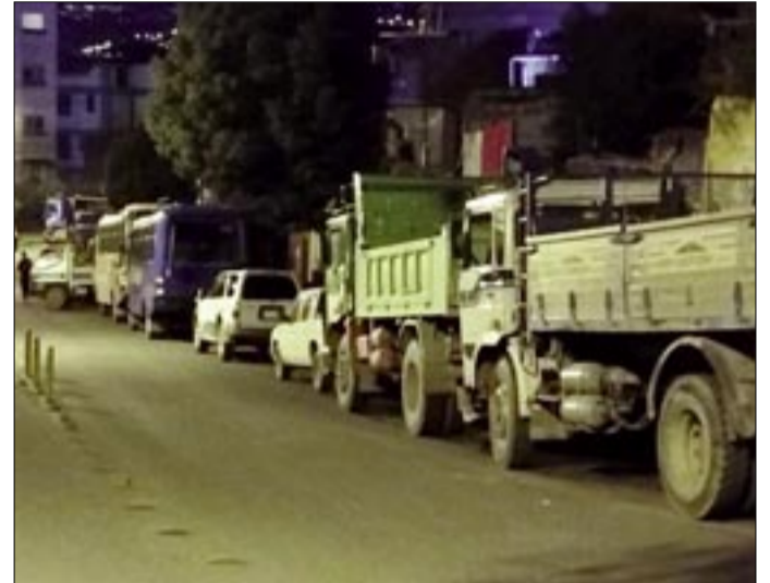
LARGAS FILAS DE MOTORIZADOS ANOCHE EN LA ZONA SUR DE LA PAZ.

Según los reportes, en los últimos días la distribución de combustible ha sido irregular, lo que generó acumulación de vehículos y prolongados tiempos de espera, aunque las autoridades afirmaron