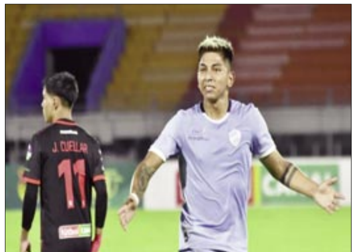
AURORA CELEBRA SU PRIMER TRIUNFO EN EL TODOS CONTRA TODOS

Aurora quedó sentenciado semanas atrás. Gualberto Villarreal San José lo había goleado 4-1 en Oruro, resultado que selló su destino en el estadio Jesús Bermúdez. En ese momento, con cinco partidos aún por disputarse, los números ya no le daban margen de salvación. Por más esfuerzo o milagro que intentara el plantel, la caída era irreversible