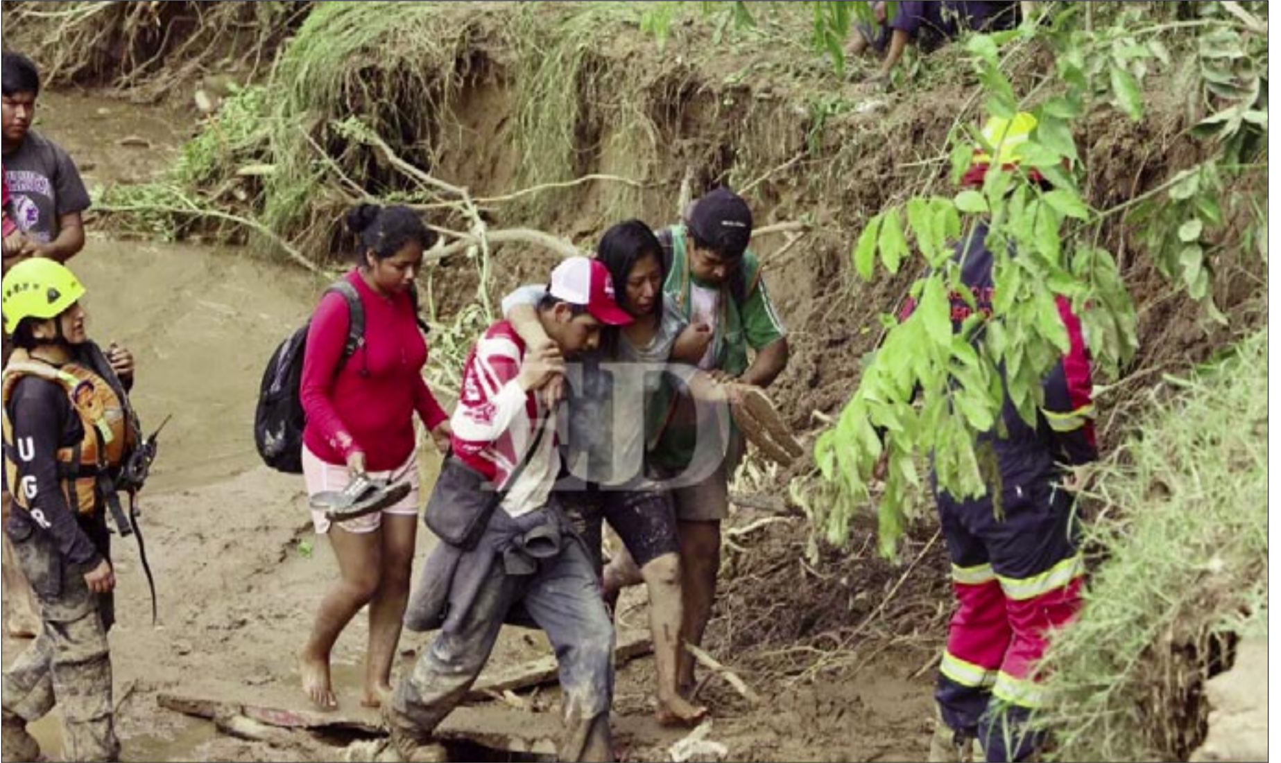
LOS TRABAJOS DE BÚSQUEDA Y RESCATE CONTINÚAN EN SANTA CRUZ