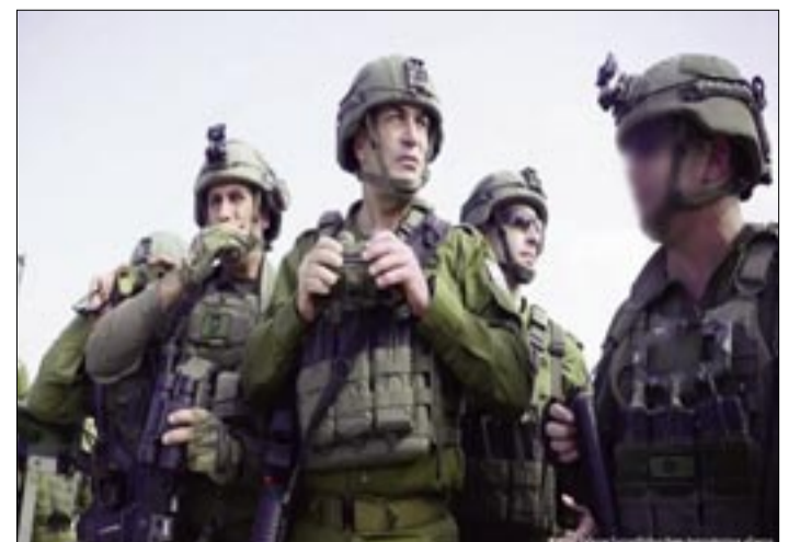
TENIENTE GENERAL EYAL ZAMIR (CON LOS ANTEOJOS LARGAVISTA EN LAS MANOS), EN UNA IMAGEN DE ARCHIVO.