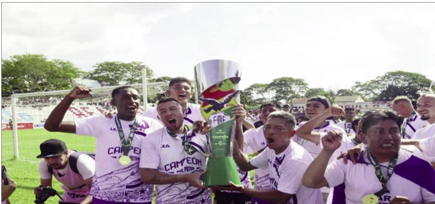
EL HISTÓRICO EQUIPO LILA FUE SUPERIOR A SAN JUAN FC. GOLEÓ EN LA PRIMERA FINAL (4-0)