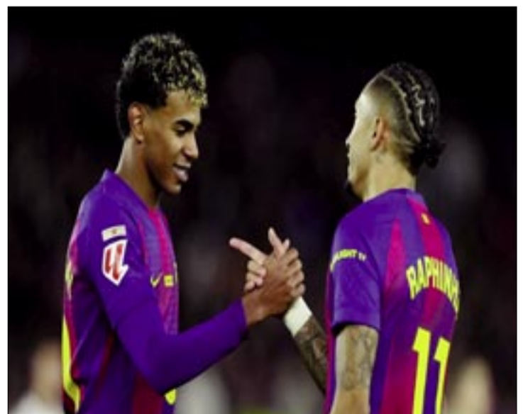
INCIDENCIAS DEL PARTIDO EN EL ESTADIO CAMP NOU.

Un remate de Eric (min. 22), que salió fuera por poco, y otro de Lamine Yamal (min. 23), ambos en un par de minutos, estuvieron a punto de sorprender a Sergio Herrera, pero el gol no llegaba.