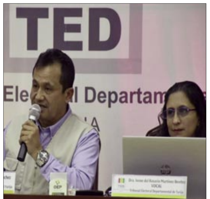
EL TED EMPIEZA A INTENSIFICAR SUS ACTIVIDADES.