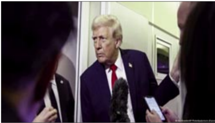
LA LLAMADA "NO SALIÓ BIEN NI MAL", RESPONDIÓ ESCUETAMENTE TRUMP AL CONFIRMAR QUE CONVERSÓ POR TELÉFONO CON EL MANDATARIO CHAVISTA. (ARCHIVO: 25.11.2025)

"El Estado venezolano, en el marco de su diplomacia de paz, ha denunciado por escrito ante la Organización de Aviación Civil Internacional, las graves amenazas contra nuestro espacio aéreo que atentan contra la seguridad en este hemisferio", indicó el ministro en un comunicado publicado en redes sociales y que fue posteriormente eliminado.