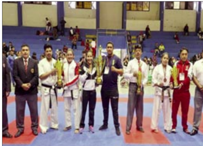
PREMIACIÓN A LOS CAMPEONES DE LA DISCIPLINA. FEBOKA

Potosí terminó en tercer lugar (4-4-6), seguido por Oruro (4-3-9), Tarija (4-3-4), Santa Cruz (1-2-4) y La Paz (0-7-10)