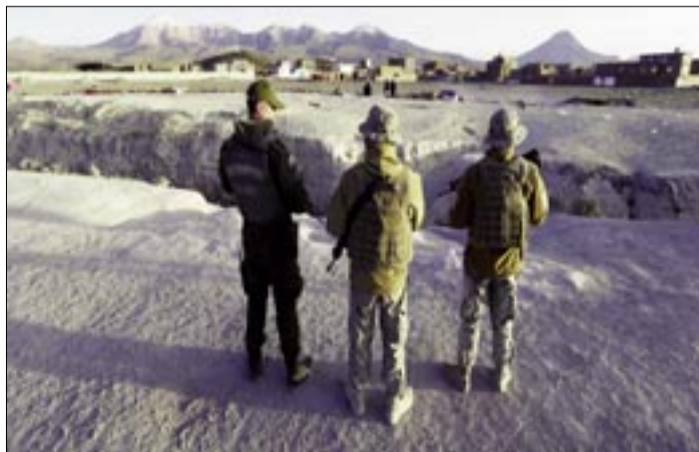
EL CONTINGENTE DE REFUERZO COMPRENDE A UN CENTENAR DE MIEMBROS DEL EJÉRCITO PERUANO

Los manifestantes aseguraron a medios peruanos que buscan retornar a sus países de origen, porque se han visto obligados a abandonar Chile ante el endurecimiento de las políticas migratorias