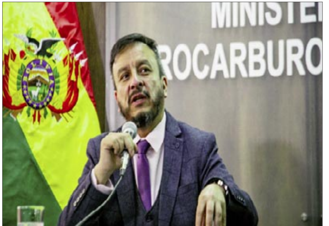
VICEMINISTRO DE HIDROCARBUROS, MAURICIO MEDINACELI.

El ministro indicó que mientras tanto el Gobierno continuará con los trabajos para abastecer de gasolina, diésel, GLP y jet fuel al mercado nacional.