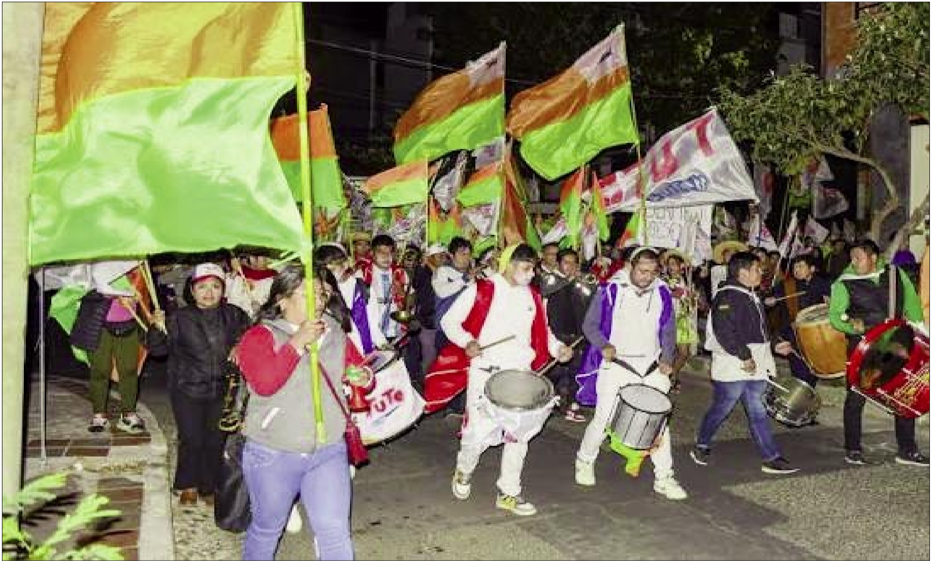
AGRUPACIONES POLÍTICAS EN CARRERA CONTRA EL TIEMPO

Hay versiones de intensas negociaciones y reuniones