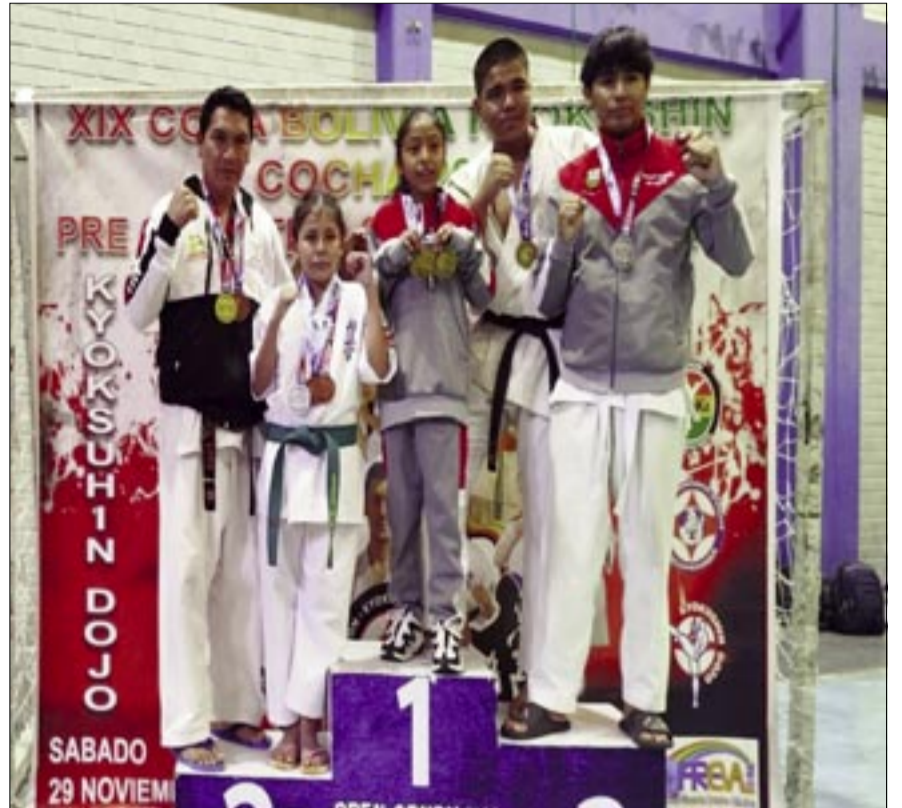
EL PODIO DE LOS KARATECAS TARIJENOS QUE COMPITIERON EN COCHABAMBA.