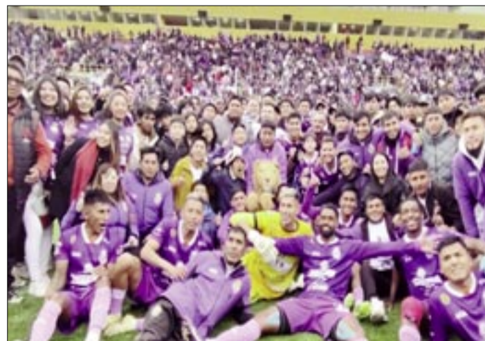
JUGADORES DEL EQUIPO 'LILA' CELEBRAN EL TRIUNFO ANTE SAN JUAN. FOTO. CLUB REAL POTOSÍ

El duelo de vuelta será en el estadio Samuel Vaca de Warnes. De remontar, San Juan pasará directo a la Primera División del fútbol. De quedar subcampeón, jugará el ascenso indirecto con el penúltimo de la tabla, que ahora es Wilstermann.