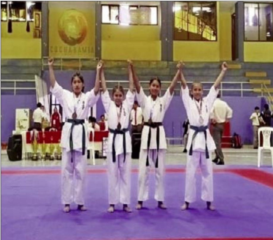
LOS DEPORTISTAS EN EL ACTO DE PREMIACIÓN DEL TORNEO NACIONAL.