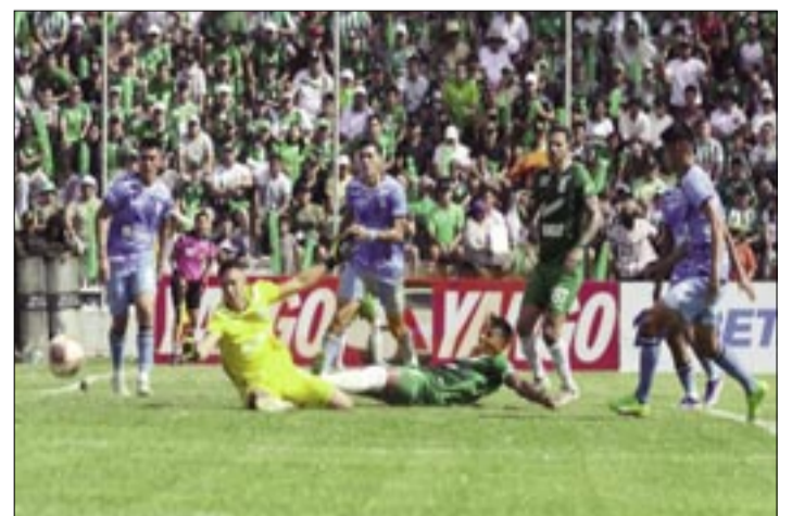
EL CLÁSICO CRUCEÑO FUE ALBIVERDE EN EL ESTADIO DE REAL SANTA CRUZ.

Con Oriente más aplomado y antes de irse al descanso nació otro lujo. Nava hizo una asistencia de taco para que Víctor Cuéllar controle y con remate cruzado anote el 2-0 cuando se jugaba un minuto de tiempo agregado (45’+1’). La racha adversa de Oriente se diluía y los refineros se frotaban las manos con tres nuevas unidades en el campeonato Todos contra Todos