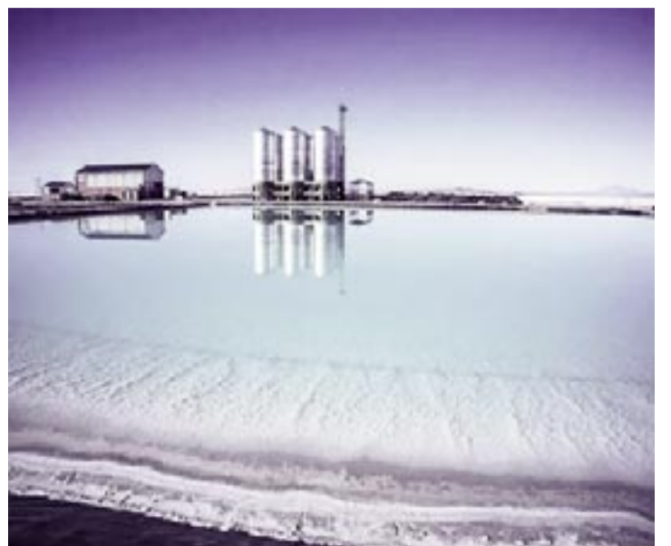
BOLIVIA POSEE UNA DE LAS MAYORES RESERVAS DE LITIO EN EL MUNDO.

La CIL, explicaron, se apoya en tres pilares que buscan la trascendencia de la industria sobre la macro y las diferencias políticas.