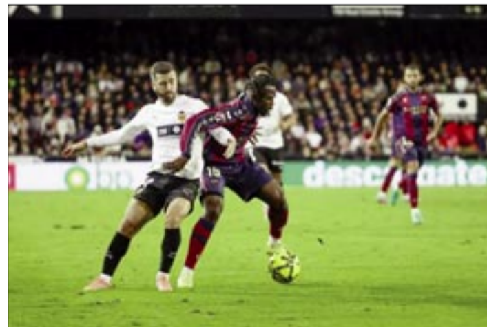
GAYÁ Y KOYALIPOU, DURANTE EL DERBI.

Por el contrario, el Levante se encuentra en una curva descendente en este momento de la temporada ya que ha perdido cuatro de sus últimos cinco partidos de Liga (el otro lo empató) tras haber perdido solo uno de sus anteriores cinco en la competición (2V, 2E, 1D).