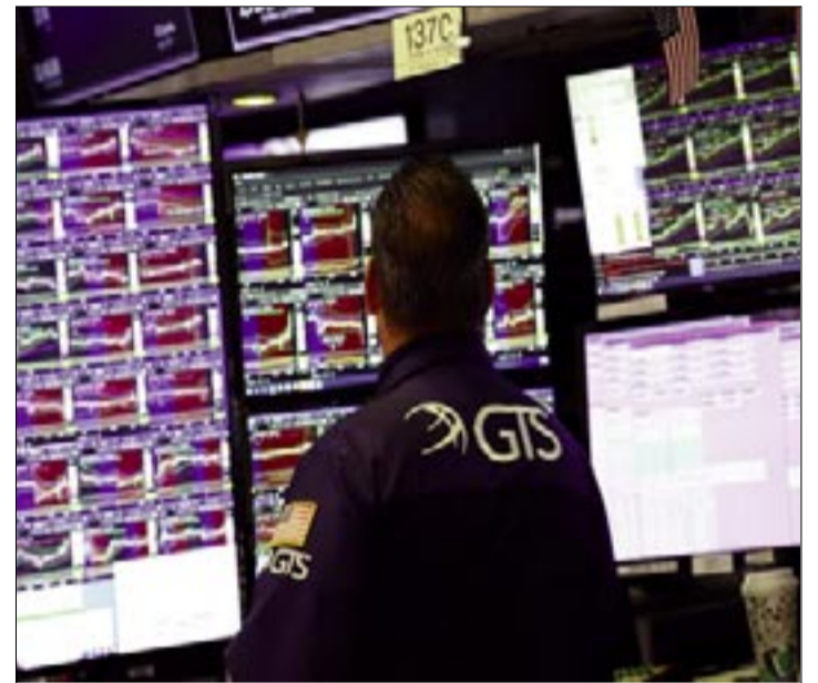
SE ESPERA QUE LA IA IMPULSE LA PRODUCTIVIDAD Y REDUZCA EL EMPLEO, POTENCIANDO EL CRECIMIENTO DE LAS EMPRESAS.

Sin embargo, la semana pasada, la división de gestión de activos del banco dijo a los inversores que las empresas de crédito privadas eran un elemento esencial en las carteras. Incluso aquellos que están seguros de que en algún momento en el futuro puede producirse una crisis no quieren perderse el auge que precede a la caída.