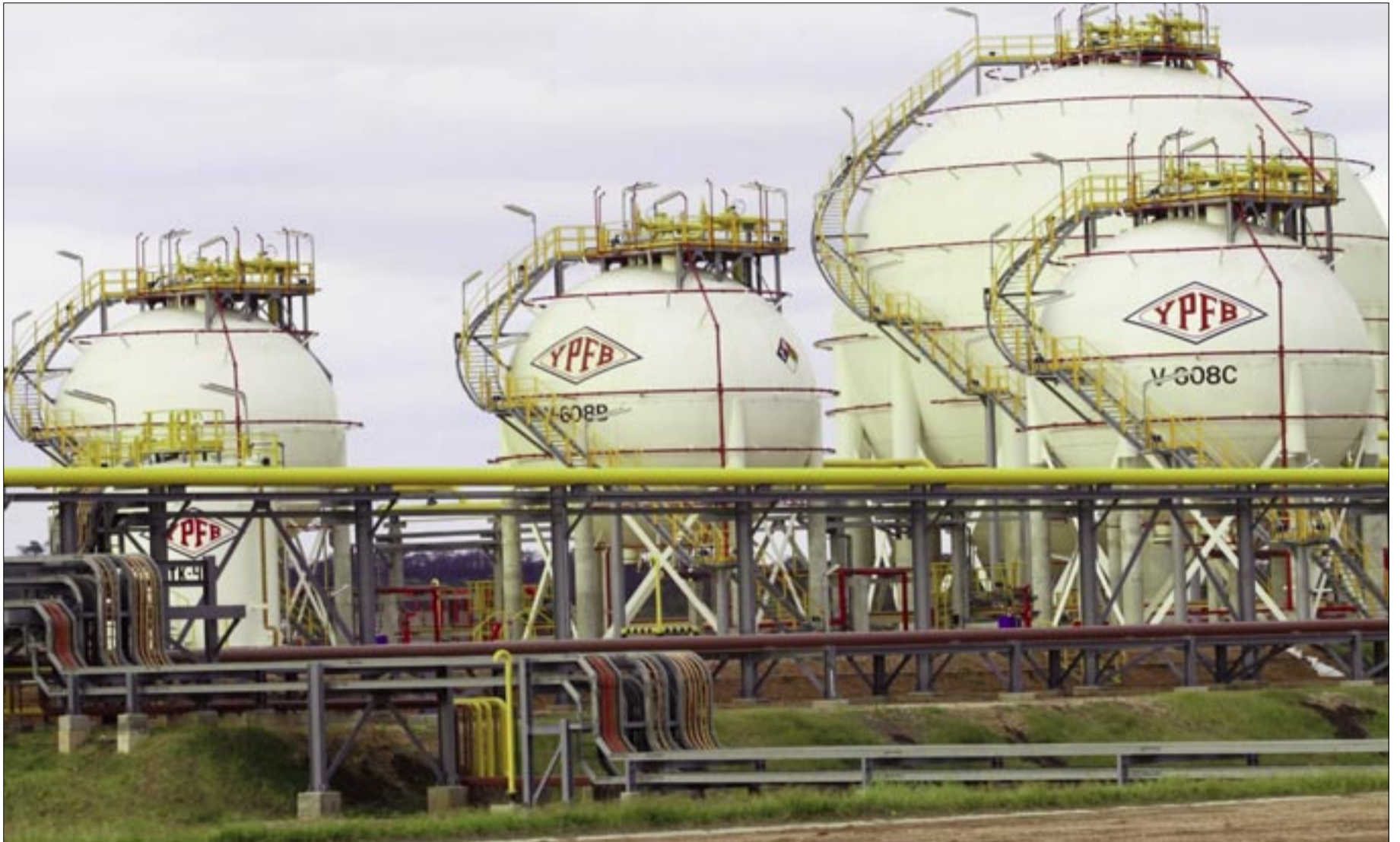
ESTA PLANTA FUE CALIFICADA DE "ELEFANTE BLANCO" POR EL CÍVICO DE YACUIBA

Rubro hidrocarburífero tiene varios pendientes