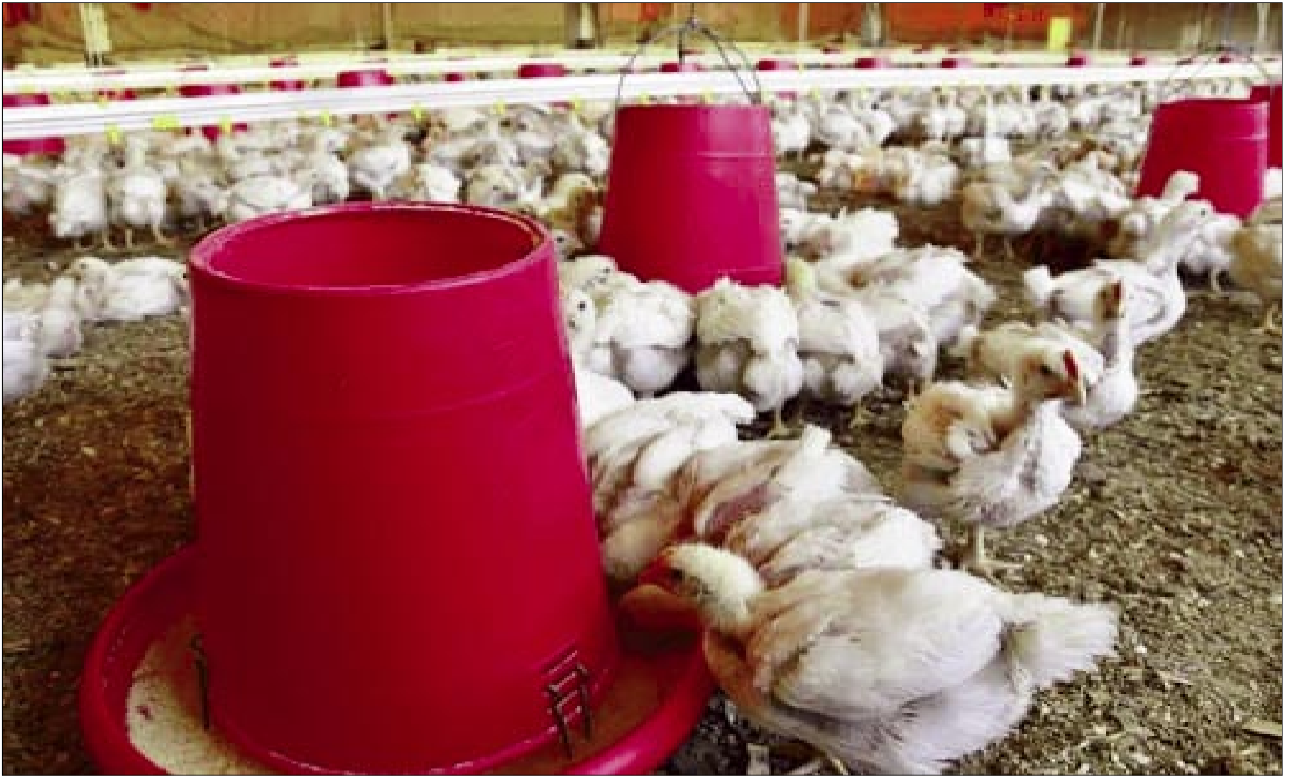
EL RUBRO DE LA AVICULTURA ESPERA NO TENER SUBA DE PRECIOS