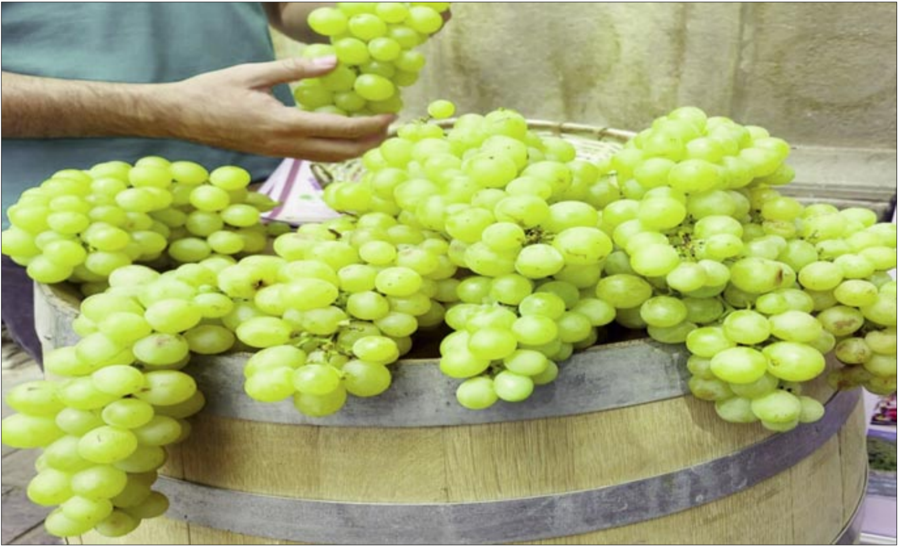
LA UVA DE LA NUEVA COSECHA ESTÁ PRONTA SALIR

Está "pintándose" un buen panorama por ahora