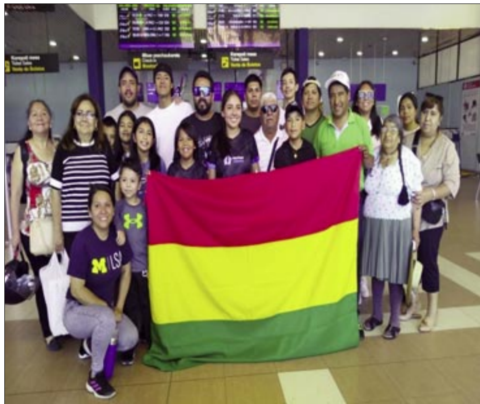
LOS RAQUETBOLISTAS TARIJENOS JUNTO A SUS FAMILIARES ANTES DEL VIAJE.