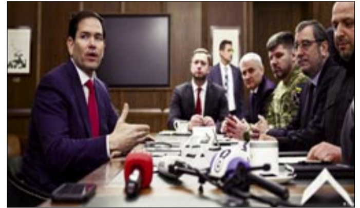
MARCO RUBIO JUNTO AL EQUIPO NEGOCIADOR UCRANIANO.

"Pero creo que hay buenas posibilidades de que podamos llegar a un acuerdo", añadió el mandatario estadounidense, quien recientemente presentó un plan de paz que algunos gobiernos europeos consideran muy favorable a Moscú y que, entre otros puntos, incluye cesiones territoriales, limitaciones al tamaño de las fuerzas ucranianas y la imposibilidad de Kiev de ingresar a la OTAN.