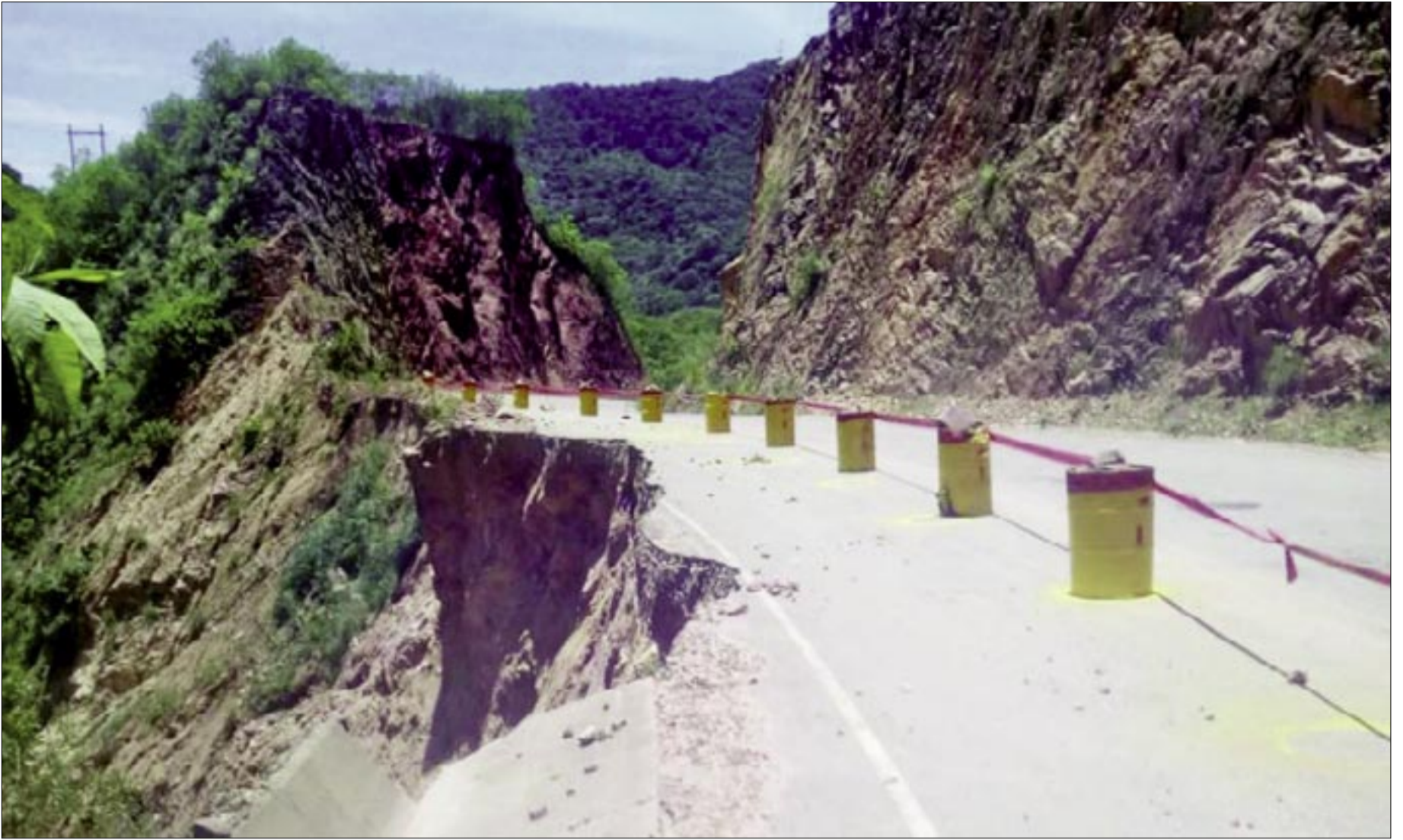
LA VARIANTE CANALETAS, ES UNO DE LOS CUELLOS DE BOTELLA, COMO OTROS MUCHOS, EN EL CAMINO AL CHACO

En coordinación con entidades representativas