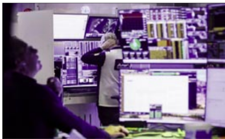
LOS OPERADORES TRABAJAN EN LA SALA DE LA BOLSA DE NUEVA YORK (NYSE) EN NUEVA YORK, ESTADOS UNIDOS, EL LUNES 24 DE NOVIEMBRE DE 2025.