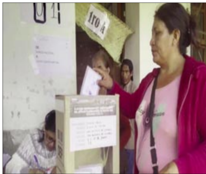
EL 19 DE DICIEMBRE TERMINA EL MANDATO DE LOS ACTUALES VOCALES DEL TRIBUNAL SUPREMO ELECTORAL (TSE).