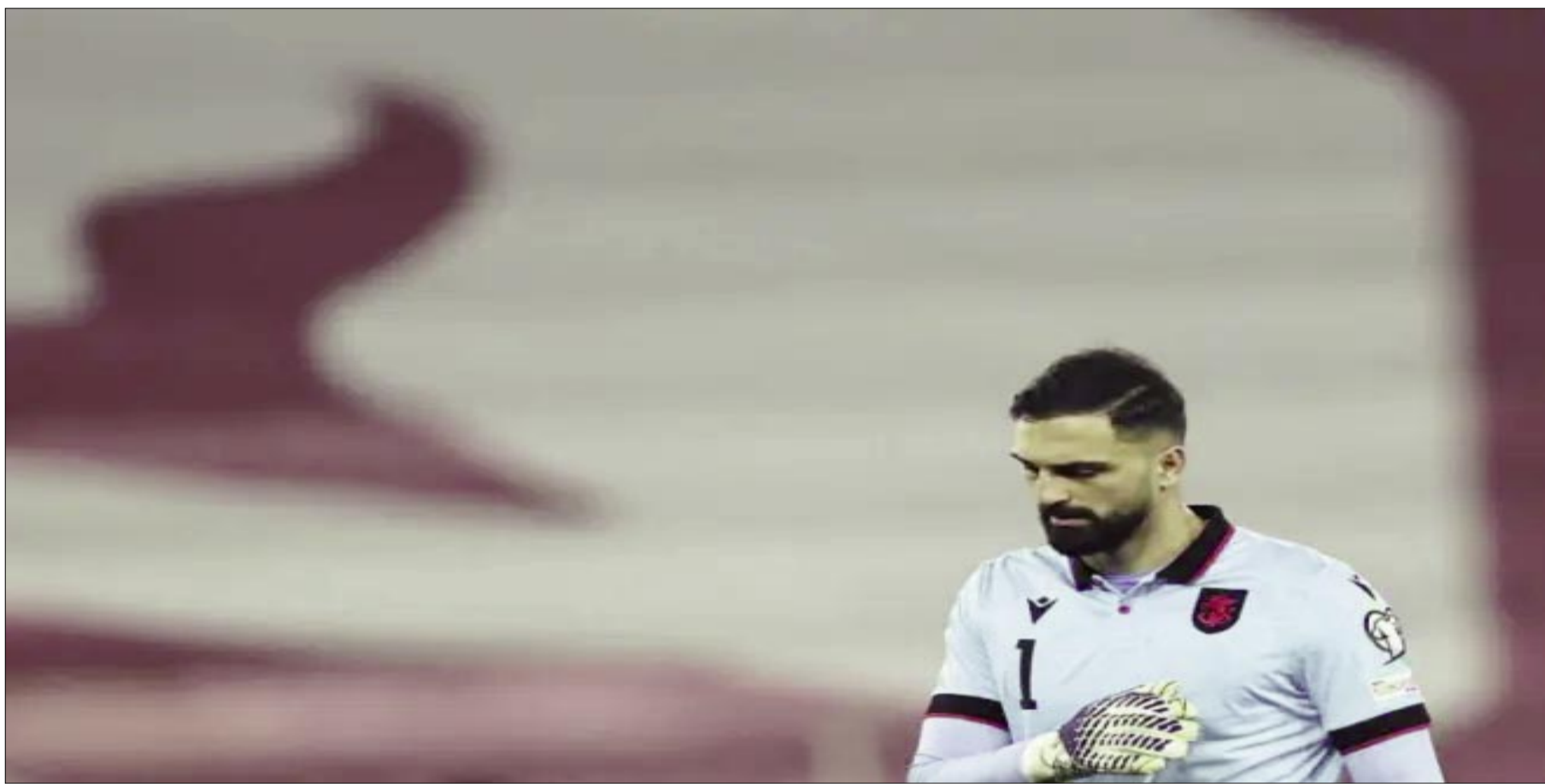
MAMARDASHVILI NO ESTARÁ SIQUIERA EN LA REPESCA CON GEORGIA, ELIMINADA EN EL GRUPO DE ESPAÑA BETFAIR