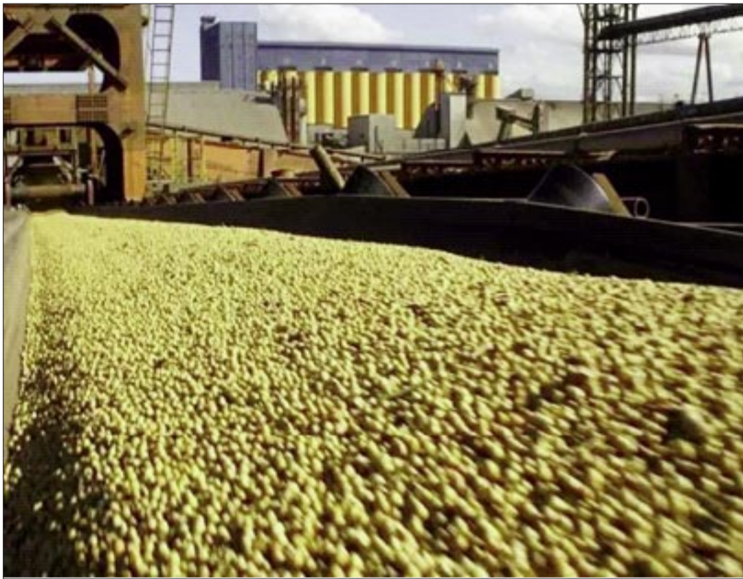
SOYA SIENDO PROCESADA.

Asimismo, mencionó que se han abierto nuevas fronteras agrícolas en Beni, Chuquisaca y Tarija, las cuales deben ser planificadas a mediano y largo plazo para producir “de manera amigable con el medio ambiente”, haciendo sostenible esta actividad.