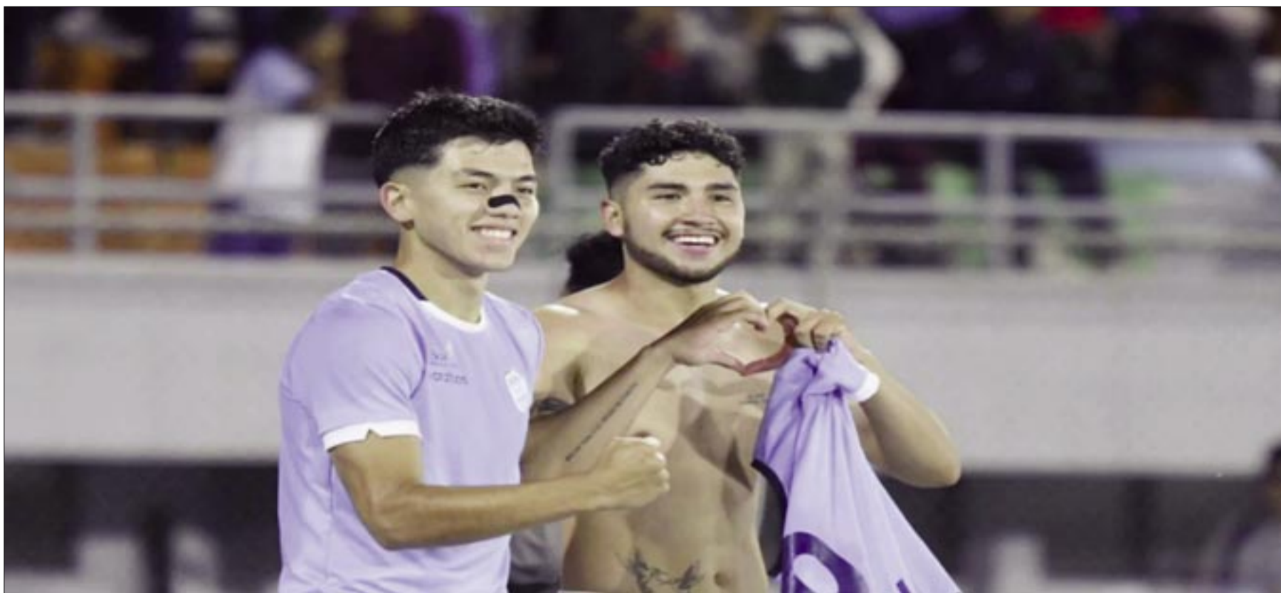
FESTEJO DE GOL DEL CLUB AURORA.