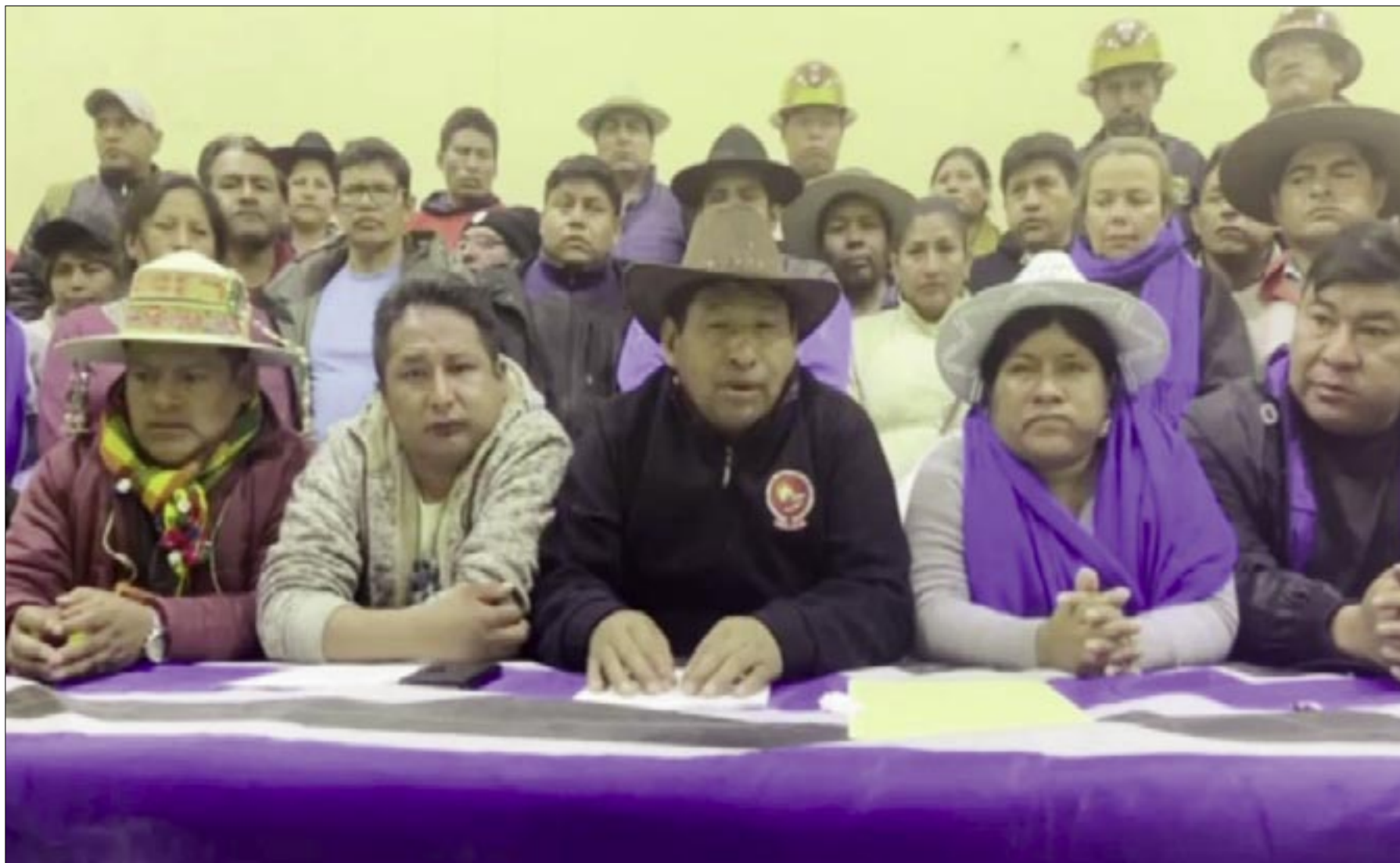
EVISTAS PARECEN AFERRARSE AL VOTO NULO PARA LA SUBNACIONAL

Ya están trabajando en posibles alianzas