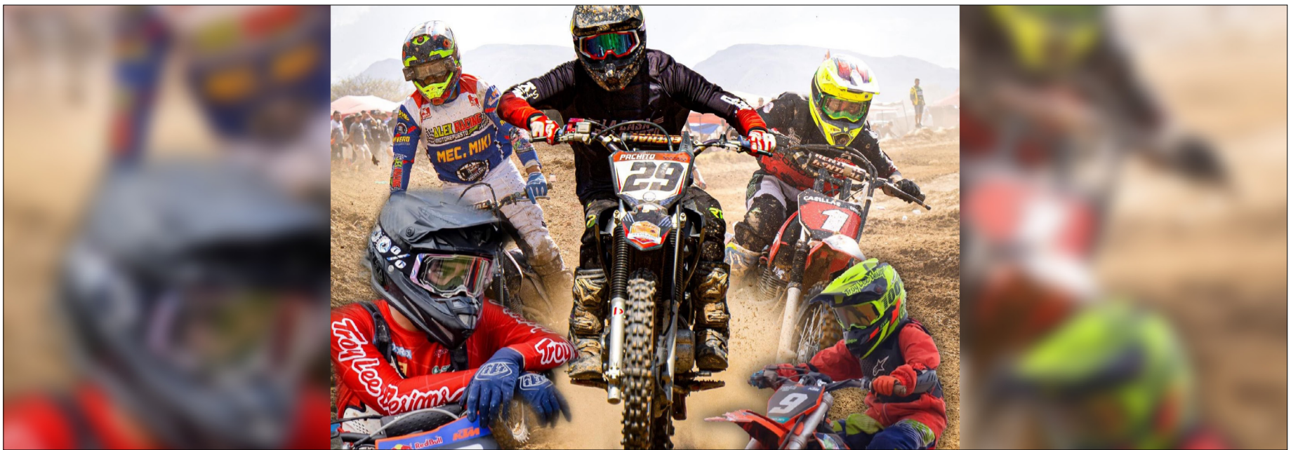
LOS PILOTOS DE LA MODALIDAD ENDURO, ESTARÁN EN ACCIÓN DURANTE ESTE SÁBADO. (FOTO: ARCHIVO).