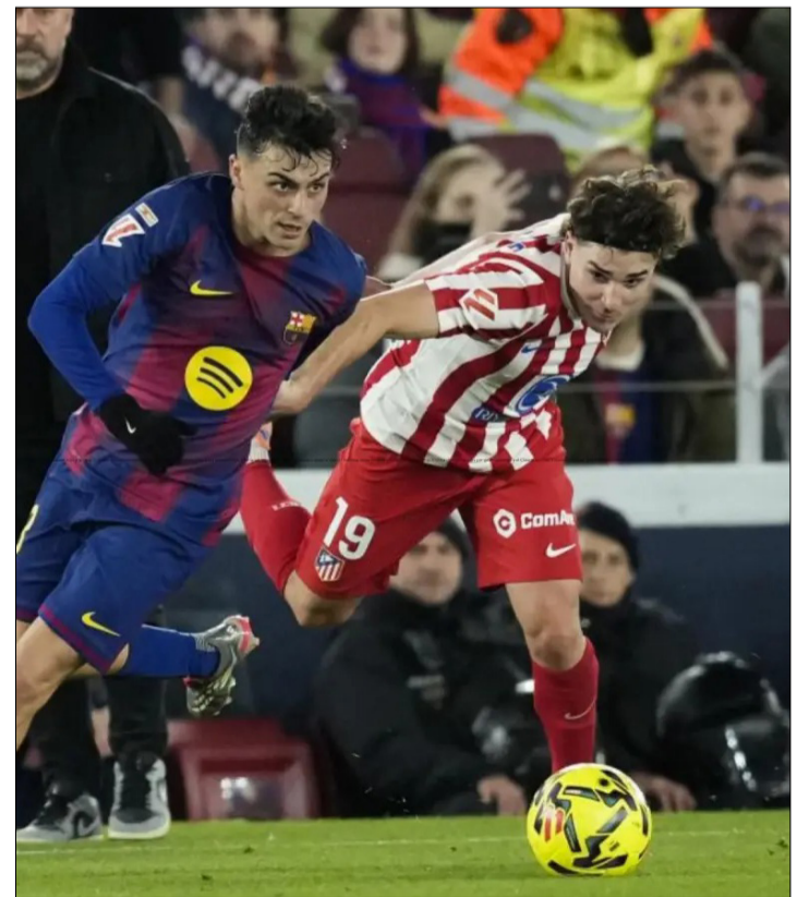
JULIÁN ÁLVAREZ, JUNTO A PEDRI, EL MARTES.