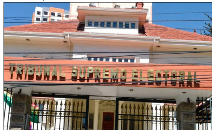
EL TRIBUNAL SUPREMO ELECTORAL (TSE).