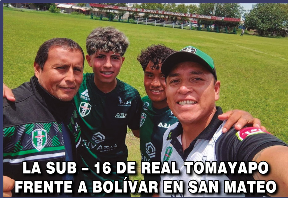
LA SUB - 16 DE REAL TOMAYAPO FRENTE A BOLÍVAR EN SAN MATEO