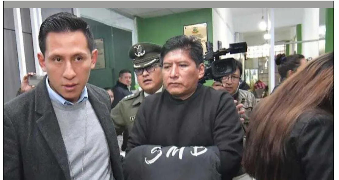
EL DIRIGENTE DE LA CONFEDERACIÓN NACIONAL DE PANIFICADORES DE BOLIVIA (CONAPABOL), RUBÉN RÍOS.