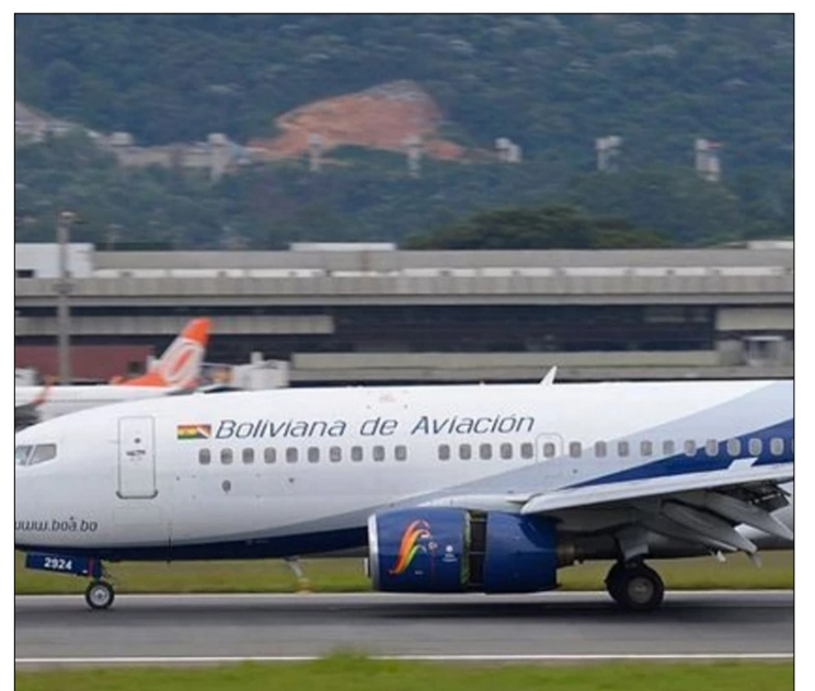
IMAGEN REFERENCIAL DE BOA