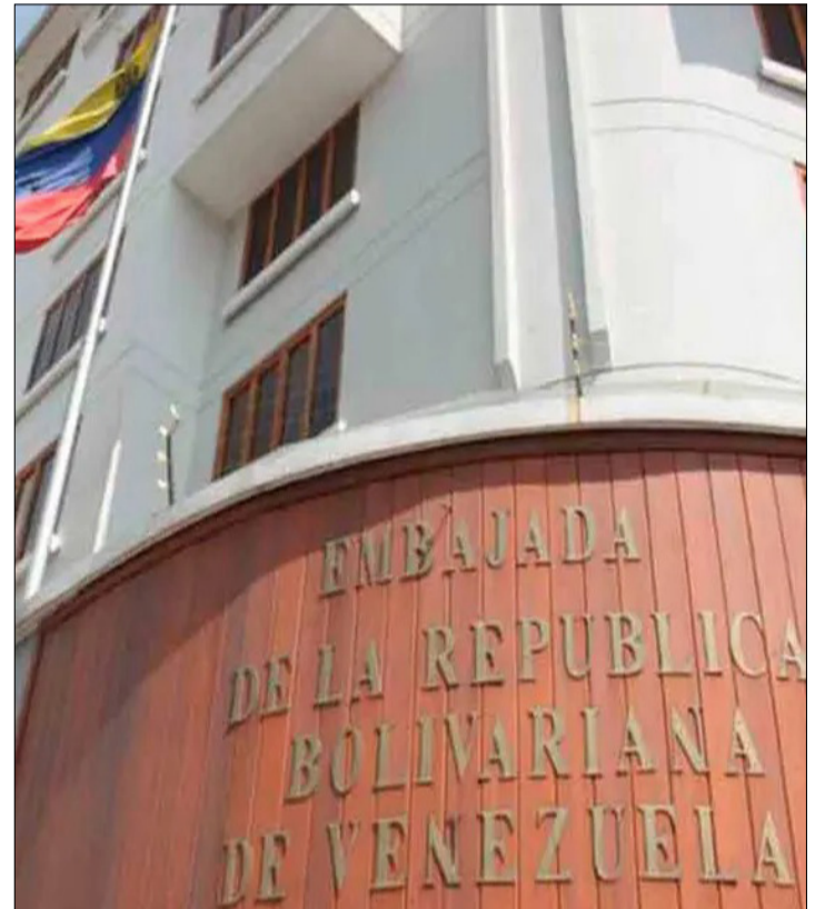
FRONTIS DE LA EMBAJADA DE VENEZUELA.