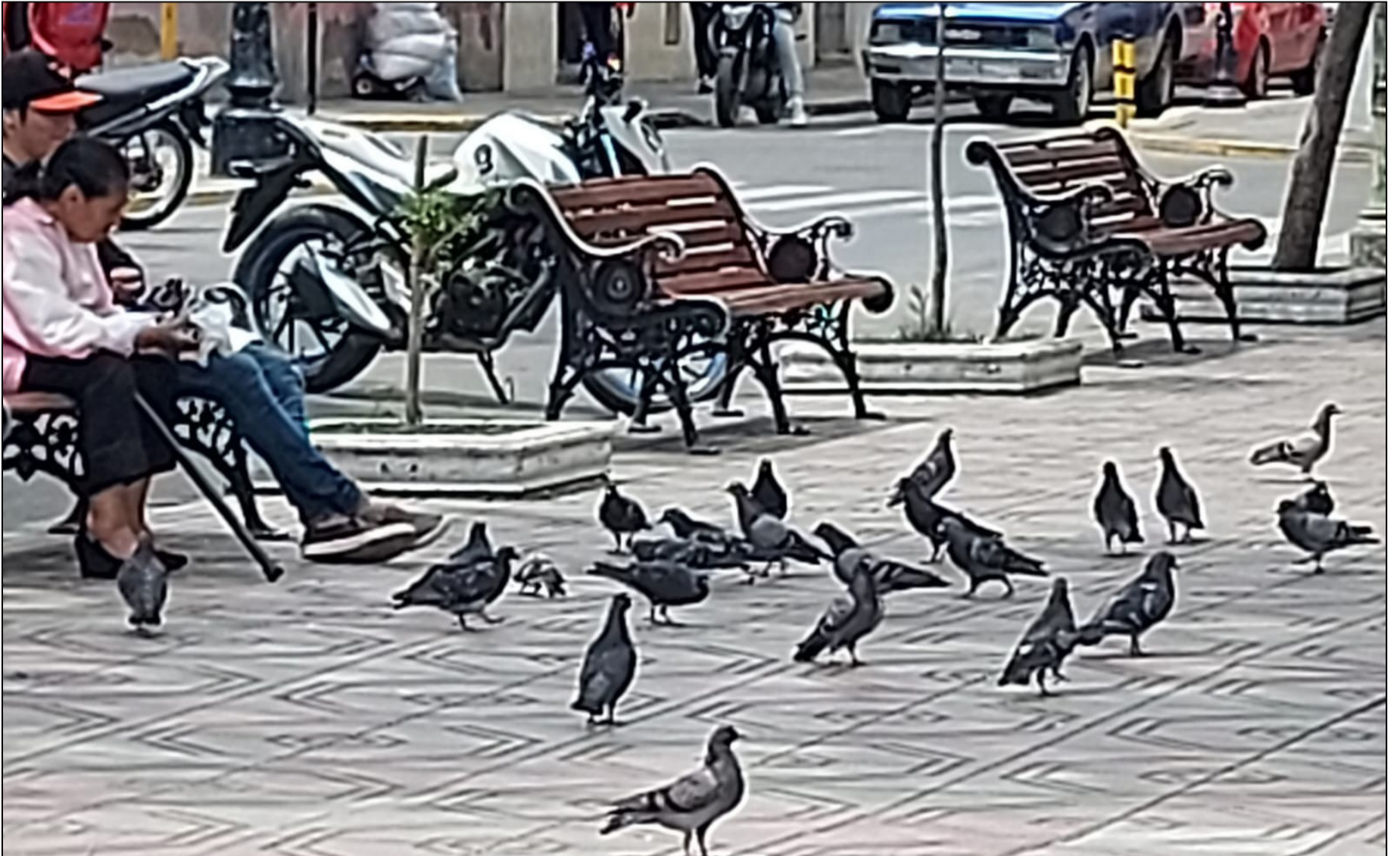
INVESTIGAN POR QUÉ ESTÁN MURIENDO LAS PALOMAS EN LA PLAZA PRINCIPAL.