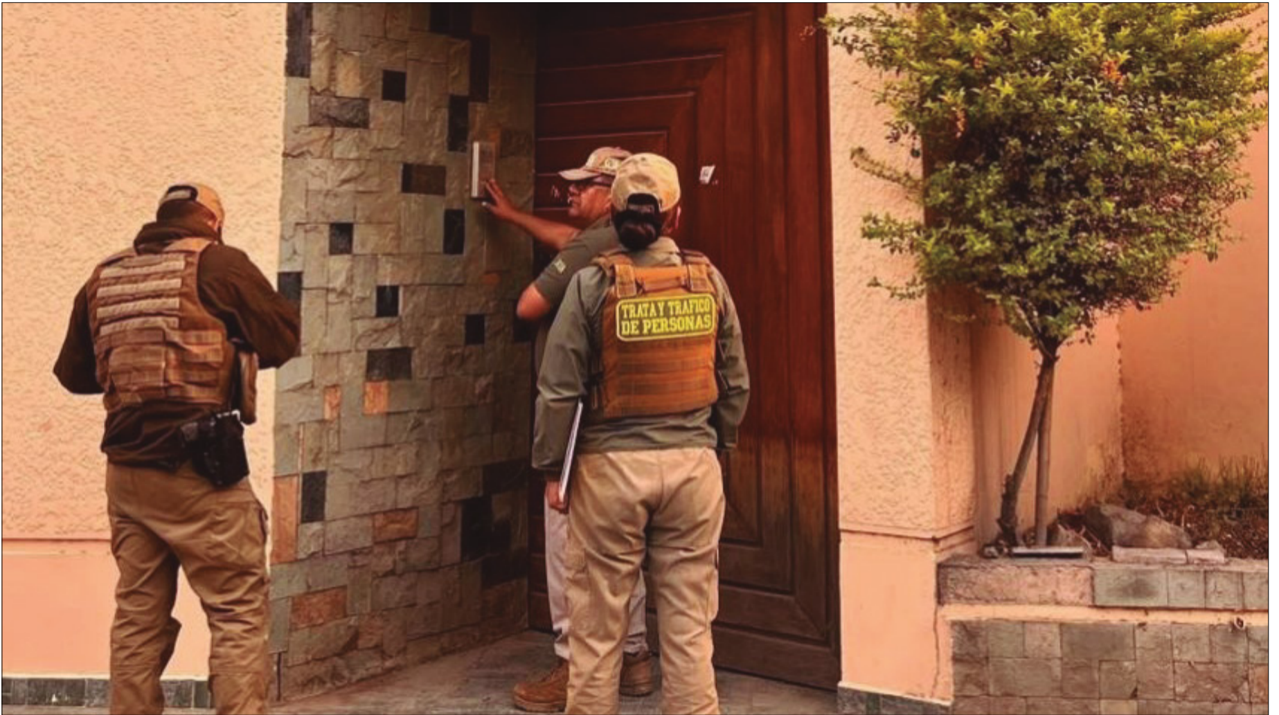
DENTRO LAS INVESTIGACIONES, ASÍ NOTIFICARON AL EX PRESIDENTE.