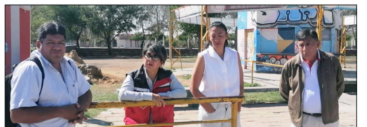
EL COLISEO UNPAYU, SERÁ ADMINISTRADO POR LA ALCALDÍA.