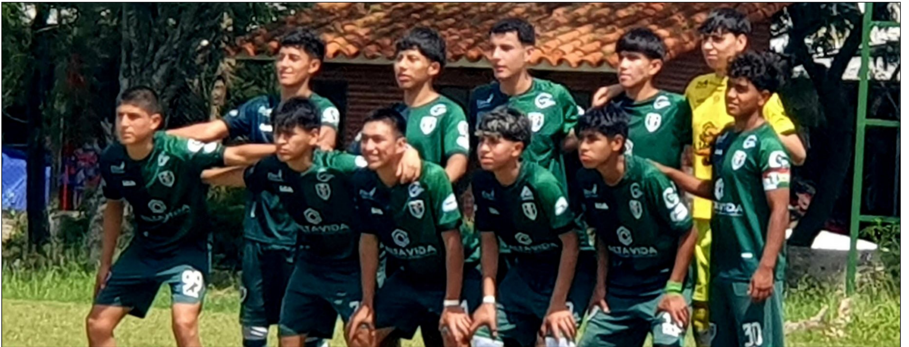
EL PLANTEL DE REAL TOMAYAPO, SE PREPARÓ PARA GANARLE A BOLÍVAR.