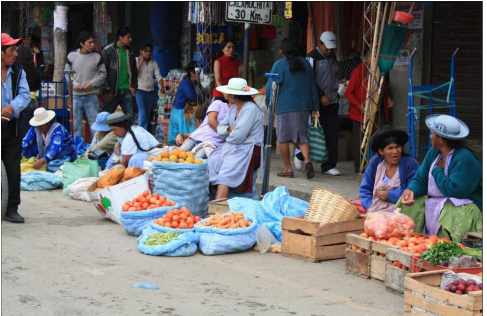
REVENDEDORES ESTÁN DESPLAZANDO A PRODUCTORES AGRÍCOLAS EN EL MERCADO CAMPESINO.

Se impusieron el desorden y el caos en la zona