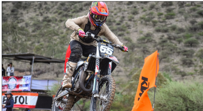
EL ENTRENAMIENTO DE LOS PILOTOS QUE REALIZARON ESTE VIERNES.

deportiva de la Federación Boliviana de Motociclismo (FBM) y conjuntamente con ellos hemos terminado los detalles que faltaban; invitamos a la población tarijeña para que se traslade al Valle y sea parte de la fiesta de la última fecha nacional, después de nueve años aproximadamente se volverá a correr una competencia nacional en Tarija”, declara