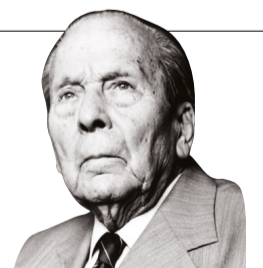
Jorge Luis Borges 1899-1986. Escritor argentino.

“ Yo no hablo de venganzas ni perdones, el olvido es la única venganza y el único perdón....”