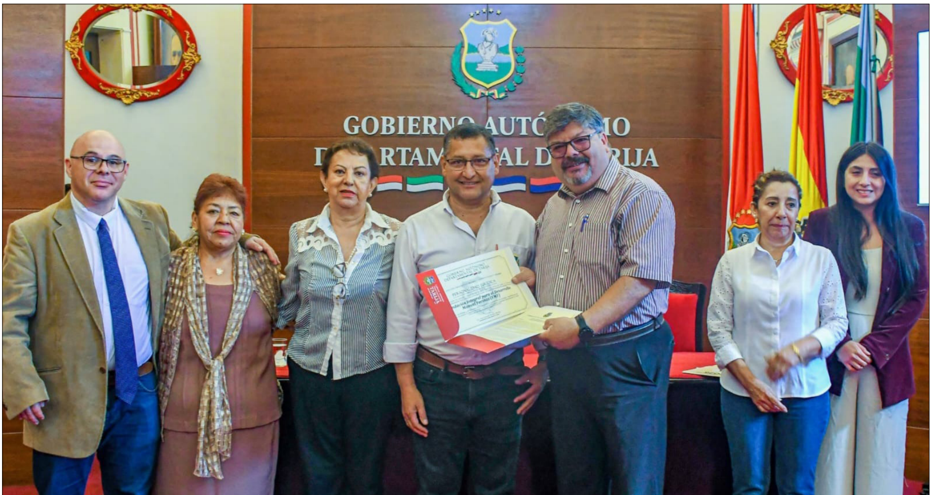
GOBERNACIÓN ENTREGÓ PERSONERÍAS JURÍDICAS EN DÍA DEL VOLUNTARIADO.

La crisis de la entidad se agudiza a diario