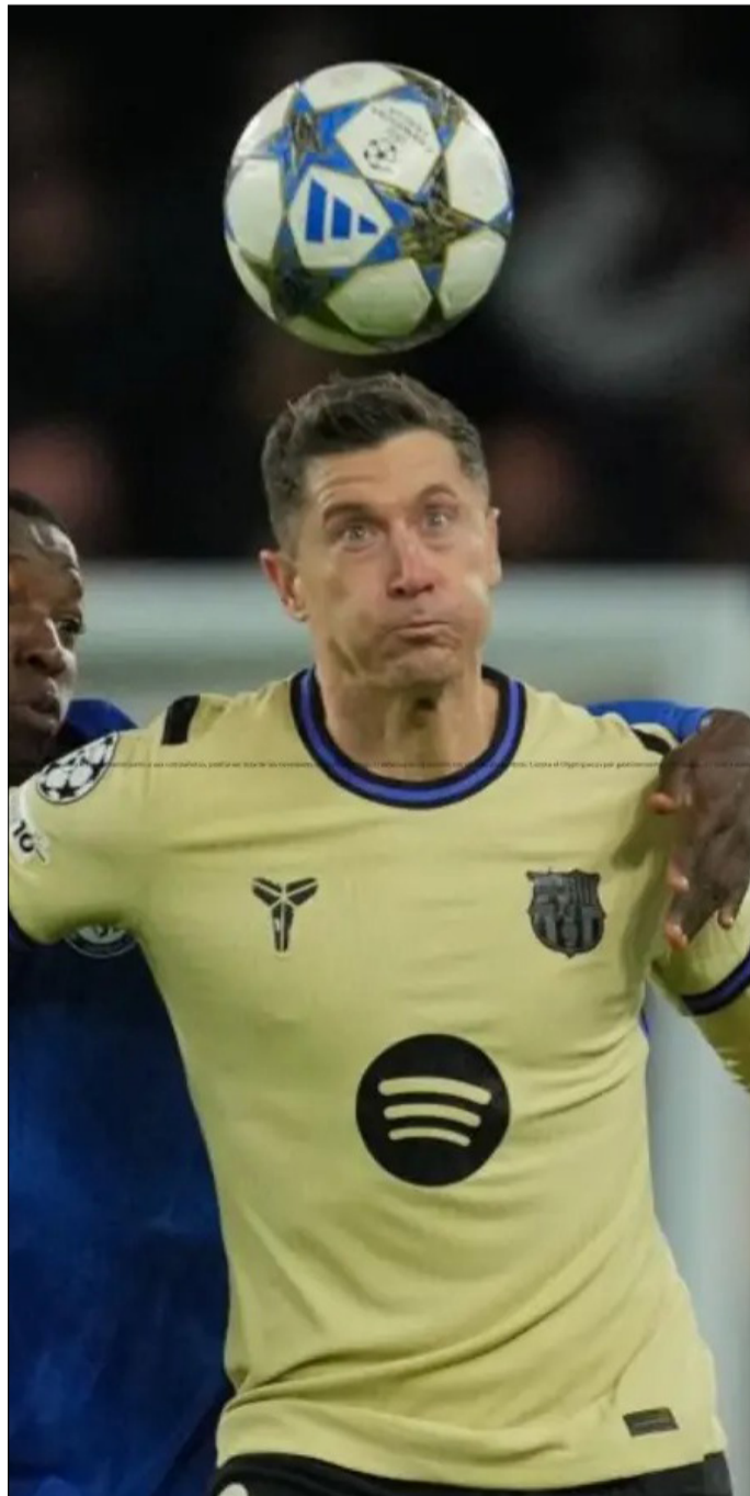
LEWANDOWSKI, DURANTE UN ENCUENTRO DE CHAMPIONS.