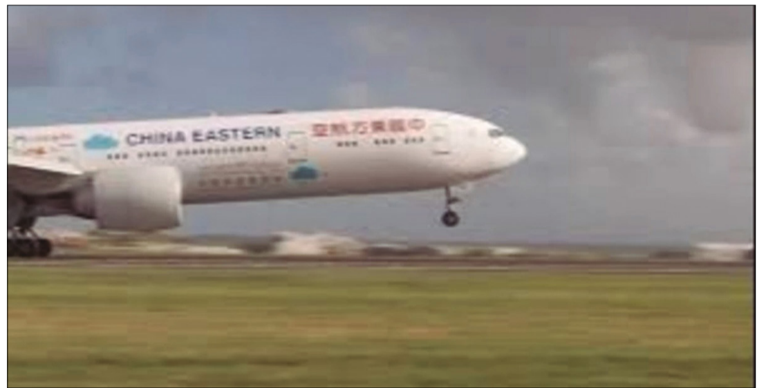
AVIÓN ES OPERADO POR CHINA EASTERN AIRLINES