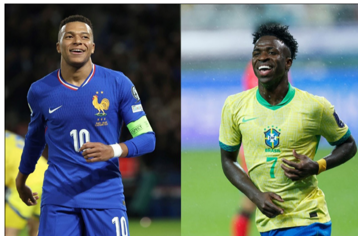
FRANCIA Y BRASIL, DOS CANDIDATOS AL MUNDIAL 2026.