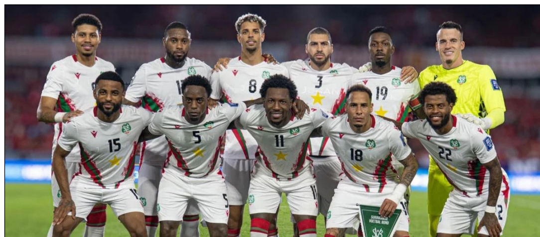
PLANTEL TITULAR DE LA NATIO DURANTE UN PARTIDO DE ELIMINATORIA.