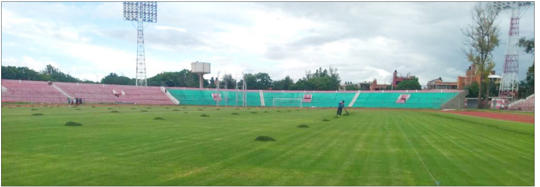
EL CORTE DEL CÉSPED DEL ESTADIO IV CENTENARIO DE LA CAPITAL TARIJEÑA.