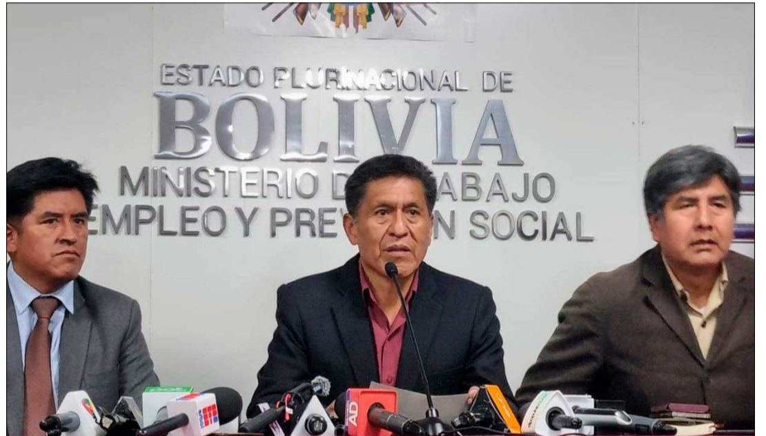
EL MINISTRO DE TRABAJO BRINDÓ LA INFORMACIÓN.