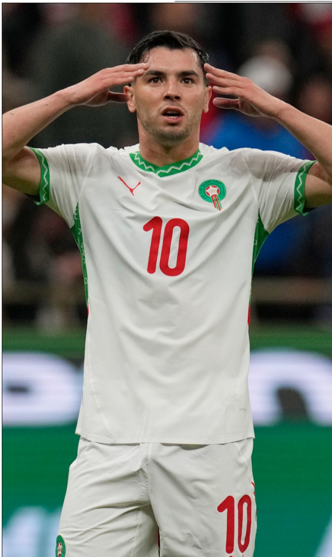
BD, TRAS SU GOL.