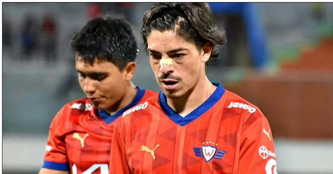
WILSTERMANN ESPERA MANTENERSE EN PRIMER DIVISIÓN LA PRÓXIMA TEMPORADA, ALGO QUE POR AHORA PARECE MUY COMPLEJO.

Se prevé que este martes se lleve a cabo el Consejo Superior de la FBF, reunión en la que se abordarán temas clave como los sistemas de campeonato y el calendario oficial de la temporada 2026.