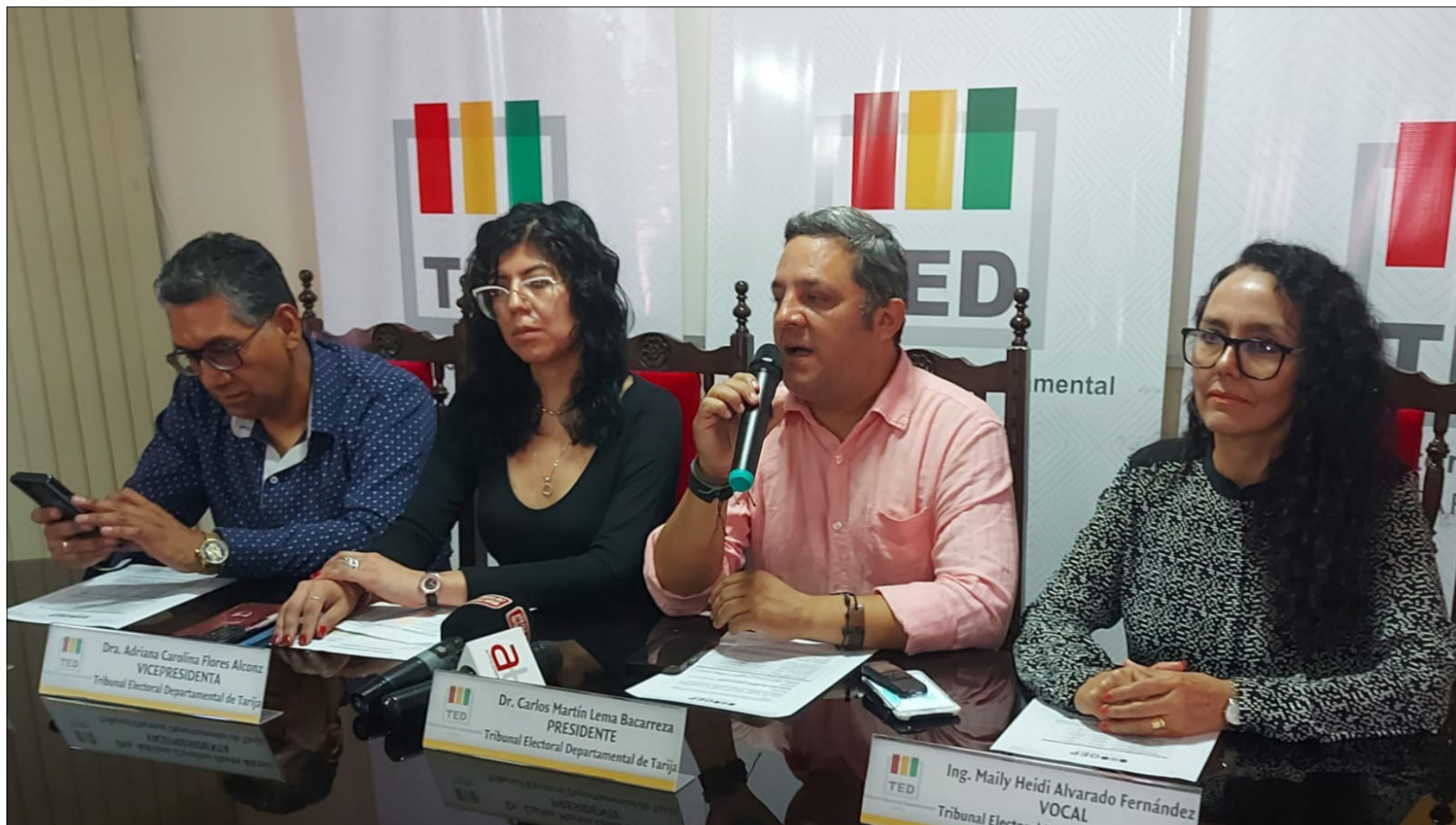
ASÍ SE PRESENTARON LOS NUEVOS VOCALES ELECTORALES.

Se trata de cuatro nuevas autoridades que retomaron el calendario electoral y todas las actividades iniciadas por sus antecesores.