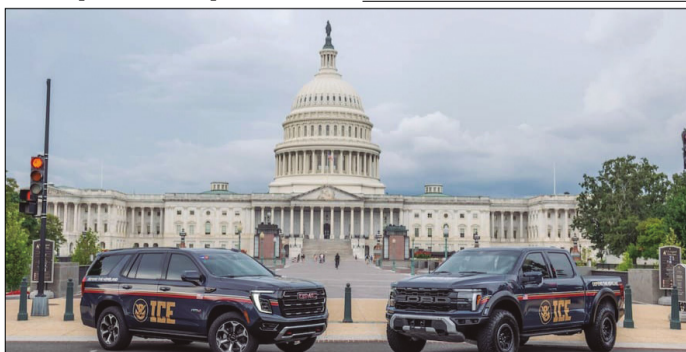
LA NUEVA TÁCTICA DEL ICE TUVO EFECTOS DIRECTOS EN LA CANTIDAD Y EL TIPO DE ARRESTOS REALIZADOS EN TODO ESTADOS UNIDOS