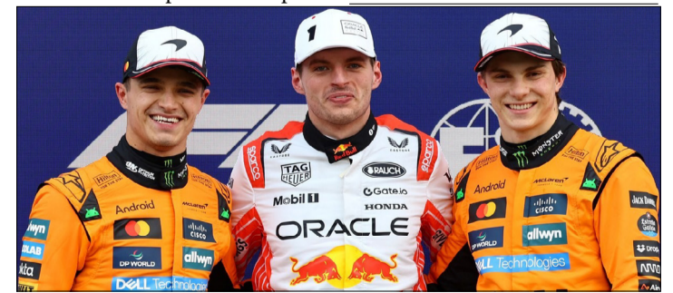
LA DECISIÓN DE LOS JEFES DE EQUIPO ESTUVO ENTRE NORRIS Y VERSTAPPEN. PIASTRÍ, OTRO DE LOS MÁS ELEGIDOS.