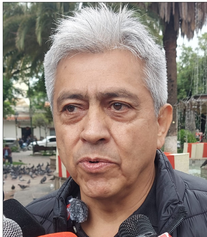
CANDIDATO A GOBERNADOR, MARIO COSSÍO CORTEZ.

ideas”, afirmó al admitir que decidir volver a la política electoral no fue fácil. Confirmó que su agrupación no tiene candidato a alcalde municipal en Cercado.