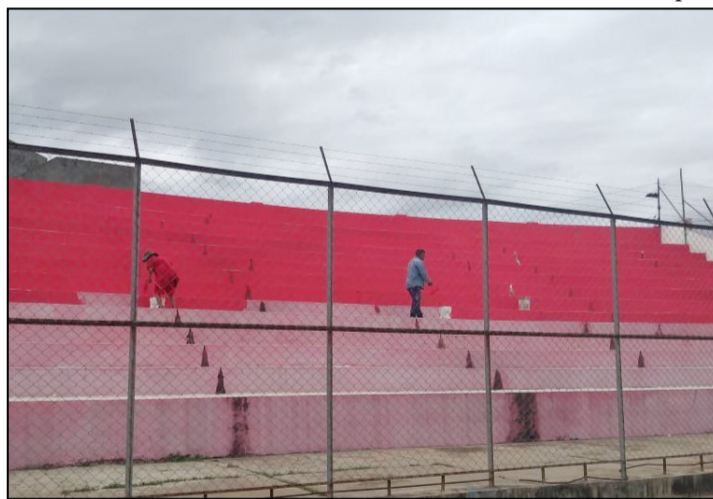
PERSONAL DEL SEDEDE REALIZA EL PINTADO DE LAS TRIBUNAS DEL ESTADIO.

El 25 de enero, el seleccionado nacional se enfrentará a México en el estadio Ramón Tahuichi Aguilera de Santa Cruz y el tercer partido amistoso será el 31 de enero con la selección de República Dominicana, el escenario también será el estadio Tahuichi Aguilera.