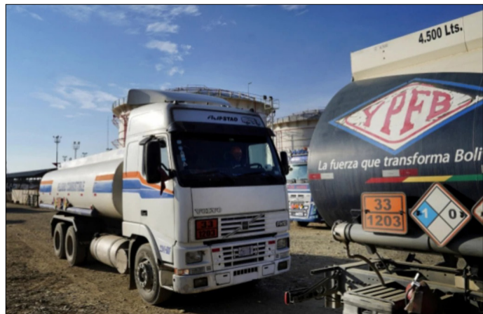
LA PROCURADURÍA INTENSIFICA LOS TRABAJOS DE AUDITORÍA EN EL CASO BOTRADING