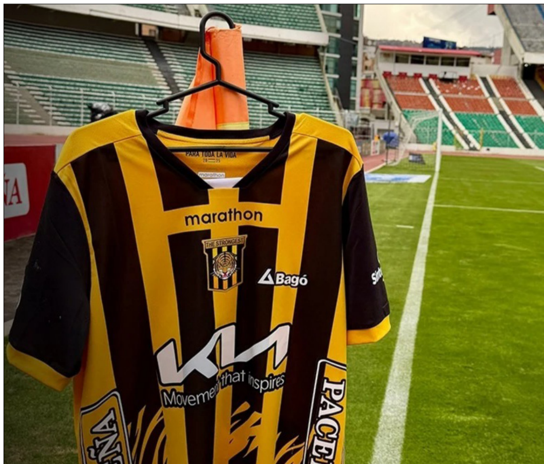
EL TIGRE YA PIENSA EN LA TEMPORADA 2026.