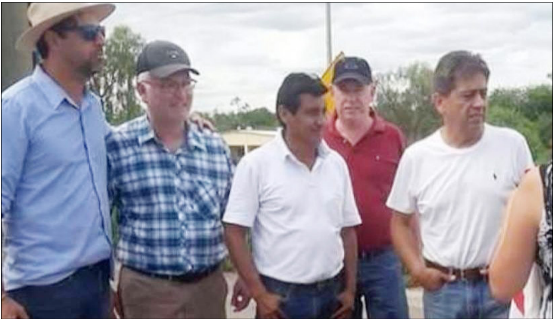
EL EX GOBERNADOR VOLVIÓ A ADENTRARSE EN LA ARENA POLÍTICA.

Prácticamente dio inicio a la contienda política