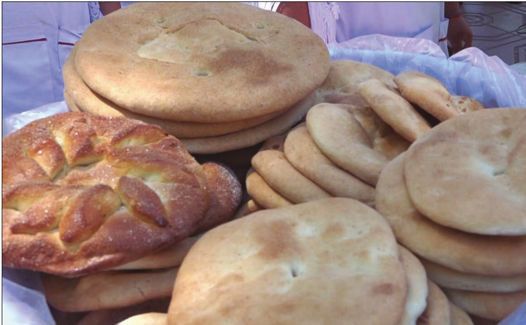
EL PRECIO DEL PAN TENDRÍA QUE BAJAR O AUMENTAR SU GRAMAJE.

Los precios actuales del pan se colocaron cuando el quintal de harina estaba en 320 bolivianos, ahora está en 240, confirmó el intendente municipal, Carlos Camacho.