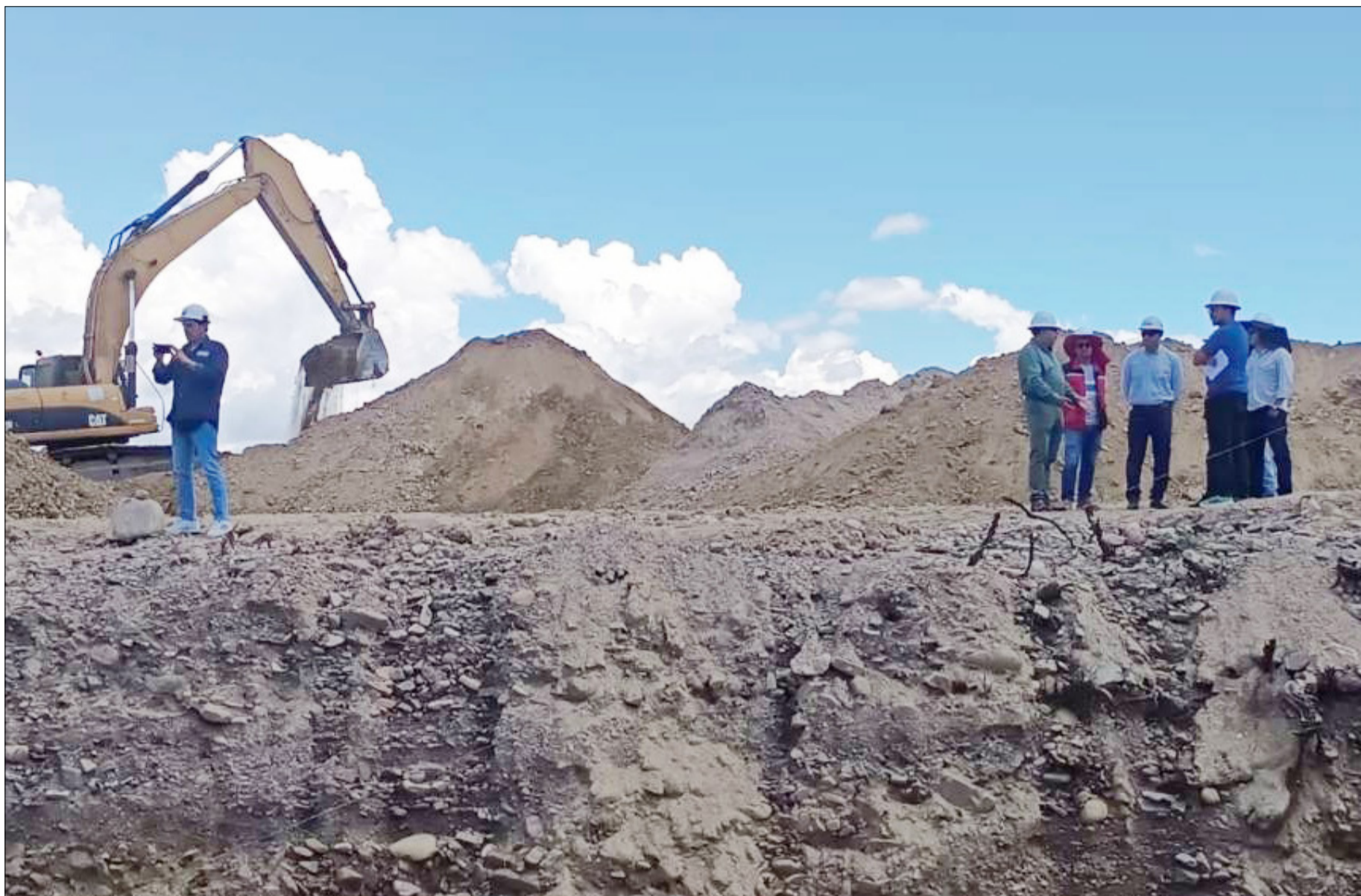
ASÍ CONSTRUYERON LOS PUENTES EN LA SEGUNDA CIRCUNVALACIÓN

La vía será habilitada por administración directa