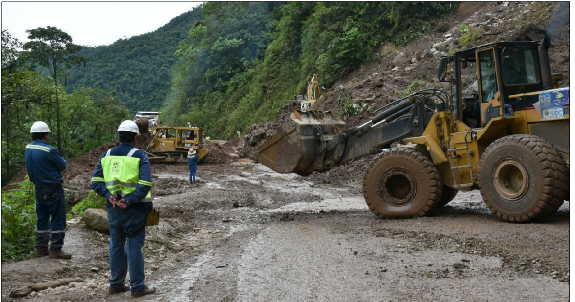
NO TODO EL PRESUPUESTO PARA EL PLAN LLUVIAS FUE DESEMBOLSADO.

Es un presupuesto heredado de la anterior gestión