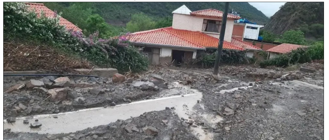
DESPLAZAMIENTO EN LA CARRETERA CHUQUISACA - COCHABAMBA POR INTENSAS LLUVIAS. RRSS.