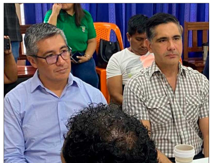
ESPINOZA Y JUSTINIANO ESTUVIERON EN SANTA CRUZ.