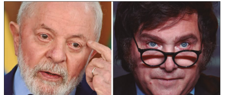
EL PRESIDENTE DE BRASIL, LUIZ INÁCIO LULA DA SILVA, Y EL PRESIDENTE ARGENTINO JAVIER MILEI