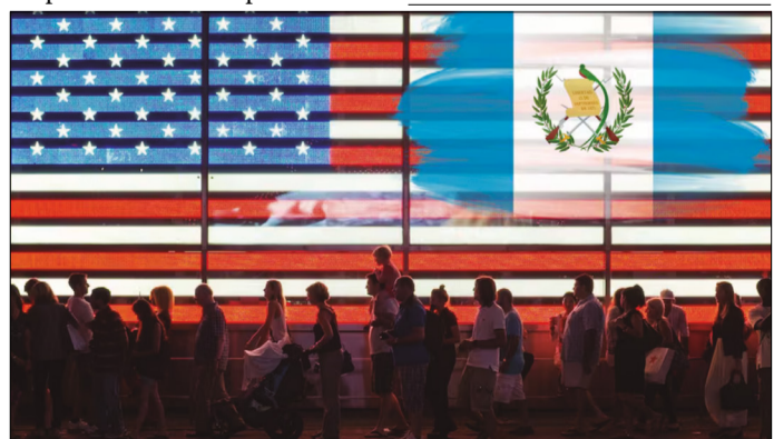
SIETE PAÍSES, INCLUIDO GUATEMALA, SERÁN AFECTADOS POR EL FIN DEL PAROLE QUE IMPODRÁ LA ADMINISTRACIÓN DE DONALD TRUMP A PARTIR DE 2026