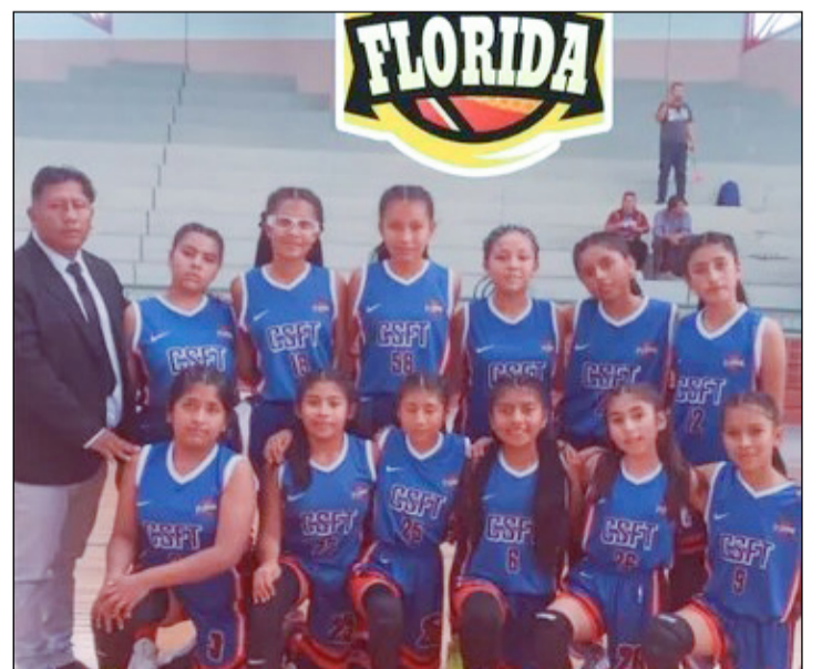
JUGADORAS DEL CLUB SPORT FLORIDA, SE PREPARAN PARA LA FINAL.

La fase final, será una fiesta del básquet formativo en la categoría damas, el talento, la emoción y el desarrollo deportivo; la Liga Boliviana de Basquetbol Menor (Libomenor) U - 12, se consolida como un espacio fundamental para la formación integral de jóvenes deportistas, fortaleciendo las bases del básquetbol femenino boliviano y proyectando a las futuras protagonistas del baloncesto boliviano.