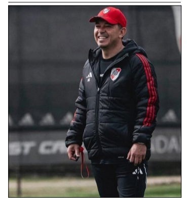
LA SONRISA DE GALLARDO.