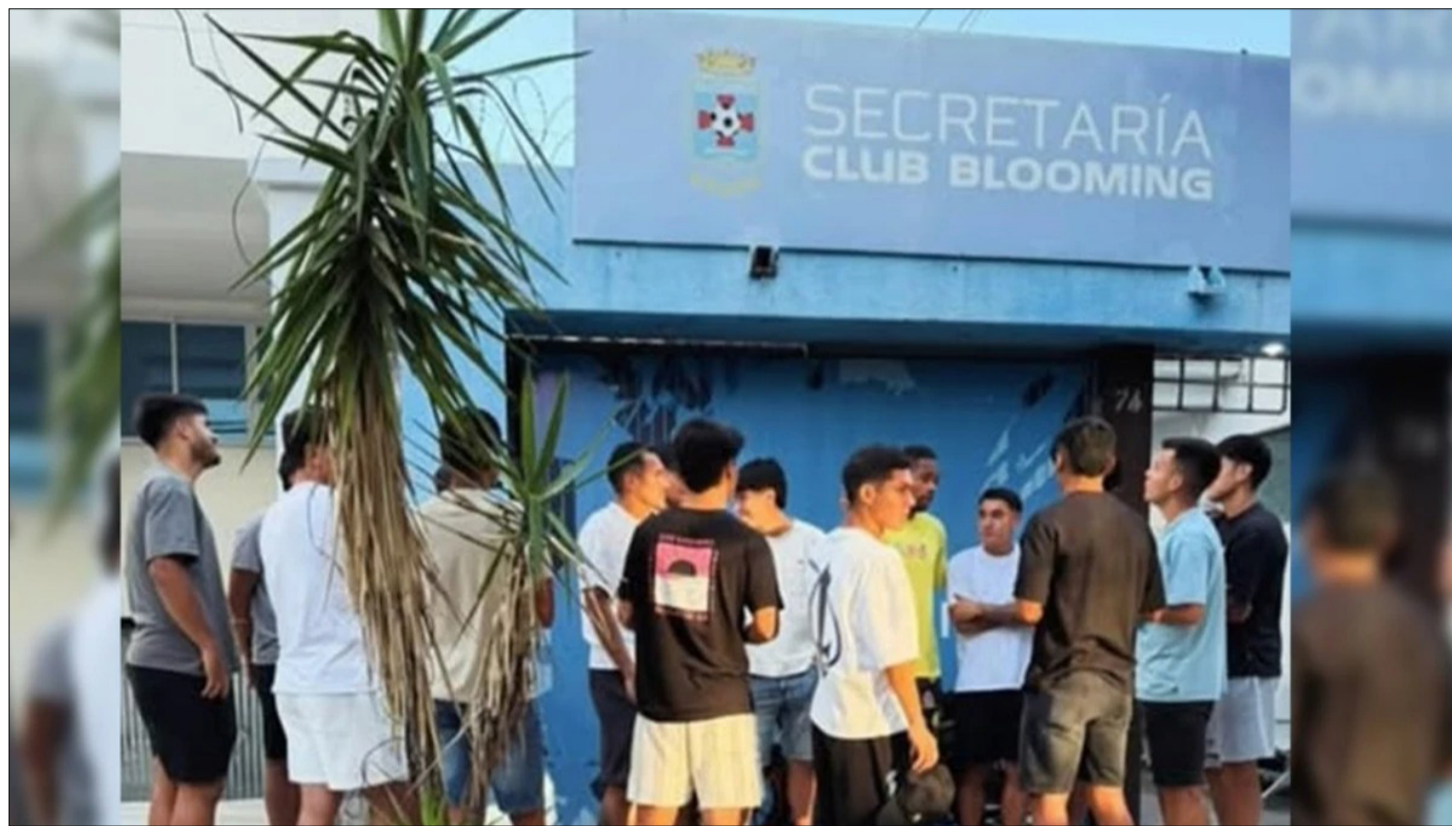
LOS JUGADORES DE BLOOMING NO COBRARON LA TARDE DEL VIERNES.