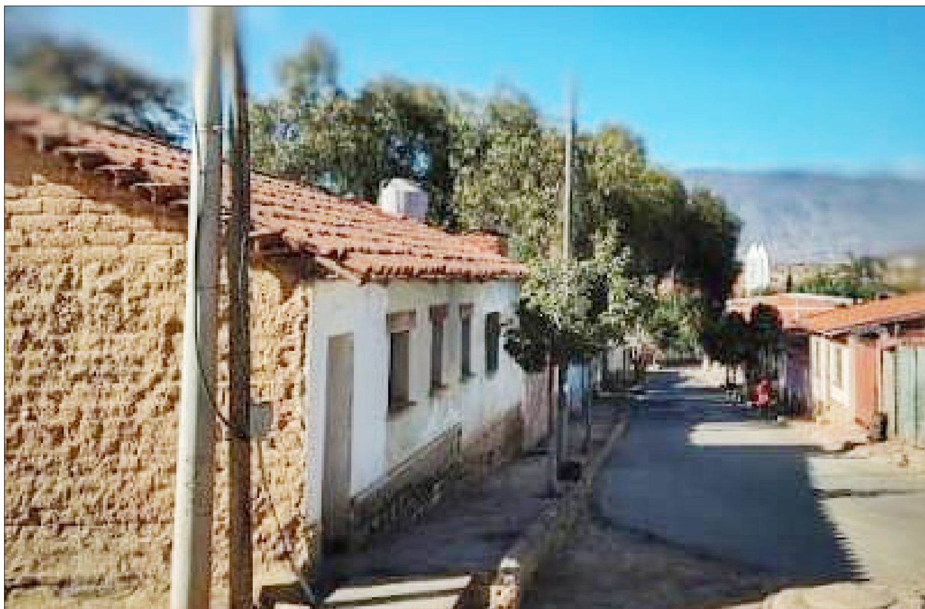
FEJUVE SE SUMÓ AL RECHAZO DEL DECRETO GUBERNAMENTAL.

Ya está todo acordado y sellado, revelaron