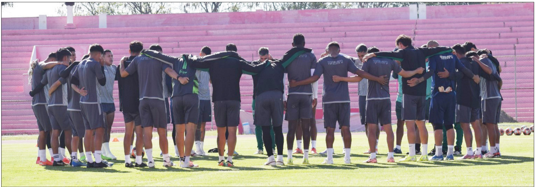
LA DIRIGENCIA DEL CLUB REAL TOMAYAPO, ESTÁ ABOCADO EN EL PROYECTO 2026. (FOTO: ARCHIVO).

División Profesional del fútbol boliviano