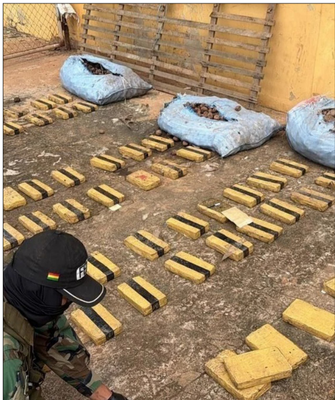
DROGA SEQUESTRAADA POR LA FELCN