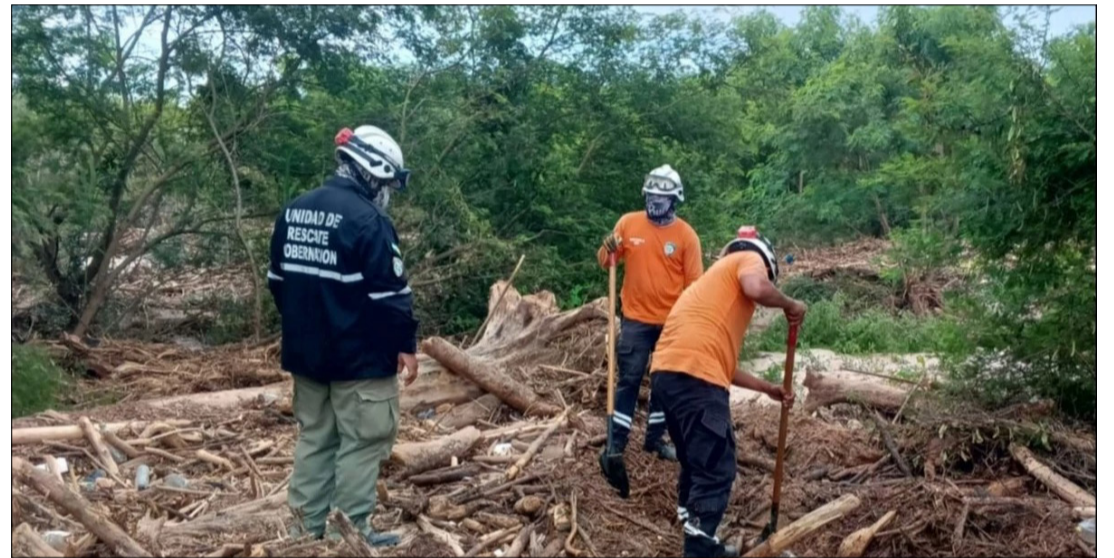
RESCATISTAS ENCUENTRAN EL CUERPO DE UNA PERSONA EN LA ZONA DE VALLE SÁNCHEZ