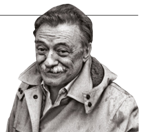
Mario Benedetti 1920-2009. Escritor y poeta uruguayo.

“ La propaganda es una formidable vendedora de sueños, pero resulta que yo no quiero que me vendan sueños ajenos, si no sencillamente que se cumplan los míos.....”