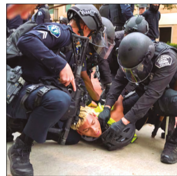
LOS DETENIDOS ENFRENTAN CARGOS FEDERALES EN SU CONTRA, LAS AUTORIDADES SIGUEN BUSCANDO A LOS PRÓFUGOS