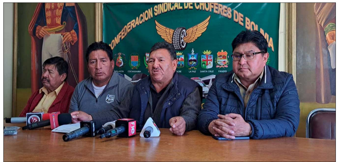
LOS CHOFERES SE PRONUNCIARON ESTE VIERNES.