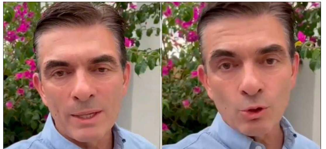
PUBLICÓ UN VIDEO CON SU POSICIÓN.