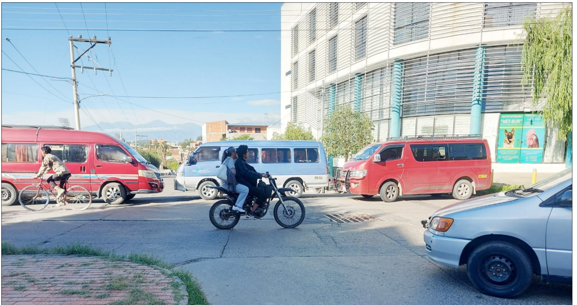
UNA FACETA DEL BLOQUEO DE CALLES Y AVENIDAS POR EL TRANSPORTE DE TARIJA.