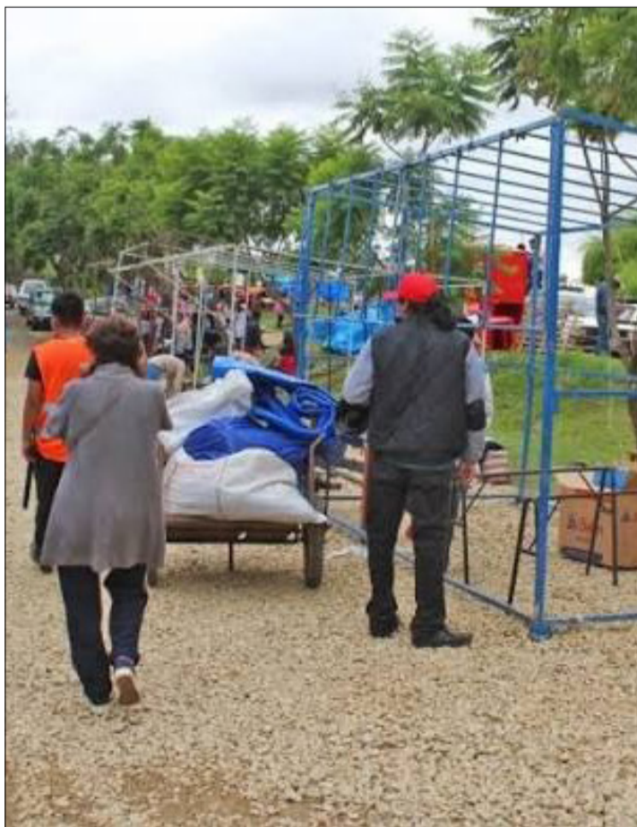
CONFIRMARON LA FERIA NAVIDEÑA.