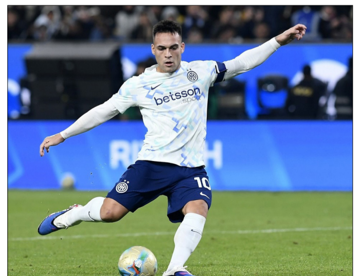
EL PENAL DE LAUTARO MARTINEZ PARA EL INTER ANTE EL BOLOGNA