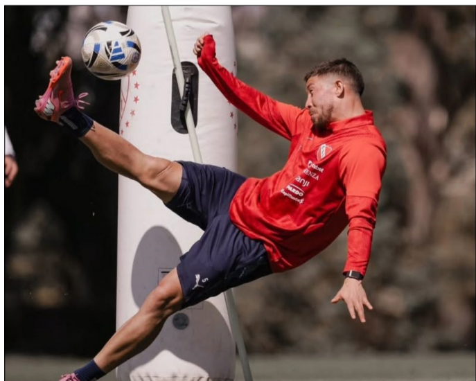
LOYOLA, BUSCADO DESDE BRASIL. PRENSA INDEPENDIENTE