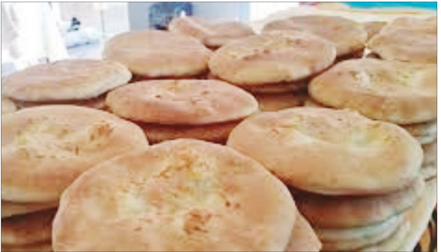
EL PRECIO DEL PAN, SIN VARIACIONES POR AHORA.

Prevén ampliado departamental la próxima semana