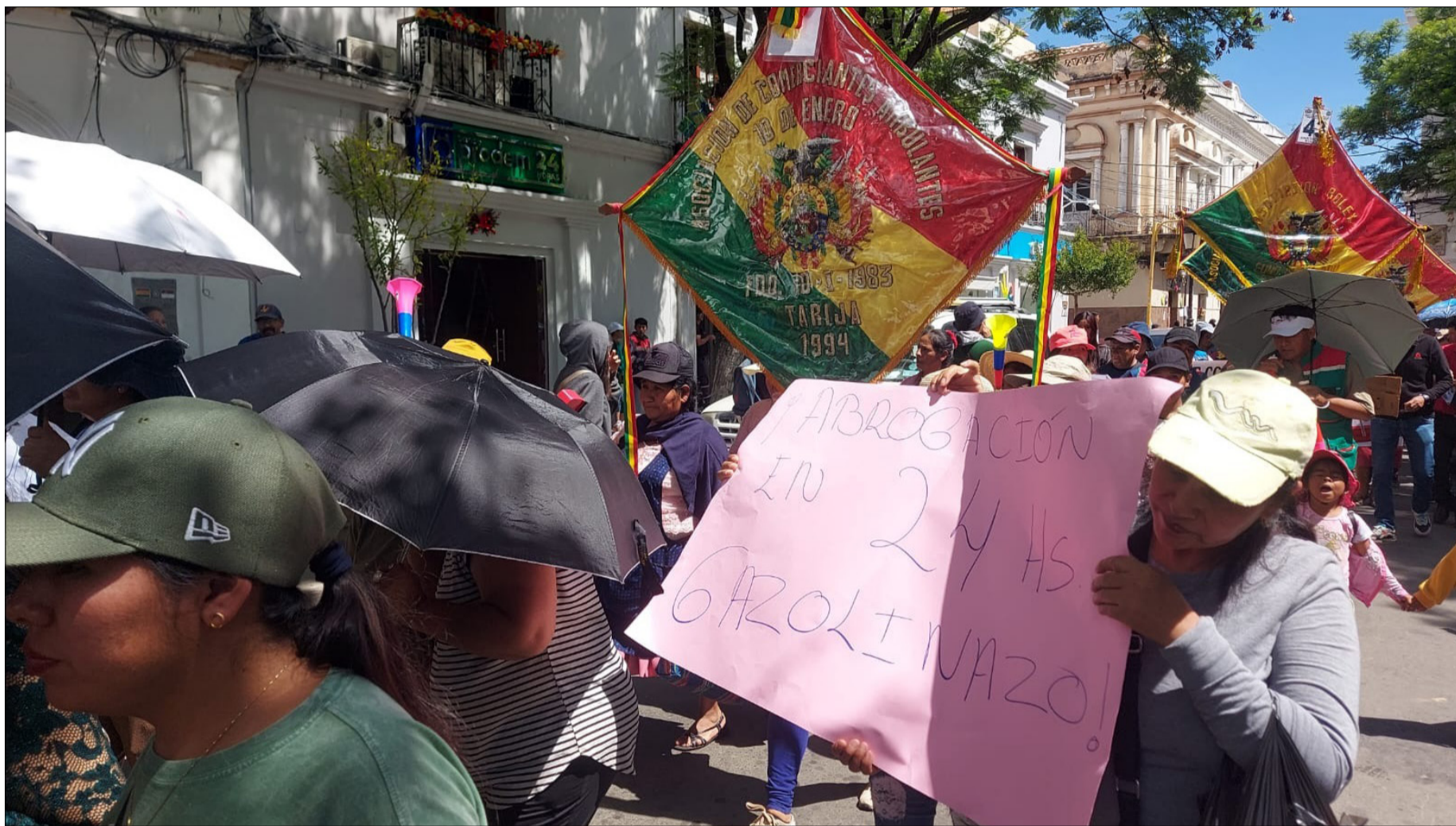
GREMIALISTAS SE PRONUNCIARON CONTRA EL DECRETO 5503.