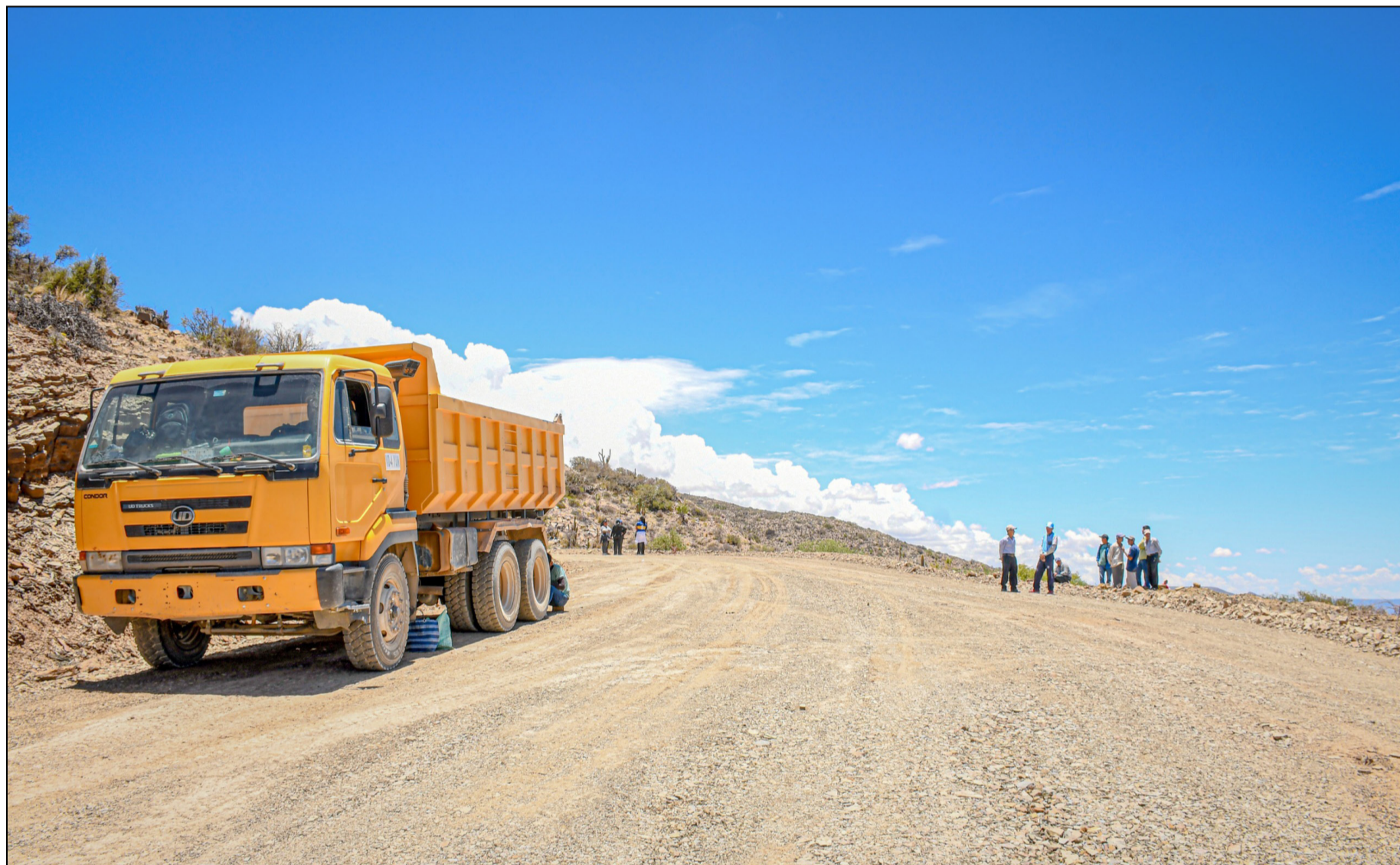
UNA PARTE DEL CAMINO ENTREGADO EN LA ZONA ALTA.

La inauguración se dio en la zona alta de Tarija, donde se destacó la integración y la mejora de las condiciones para sacar los productos al mercado. Habló el gobernador Oscar Montes.