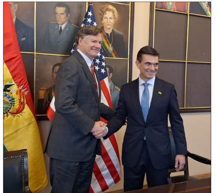
LANDAU EN SU VISITA A BOLIVIA EN NOVIEMBRE.