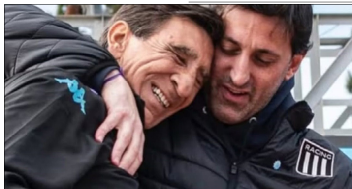
COSTAS SEGUIRÁ EN RACING.