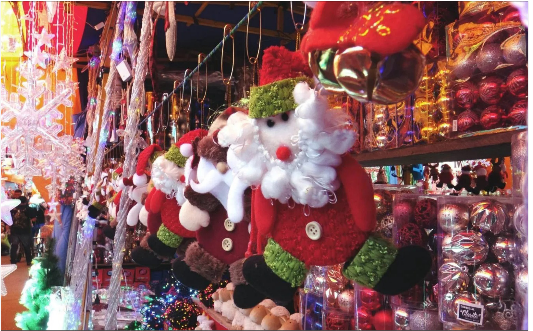
FERIANTES ANUNCIAN REBAJAS EN NUEVA VERSIÓN DE LA FERIA.