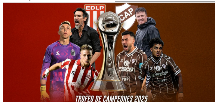
LA FINAL DEL TROFEO DE CAMPEONES ENTRE ESTUDIANTES Y PLATENSE.