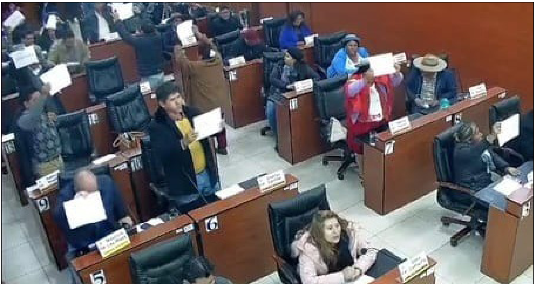
EL LEGISLATIVO AÚN ESPERA REDUCIR EL NÚMERO DE SUS MIEMBROS.

Dieron a entender que habría una posibilidad