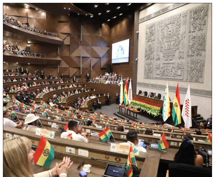
SESIÓN EN EL HEMICICLO DEL LEGISLATIVO.