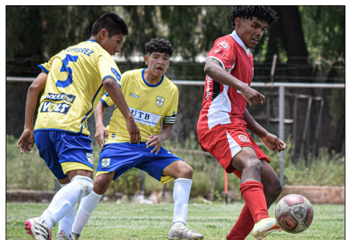
EL CUADRO DE ABB, QUIERE SACAR VENTAJA EN EL PRIMER PARTIDO. (FOTO: ARCHIVO).

la diferencia de gol, si mantienen el empate, se definirá a los clasificados mediante la tanda de los penales.