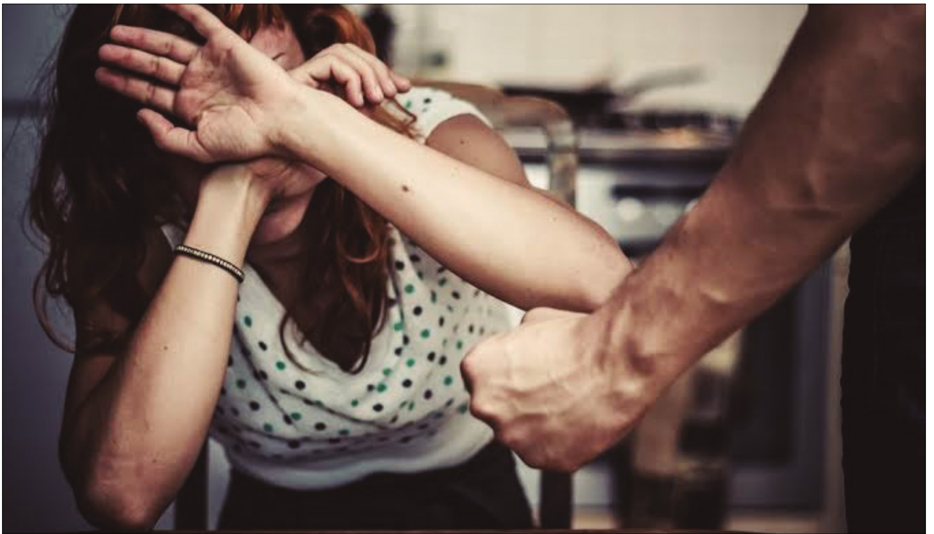
LA VIOLENCIA CONTRA LA MUJER SIGUE CON NÚMEROS MUY ALTOS.

Mucha legislación está quedando en el papel