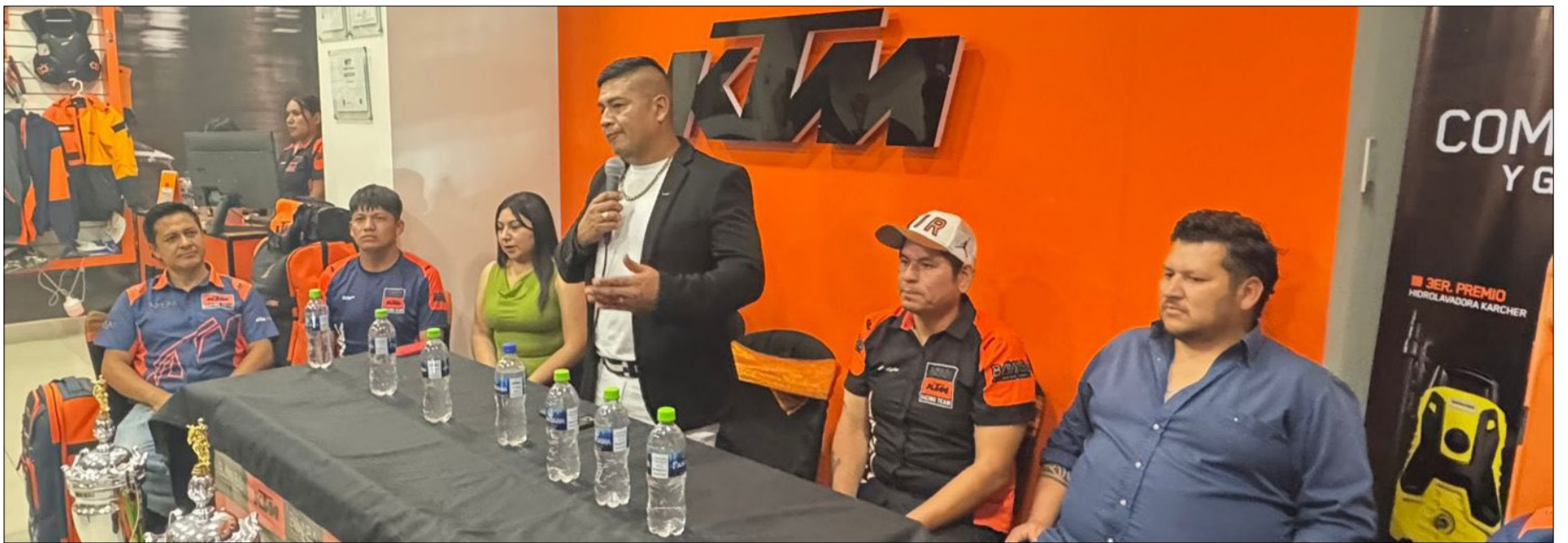
LA PRESENTACIÓN A CARGO DE KTM TARIJA – BAMBA MOTORSPORT.