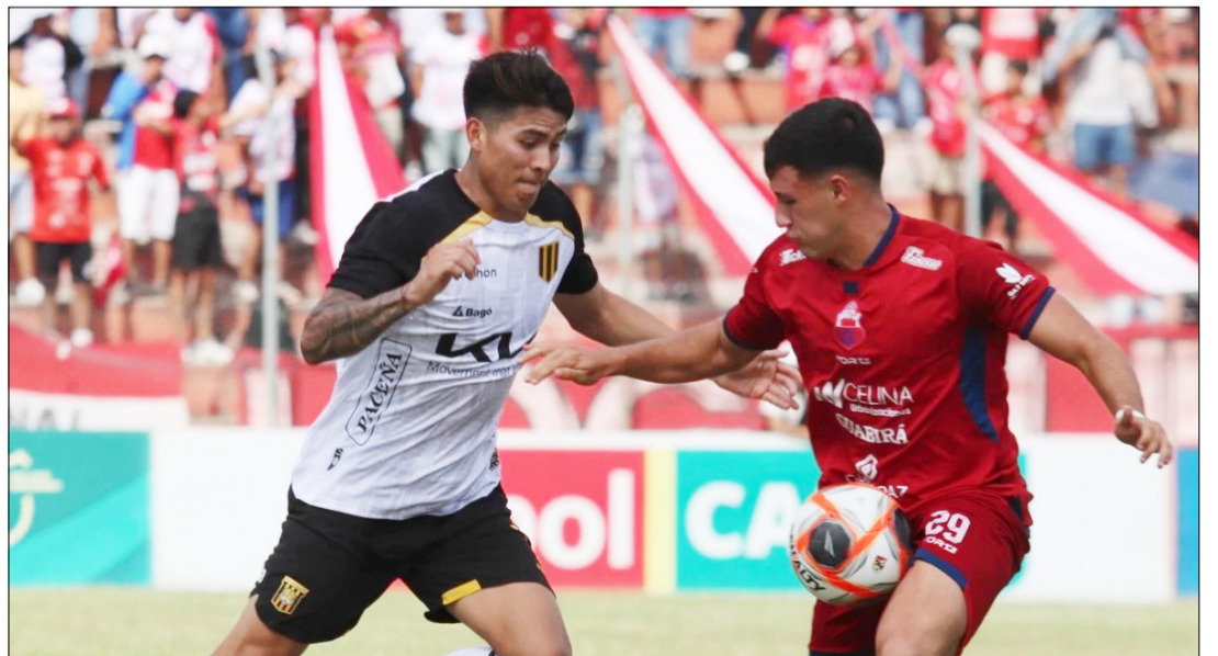
INCIDENCIAS DEL PARTIDO EN EL ESTADIO GILBERTO PARADA.