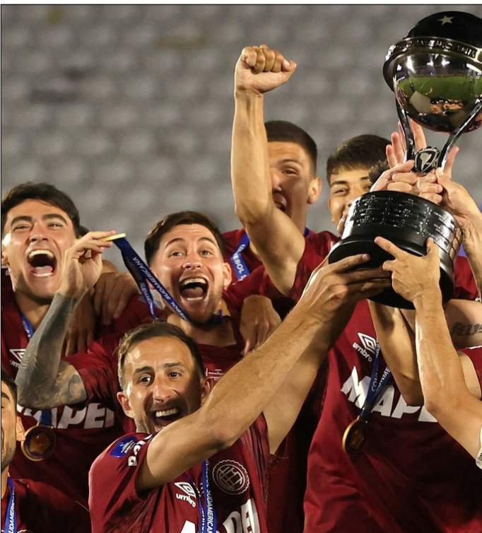
LANÚS SE QUEDÓ CON 9.845.000 DÓLARES TRAS DERROTAR A MINEIRO.