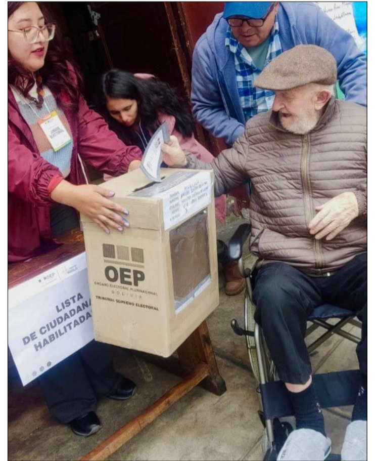
JORNADA DE VOTACIÓN DELAS ELECCIONES GENERALES DE 2025.