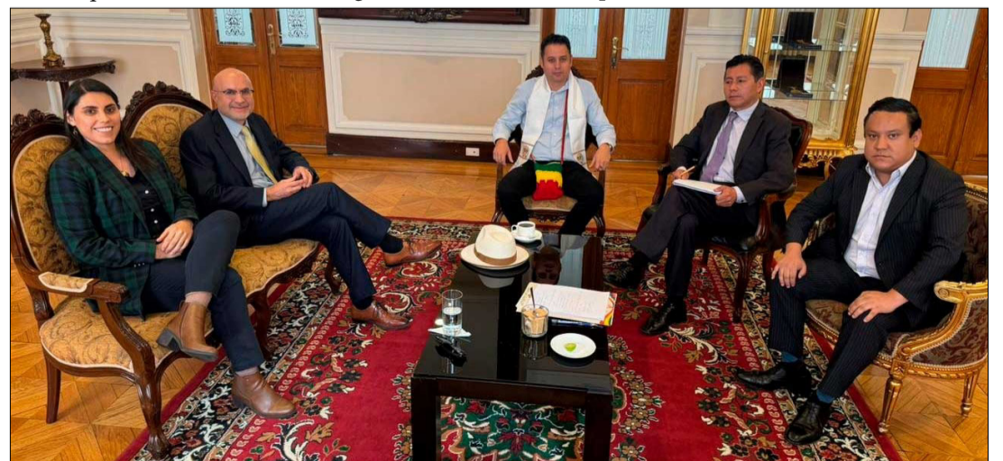
LA FOTO COMPARTIDA POR EL MINISTERIO DE LA PRESIDENCIA.