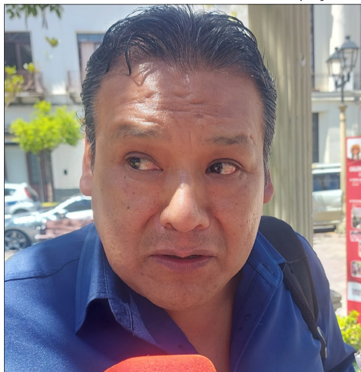
VOCERO DE LA CADENA UVA, VINO Y SINGANI.

al indicar que con ese financiamiento ampliarían la frontera agrícola a 10 mil hectáreas en el valle central de Tarija, que inci-