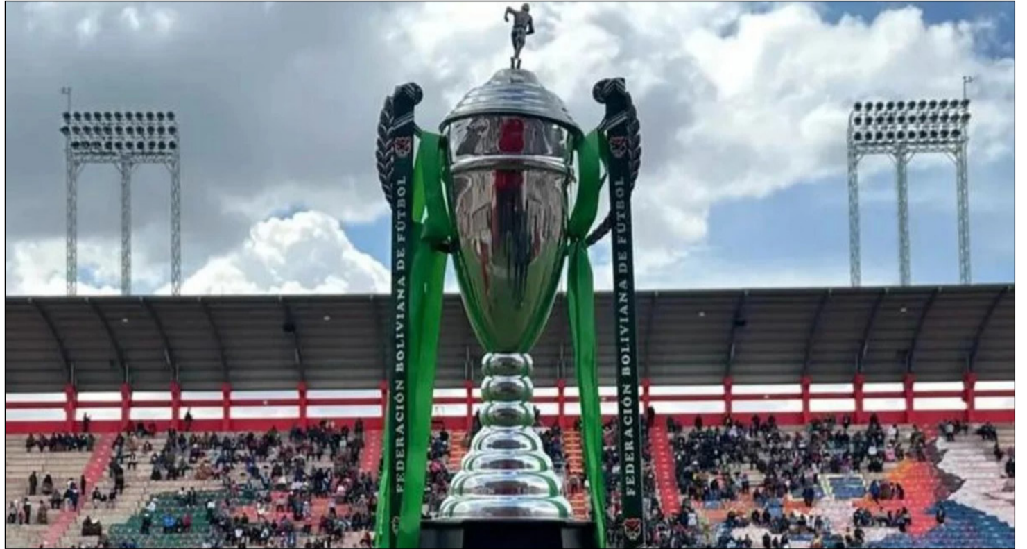
EL TROFEO DE LA COPA SIMÓN BOLÍVAR QUE SE ENTREGARÁ AL CAMPEÓN 2025.