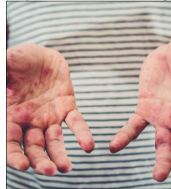
EL VIRUS CON MÁS CAPACIDAD DE DISEMINACIÓN ES EL SARAMPIÓN

A los dos días, emprendieron el viaje de regreso a Uruguay y lo hicieron por tierra, en ómnibus de larga