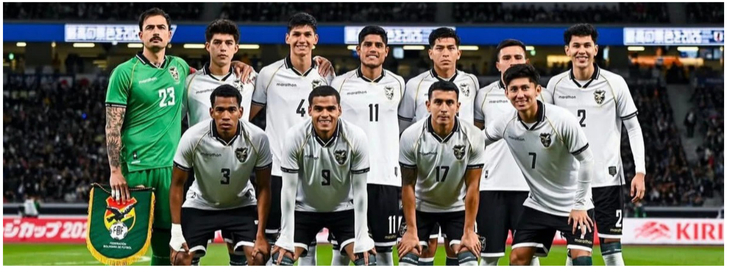
BOLIVIA JUGARÁ EN DICIEMBRE EN SUELO PERUANO.