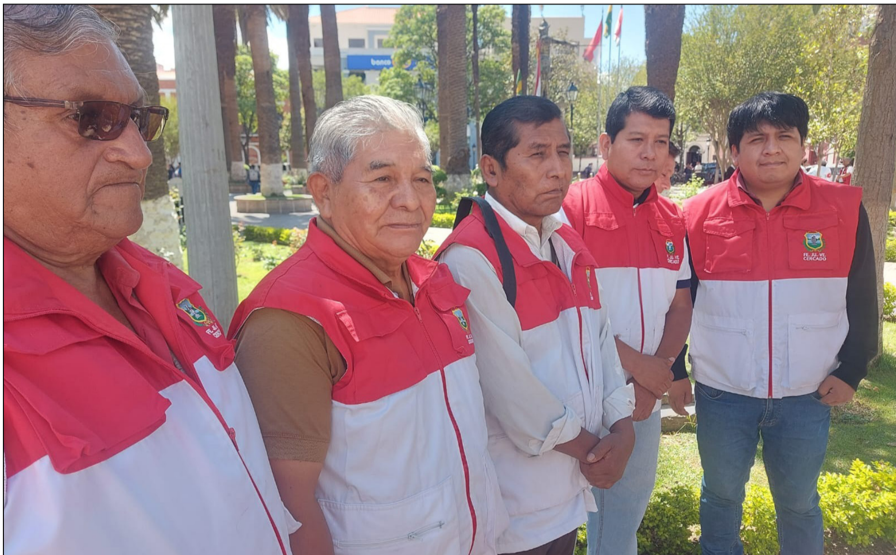
FEJUVE CERCAO PIDIÓ A AUTOPROORROGADOS DEVOLVER SALARIOS DE CASI DOS AÑOS.