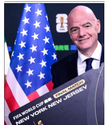
GIANNI INFANTINO, PRESIDENTE DE LA FIFA.