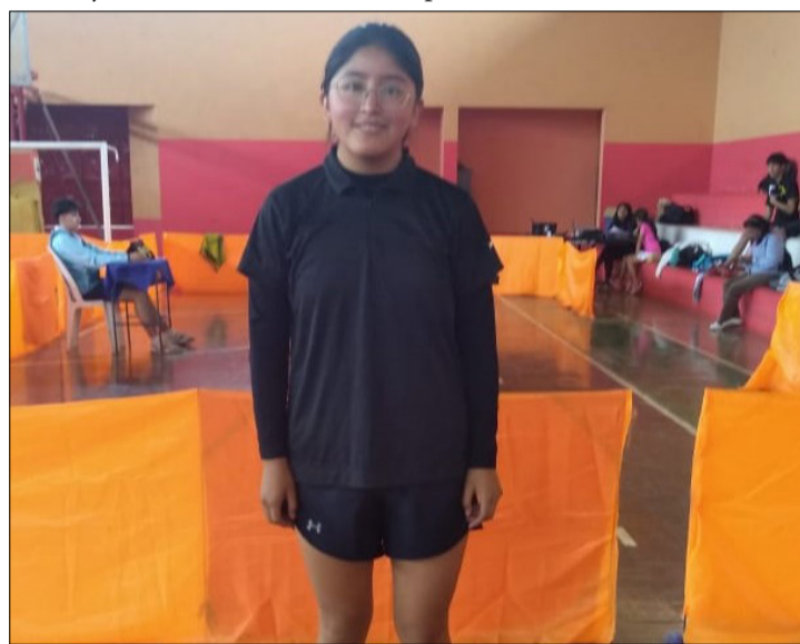
LA TENISMESISTA TARIJEÑA, COMPITIÓ EN EL TORNEO MUNICIPAL DEL FIN DE SEMANA.