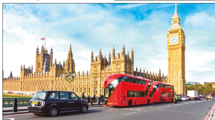
"NO SE TRATA DE UNA FILTRACIÓN MENOR: ES EL DOCUMENTO COMPLETO"