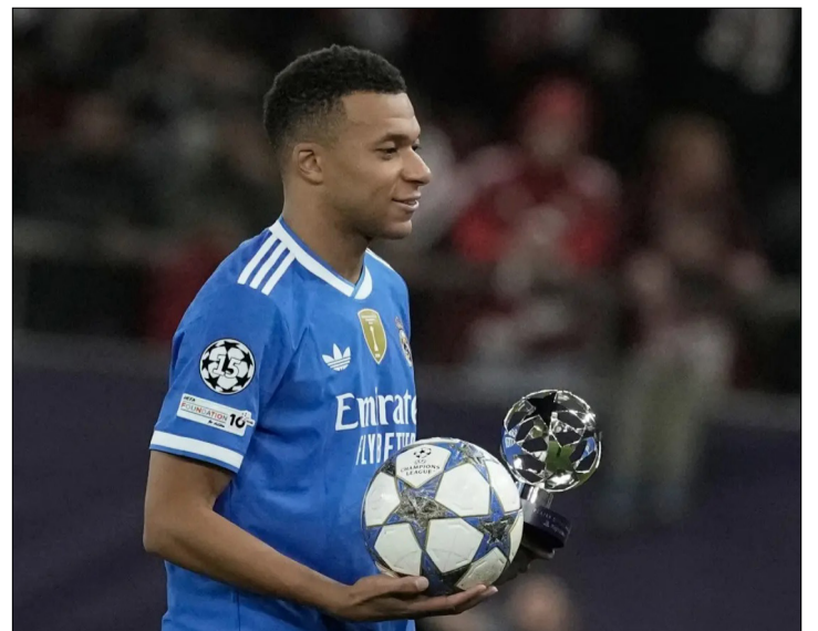
MBAPPÉ, CON EL TROFEO DE MVP DEL PARTIDO Y EL BALÓN TRAS MARCAR CUATRO GOLES.