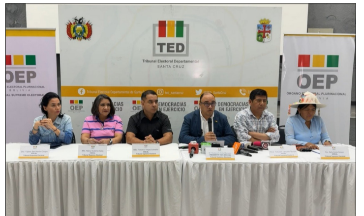
VOCALES DEL TSE EN CONFERENCIA DE PRENSA.