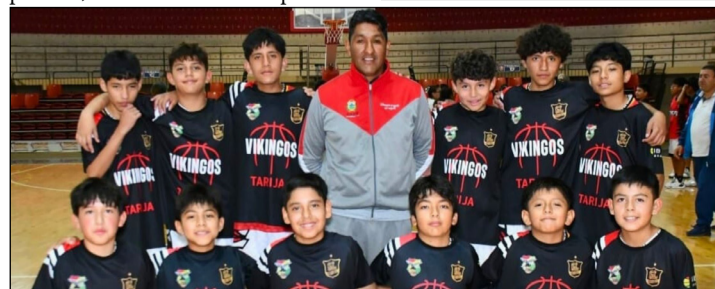
EL PLANTEL DE VIKINGOS, SE PREPARA PARA LA FINAL DE LA LIBOMENOR U – 12.

Chieri de Sucre Vikingos de Tarija Aleman de Oruro Urcupiña de Quillacollo Fortaleza de Sacaba La Salle Cochabamba (Organizador)