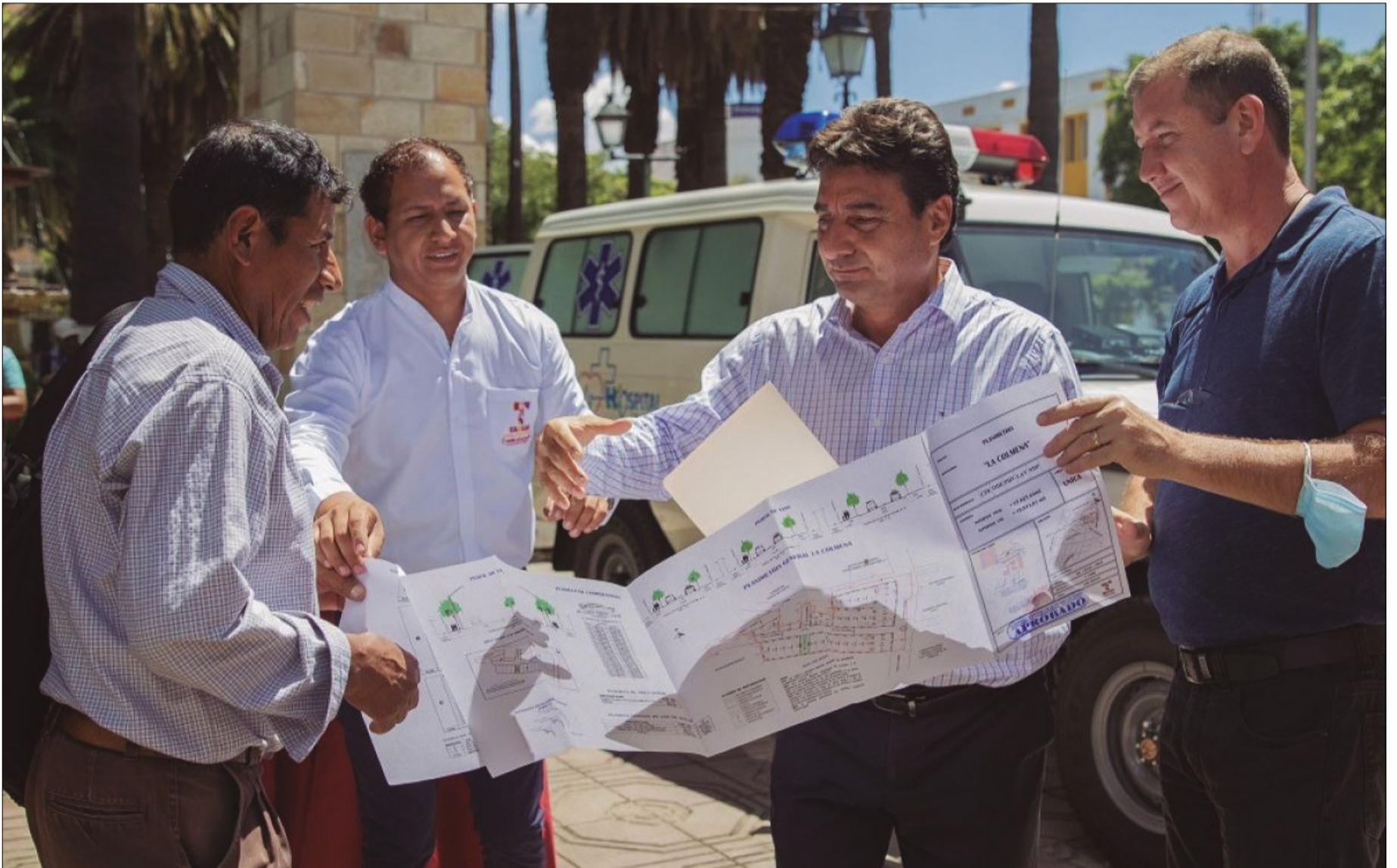
EL ASUNTO DE LAS PLANIMETRÍAS EMPIEZA A GENERAR DUDAS.