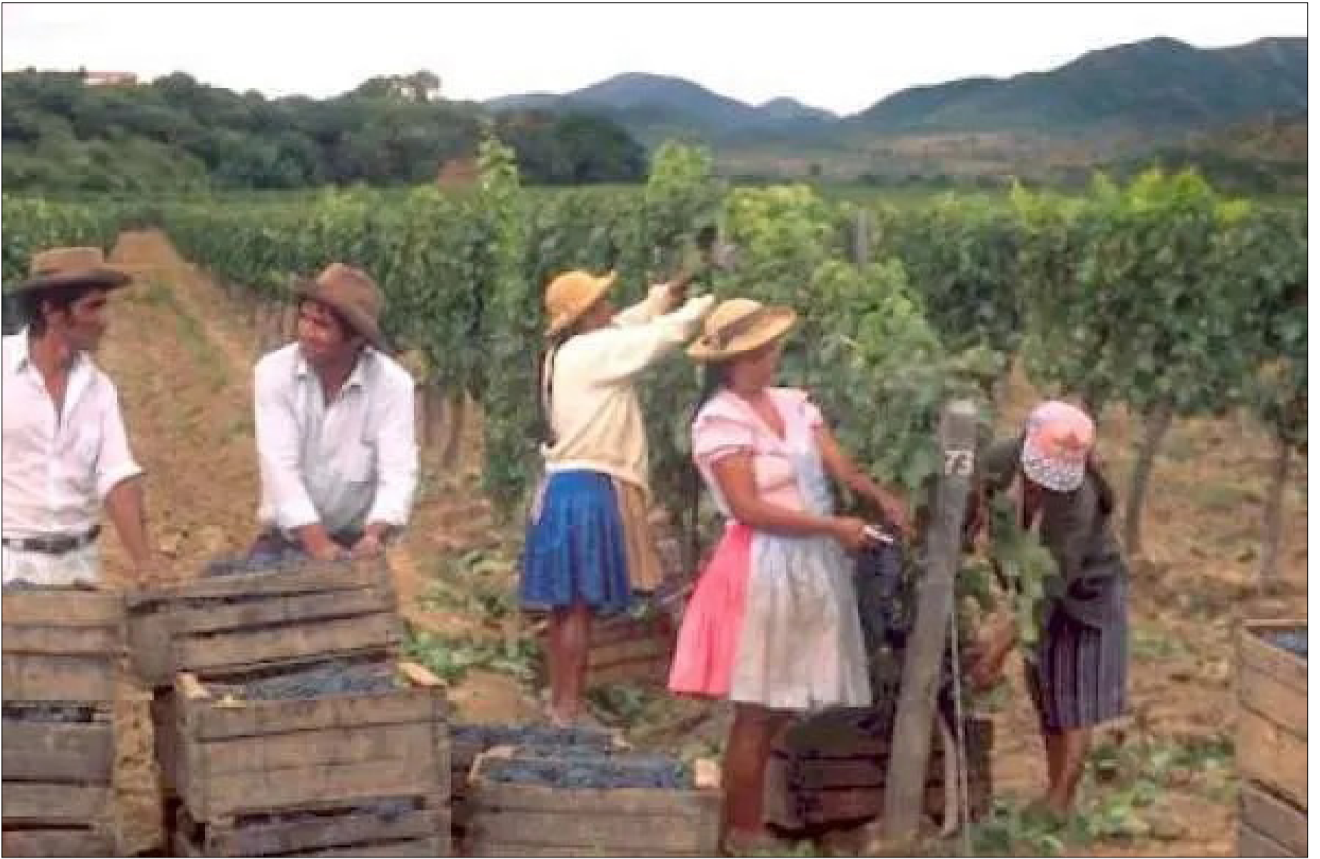
VIÑATEROS ESPERAN LOGRAR RESPUESTAS DE PARLAMENTARIOS.

Esperan presencia de todos los legisladores