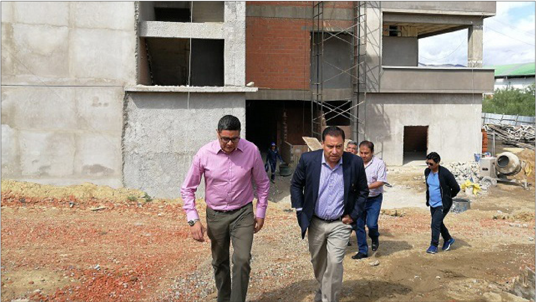
A PESAR DE LAS GESTIONES DESPLEGADAS, EL ONCOLÓGICO SIGUE A MEDIAS.