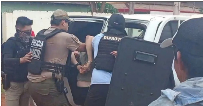
'NEM DA GERUSA' FUE CAPTURADO EL JUEVES EN GUAYARAMERÍN