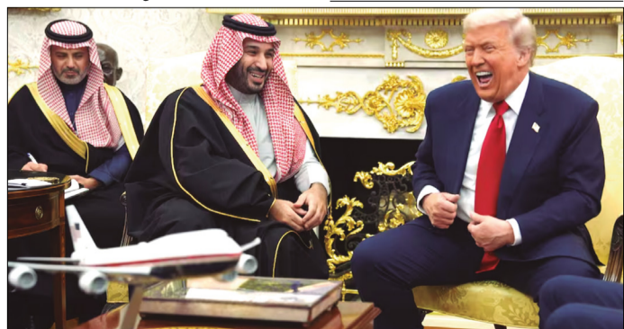
EL PRESIDENTE DONALD TRUMP SE REÚNE CON EL PRÍNCIPE HEREDERO DE ARABIA SAUDITA, MOHAMMED BEN SALMAN