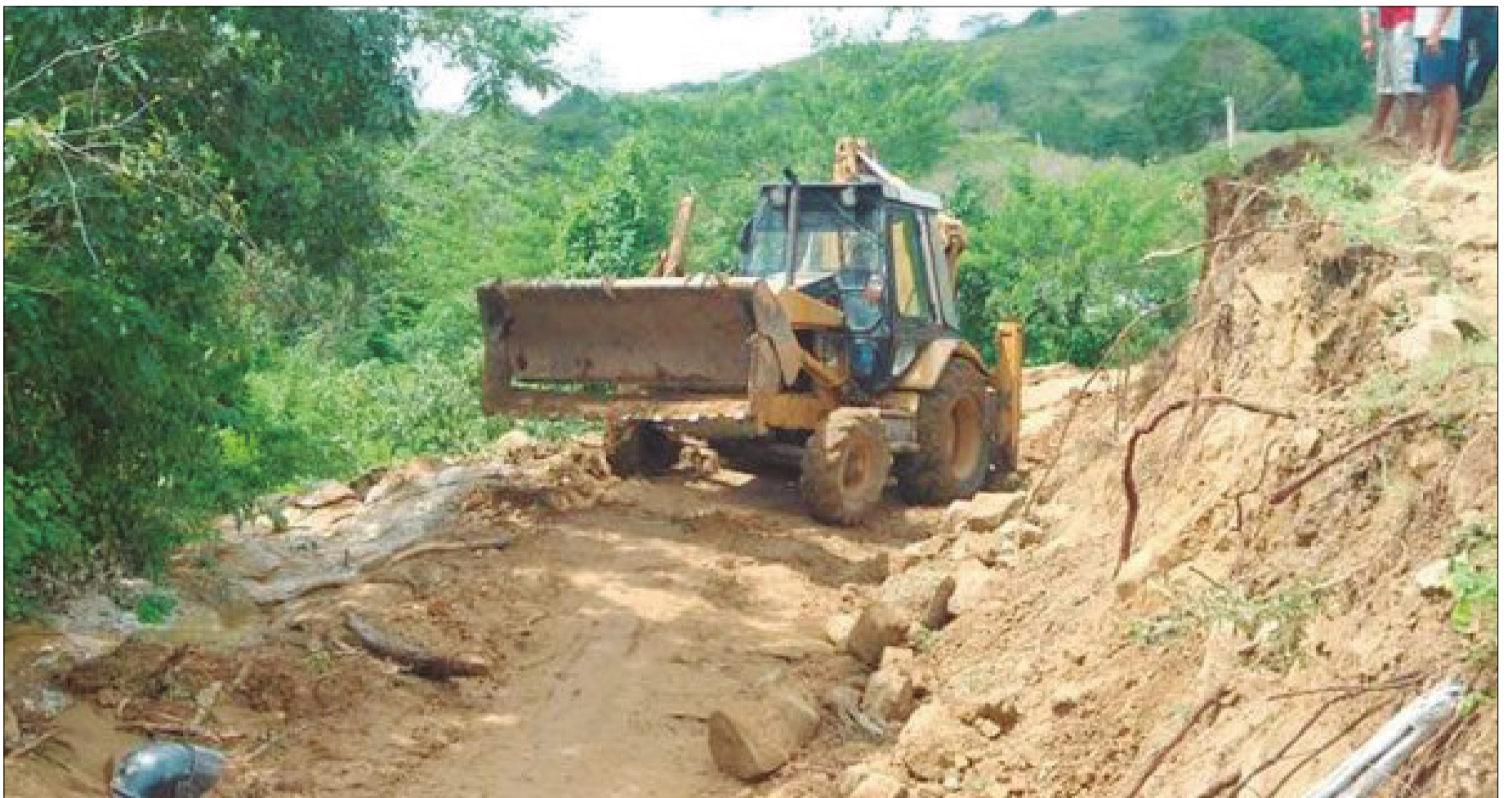
CAMINO CON TRAMOS MUNICIPALES, AHORA ES PARTE DE LA RED VIAL FUNDAMENTAL.

Se irá directo hasta la capital oriental