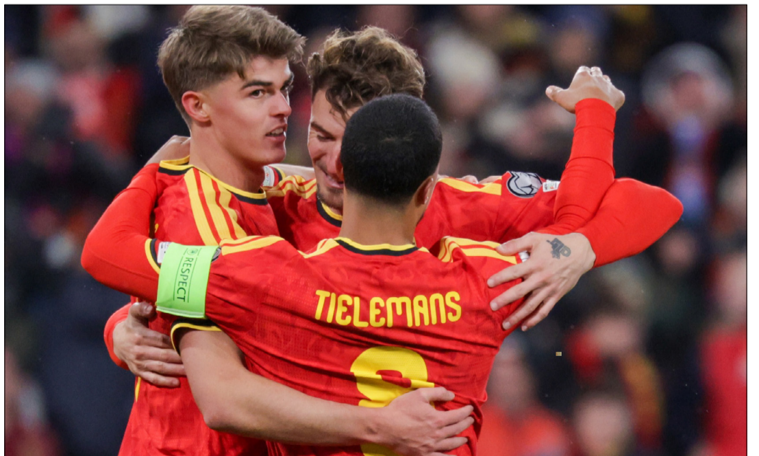
LOS JUGADORES BELGAS DISFRUTAN DEL TRIUNFO.