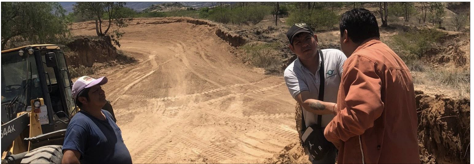
EL CIRCUITO DE MOTOCICLISMO SAN JORGE, ESTÁ HOMOLOGADO PARA LA CARRERA NACIONAL. (FOTO: ASOCIACIÓN).