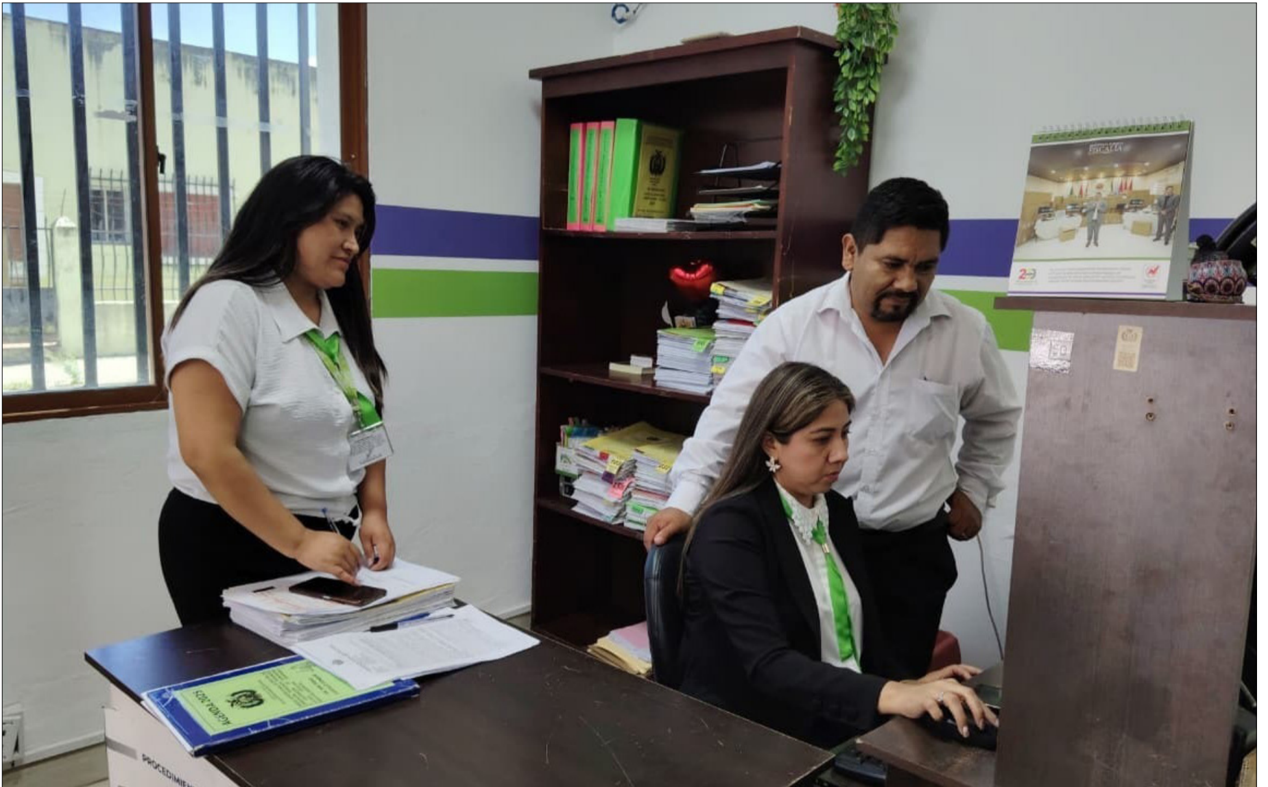
DE ESTA FORMA INSPECCIONARON LA FISCALÍA EN YACUIBA.