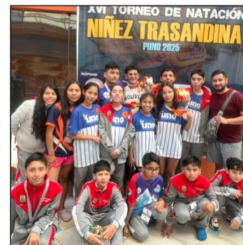
NADADORES DE ACUATIC CENTER, BRILLARON EN LOS TRASANDINOS PUNO 2025.