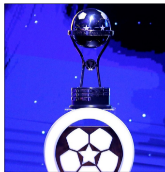
SE ESPERA UN GRAN OPERATIVO.