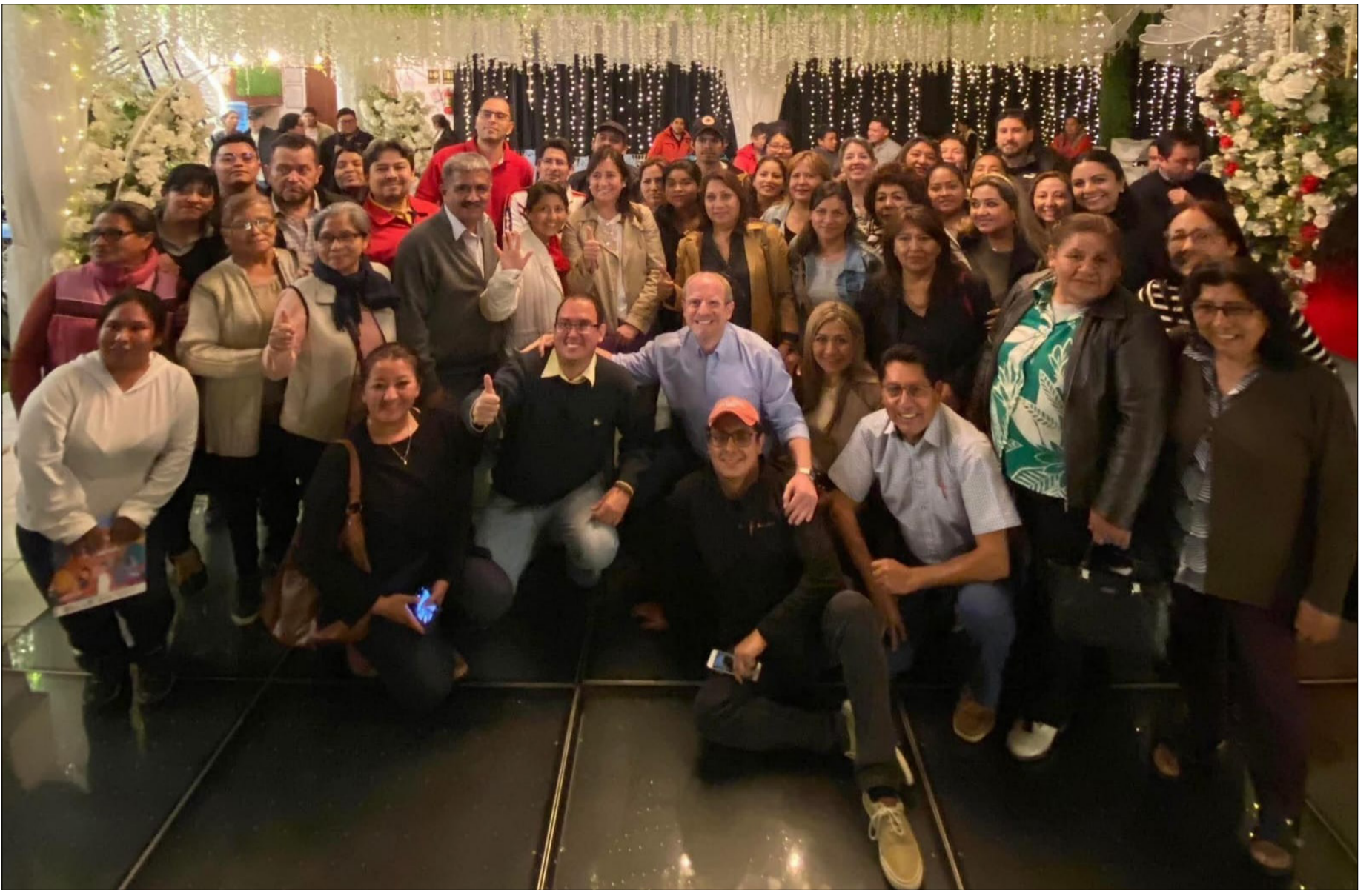
EL EX GOBERNADOR OLIVA EMPEZÓ A MOSTRARSE MÁS.