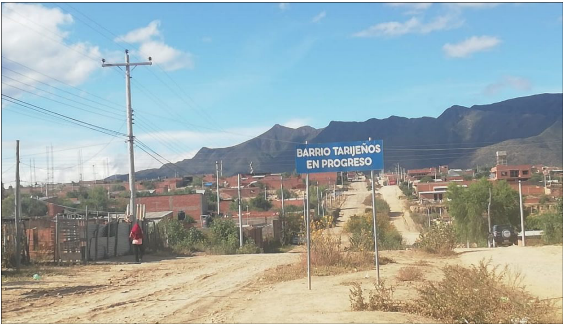
VECINOS ESTÁ ZONA SE MOVILIZARON POR PLANIMETRÍA.

En medio de movilización de algunos vecinos