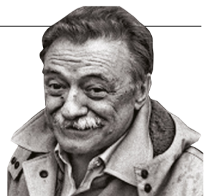
Mario Benedetti 1920-2009. Escritor y poeta uruguayo

“ Y para estar total, completa, absolutamente enamorado, hay que tener plena conciencia de que uno también es querido...”