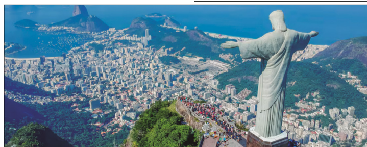
BRASIL SE UNIÓ MUCHO A ESTADOS UNIDOS Y SE MANTUVO FIRME JUNTO A ESE PAÍS TODO EL TIEMPO