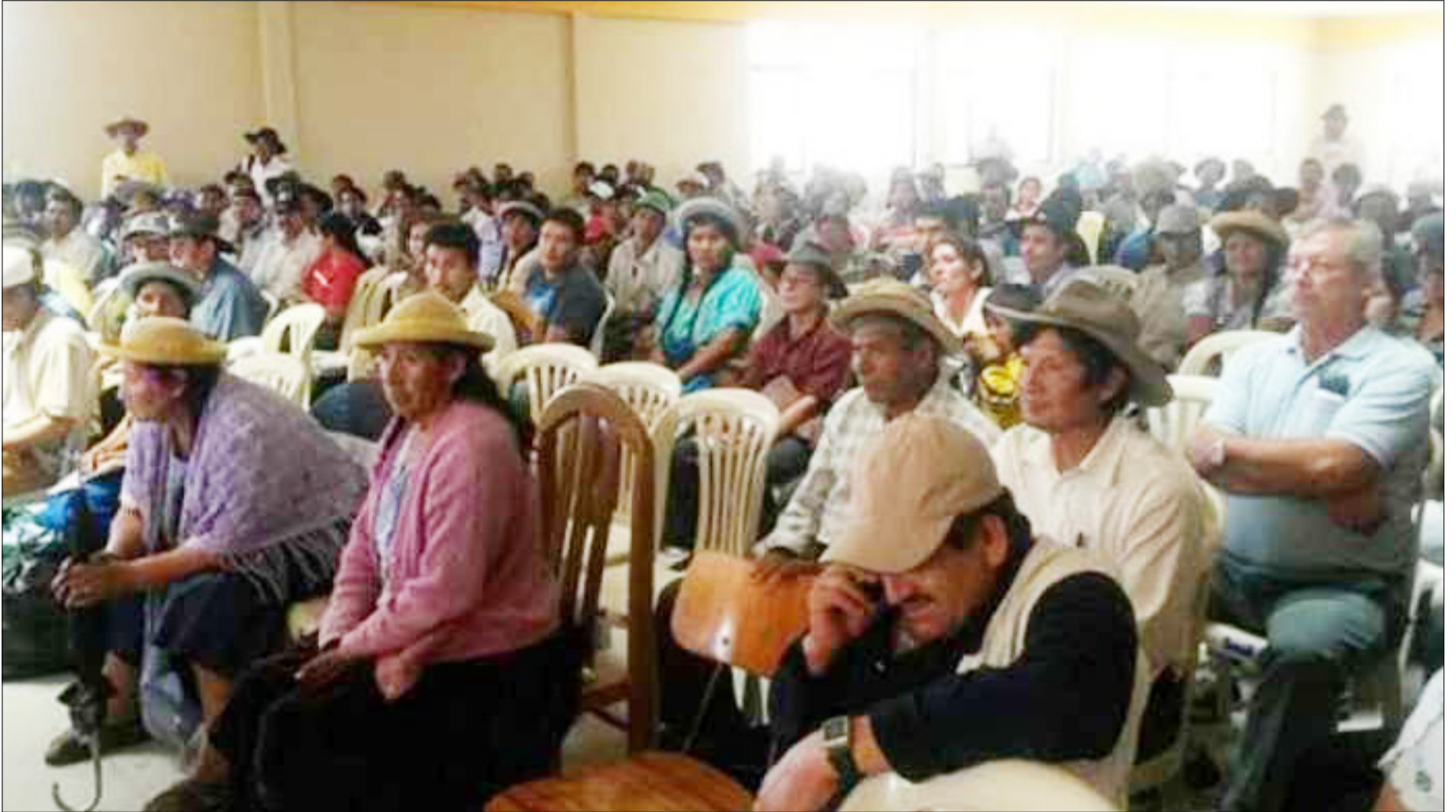
MUCHOS AÚN ESPERAN EL PROSOL, OTROS YA LO DAN POR PERDIDO.