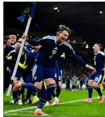
ESCOCIA LE GANÓ UN TREMENDO PARTIDO A DINAMARCA.

De entrada la historia parecía sonreírle a los escoceses gracias al tremendo gol de chilena de Mc Tominay a los tres minutos de juego. Además, se fueron al descanso en ventaja, en lo que parecía un trámite para los dirigidos por Steve Clark teniendo en cuenta que solo les servía la victoria. Sin embargo, en el arranque de la segunda parte Hojlund de