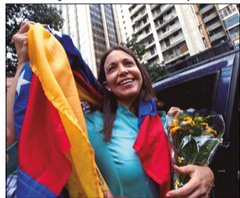
LA EXDIPUTADA Y LÍDER Opositora MARÍA CORINA MACHADO

El medio norteamericano The Washington Post, que obtuvo una copia del Manifiesto previo a su publicación, celebró las palabras de Machado y calificó