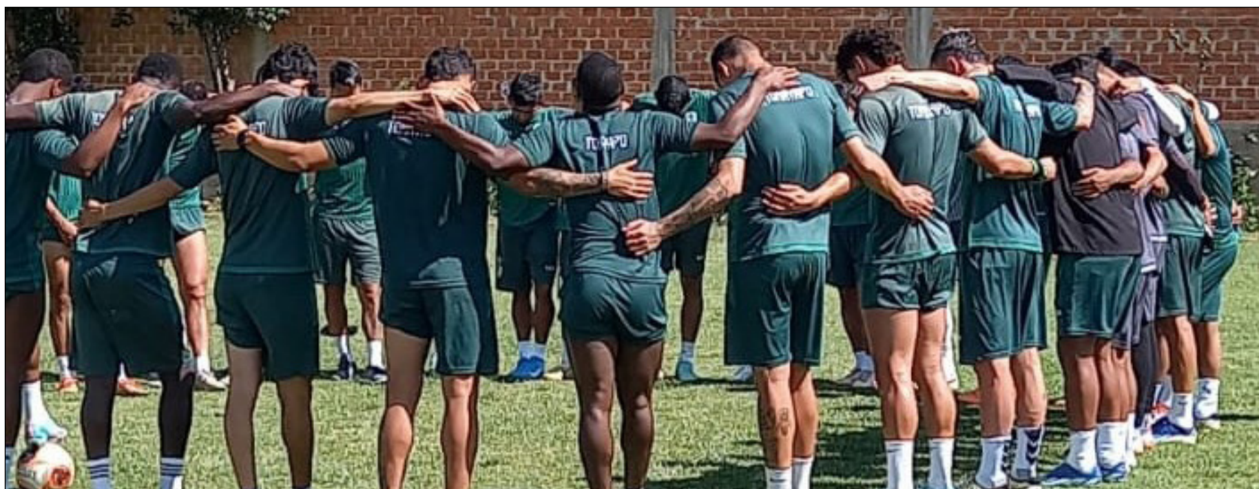
LOS JUGADORES DE REAL TOMAYAPO, SE PREPARAN PARA VISITAR A BLOOMING. (FOTO: ARCHIVO).

División Profesional del fútbol boliviano