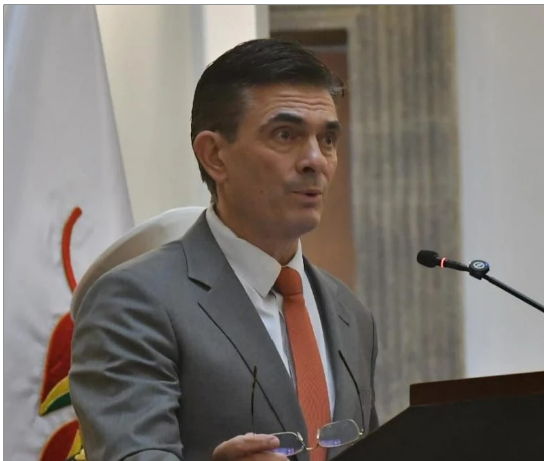
PAZ PEREIRA OFICIALIZA APOYO A LA PAZ PARA LOS JUEGOS BOLIVARIANOS.

Según detalla el documento, la posible realización del evento en la sede de gobierno busca potenciar el rendimiento de los deportistas bolivianos, así como