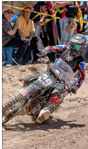
EL FIN DE SEMANA SE CORRIÓ LA PRENACIONAL Y LOS PILOTOS FUERON LOS PROTAGONISTAS.

del calendario nacional y este año se correrá la octava carrera desde el cinco, seis y siete de diciembre; en la