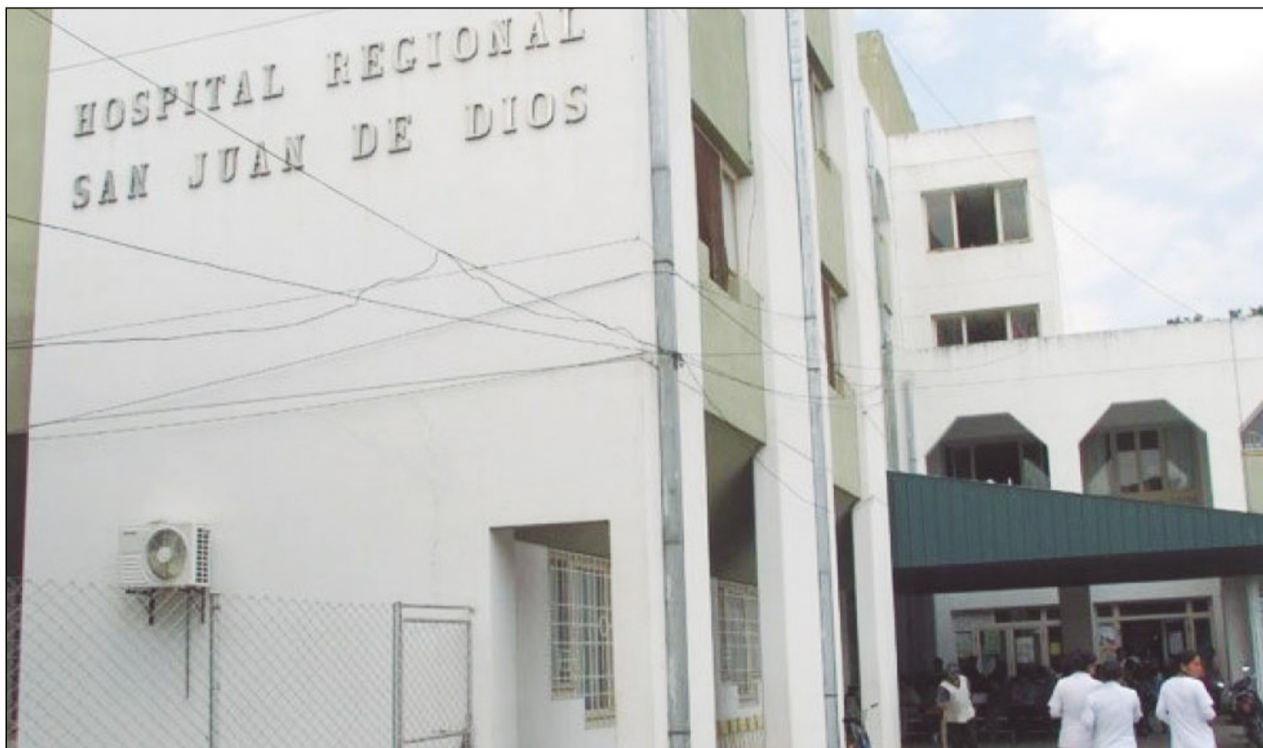
CONSIDERAN QUE ESTE NOSOCOMIO ESTÁ SIENDO ABANDONADO SISTEMÁTICAMENTE.