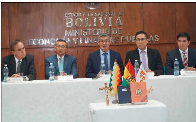
LAS NUEVAS AUTORIDADES, DESPUÉS DE LA POSESIÓN DE ESTE MARTES.