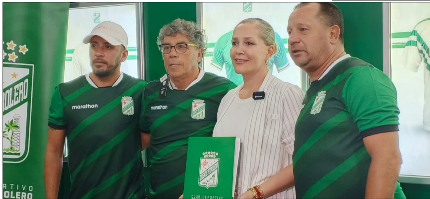
PRESENTACIÓN DEL ENTRENADOR ARGENTINO CON ORIENTE. FOTO. LUBER SÁNCHEZ