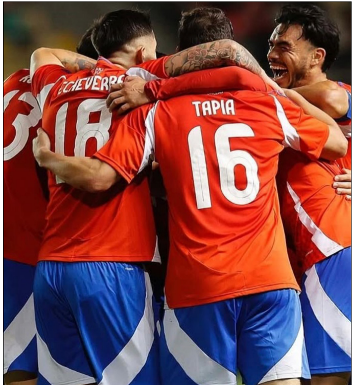
LA VICTORIA DE CHILE ANTE PERÚ.