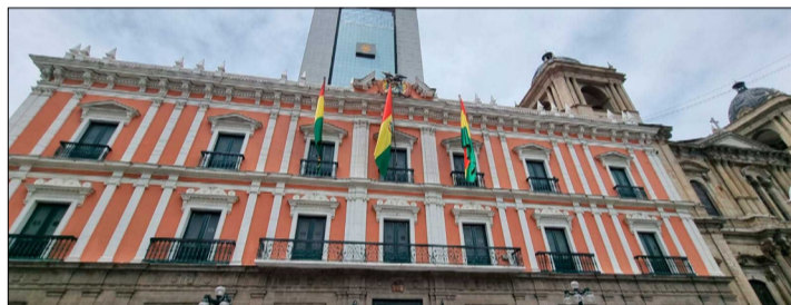
NUEVO GOBIERNO YA TIENE SU ORGANIZACIÓN MINISTERIAL.