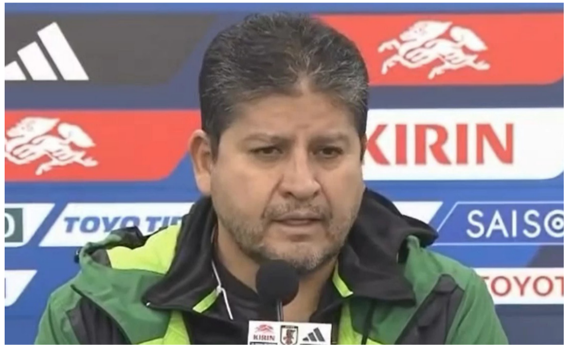
EL DT DURANTE LA CONFERENCIA DE PRENSA. FOTO: CAPTURA