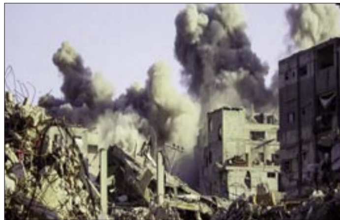
UN EDIFICIO EN EL CAMPAMENTO DE BUREIJ PARA REFUGIADOS PALESTINOS ES ALCANZADO POR UNO DE LOS ATAQUES ISRAELÍES EN GAZA, LUEGO DE QUE ISRAEL ACUSARA A HAMÁS DE VIOLAR EL ALTO AL FUEGO

"En respuesta a la flagrante violación del acuerdo de alto al fuego más temprano hoy, las FDI (fuerzas militares) comenzaron una serie de ataques contra objetivos terroris-