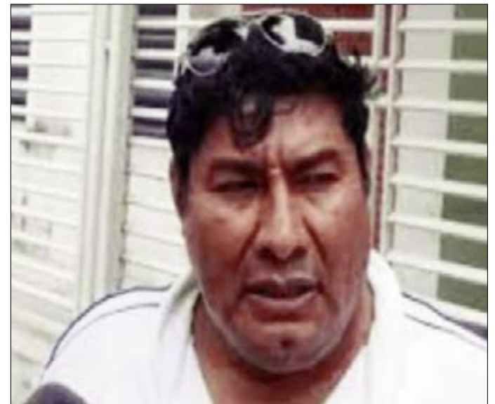
SECRETARIO DE PLANIFICACIÓN DEL GOBIERNO REGIONAL DEL CHACO, MIGUEL ÁNGEL SALAZAR.

Imagínese el apalancamiento que hemos tenido, el equipamiento para el hospital “Fray Quebracho”, que supera los 133 millones, dotación de más de 100 ítems, que supera también una cifra considerable, “pese a no tener recursos, hacemos gestiones”, aseguró