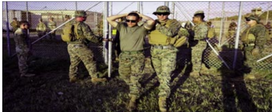
EN FEBRERO, LOS MARINES PRACTICABAN ENTRE ELLOS, AL COMIENZO DE LA OPERACIÓN DE DETENCIÓN DE MIGRANTES EN GUANTÁNAMO.

Un grupo de 18 detenidos llevaba menos de una semana recluido en la base de Guantánamo. Todos fueron deportados días antes de una audiencia judicial en la que abogados impugnan la detención de migrantes en ese lugar.