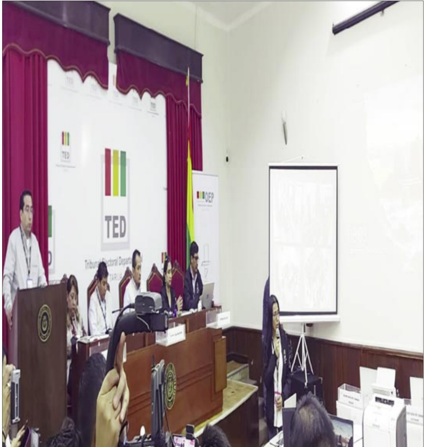
ASÍ SE INICIÓ EL RECUENTO OFICIAL DE VOTOS POR TIEMPO Y MATERIA

El presidente reconoció que algunas mesas empezaron a trabajar después de las 9 de la mañana debido a que algunos jurados se atrasaron y varios tuvieron que ser sustituidos por ciudadanos que estaba en la fila para votar. “Jurado electoral que no ha asistido será pasible a una sanción económica”, anunció al añadir que lo mismo ocurrirá con el votante que no sufragó. La multa para el jurado ausente es 1.375 y para el ciudadano inasistente, 500 bolivianos.