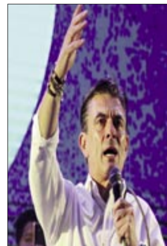
EL CENTRISTA RODRIGO PAZ GANÓ LAS ELECCIONES DE BOLIVIA

El apoyo al Movimiento al Socialismo prácticamente se derrumbó en la primera vuelta de las elecciones. La inflación ha crecido hasta un 23% en lo que va del año, mientras que la escasez de combustibles y dólares ha paralizado la demanda de los consumidores.