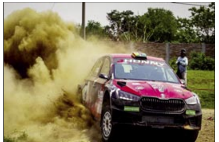
EL POTOSINO AL MANDO DE SU SKODA RS.