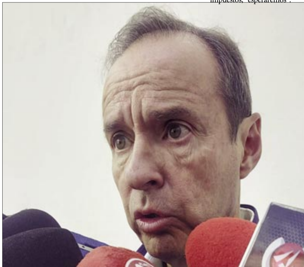
CANDIDATO DE "LIBRE", JORGE "TUTO" QUIROGA.

filas por diésel y gasolina, considerando que el 8 de noviembre es la posesión de las nuevas autoridades, también han hablado de la distribución 50-50 de los impuestos, "esperaremos".