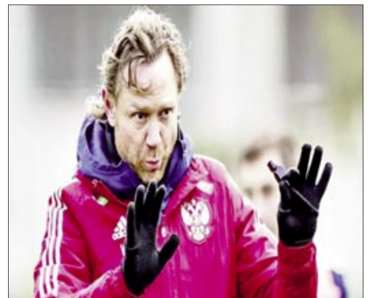
VALERI KARPIN, ENTRENADOR RUSO.