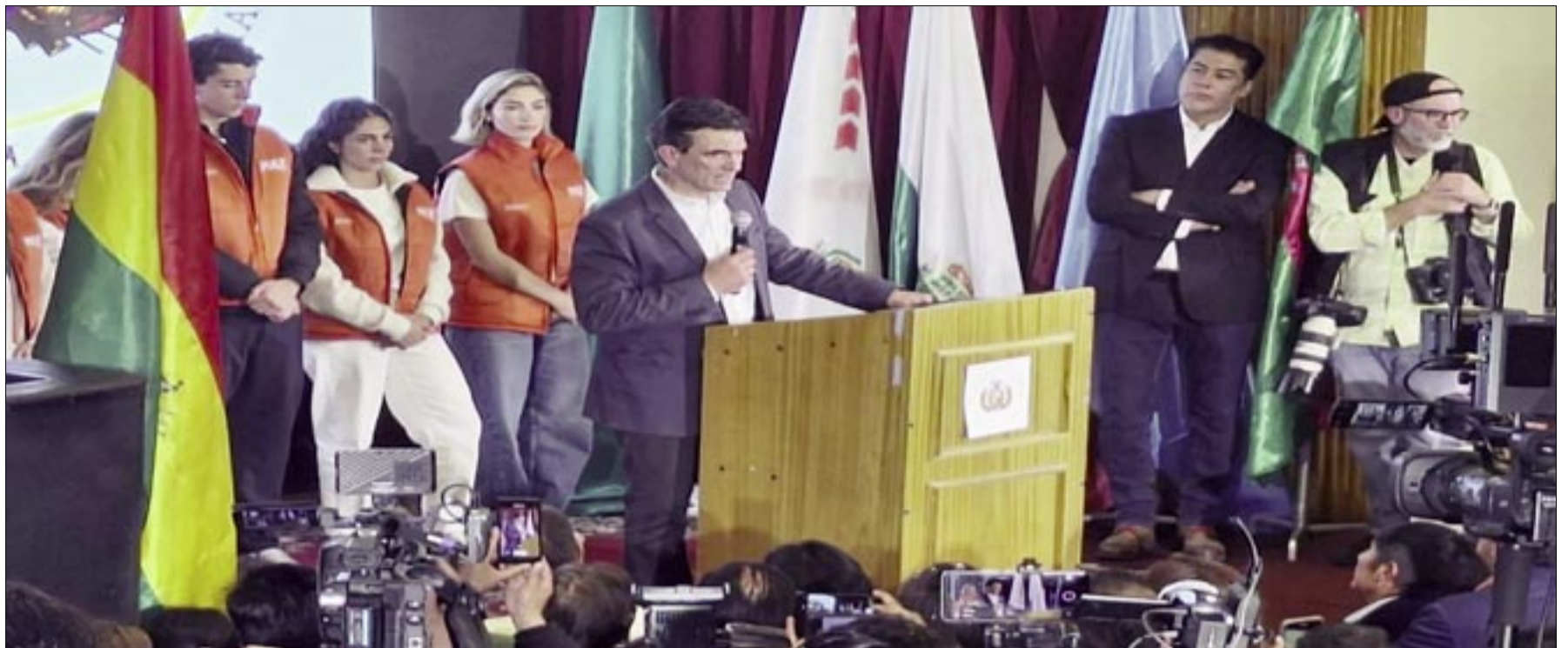
AGRADECIÓ A TUTO POR RECONOCER SU VICTORIA.