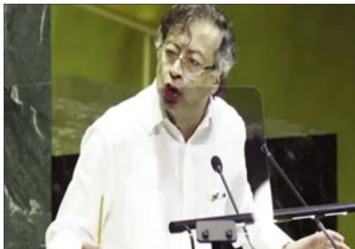
EL GOBIERNO DE GUSTAVO PETRO CONSIDERÓ LAS DECLARACIONES DE TRUMP COMO "UNA AMENAZA DIRECTA" A LA SOBERANÍA COLOMBIANA