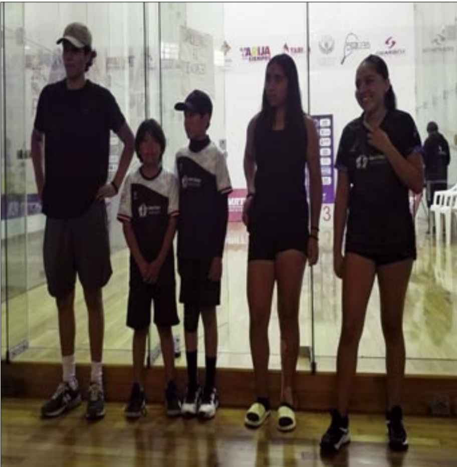
TARIJA TENDRÁ CINCO JUGADORES EN LA SELECCIÓN DE BOLIVIA.