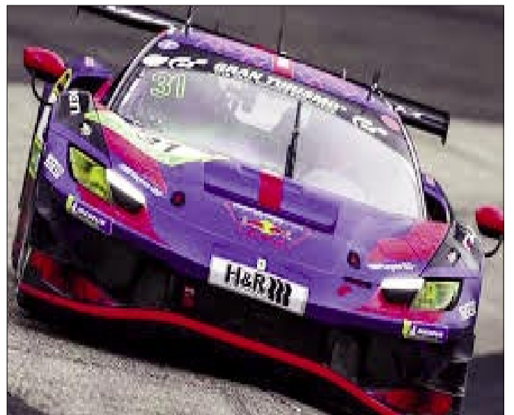
LA FERRARI 296 GT3

En cuestión de días, Verstappen pasó de conquistar un nuevo podio en la máxima categoría del automovilismo a dominar el 'Infierno Verde' alemán, reafirmando que su talento trasciende la Fórmula 1. Su presente lo consolida como un piloto versátil, competitivo y capaz de brillar en cualquier escenario