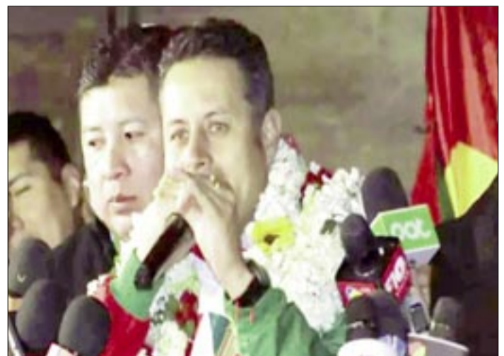
EDMAND LARA, CANDIDATO A VICEPRESIDENTE POR EL PDC/APG

Lara se dirigió a todas las personas que lanzaron insultos en su contra y les mandó un mensaje: “Bolivia es primero”. Tras ello, aseguró que trabajará por todos, para quienes votaron y no por el PDC. “Gracias a Dios por este momento histórico”, expresó.