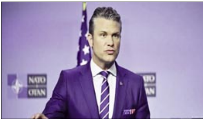
HEGSETH ASEGURÓ QUE LAS ORGANIZACIONES CRIMINALES PERSEGUIDAS POR ESTADOS UNIDOS "SON EL AL QAEDA DEL HEMISFERIO OCCIDENTAL"