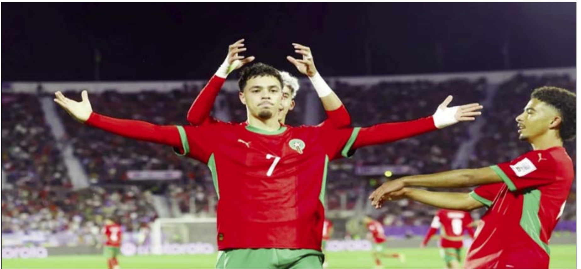
EL CHUQUISAQUEÑO CONQUISTÓ POR TERCERA VEZ CONSECUTIVA EL TÍTULO DE SINGLES PROFESIONAL