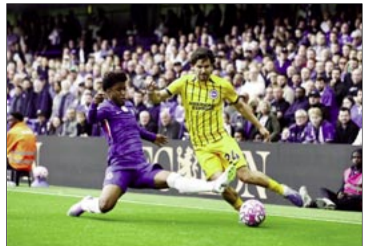
LOS 'BLUES' NO PUEDEN EN CASA.

de su faro, Cole Palmer, lesionado, sufrió hasta el final, arrinconado por un rival que con un jugador más se fue arriba, en busca de la victoria que parecía lejana al principio. Porque el choque fue del Chelsea en el arranque y durante muchos minutos. Casi hasta que se quedó con diez. De la mano de Enzo Fernandez tuvo ventaja. El argentino ya pudo marcar de golpe franco al principio. Después, adelantó a su equipo al rematar a puerta vacía un pase desde la derecha de Estevo