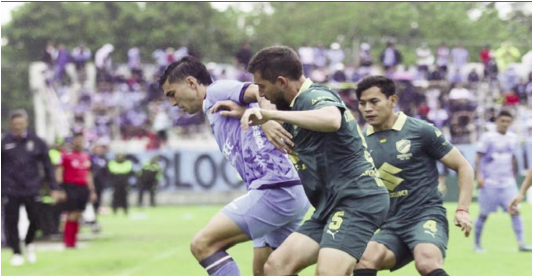
INCIDENCIAS DEL PARTIDO. APG