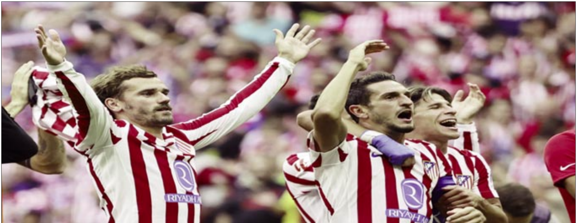
JUGADORES DE ATLÉTICO DE MADRID CELEBRAN EN TRIUNFO ANTE EL REAL.