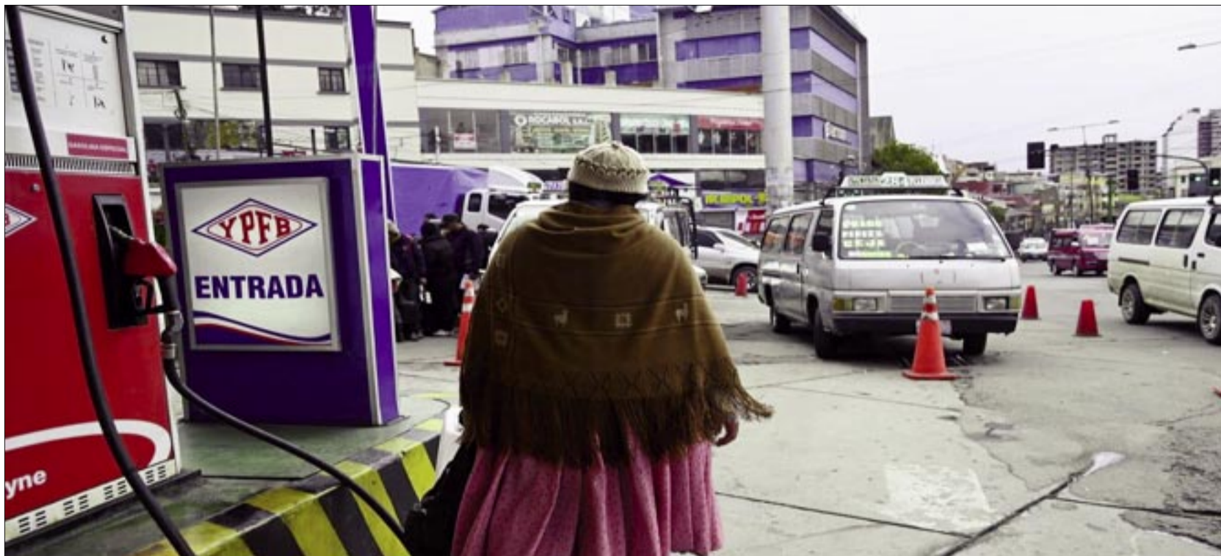
BOLIVIA PRECISA RESOLVER LA FALTA DE CARBURANTES, SEGÚN Oponentes DEL PDC

Hay una margen de diferencia relativamente corta