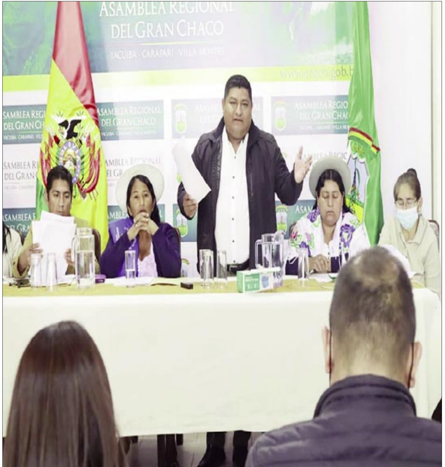
EL GOBIERNO REGIONAL DEL CHACO TAMBIÉN TIENE DIFICULTADES ECONÓMICAS

“Una cosa es presupuesto, otra la liquidez, la economía real, eso es a nivel nacional, no solo regional”, insistió al recordar que las leyes 3038 y 3861 fueron modificadas por las 017 y 927, relativas a la asignación de recursos a los municipios.