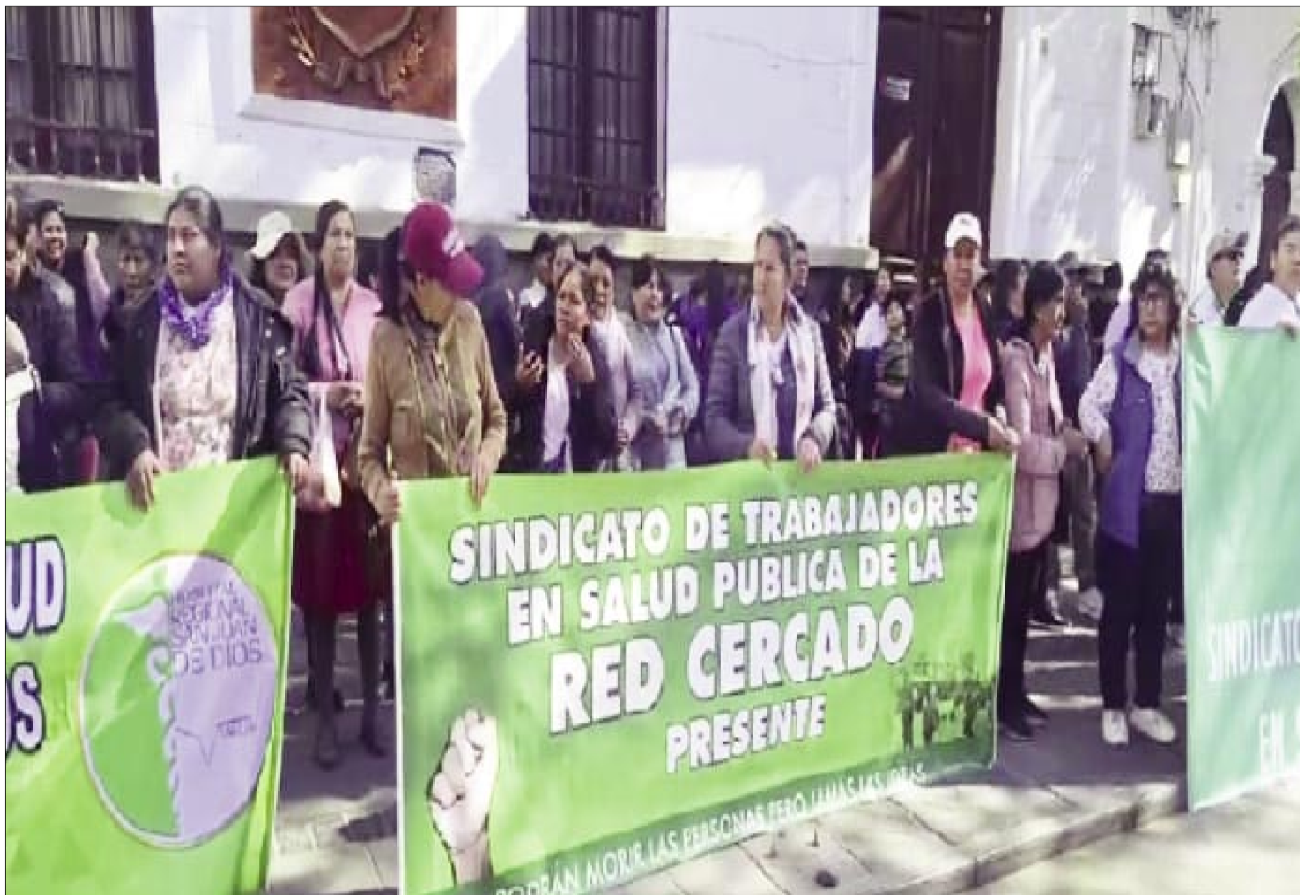
LOS TRABAJADORES EN SALUD VOLVERÁN A LAS MEDIDAS DE PRESIÓN

A partir de esta semana, pasado el balotaje