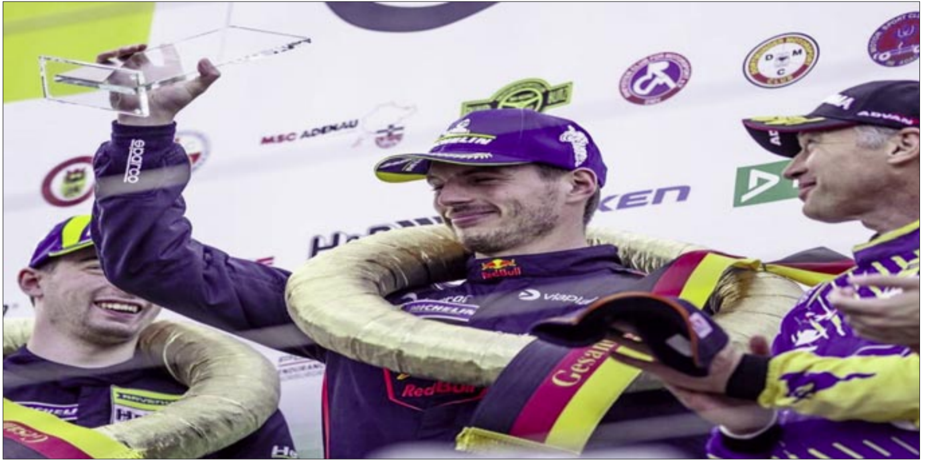
MAD MAX SIGUE HACIENDO HISTORIA EN EL AUTOMOVILISMO.