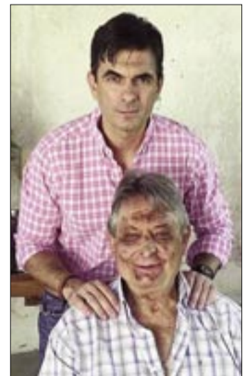
JAIME PAZ ZAMORA Y RODRIGO PAZ