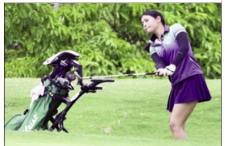
LOS DIABLOS ROJOS NO LEVANTA CABEZA.

Esa cifra se suma a los 70 y 75 que logró en las dos primeras rondas para tener un total de 220 golpes, cuatro menos que la segunda, la colombiana Cristina Álvarez (224), y cinco menos que las terceras, la también colombiana Sofía Araque y la brasileña Maitri Peychaux (225).