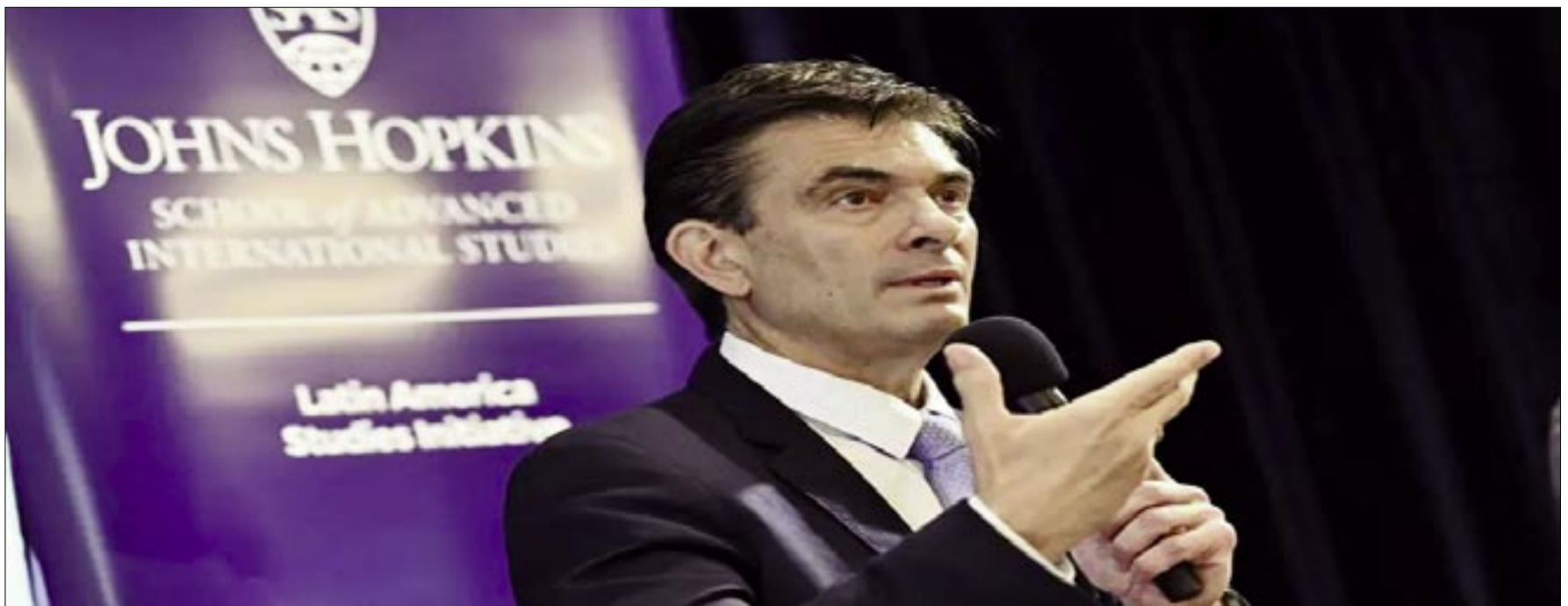
ENCUESTAS DE AMBOS CANALES DE TELEVISIÓN.