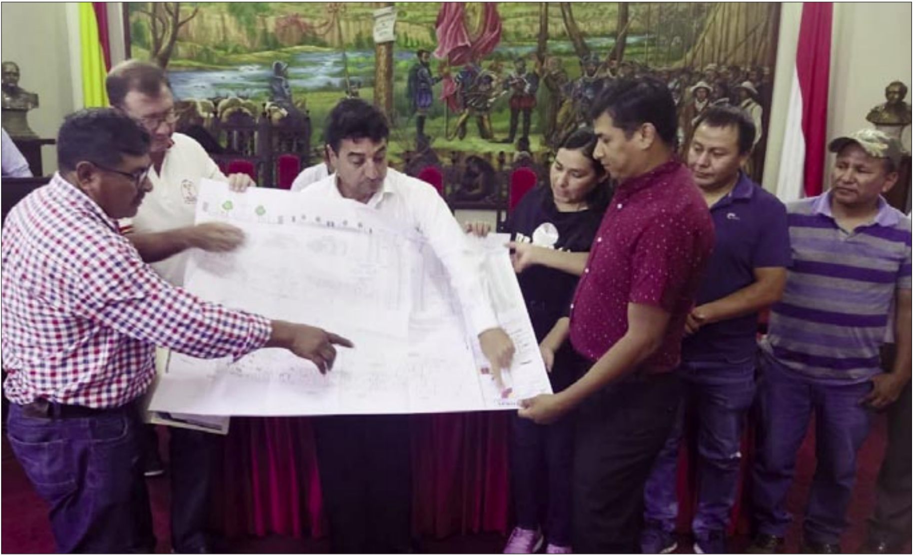
DIRIGENCIA DE FEJUVE QUIERE REPONER LA LEY DE PLANIMETRÍAS.