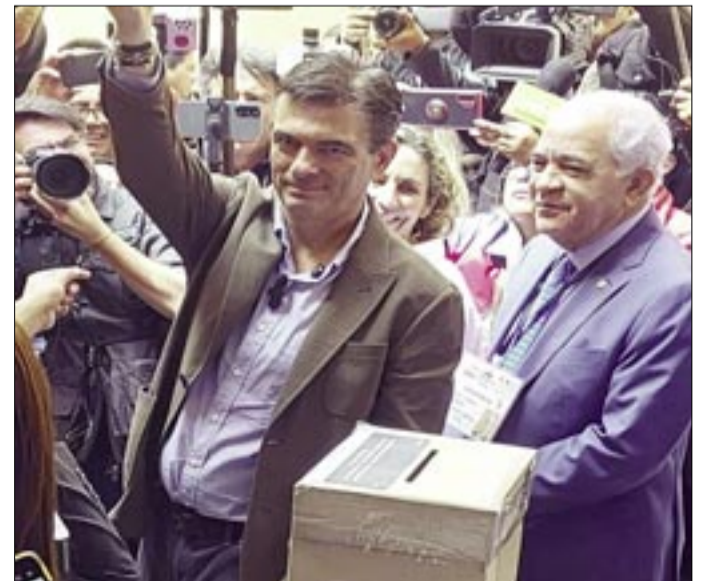
CANDIDATO PRELIMINARMENTE GANADOR, RODRIGO PAZ PEREIRA

Estamos trabajando para conocer cuál la situación en que vamos a recibir el gobierno, acotó al asegurar que informarán de todo a la población para que sepa el rol que tiene que jugar, que será muy importante, porque el problema, no solo es del gobierno