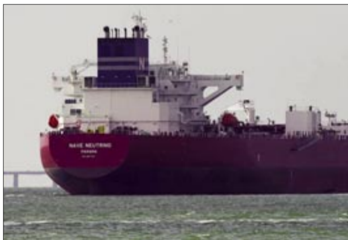
UN PETROLERO FLETADO POR CHEVRON ESPERANDO PARA CARGAR CRUDO PESADO DE EXPORTACIÓN EN MARACAIBO, VENEZUELA, EL MES PASADO.

El gobierno de Donald Trump ha duplicado la recompensa ofrecida por el líder autocrático de Venezuela, lo califica de "narcoterrorista" y ahora amenaza con realizar ataques militares en suelo venezolano.