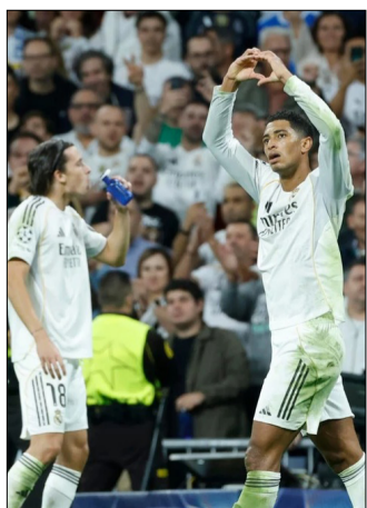
JUDE BELLINGHAM CELEBRANDO GOL ANTE JUVENTUS.