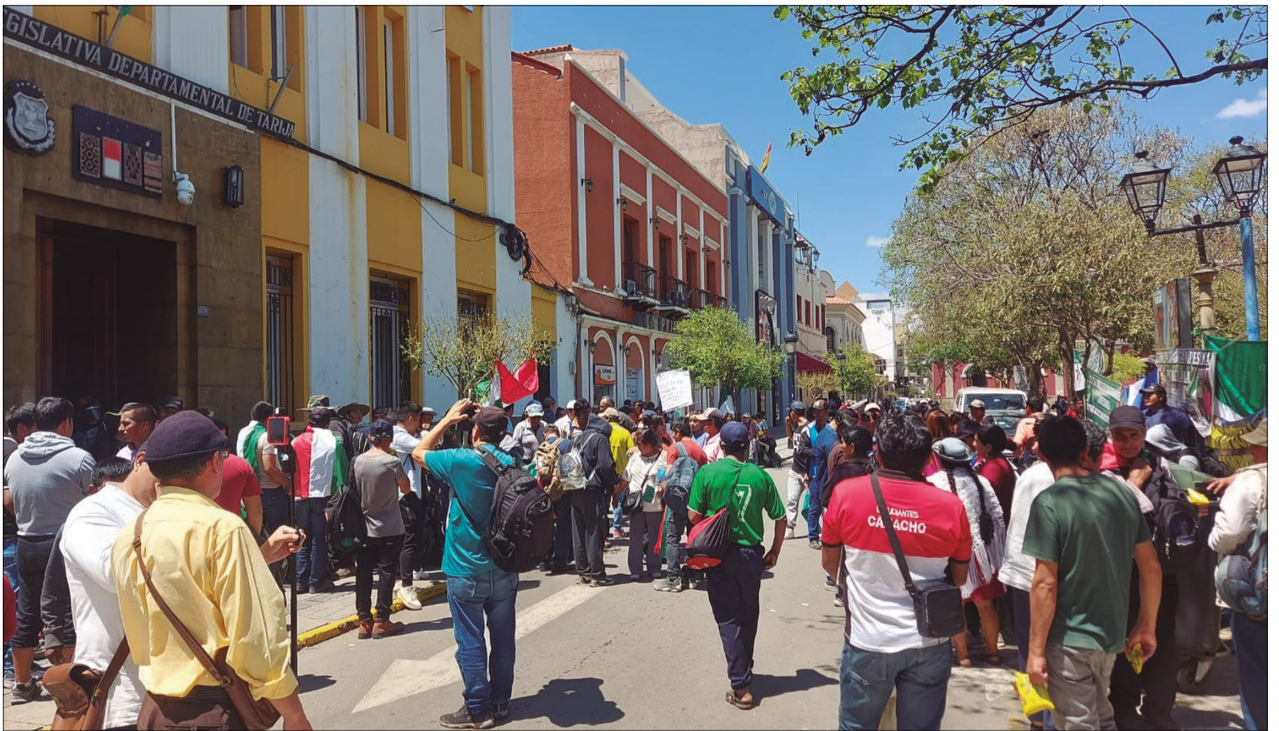
DIRECTIVA AGENDÓ PARA HOY PROYECTO DEL 45% DE LAS REGALÍAS.

Están movilizados impulsores y oponentes al proyecto