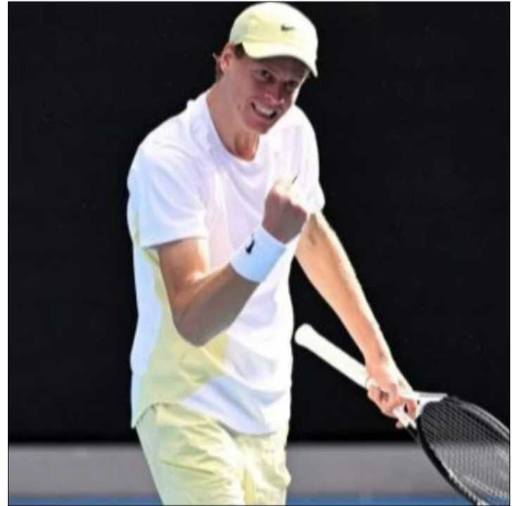
EL ITALIANO APLASTA A ALTMAIER Y CONTINÚA EN MODO AUTORITARIO.