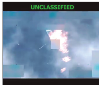
NUEVO ATAQUE CONTRA EL NARCOTRÁFICO AHORA EN EL PACÍFICO

El gobierno de Trump justificó su campaña contra los cárteles de la droga al calificarlos de amenaza terrorista para la seguridad nacional, argumentando que el tráfico de drogas —principalmente fentanilo— provoca decenas de miles de muer-