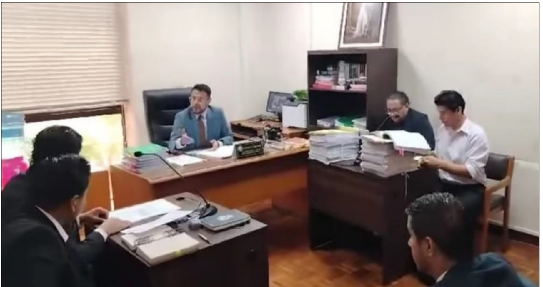
EN ESTA AUDIENCIA DECLARARON REBELDE AL EX MANDATARIO.

La autoridad se presentó a la opinión pública