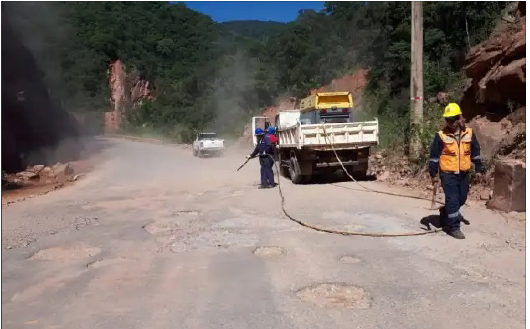
ESTE TRAMO ESTÁ EN RIESGO, OTRA VEZ, DE PARALIZACIÓN.