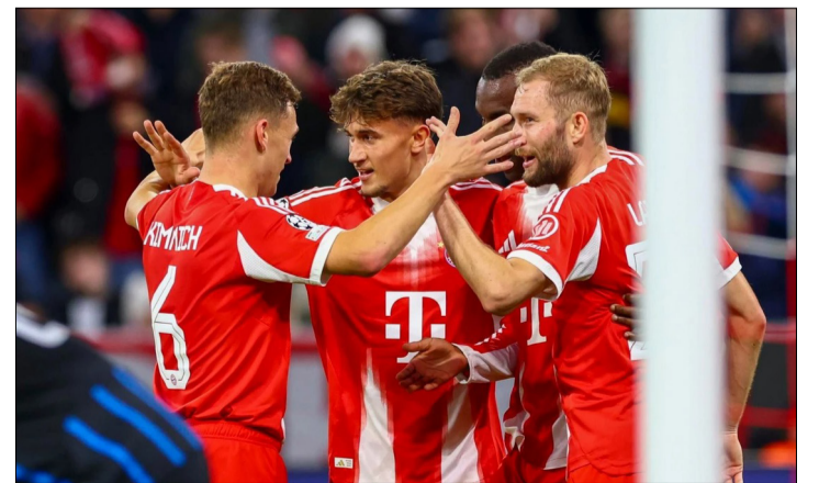
JUGADORES DEL EQUIPO ALEMÁN CELEBRANDO UNO DE LOS GOLES.