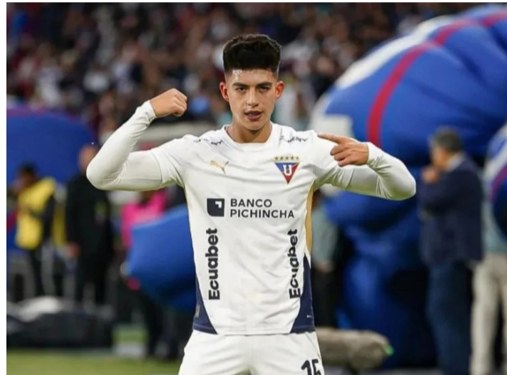
EL MEDIOCAMPISTA BOLIVIANO DURANTE UN PARTIDO CON EL EQUIPO 'ALBO'.

Será, sin duda, una noche histórica en el Rodrigo Paz Delgado, donde Liga buscará dar el primer paso hacia una nueva final continental.