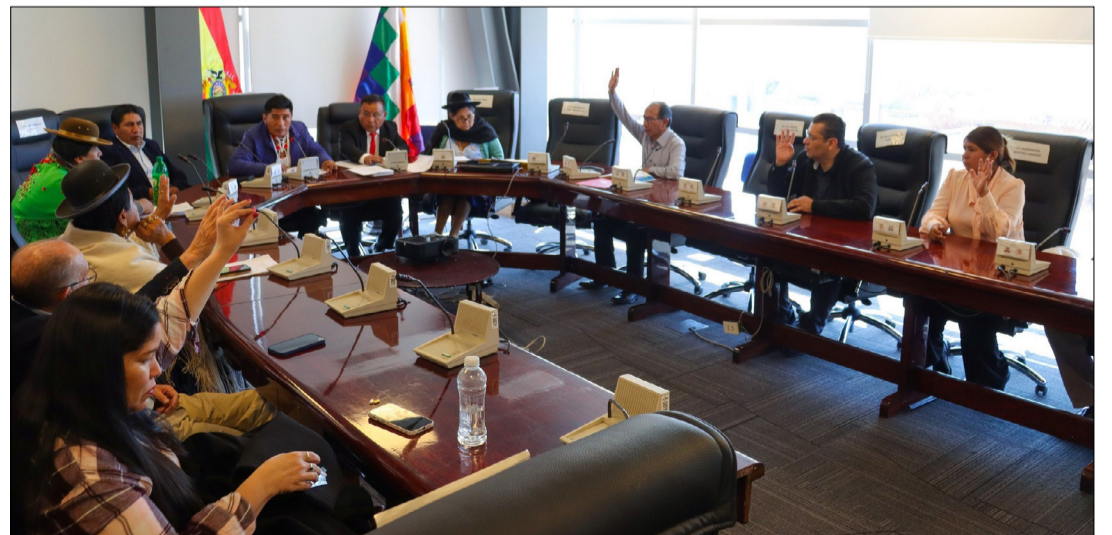
SESIÓN DE LA COMISIÓN ECONOMÍA PLURAL.