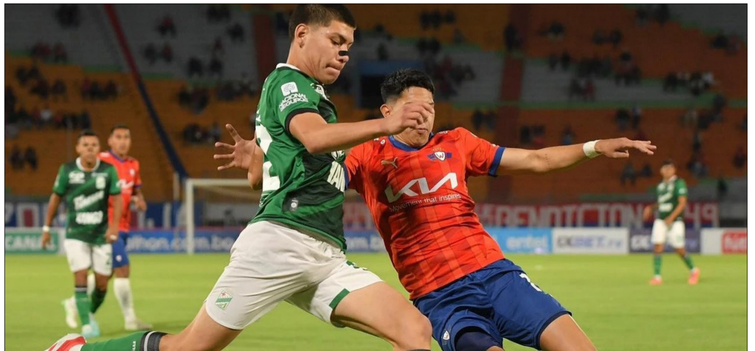
PARTIDO POR COPA BOLIVIA ENTRE AMBOS EQUIPOS.