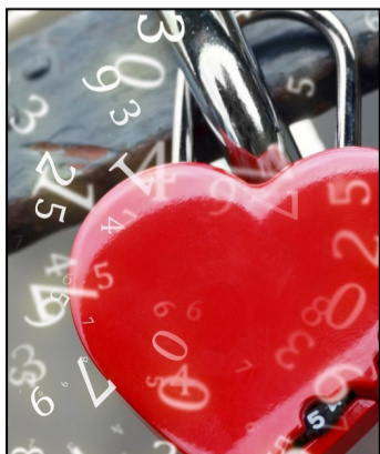
Foto: ilustración Shutterstock. Para saber qué número trae el contrato relacional, debés sumar tu día de cumpleaños con el de la otra persona. Foto: ilustración Shutterstock.

Para saber qué número trae el contrato relacional, debés sumar tu día de cumpleaños con el de la otra persona.