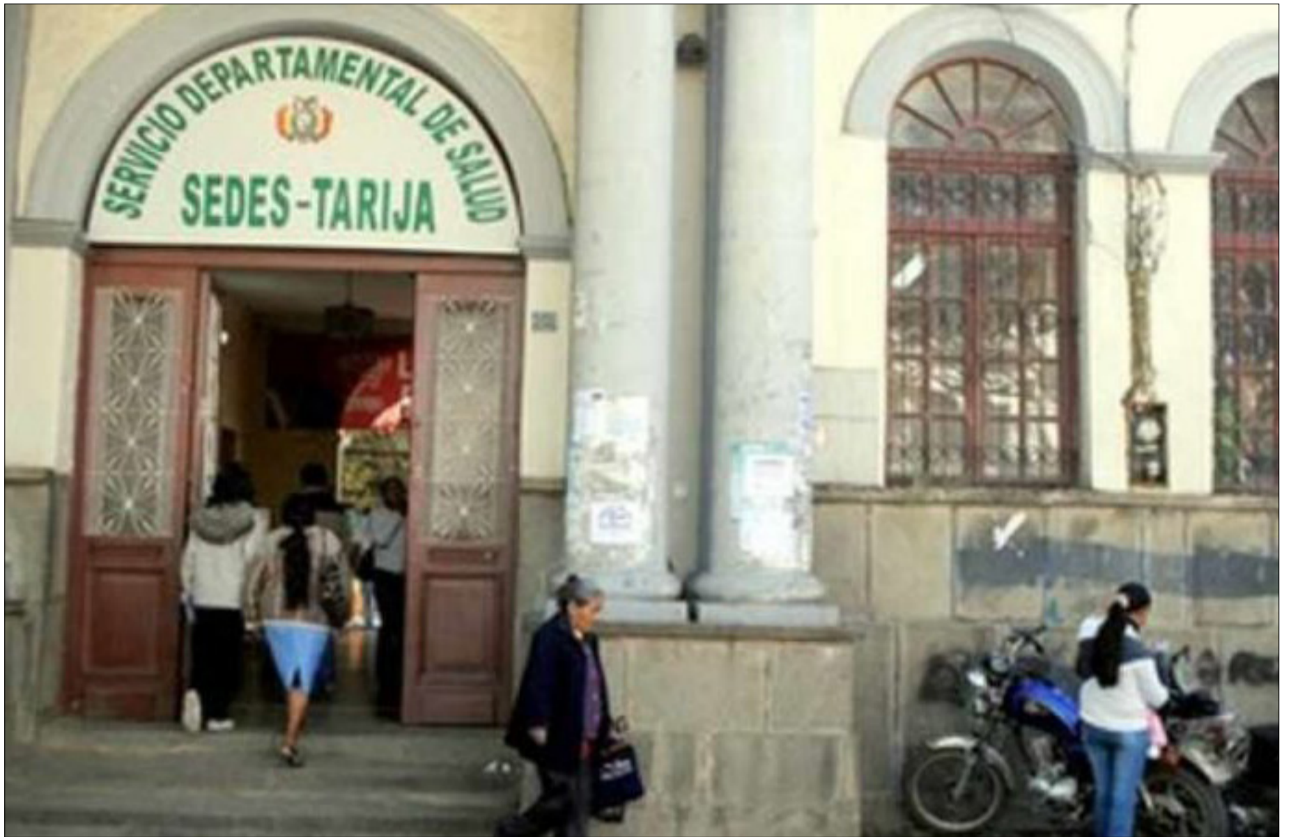
EL SEDES CONFIRMÓ SEGUNDO CONTAGIO DE SARAMPIÓN EN TARIJA.

También iniciaron campaña contra el dengue