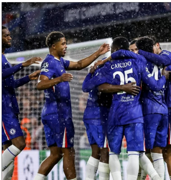
LOS JUGADORES DEL CHELSEA CELEBRAN EL GOL DEL 4-1 DE PENALTI.