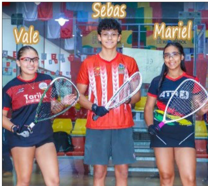
LOS TARIJEÑOS CLASIFICADOS AL MUNDIAL JUNIOR, TAMBIÉN COMPETIRÁN.

Por otro lado, dijo que los raquetbolistas chapacos que clasificaron al campeonato mundial Junior, (3) también competirán en el torneo nacional Open; mientras que los niños de la categoría 10 años (dobles), por la edad, no podrán competir en el nacional.