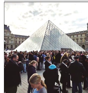
22 DE OCTUBRE DE 2025, FRANCIA, PARÍS: VISITANTES HACEN FILA FRENTE AL MUSEO DEL LOUVRE.