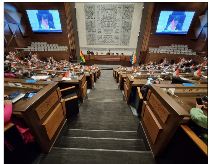
IMAGEN REFERENCIAL DE UNA ANTERIOR SESIÓN EN EL HEMICICLO DEL NUEVO EDIFICIO DEL LEGISLATIVO.