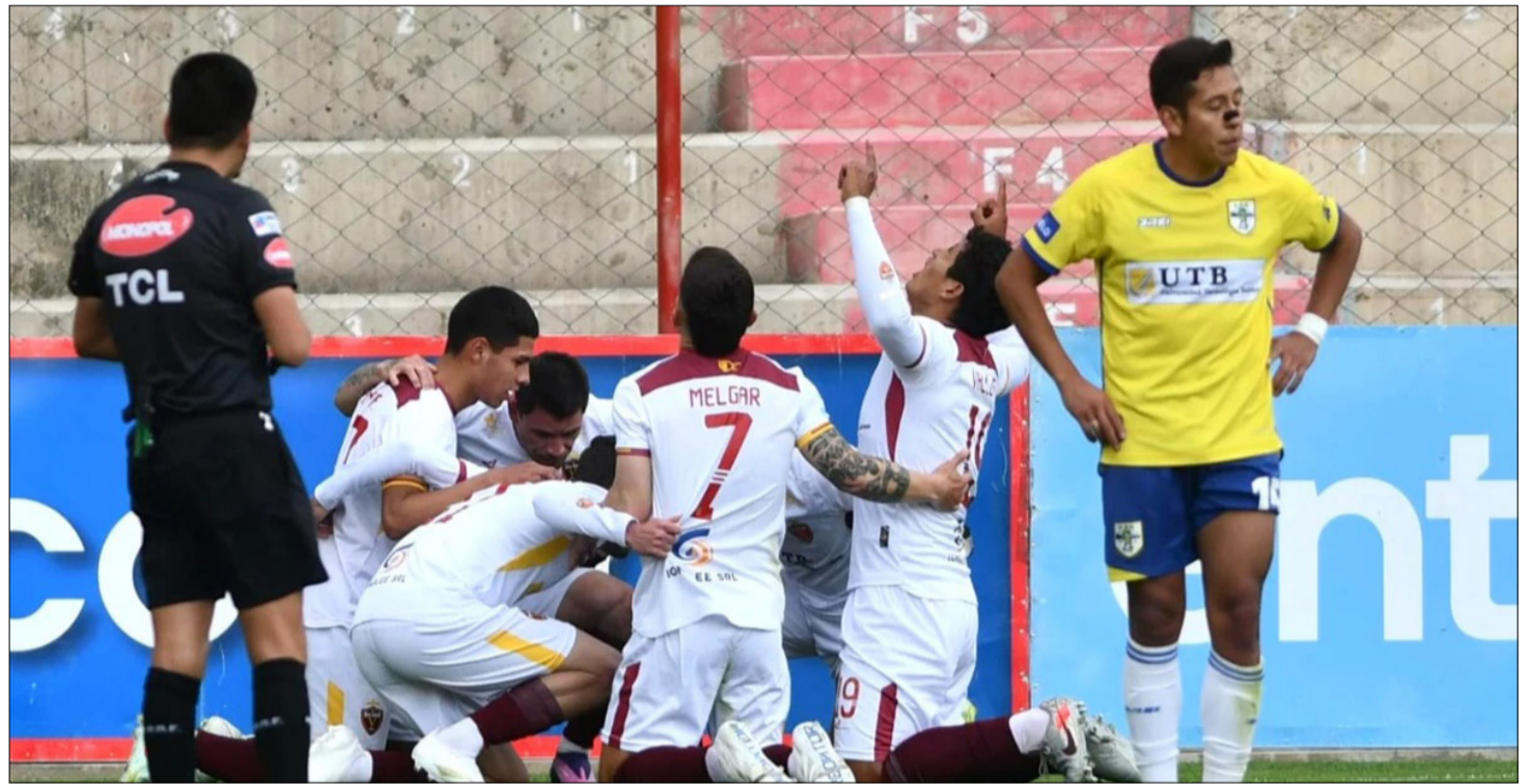
JUGADORES DE REAL ORURO CELEBRAN TRAS VENCER A ABB EN EL ALTO.