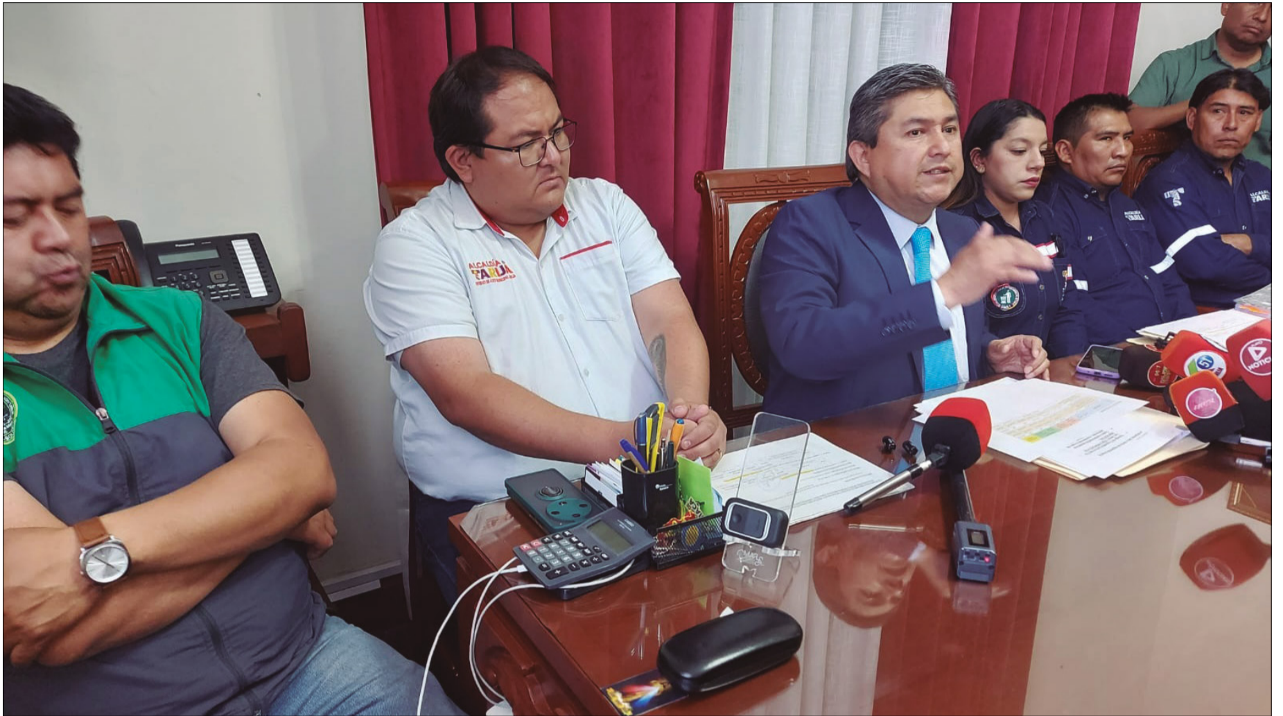
TRES ÍTEMS SE ADJUDICARON PARA EMAT Y DOS FUERON DECLARADOS DESIERTOS.