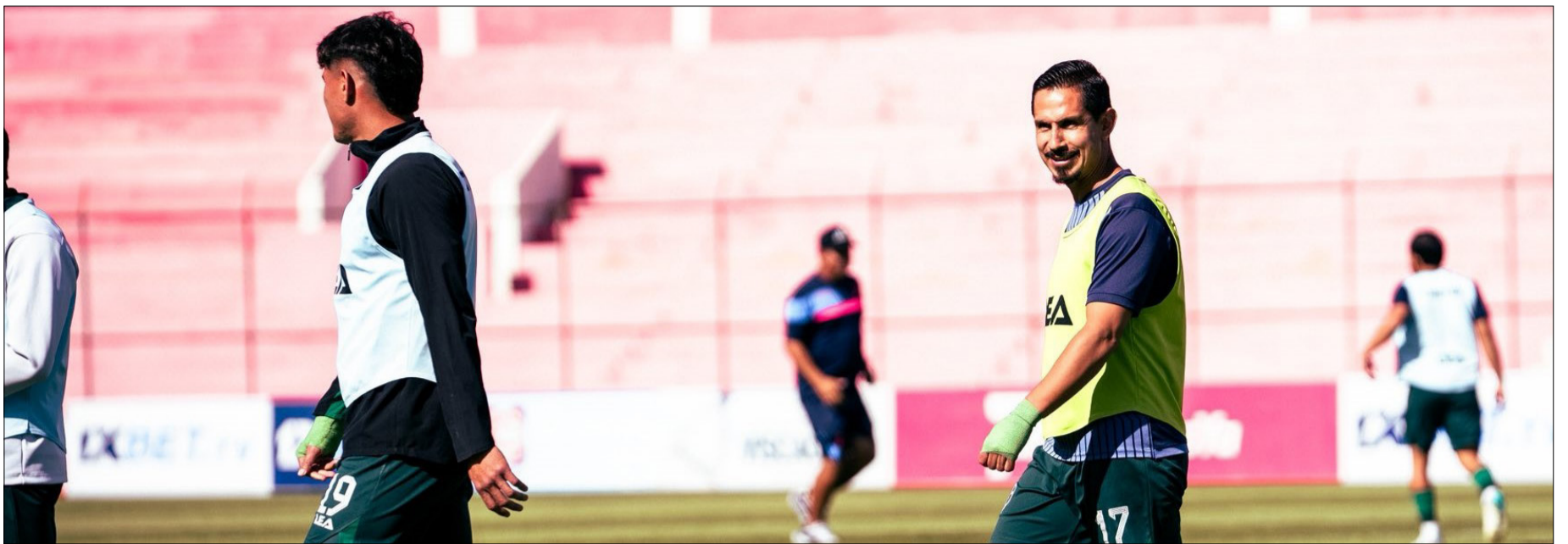
EL TRABAJO DEL PLANTEL DE REAL TOMAYAPO DE CARA AL PARTIDO DEL VIERNES.