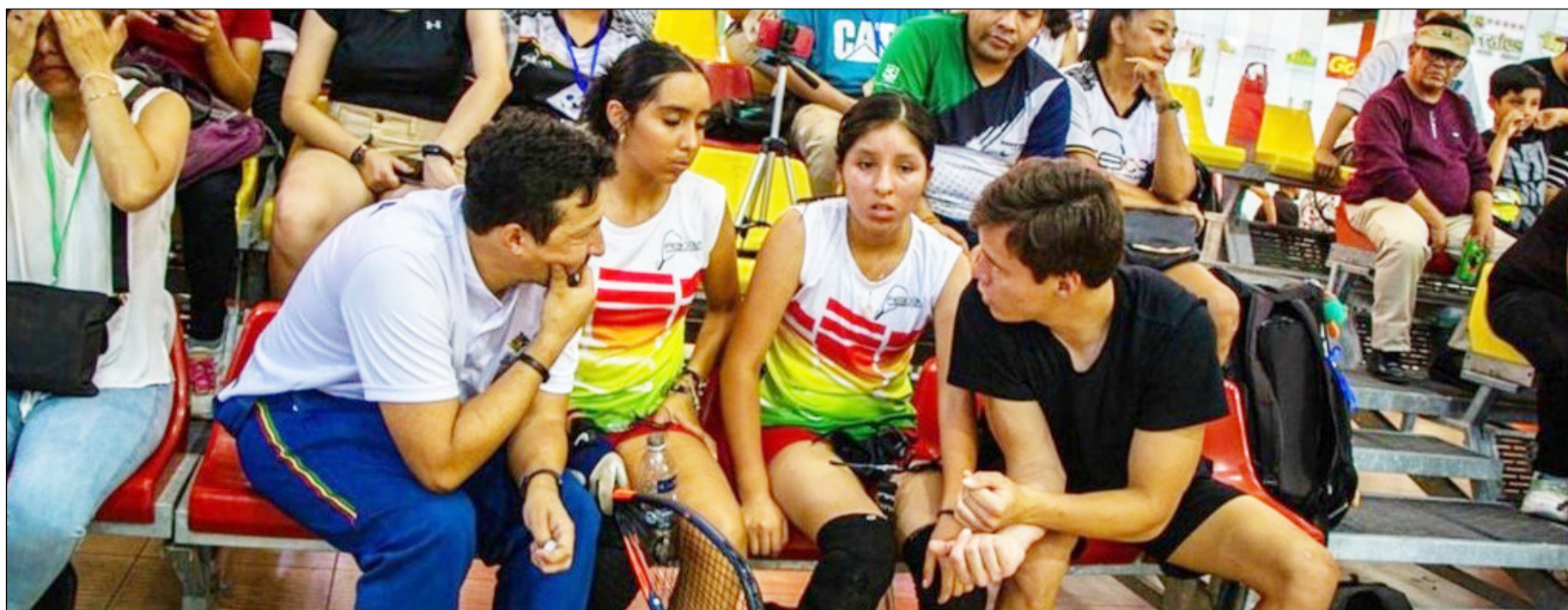
LOS RAQUETBOLISTAS DE LA CATEGORÍA OPEN SE CONCENTRARÁN EN TARIJA.