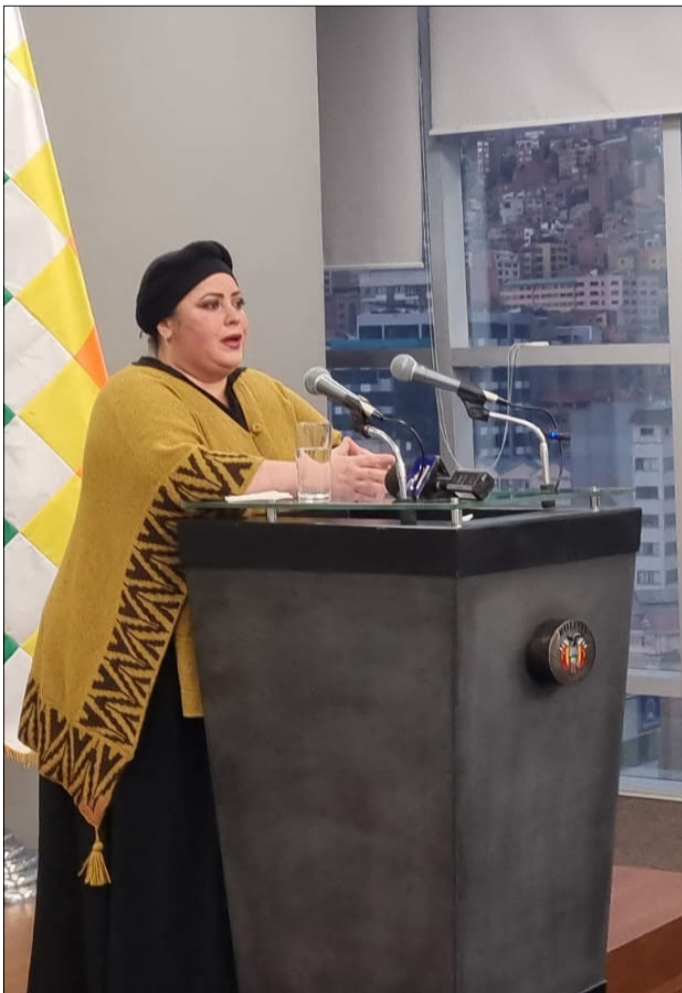
PRADA EN CONFERENCIA DE PRENSA.