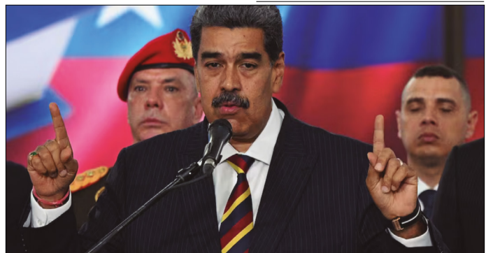
EL 18 DE AGOSTO DE 2025, NICOLÁS MADURO ANUNCIÓ QUE DESPLEGARÍA 4,5 MILLONES DE MILICIANOS EN RESPUESTA A LAS “AMENAZAS ESTADOUNIDENSES”, DESPUÉS DE QUE WASHINGTON AUMENTARA LA RECOMPENSA POR SU CAPTURA Y LANZARA OPERATIVOS ANTIDROGAS EN EL CARIBE; DOS MESES DESPUÉS, EL CARIBE SIGUE SIENDO ESCENARIO DE LAS MISMAS CONTROVERSIAS QUE GENERARON AQUELLA REACCIÓN DEL RÉGIMEN