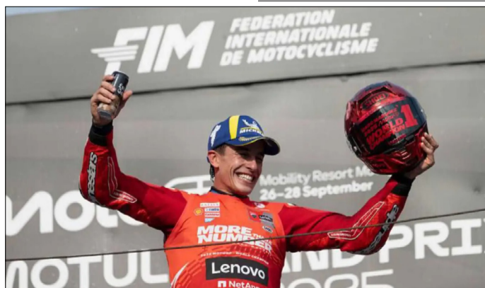
MÁRQUEZ CELEBRANDO UNA DE SUS MÚLTIPLES VICTORIAS DURANTE LA TEMPORADA

las voces que decían que no tenía sentido seguir y dio un giro de tuerca a todo. Todas esas cirugías antes mencionadas ocurrieron entre 2020 y 2023 y el piloto decidió divorciarse de la marca que le había acompañado toda su vida deportiva para fichar por el equipo que mejor había comprendido el reglamento de MotoGP, Ducati.