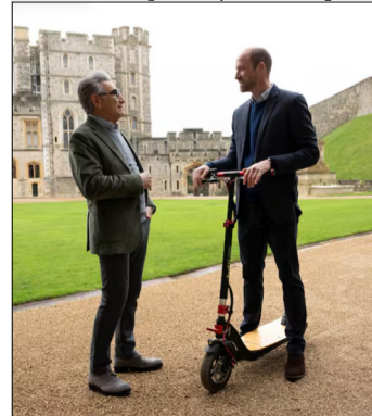
LA ENTREVISTA AL PRÍNCIPE GUILLERMO

Estas declaraciones no pasan desapercibidas en Gran Bretaña, donde el reinado de Carlos III, iniciado tras la muerte de Isabel II en septiembre de 2022, es visto como transitorio y con un fuerte aire de continuidad respecto a los 70 años de su madre en el trono. Consciente de esa percepción, Guillermo parece buscar imprimir un sello propio, más flexible y abierto al cambio, aunque sin romper con la esencia de la monarquía que representa.