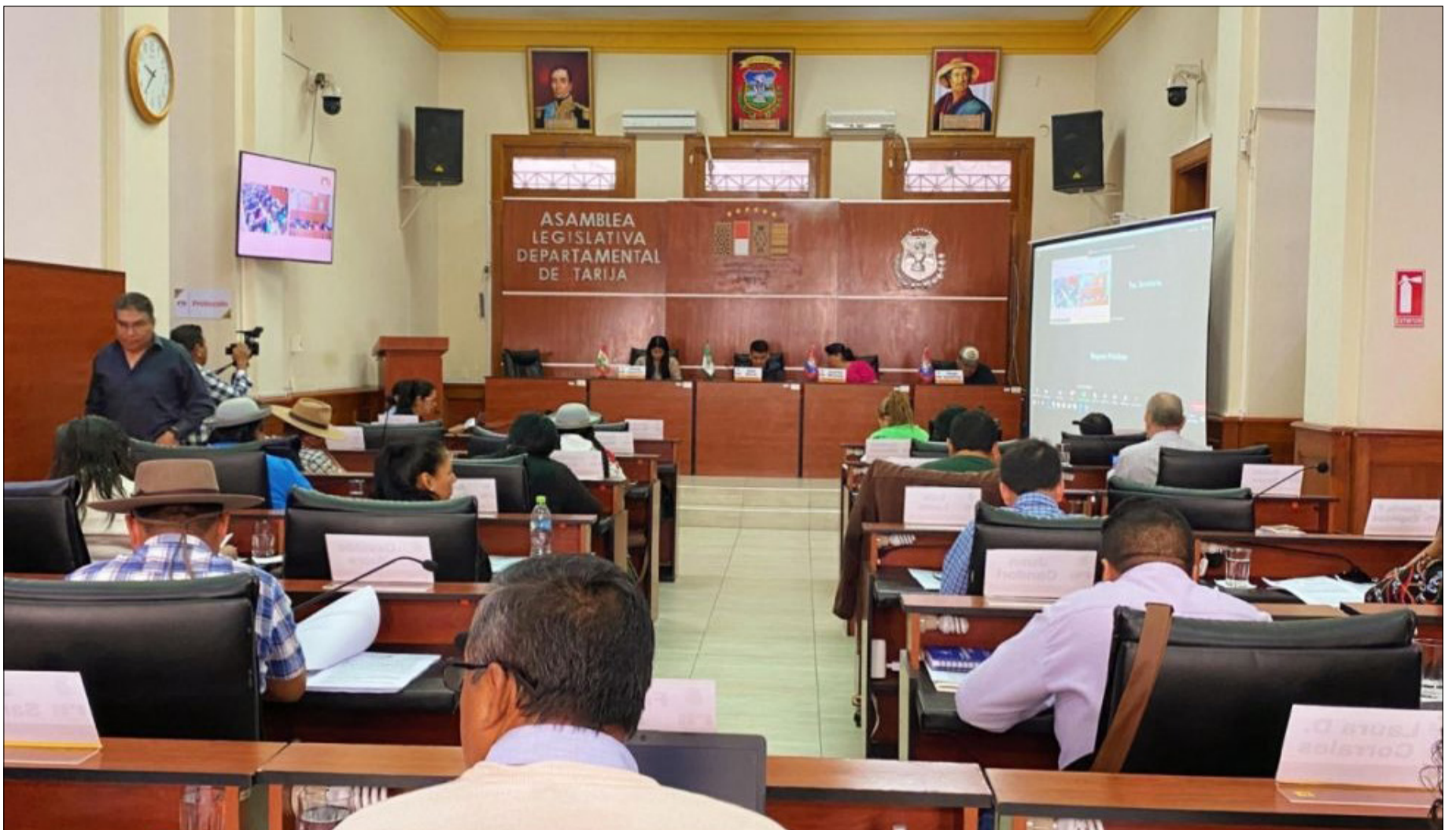
LEGISLADORES ESPERAN PROMULGACIÓN DE LEY DE FISCALIZACIÓN.

Esperan evitar el doble control y mejorar