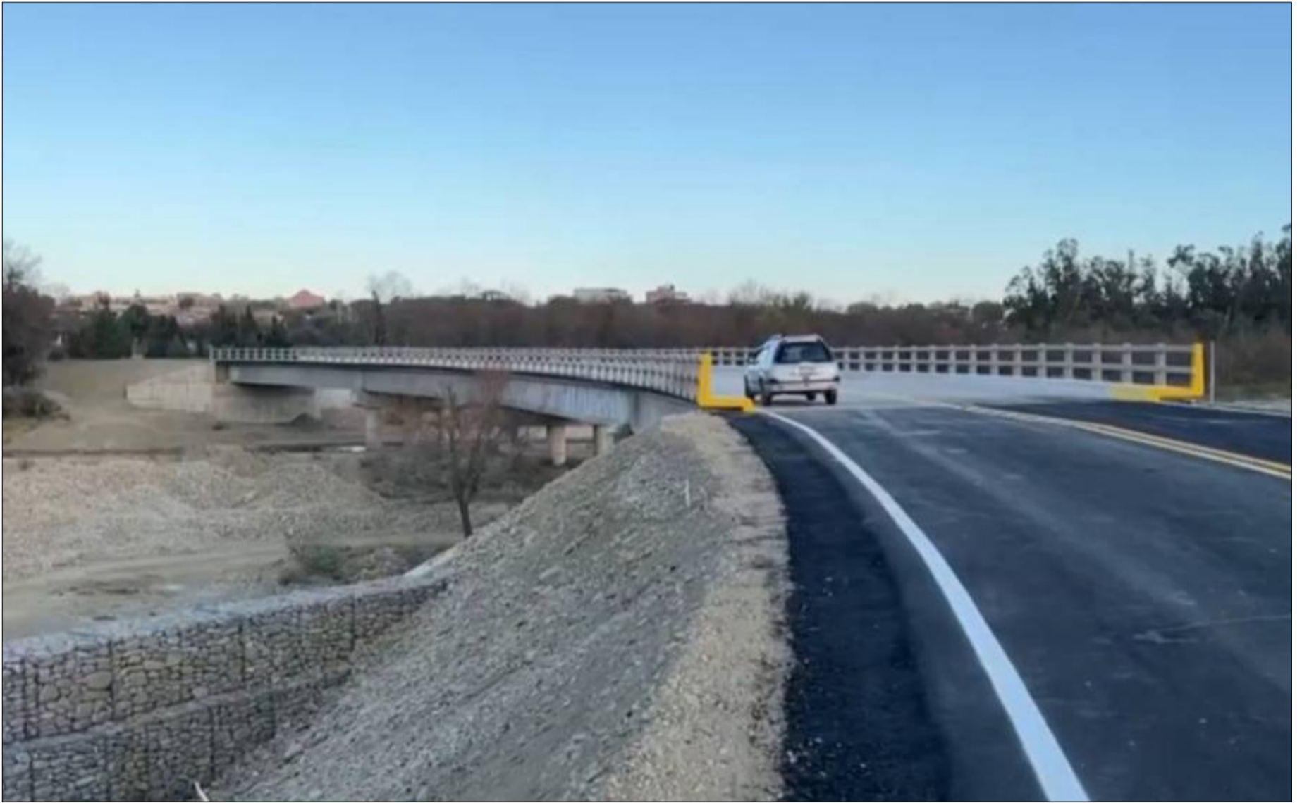
ESTE PUENTE SERÁ INAUGURADO OFICIALMENTE HOY.