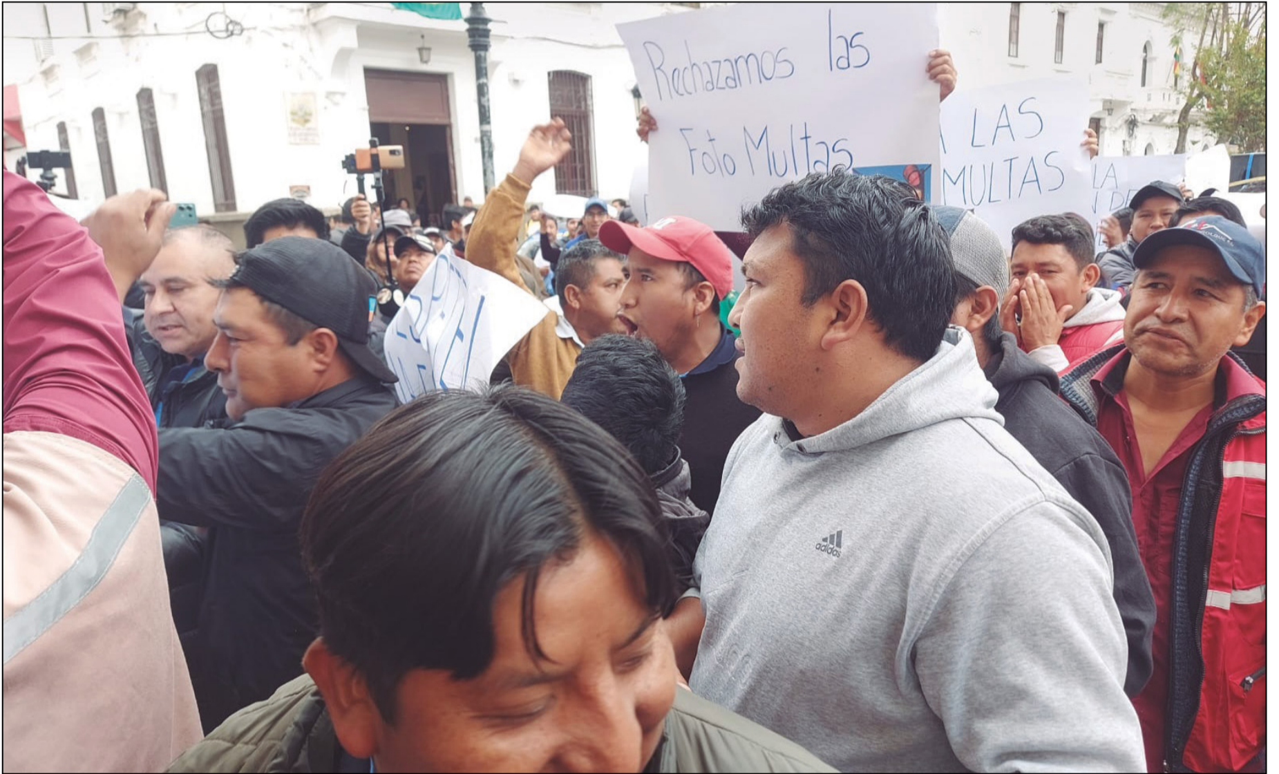
FACETA DE LA ÚLTIMA MOVILIZACIÓN CONTRA LAS FOTO MULTAS.