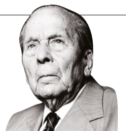
Jorge Luis Borges 1899-1986. Escritor argentino.

“ Yo no hablo de venganzas ni perdones, el olvido es la única venganza y el único perdón....”