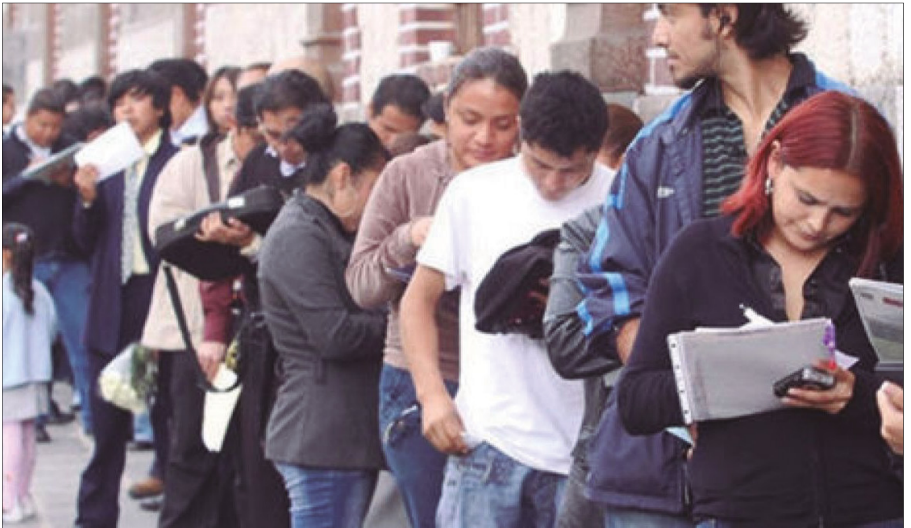
CIENTOS DE JÓVENES PROFESIONALES ESTÁN DESEMPLEADOS.

El dramático desempleo afecta más a jóvenes