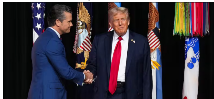
EL PRESIDENTE NORTEAMERICANO, DONALD TRUMP, ES RECIBIDO POR EL SECRETARIO DE DEFENSA, PETE HEGSETH