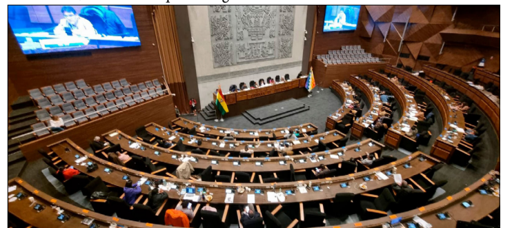
LOS MASISTAS PLANTEARON LA INICIATIVA EN LA ÚLTIMA SESIÓN.