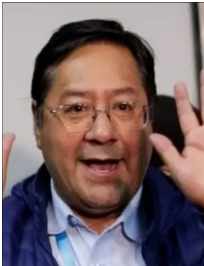
PRESIDENTE DE BOLIVIA, LUIS ARCE CATACORA.

La obra entró en funcionamiento hace un par de meses