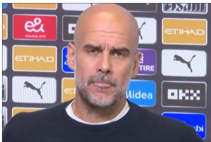
GUARDIOLA: "RODRI ES INSUSTITUIBLE EN MUCHAS COSAS"