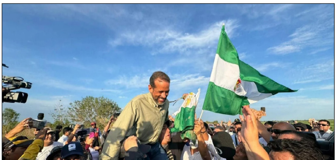
EL GOBERNADOR SALE DEL PREDIO INVADIDO Y CELEBRAN QUE SE FUERON LOS AVASALLADORES

gación, reitero, por el presunto delito de avasallamiento y otros tipos penales. No se descarta la ampliación por otros delitos de lesiones graves y leves, asociación delictuosa, privaciones de libertad entre otros tipos penales”, informó Alberto Zeballos, fiscal departamental.