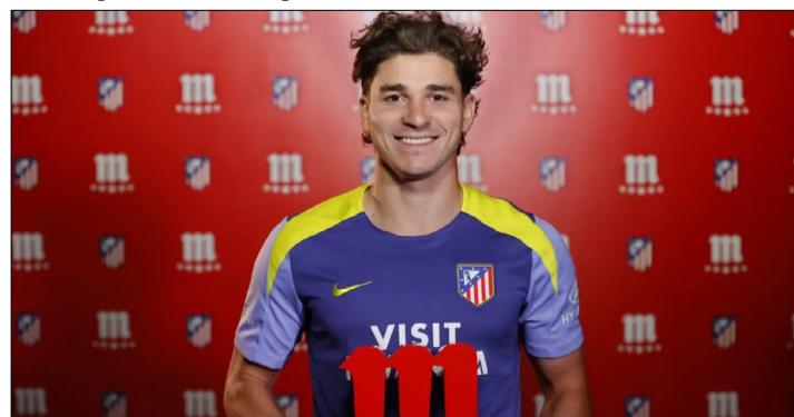
JULIÁN ÁLVAREZ POSA CON EL PREMIO JUGADOR CINCO ESTRELLAS DE SEPTIEMBRE.