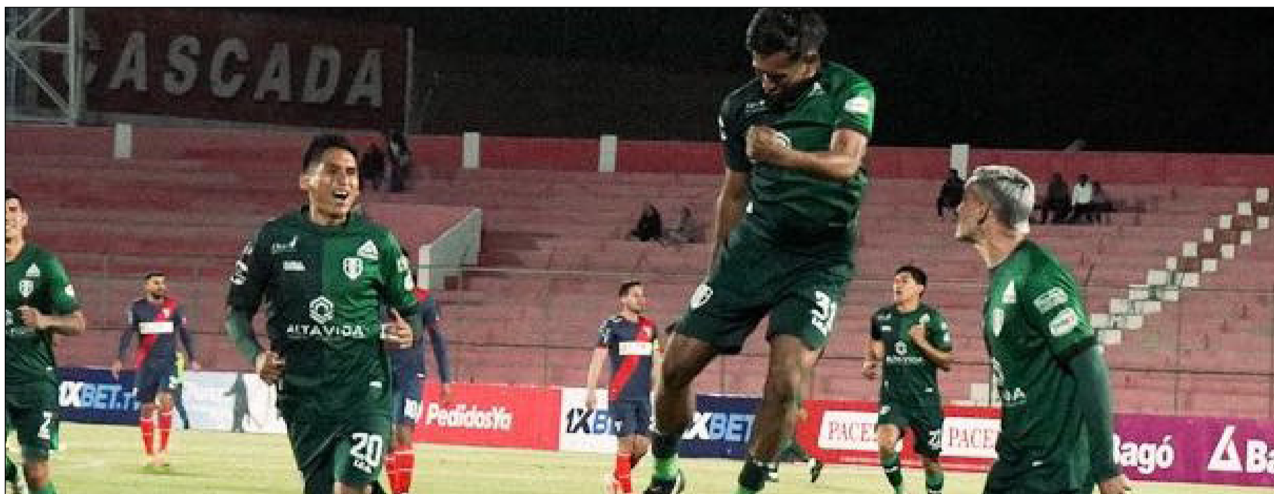
JUGADORES DE REAL TOMAYAPO, ESTE SÁBADO ESTRENARÁN DT.

División Profesional del fútbol boliviano