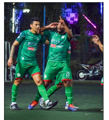
JUGADORES DE UNIÓN, SE PREPARAN PARA EL CLÁSICO.

PROGRAMACIÓN SEPTIMA FECHA DOMINGO 05 DE OCTUBRE ESTADIO MUNICIPAL LA BOMBONERA 16:30 PUMAS CHAPACOS VS APS TARIJA 18:30 15 DE ABRIL VS GARCIA AGREDA ESTADIO IV CENTENARIO 15:30 UNIÓN TARIJA VS ATLETICO CICLÓN MIÉRCOLES 08 DE OCTUBRE ESTADIO MUNICIPAL LA BOMBONERA 18:30 INDEPENDIENTE VS MUNICIPAL