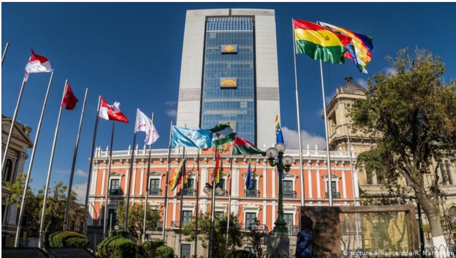
BOLIVIA SE PREPARA PARA TENER UN NUEVO GOBIERNO.