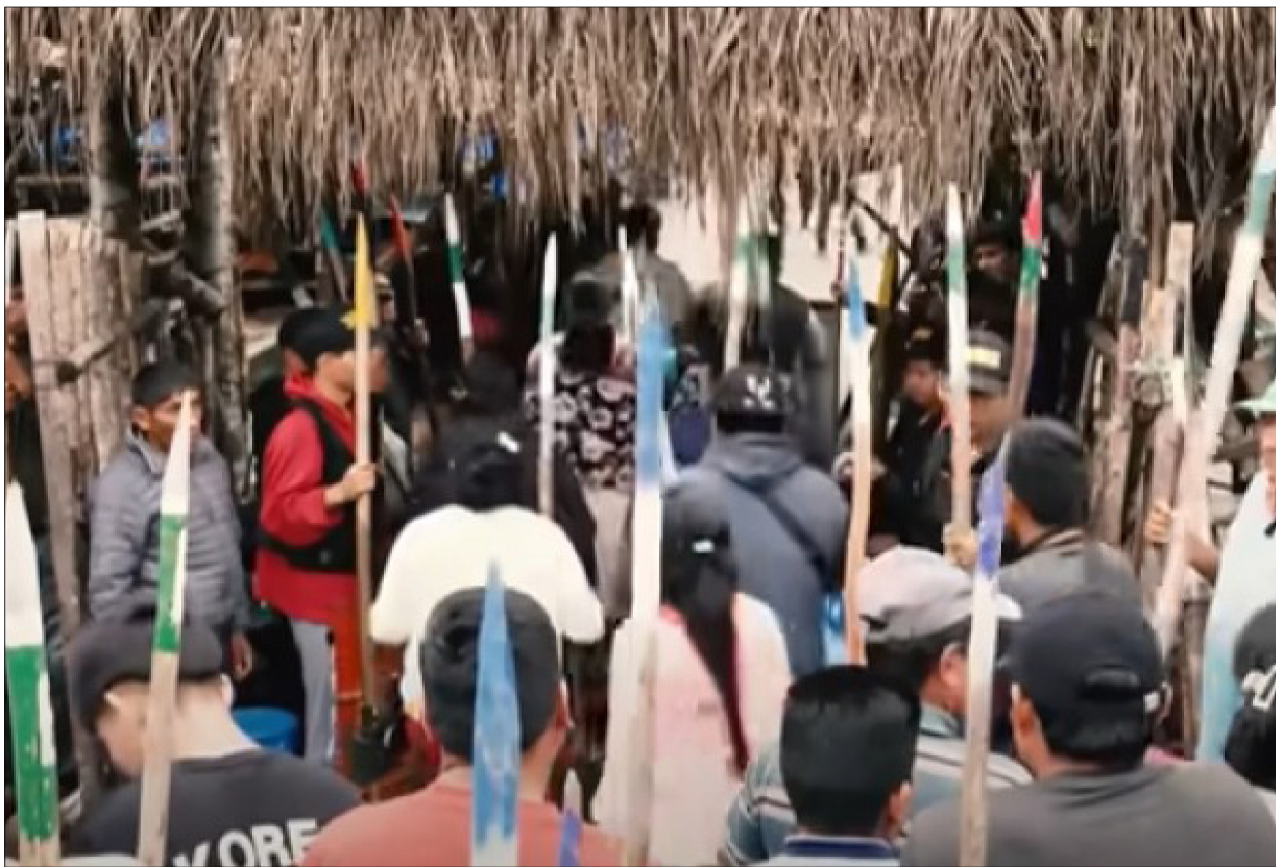
EVO MORALES ATRINCHERADO, PARECE ESTAR AL ACECHO.

El accionar gubernamental será determinante