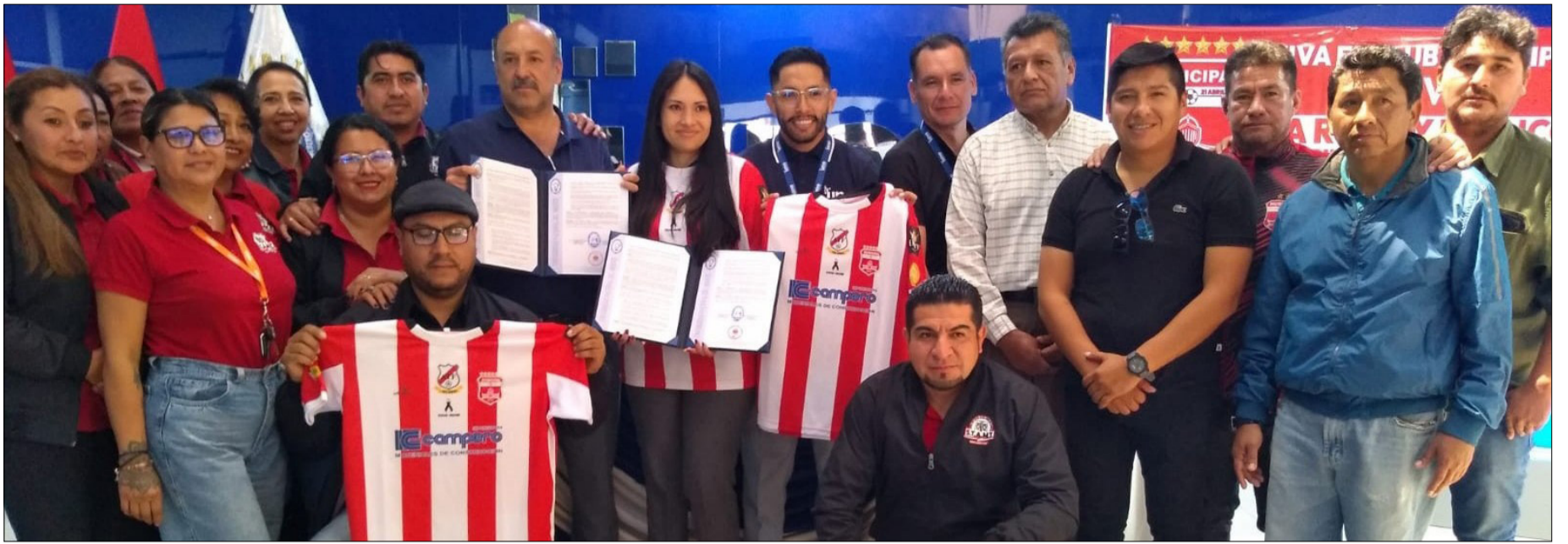
LOS DIRIGENTES DEL CLUB MUNICIPAL JUNTO A LAS AUTORIDADES DE LA UNO.