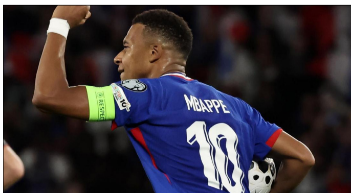
EL DELANTERO FRANCÉS FESTEJANDO SU GOL DE PENAL.