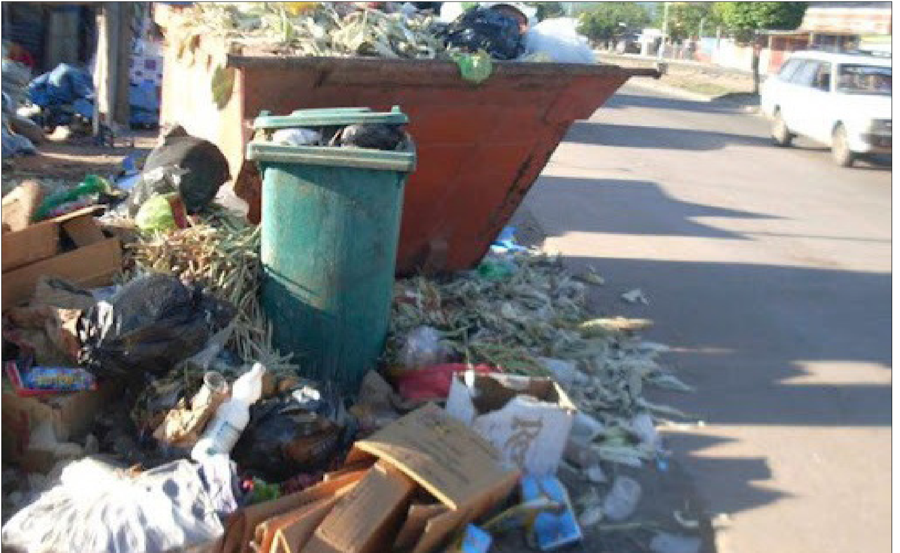
PROBLEMA DE LOS RESIDUOS SÓLIDOS EN BERMEJO, SIN SOLUCIÓN.