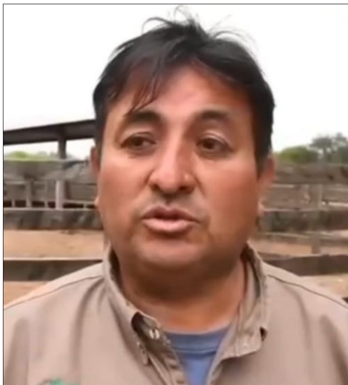
TÉCNICO DE SERAGRO EN VILLA MONTES.

ductores de la zona de transición, como de pie de monte porque ahí fueron las zonas más afectadas por una peste