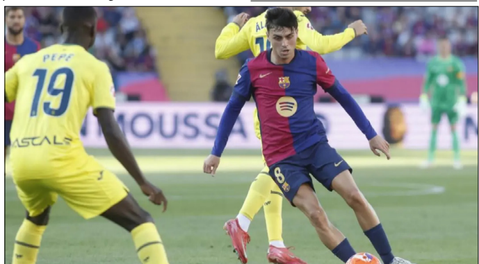
EL ÚLTIMO PARTIDO ENTRE BARÇA Y VILLARREAL DE LA TEMPORADA 2024-2025.