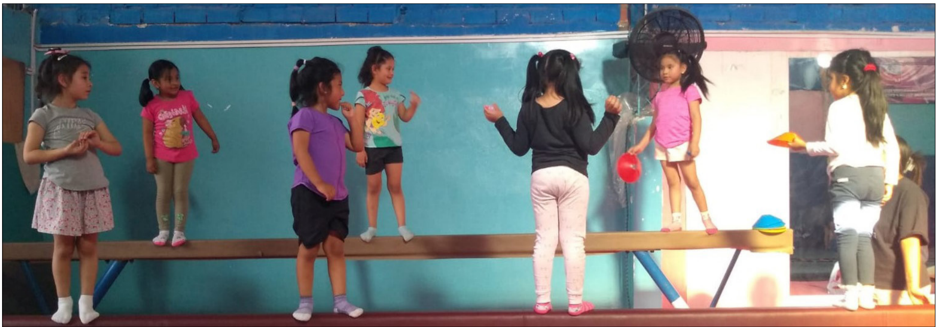
LAS GIMNASTAS DEL CLUB, DURANTE SUS ENTRENAMIENTOS.