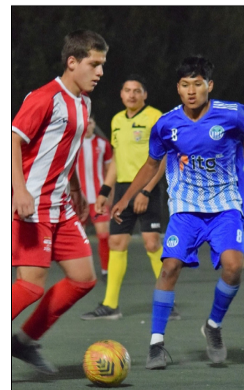
MUNICIPAL VA EN BUSCA DEL TRIUNFO.