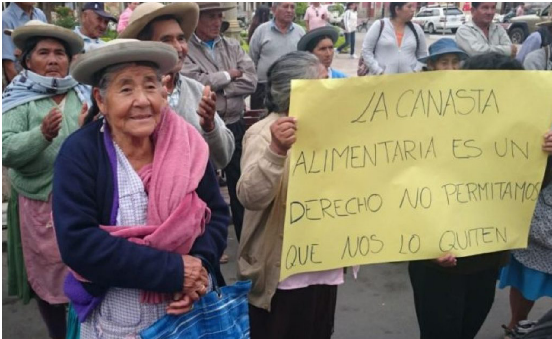
LEGISLADOR CONSIDERA QUE ADULTOS MAYORES SERÁN AFECTADOS.

El desacuerdo es porque el presupuesto no es participativo y se afecta a los sectores considerados vulnerables como los adultos mayores.