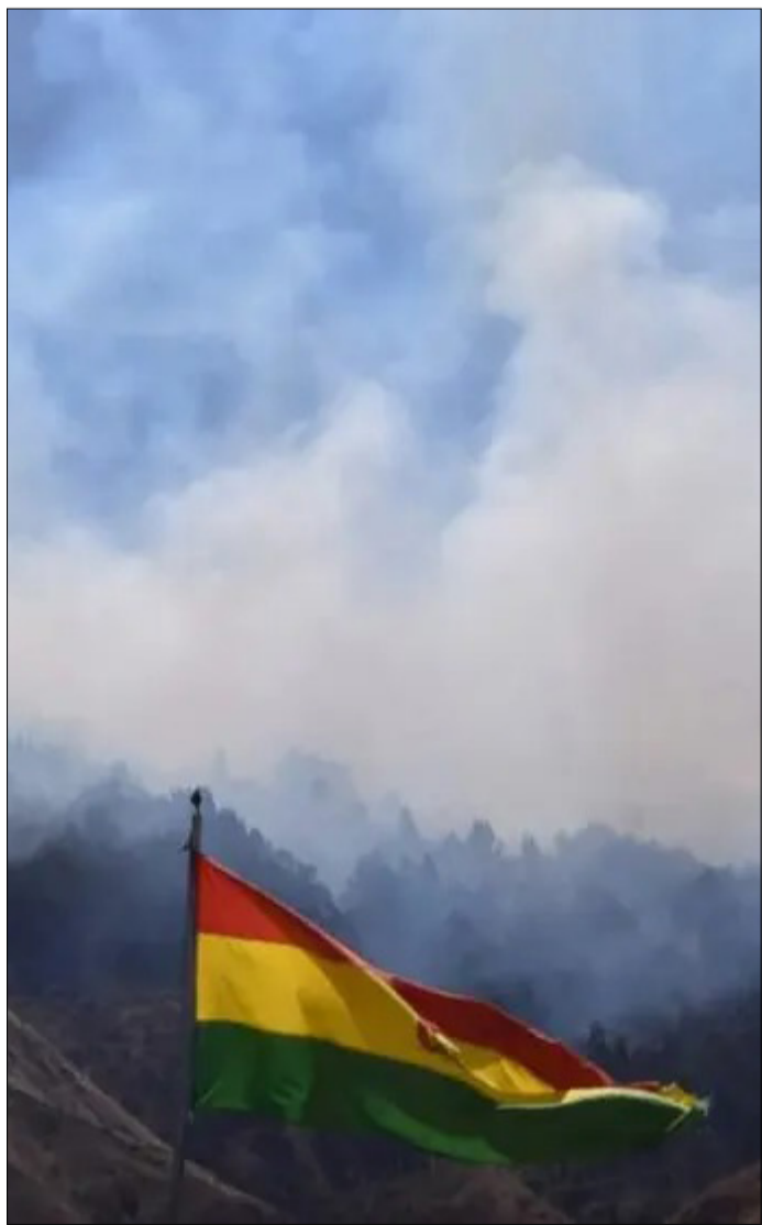
CUÉLLAR SOLÍA DEFENDER AL PRESIDENTE.