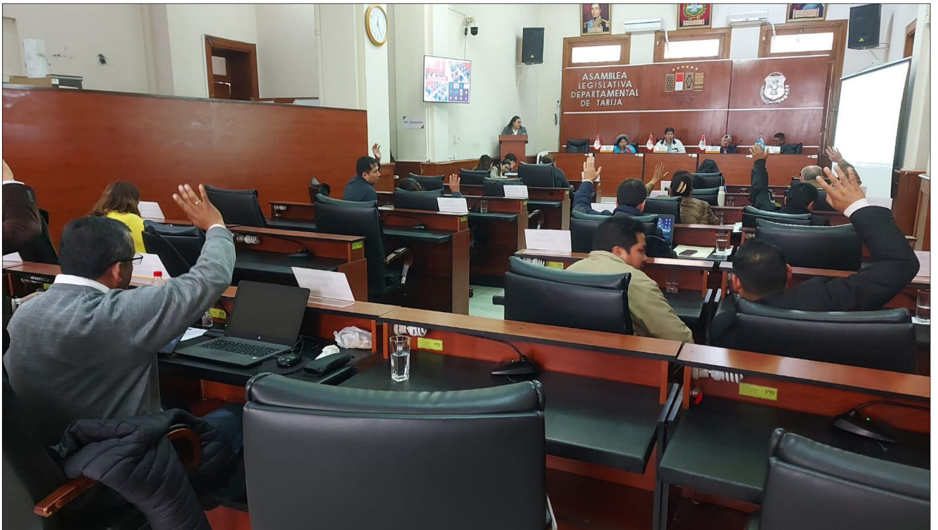
ASAMBLEA PREVÉ TRATAR LEY ELECTORAL DEPARTAMENTAL.