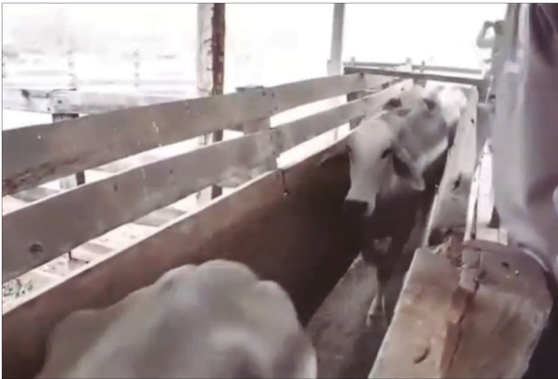
INVESTIGAN EN VILLA MONTES, CAUSAS DE MUERTE GANADO.

Dentro un acuerdo con universidad italiana