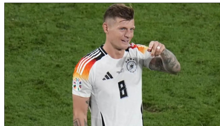
TONI KROOS, EN LA EUROCOPIA 2024 CON ALEMANIA.