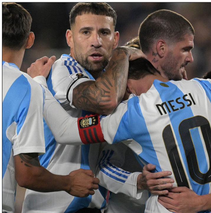
GARAY SERÁ EL JUEZ CENTRAL EN EL ALTO.