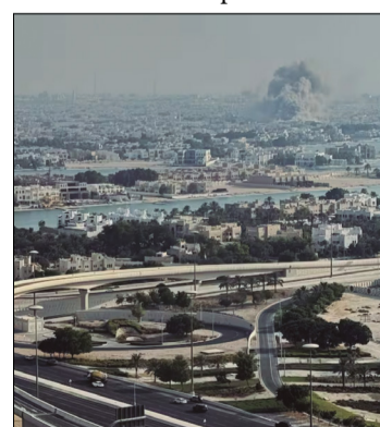
UN INESPERADO BOMBARDEO PUSO EN JAQUE LAS NEGOCIACIONES DE PAZ EN MEDIO ORIENTE