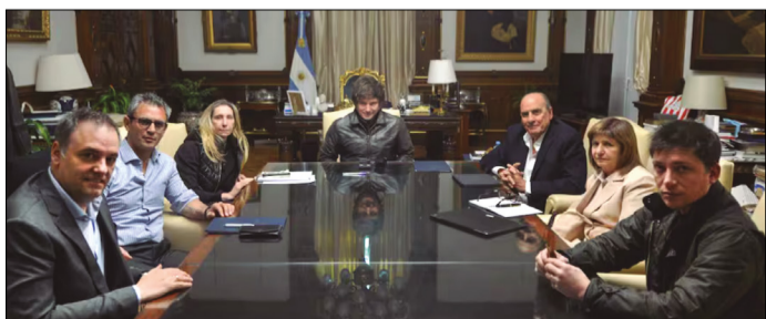
MILEI REUNIÓ A SU MESA POLÍTICA NACIONAL ESTE MARTES EN LA CASA ROSADA