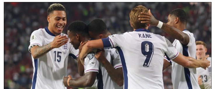
JUGADORES DE INGLATERRA CELEBRAN EL TRIUNFO ANTE SERBIA