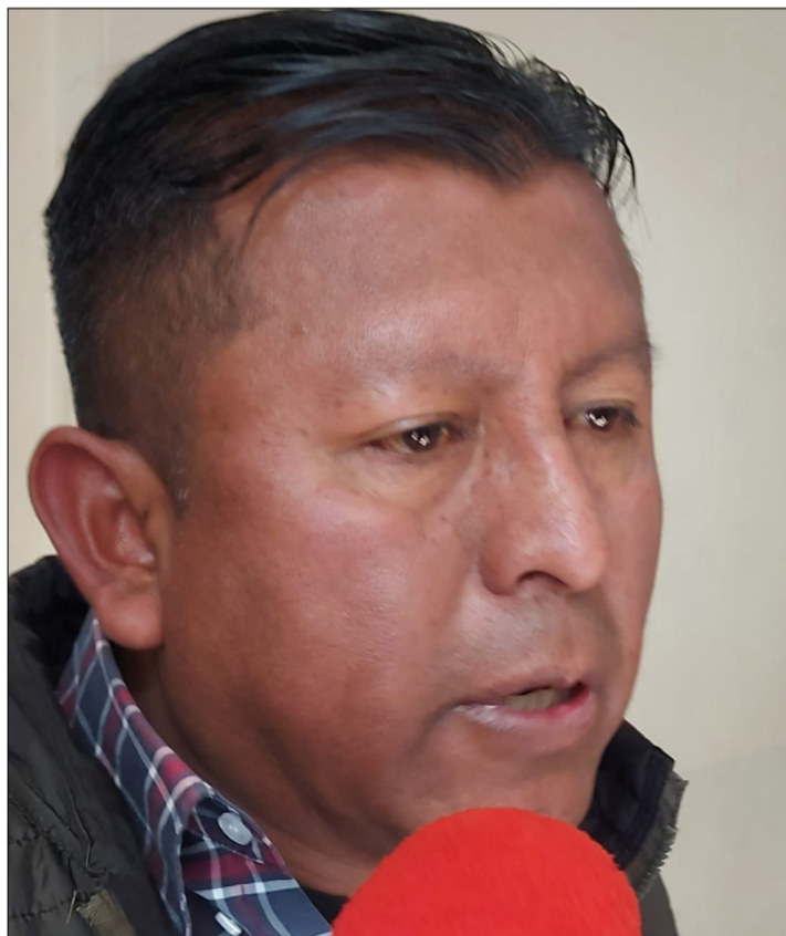
DIPUTADO NACIONAL, EDWIN ROSAS URZAGASTE.

Es un proyecto altamente beneficioso para las personas de escasos recursos, que están buscando superar la crisis para retomar sus actividades que se afectaron con los problemas económicos del país, insistió Rosas.