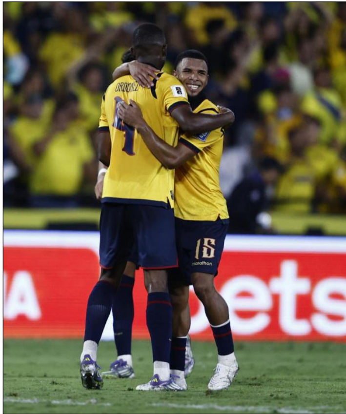
JUGADORES DE ECUADOR CELEBRAN LA VICTORIA FRENTE A ARGENTINA POR LAS ELIMINATORIAS.

Los ecuatorianos reclamaron al árbitro Roldán por una fuerte entrada de Tagliafico sobre Preciado dentro del área argentina. El atacante sangró tras el impacto, y tras una prolongada revisión en el VAR, el colombiano