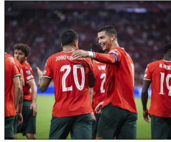
JUGADORES DE LA SELECCIÓN DE PORTUGAL CELEBRANDO GOL.

Con el control del partido, los lusos encontraban espacios por las dos bandas, con buenas conexiones entre Bernardo Silva y Cancelo, por la derecha, y de Nuno Mendes