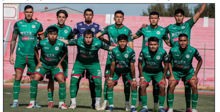
LOS JUGADORES DEL CUADRO DE UNIÓN TARIJA.

tan con jugadores que tienen un buen nivel de juego.