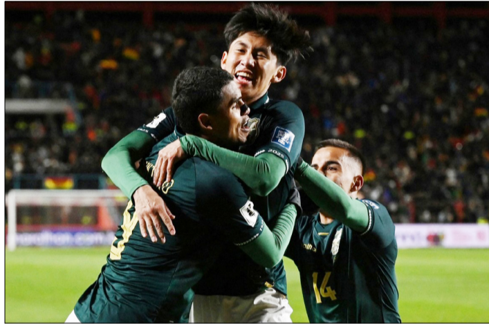
LOS BOLIVIANOS, A TODO O NADA EN EL REPECHAJE (REUTERS).