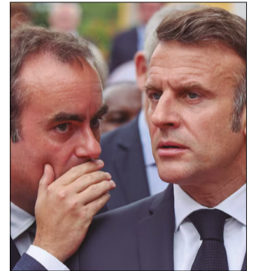
SÉBASTIEN LECORNU LE HABLA AL OÍDO AL PRESIDENTE EMMANUEL MACRON

Un candidato “a nada” que deberá ahora hacer frente a infinitos desafíos y, sobre todo, ser capaz de sortear la trampa de un presupuesto 2026 que ya provocó la caída de sus dos anteceso-