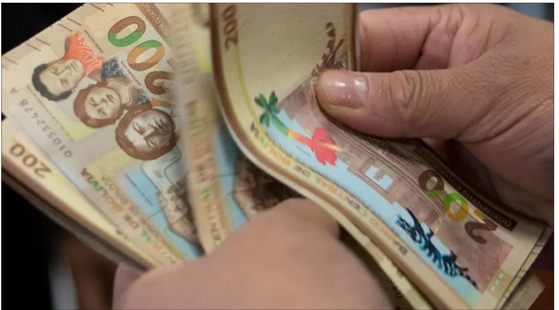
BUSCAN PAUSA PARA DEUDORES DE MICROCRÉDITOS.

No pone en riesgo el sistema financiero, aseguran