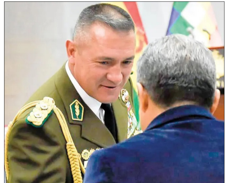
EL GENERAL MAYOR AUGUSTO RUSSO, COMANDANTE GENERAL DE LA POLICÍA.