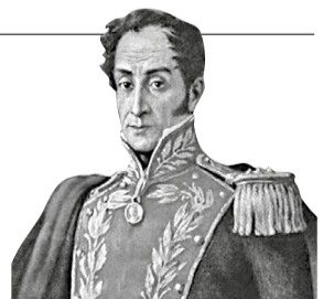
Simón Bolívar 1783-1830. Militar y político sudamericano de origen venezolano.

“ Para el logro del triunfo siempre ha sido indispensable pasar por la senda de los sacrificios.... ”