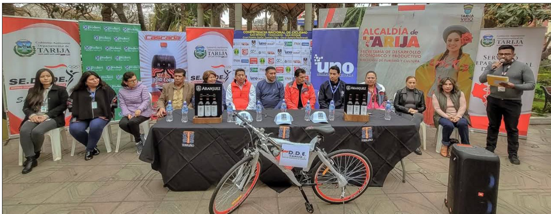
EL ACTO DE LA PRESENTACIÓN DE LA XXXVI COMPETENCIA.

XXXVI carrera de ciclismo San Roque – Chaguaya