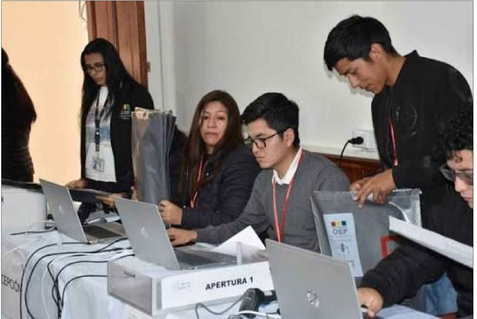
SELECCIONADOS COMO JURADOS ELECTORALES. DEBEN HACER LLEGAR SUS EXCUSAS HASTA EL 28 DE SEPTIEMBRE