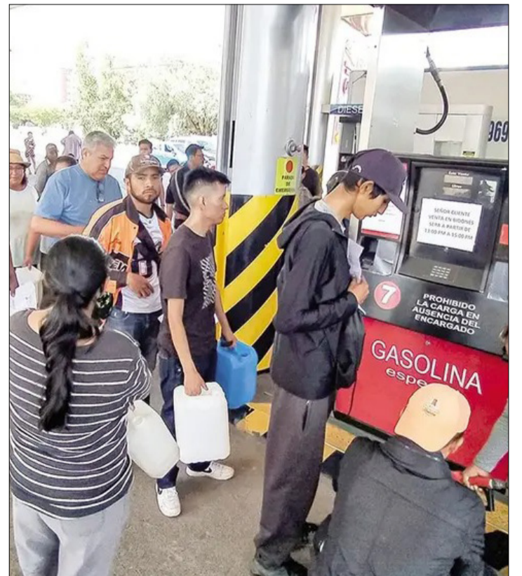
UNA IMAGEN DE LA POBLACIÓN HACIENDO FILAS EN SURTIDORES DE COCHABAMBA.