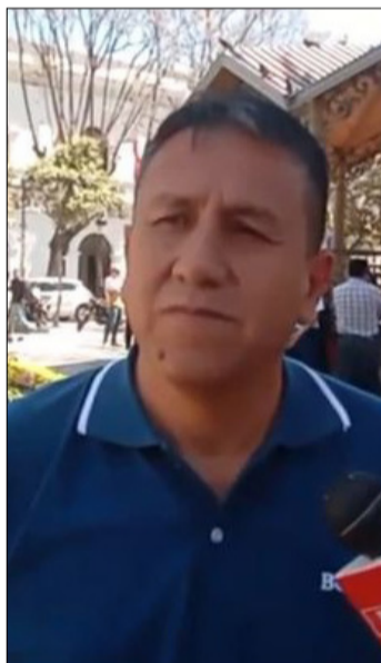
SENADOR NACIONAL LUÍS CASO

“Hay un aspecto positivo que no se puede negar: de alguna manera, el sistema de fotomultas está enseñando a respetar las señales de tránsito en la ciudad. Sin embargo, no podemos pasar por alto que el Concejo no