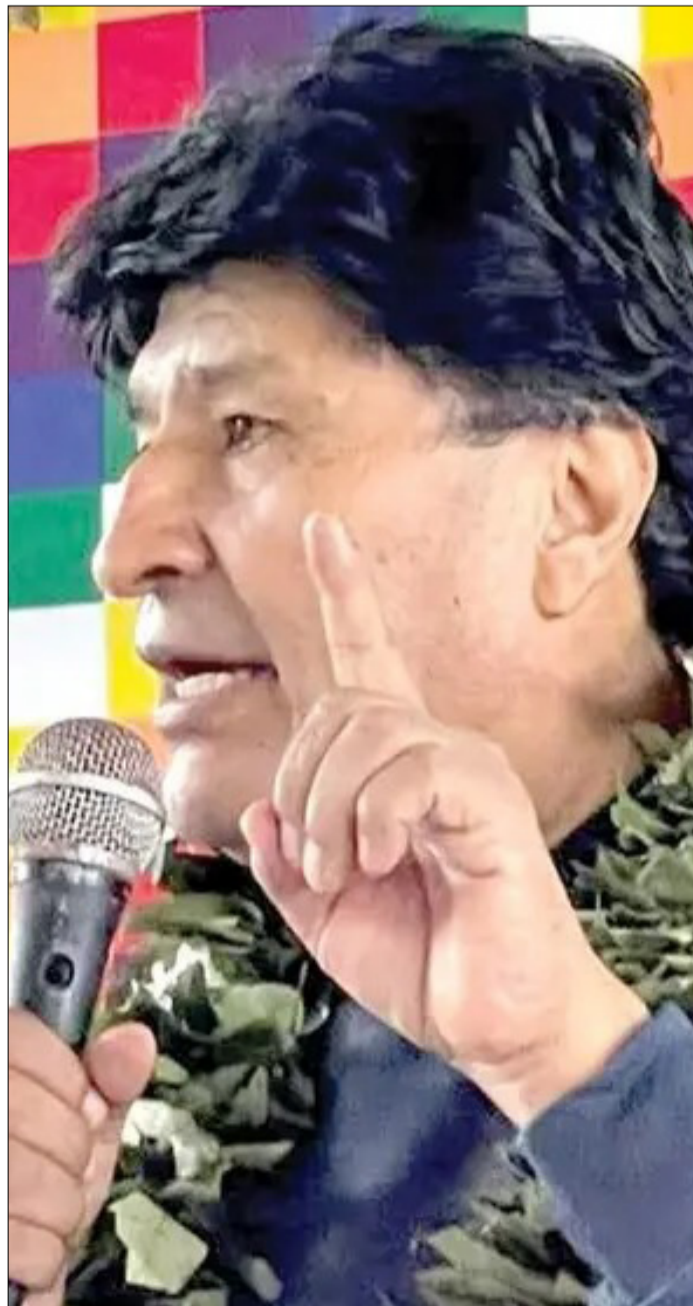
EL EXPRESIDENTE EVO MORALES EN UNA IMAGEN DE ARCHIVO.