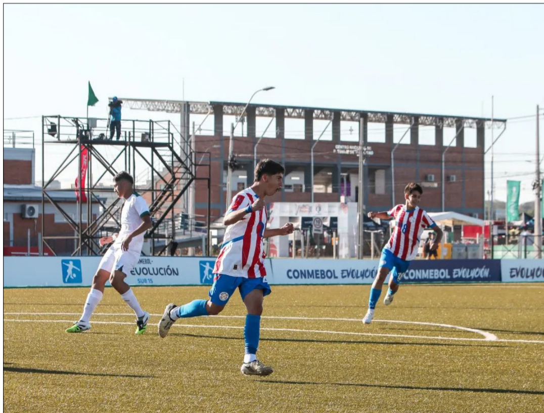
LA SUB 15 SUMA SU SEGUNDA DERROTA EN LA LIGA EVOLUCIÓN.