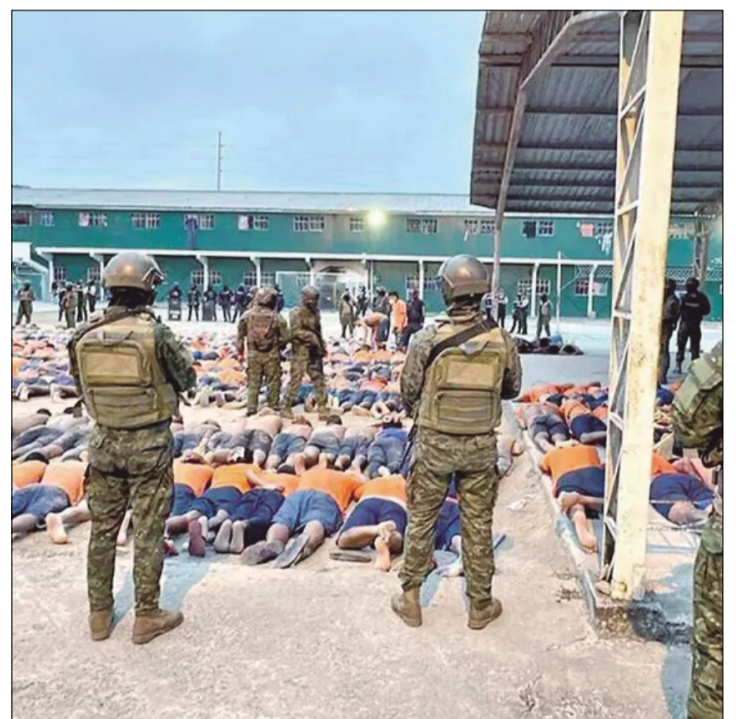
MILITARES CONTROLAN A LOS REOS TRAS INTERVENIR EN EL PENAL.