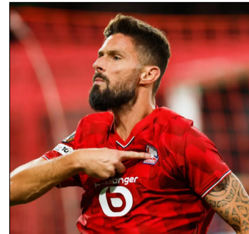
OLIVIER GIROUD, CELEBRANDO SU GOL CONTRA EL BRUNN