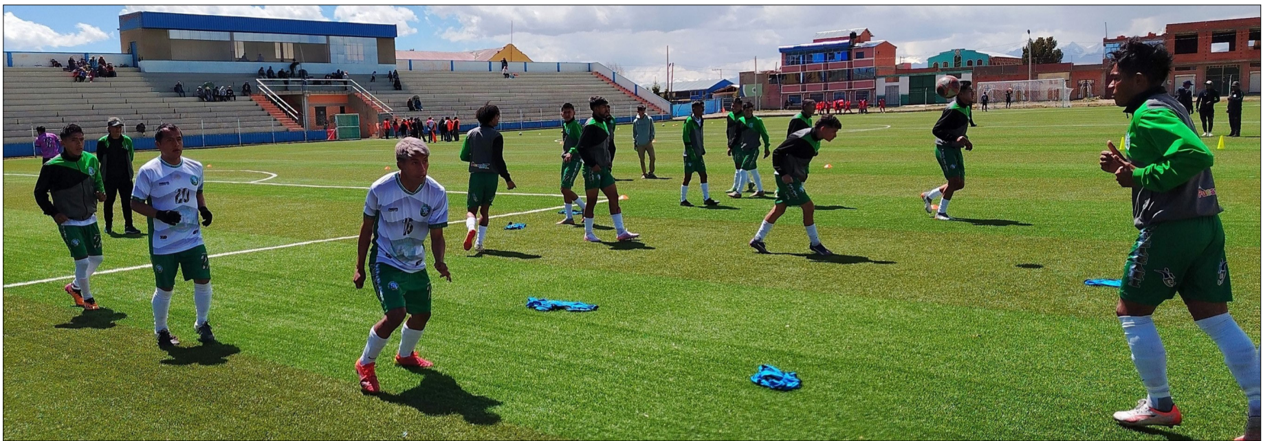
UNA DE LAS PRÁCTICAS DE CD PUCARANI, ANTES DE VIAJAR A TARIJA.