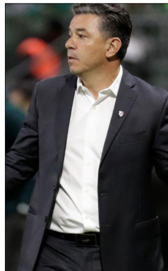
GALLARDO NO PUDO ARMAR UN EQUIPO TODAVIA.

falta un equipo mas "fuerte" para estas competencias. Lo repitió varias veces: "Debemos construir un equipo fuerte en lo individual y colectivo para competir y ganar. Es nuestra obligación". Él sabe que, hoy, también es parte del problema porque no logró ese ensamble y esa identidad, marca registrada de sus viejos equipos. Solo por momentos, quedó dicho.