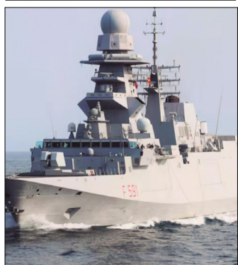
ESTA FOTOGRAFÍA, SIN FECHA NI UBICACIÓN, DIFUNDIRA POR LA MARINA MILITARE ITALIANA, MUESTRA LA FRAGATA ITALIANA VIRGINIO FASAN (F 591) EN EL MAR