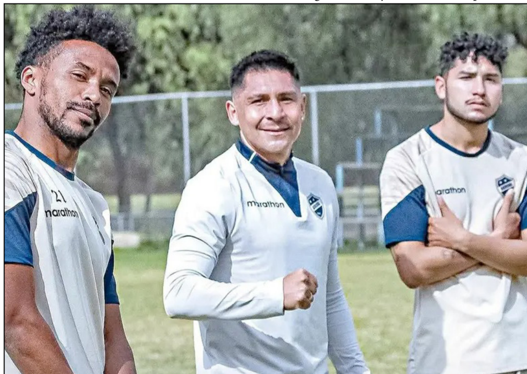
JUGADORES DE AURORA EN UN ENTRENAMIENTO.

Una victoria en el Capriles volvería a dejar la distancia entre Aurora y Wilster a 5 partidos, pero un empate o una nueva derrota podría terminar de sentenciar la ilusión celeste por salvarse del descenso desde el mérito deportivo, aferrándose en consecuencia a la resolución que emita el TAS próximamente.