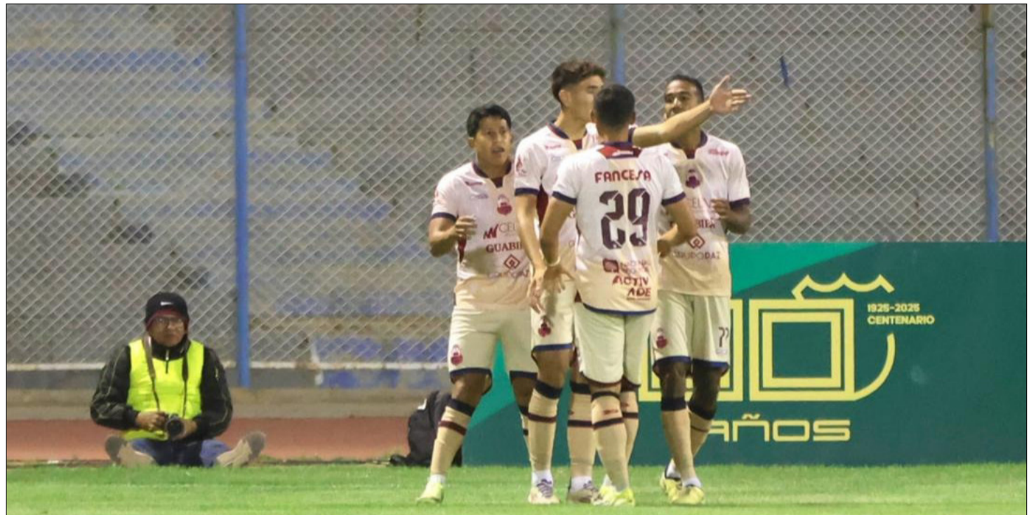
FESTEJO AZUCARERO LUEGO DE VENCER EN A REAL ORURO.