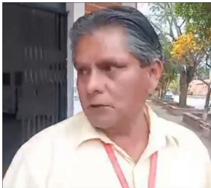
DIRIGENTES DE LA JUNTA DISTRICTAL DE PADRES DE FAMILIA EN BERMEJO, QUE SE DECLARARON EN EMERGENCIA

La situación refleja una creciente preocupación en la frontera tarijeña, donde padres y madres de familia reclaman ser partícipes en la planificación educativa, al considerar que solo con transparencia y corresponsabilidad se podrá garantizar un año escolar 2026 con mejores condiciones para los estudiantes.