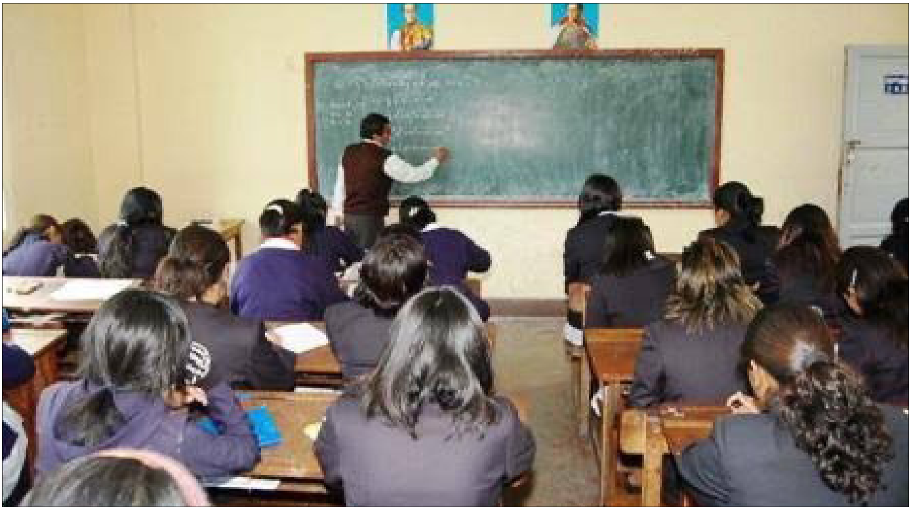
LOS ESTUDIANTES INGRESAN EN EL TERCER TRIMESTRE DE FORMACIÓN EN LA GESTIÓN 2025