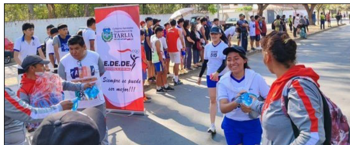
LOS ESTUDIANTES DE LAS UNIDADES EDUCATIVAS SERÁN PARTICIPES DE LA CARRERA.