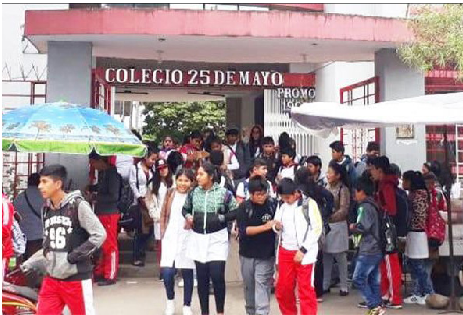
COLEGIO 25 DE MAYO, DE DÓNDE INGRESARON JÓVENES QUE LLEVARON EL ALTO EL NOMBRE DE LA CIUDAD DE BERMEJO