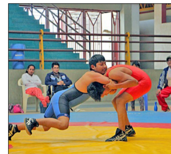
LOS ATLETAS, LISTOS PARA LA COMPETENCIA.

"Será un torneo importante para todos los deportistas de la