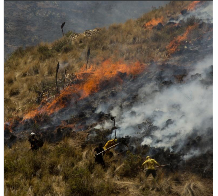
LOS INCENDIOS FORESTALES SON RECURRENTES EN LOS MESES DE SEPTIEMBRE Y OCTUBRE