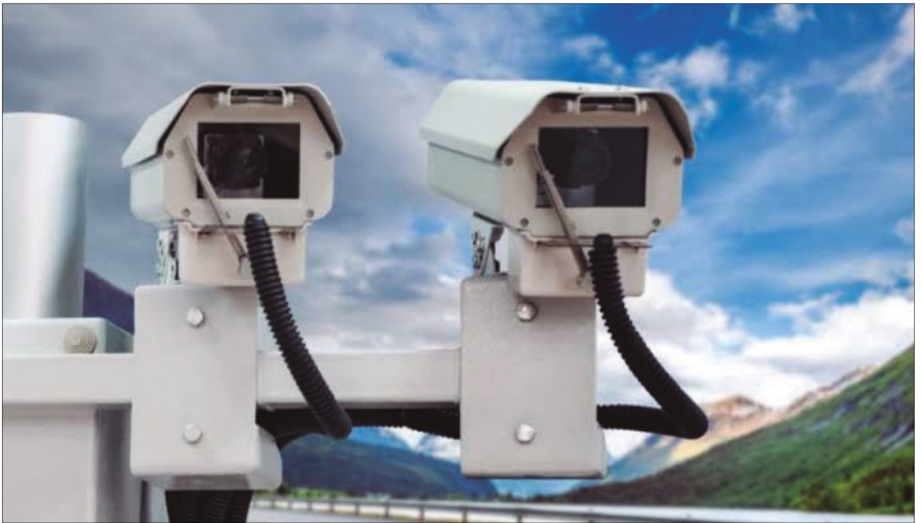
CÁMARAS QUE TOMAN FOTOS Y EVIDENCIAN INFRACCIONES DE TRÁNSITO

Fotomultas en Tarija generan controversia