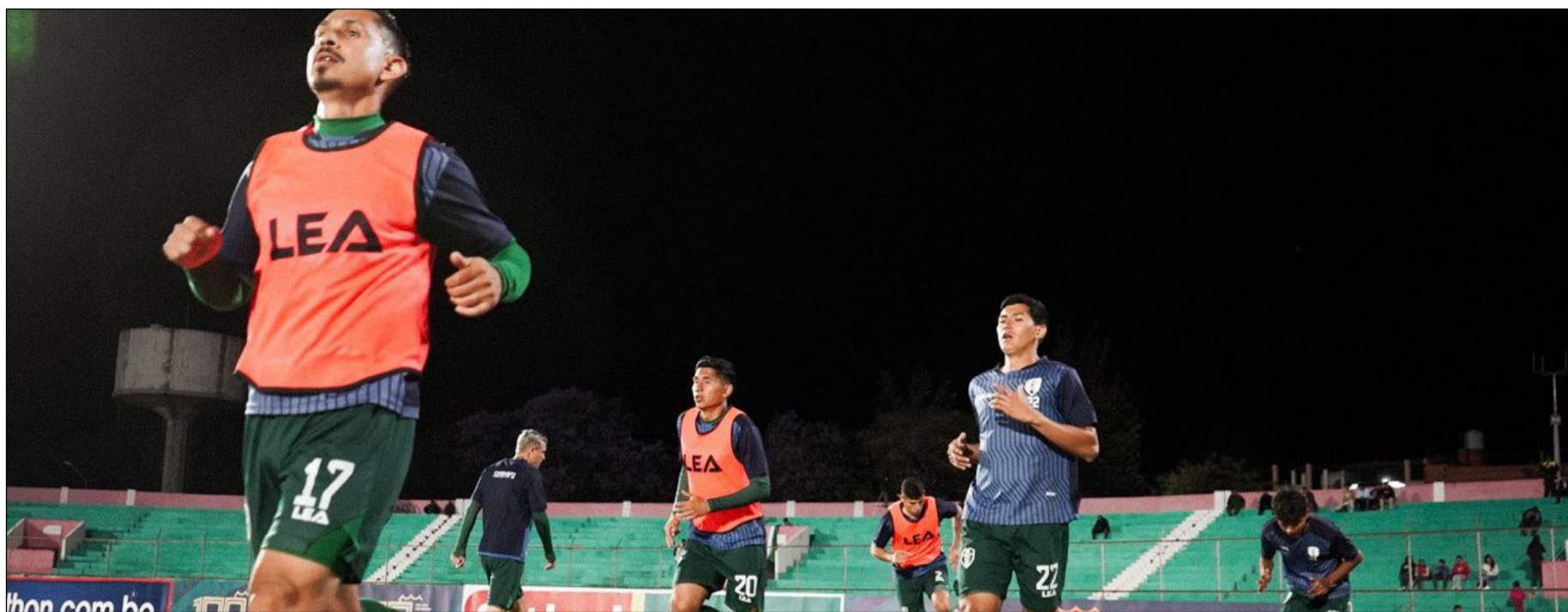
LOS JUGADORES DE REAL TOMAYAPO FUERON A SUCRE POR LOS 6 PUNTOS. (FOTO: PRENSA/TOMAYAPO).

División Profesional del fútbol boliviano