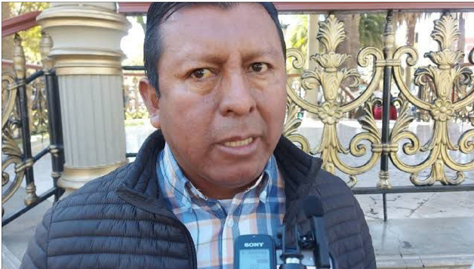
DIPUTADO NACIONAL, EDWIN ROSAS, DETRACTOR DE LA GESTIÓN DE OSCAR MONTES