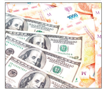
BILLETES DE PESOS Y DÓLARES