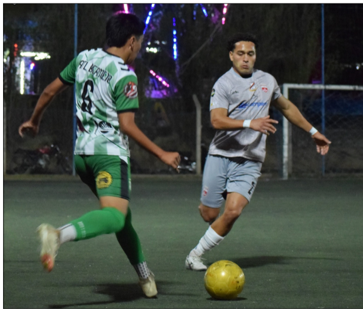
LOS JUGADORES DE MUNICIPAL VAN POR LOS TRES PUNTOS.

El costo de las entradas para el partido de este sábado, es de bolivianos 20 para mayores y 10 bolivianos para menores, la venta se iniciará desde horas 13:00 en las boleterías del estadio IV Centenario y las puertas de ingreso al escenario deportivo se abrirán desde horas 14:00.