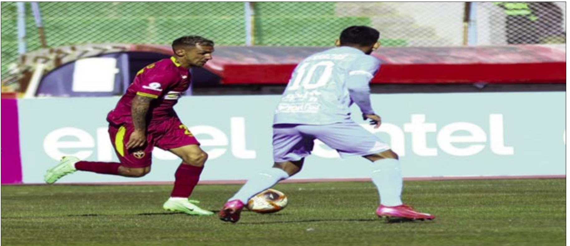
SAN ANTONIO CONSIGUE EN LOS ULTIMOS MINUTOS LOS TRES PUNTOS DEL PARTIDO.