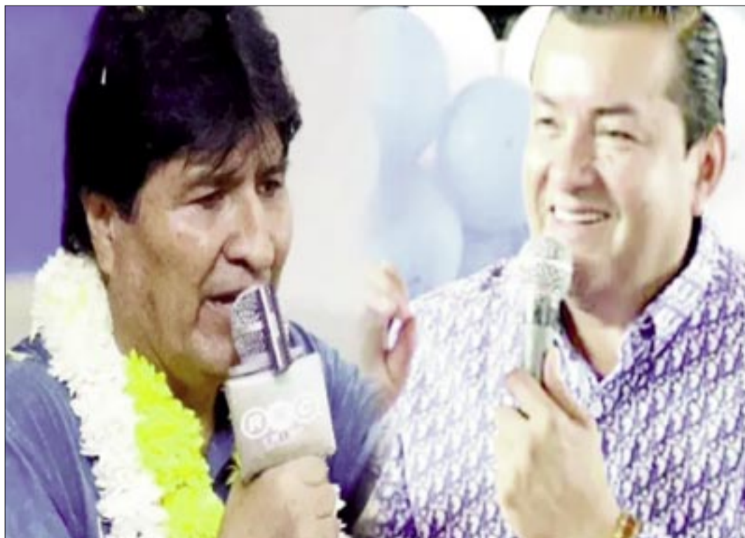
LA ALIANZA LA FUERZA DEL PUEBLO DE UCS, CUYO REPRESENTANTE ES EL ALCALDE DE SANTA CRUZ, JHONNY FERNÁNDEZ (D), Y EVO MORALES (I).

El expresidente Evo Morales, reveló que la Alianza Fuerza del Pueblo se contactó con él para conformar una alianza de cara a las elecciones presidenciales. Sin embargo, el evismo le puso dos condiciones para consolidar un acuerdo.