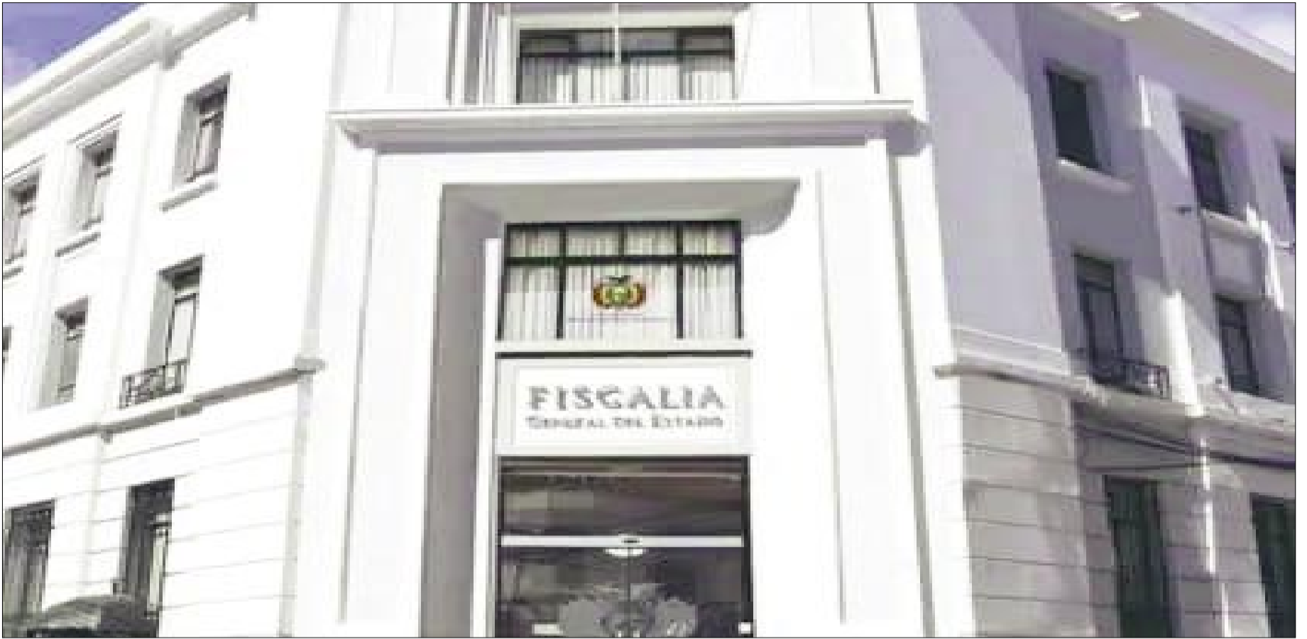
FISCALÍA GENERAL DEL ESTADO (REF)

Implementación del Sistema Justicia Libre