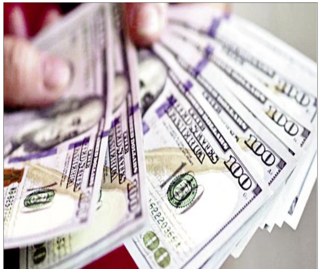
DIVISA. UN CIUDADANO MUESTRA UNOS DÓLARES ESTADOUNIDENSES, ESCASOS EN EL PAÍS ACTUALMENTE.

dientes de tratamiento por más de $us 1.741 millones.