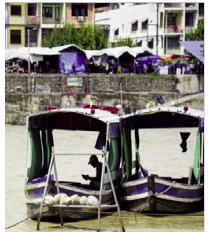
PUERTO CHALANAS (REF)

La falta de un pronunciamiento oficial por parte de la Armada Boliviana hasta el momento también genera incertidumbre sobre las acciones a seguir y la respuesta institucional ante estos actos de resistencia. La población de Bermejo, por su parte, espera que se atiendan tanto las necesidades de seguridad como las socioeconómicas, a fin de evitar que la tensión escale a mayores conflictos