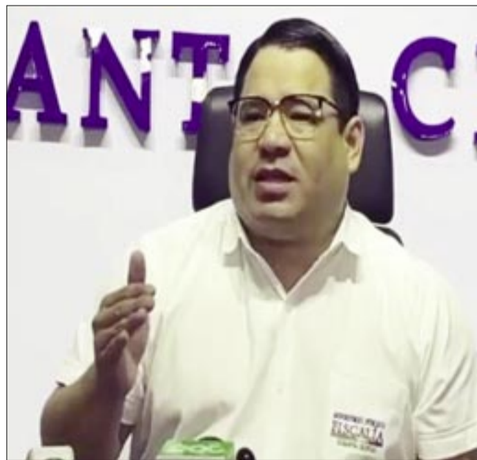
ROGER MARIACA, FISCAL GENERAL

La anticipación en la habilitación de la plataforma de consulta de jurados, aun antes del anuncio oficial, demuestra la intención del TSE de optimizar la difusión de información y facilitar la organización de la ciudadanía. Esta acción, sumada al robusto plan de la Fiscalía, busca prevenir cualquier intento de irregularidad y salvaguardar la integridad del proceso democrático boliviano, en un contexto preelectoral que ha estado marcado por diversas tensiones y debates políticos