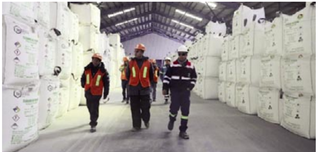
LA PLANTA EN POTOSÍ PRODUCE CARBONATO DE LITIO.

bierno debe impulsar la producción de carbonato de litio grado industrial a través de las piscinas de evaporación y la planta que ya está operando, aunque no en toda su capacidad.