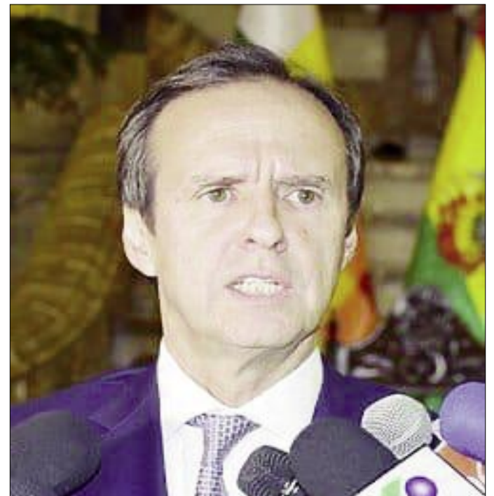
JORGE QUIROGA, CANDIDATO A PRESIDENTE

Además, su compromiso con una campaña "artesanal" y el énfasis en la austeridad buscan diferenciarse de las grandes maquinarias partidarias, apelando a la cercanía con la gente y a un mensaje más auténtico. Este estilo de campaña, si bien desafiante, podría generar una mayor empatía en un momento en que la ciudadanía valora la transparencia y la probidad en la política.