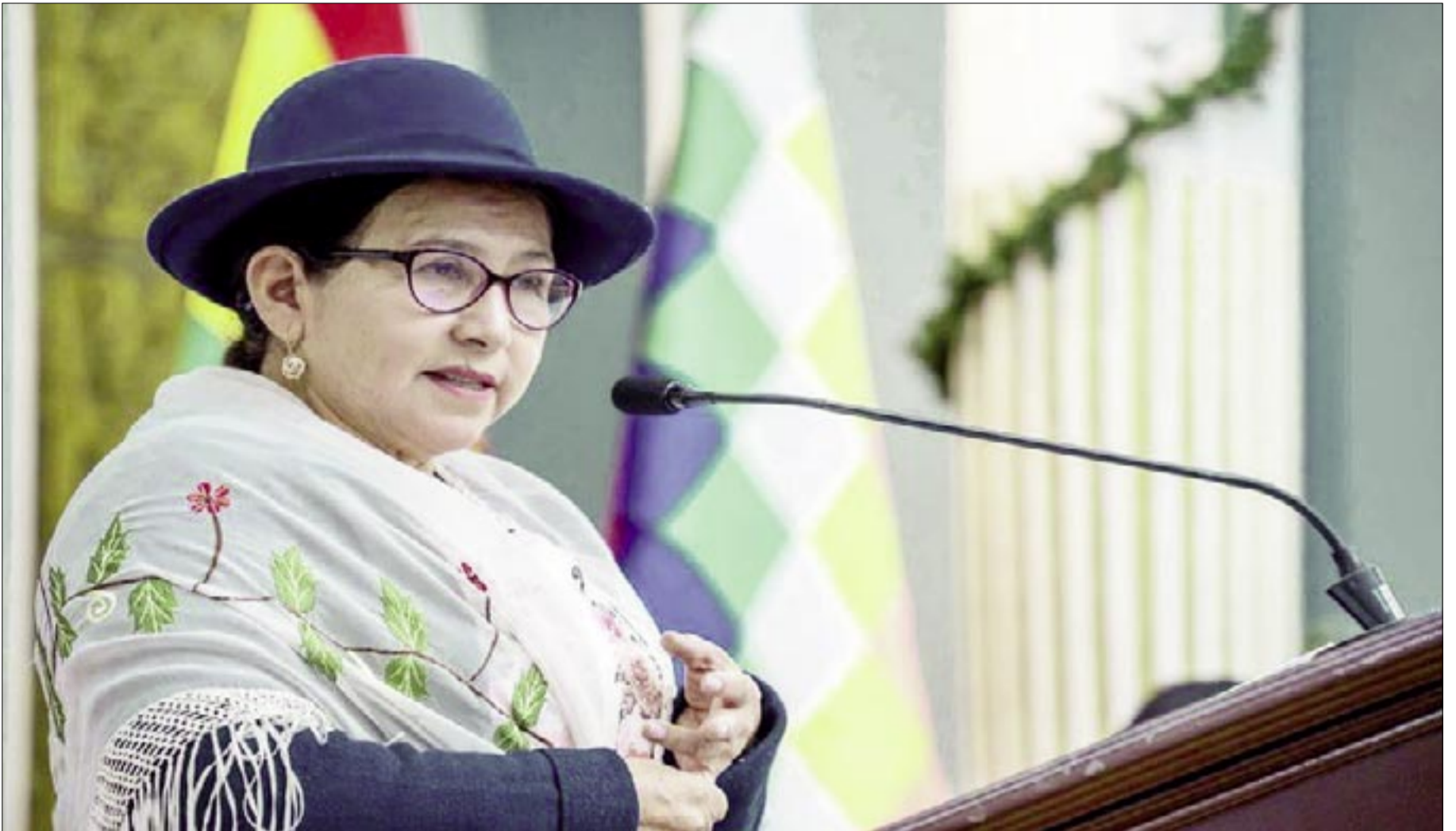
CANCILLER CELINDA SOSA

Gobierno boliviano garantiza transparencia electoral