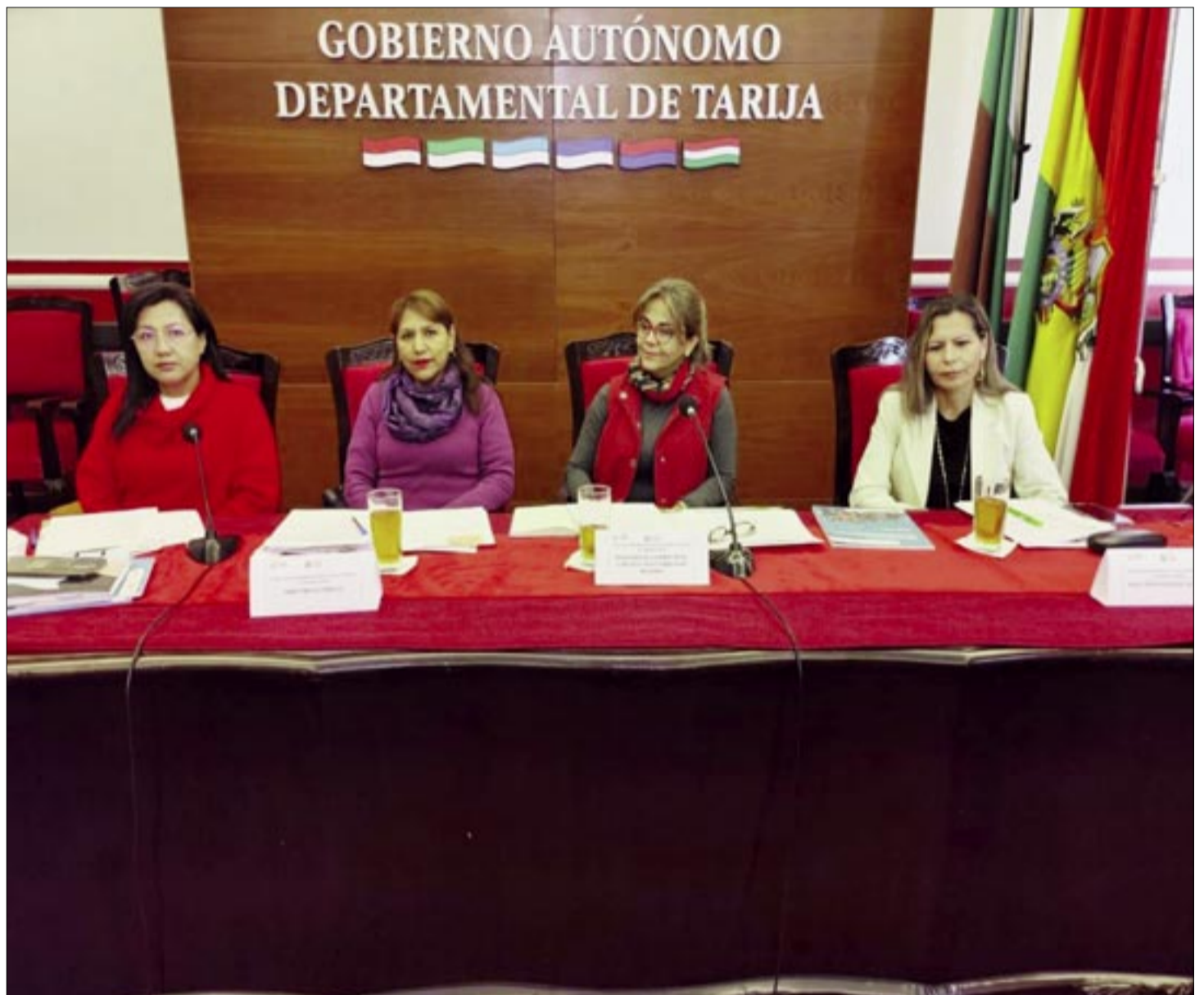
COMISIÓN DE TRATA Y TRÁFICO