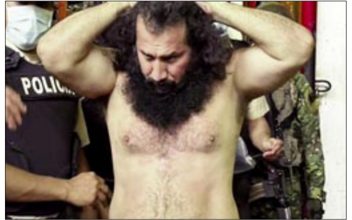
EL NARCOTRAFICANTE Y LÍDER CRIMINAL MÁS BUSCADO DE ECUADOR, JOSÉ ADOLFO MACÍAS VILLAMAR (FITO),

Su nueva captura se dio después de permanecer año y medio en paradero desconocido, tras su fuga a finales de 2023 de la Cárcel Regional de Guayaquil, donde