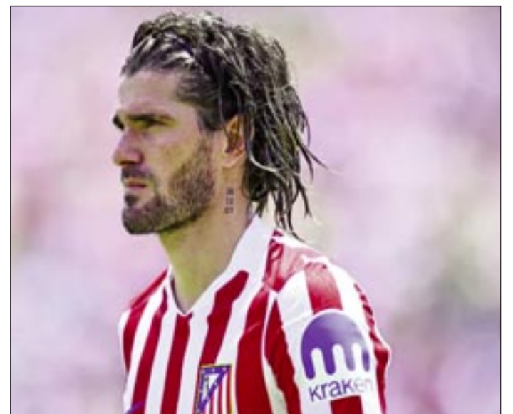
RODRIGO DE PAUL, CON LA CAMISETA DEL ATLÉTICO DE MADRID.