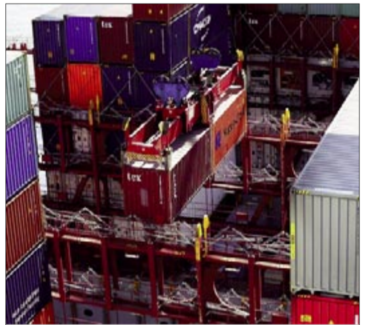
UE PREPARARÁ UN PLAN DE REPRESALIAS ANTE ENDURECIMIENTO DE LA POSTURA COMERCIAL DE EE.UU.

El bloque ya ha aprobado aranceles potenciales sobre 21.000 millones de euros de productos estadounidenses que podrían aplicarse rápidamente en respuesta a los gravámenes de Trump sobre los metales.