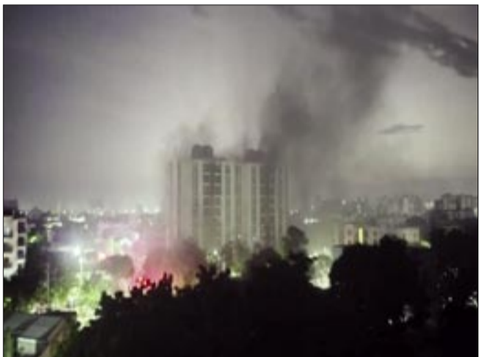
EN BARRANQUILLA, UN INCENDIO EN UN EDIFICIO DEJO UN SALDO DE TRES PERSONAS FALLECIDAS. ADEMÁS, 45 PERSONAS FUERON TRASLADADAS A CENTROS DE SALUD, ENTRE ELLAS 13 HERIDOS, INCLUYENDO DOS NIÑAS DE DOS Y TRES AÑOS