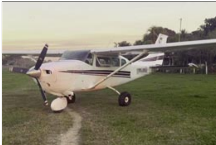
LA AVIONETA FUE SECUESTRADA EN EL CHAPARE