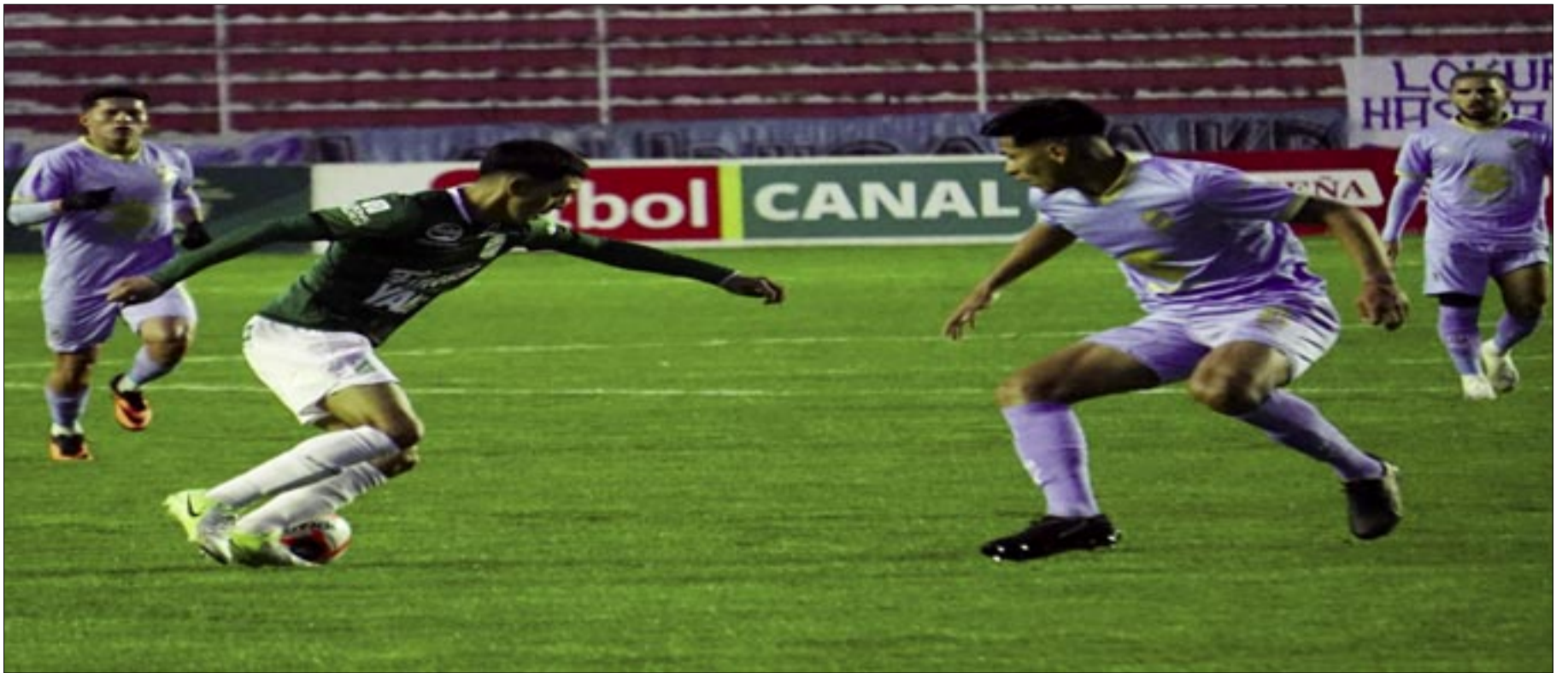
BOLÍVAR SUFRIÓ HASTA EL FINAL PARA GANARLE A ORIENTE (1-0) EN EL HERNANDO SILES.