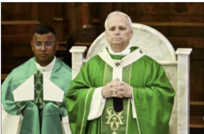
EL PAPA LEÓN XIV BENDICE DESPUÉS DE DIRIGIR UNA MISA EN LA CATEDRAL DE SAN PANCRACIO EN ALBANO LAZIALE, CERCA DE CASTEL GANDOLFO, AL SURESTE DE ROMA, EL 20 DE JULIO

El papa León XIV renovó su llamado este domingo para un cese al fuego inmediato en Gaza, pidiendo a la comunidad internacional que respete las leyes internacionales y la obligación de proteger a los civiles.