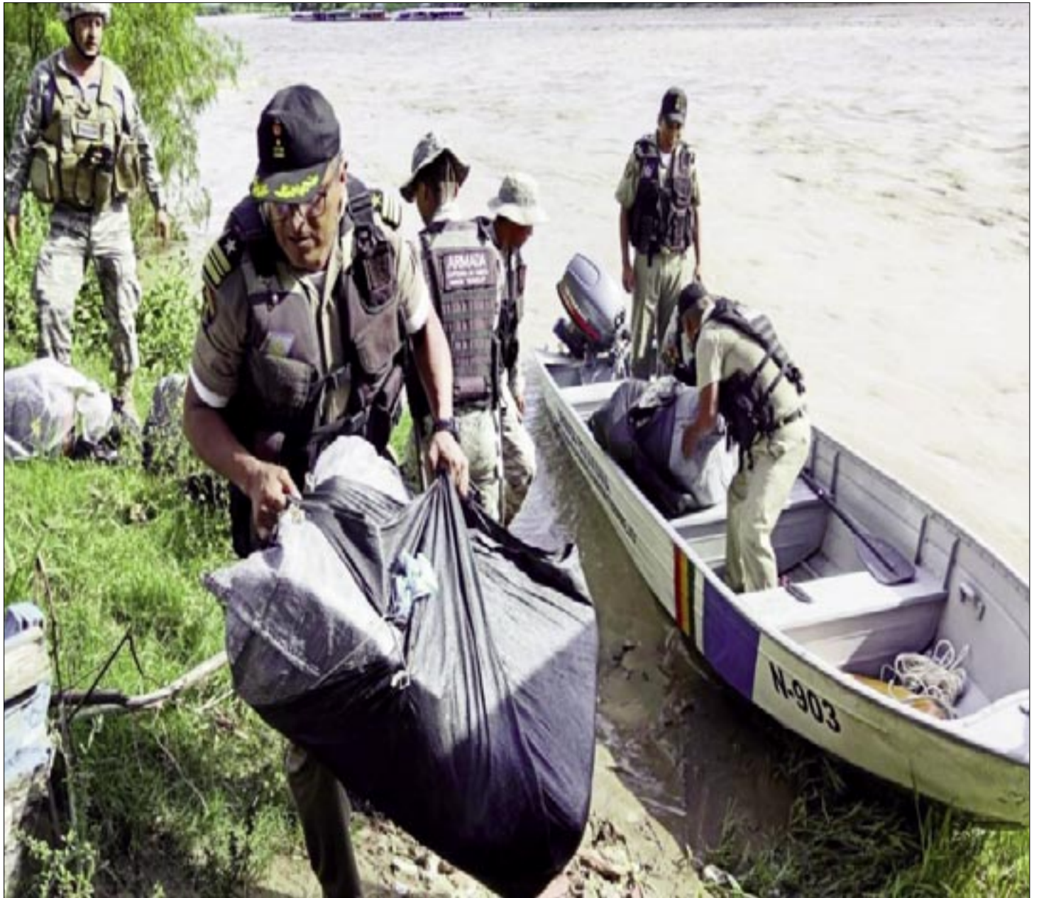
ARMADA NACIONAL (REF)

Esta situación genera una contradicción cada vez más tensa entre la necesidad del Estado boliviano de controlar el contrabando –que impacta negativamente en la economía formal y en la industria nacional– y la compleja rea-