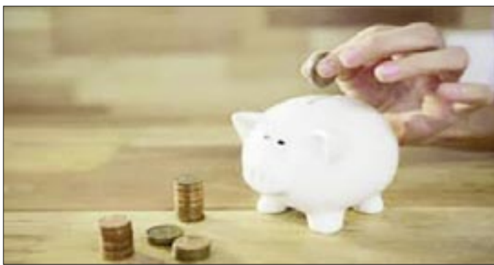
“LA INCLUSIÓN FINANCIERA TIENE EL POTENCIAL DE MEJORAR VIDAS Y TRANSFORMAR ECONOMÍAS ENTERAS”, SOSTUVO EL PRESIDENTE DEL GRUPO BANCO MUNDIAL, AJAY BANGA