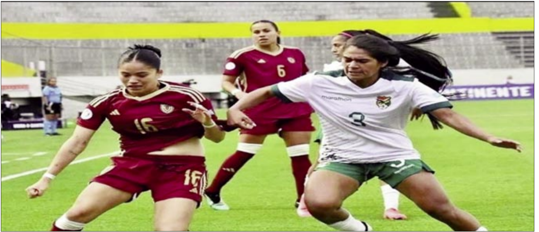
LA SELECCIÓN BOLIVIANA FEMENINA SE DESPIDE DE LA COPA AMÉRICA.