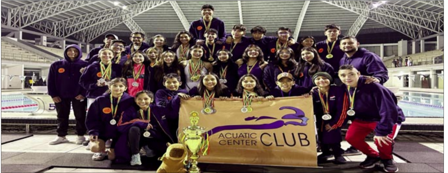
LOS NADADORES DEL CLUB ACUATIC CENTER, CUMPLIERON CON EL OBJETIVO.

Federación Boliviana de Deportes Acuáticos