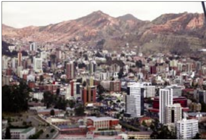
EDIFICIOS EN LA PAZ, BOLIVIA, EL VIERNES 23 DE OCTUBRE DE 2015.

DANIEL SALAZAR CASTELLANOS/BLOOMBERG LÍNEA