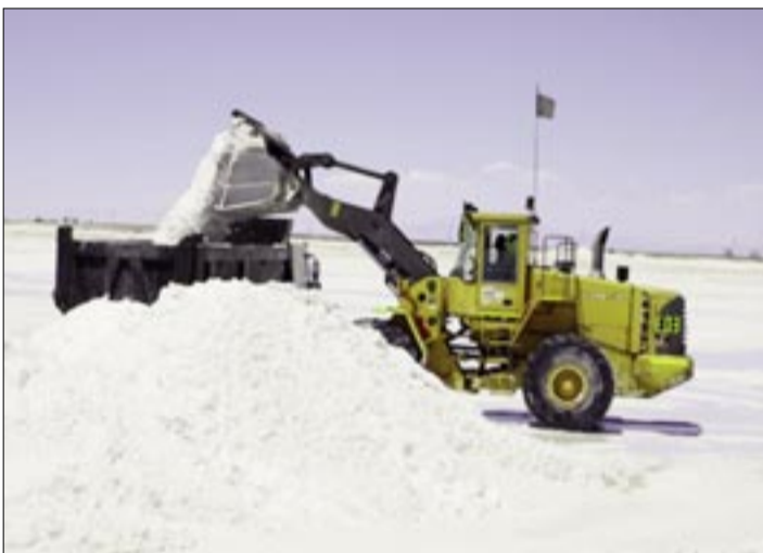
EXPLOTACIÓN DE LITIO EN UYUNI A CARGO DE YLB, UNO DE LOS RECURSOS CON POTENCIAL DE BOLIVIA.

El 7 de julio este medio también reportó que la inversión extranjera directa neta recibida por Bolivia del extranjero (IED) en el primer trimestre de esta gestión, alcanzó un valor de 223 millones de dólares.