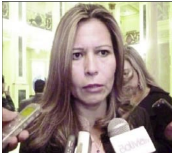
FISCAL SANDRA GUTIÉRREZ

La implementación de Justicia Libre y la digitalización de procesos son cruciales en la era actual, no solo para la agilización de trámites, sino también para asegurar una mayor transparencia y trazabilidad en cada caso. Esta iniciativa no solo beneficia la operatividad interna de la Fiscalía, sino que refuerza la confianza pública en la capacidad del Ministerio Público para responder eficazmente a las demandas de justicia de la población