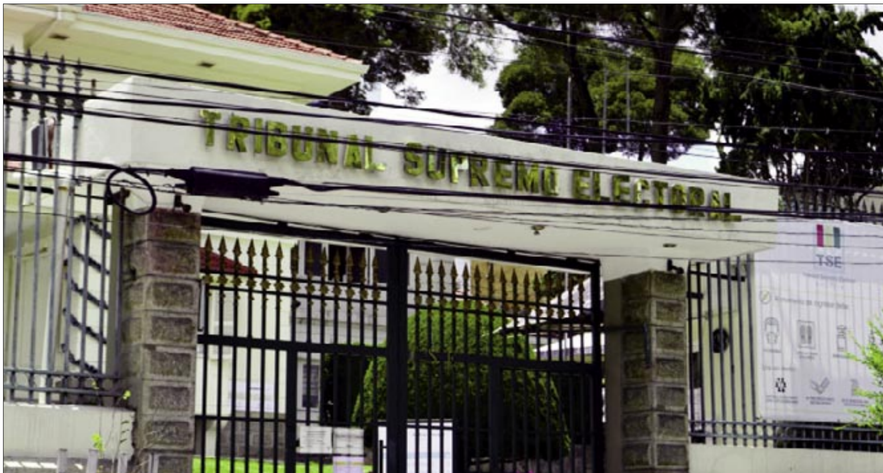
TRIBUNAL SUPREMO ELECTORAL (TSE)

TSE habilita plataforma para consulta de jurados electorales