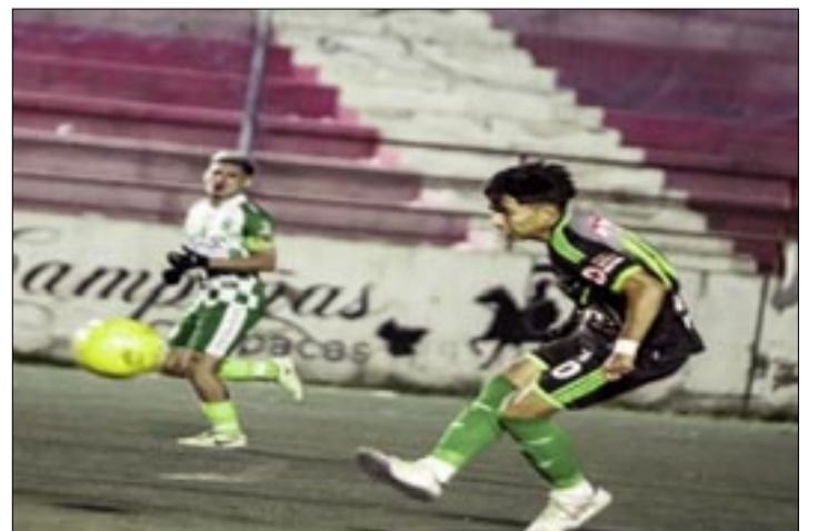
JUGADORES DEL PLANTEL DE UNIÓN TARIJA, YA PIENSAN EN LA FASE NACIONAL. (FOTO: FOTO/ARCHIVO).

Mientras que el plantel de Río San Juan Humi, tendría que jugar en el estadio de Villazón, sin embargo, en el transcurso de los próximos días, la comisión de competiciones del ente federativo, realizará la inspección respectiva del mencionado escenario deportivo