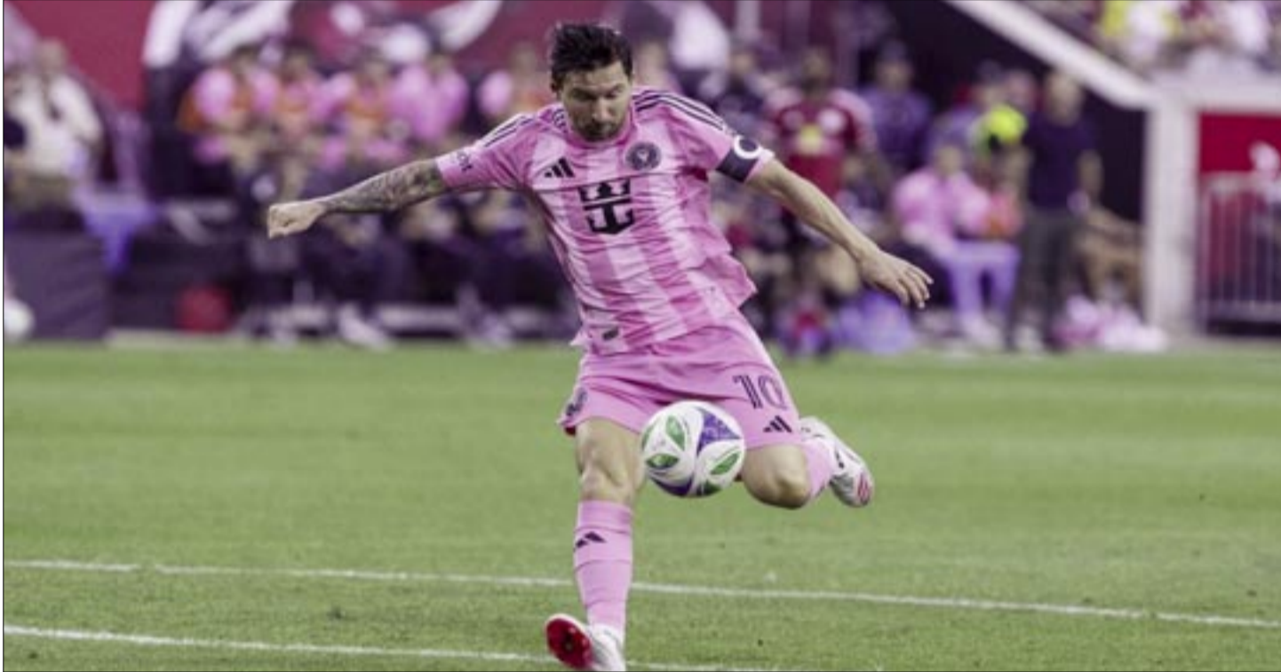
OTRO DOBLETE MAS A LA COLECCIÓN DE LEO MESSI.

Inter Miami goleó 1-5 en Nueva Jersey con una brillante actuación del argentino, que lleva 18 tantos en 18 partidos de MLS