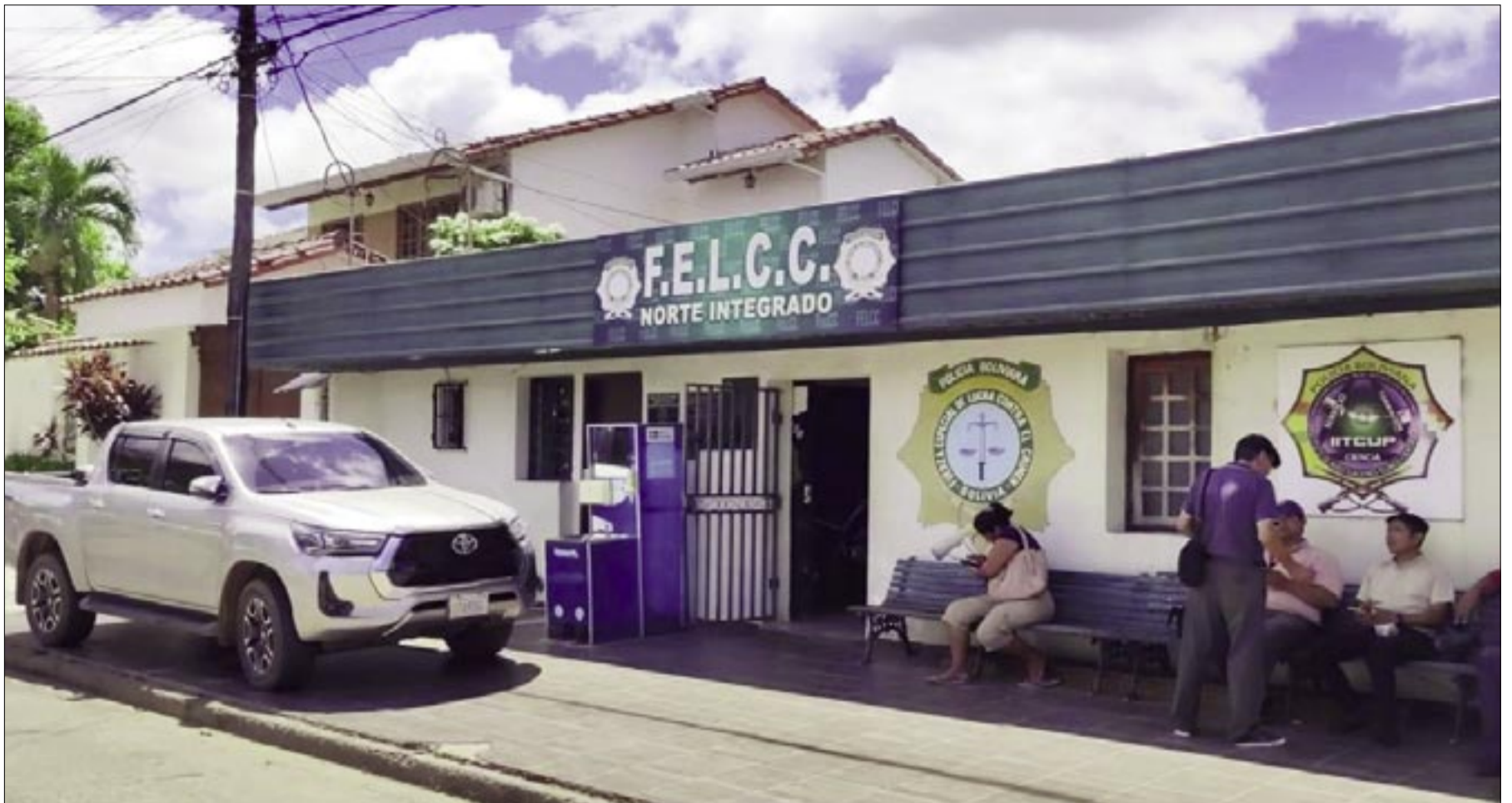
LA FELCC DEL NORTE INTEGRADO INVESTIGA EL SECUESTRO