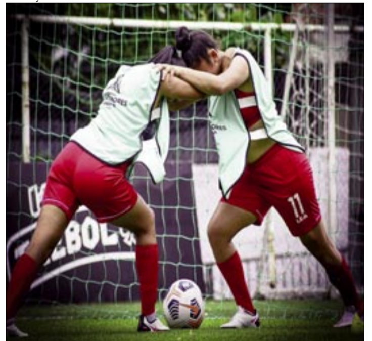
REAL TOMAYAPO, HARÁ RESPETAR SU LOCALÍA.

tado que les permita avanzar a la siguiente ronda del campeonato liguero de la categoría damas