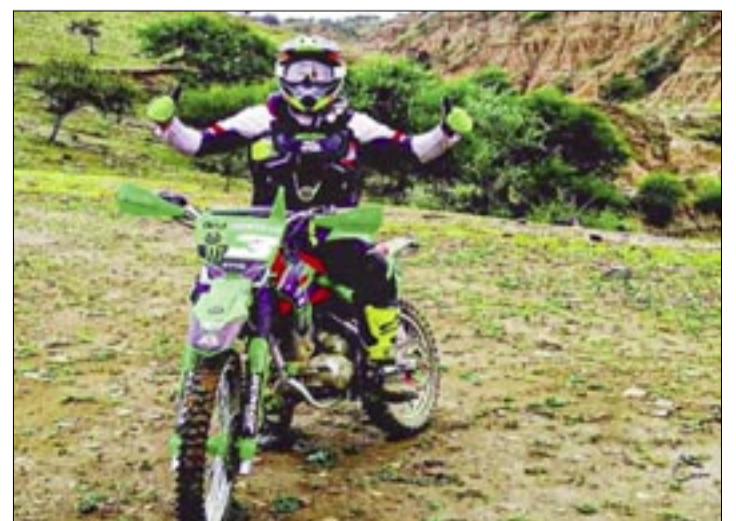
LOS PILOTOS DEL MOTOCICLISMO DE CERCAO, SE REUNIRÁN EN EL CIRCUITO INTEGRACIÓN.