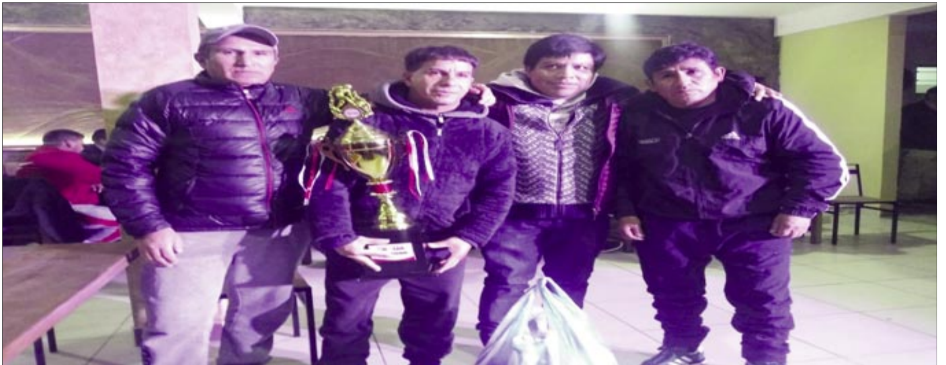
EL PLANTEL DE 20 DE MAYO, ES EL CAMPEÓN DE LA PRIMERA B SENIOR

Asociación Liga Deportiva Gremial Obrera Tarija