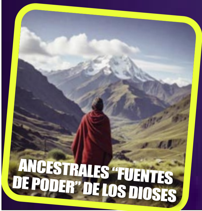
ANCESTRALES “FUENTES DE PODER” DE LOS DIOS