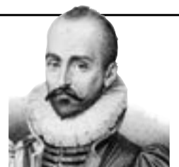
Michel de Montaigne 1533-1592. Escritor y filósofo francés.

“ La conciencia hace que nos descubramos, que nos denunciemos o nos acusemos a nosotros mismos, y a falta de testigos declara contra nosotros.....”