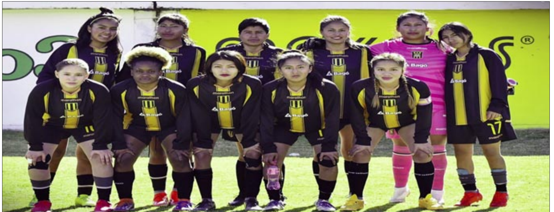
JUGADORAS DE THE STRONGEST, LLEGARON CON LA MISIÓN DE GANAR.