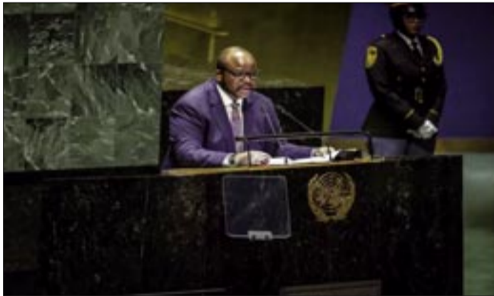
MSWATI III, REY DE ESUATINI, SE DIRIGIÓ A LA ASAMBLEA GENERAL