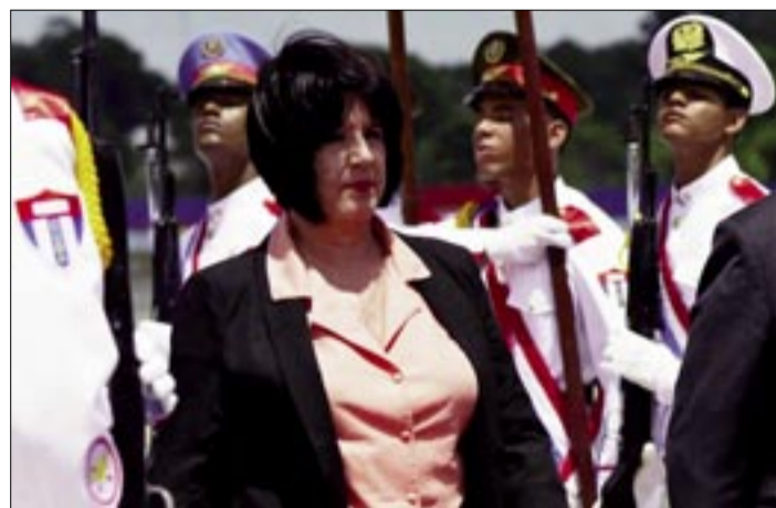
LA MINISTRA CUBANA DE TRABAJO Y SEGURIDAD SOCIAL, MARTA ELENA FEITÓ CABRERA, EN 2023.

PEL gobierno comunista de Cuba se ha enorgullecido por mucho tiempo de su capacidad para satisfacer las necesidades básicas de la población de la isla, a pesar de la persistente evidencia de lo contrario.