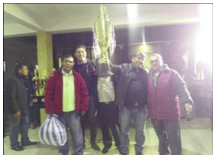
EL MOMENTO DE LA PREMIACIÓN AL CLUB LOURDES CADEPIA, CAMPEÓN 2024