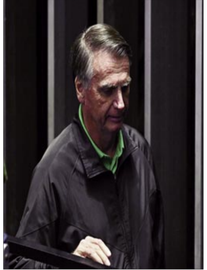
EXPRESIDENTE JAIR BOLSONARO